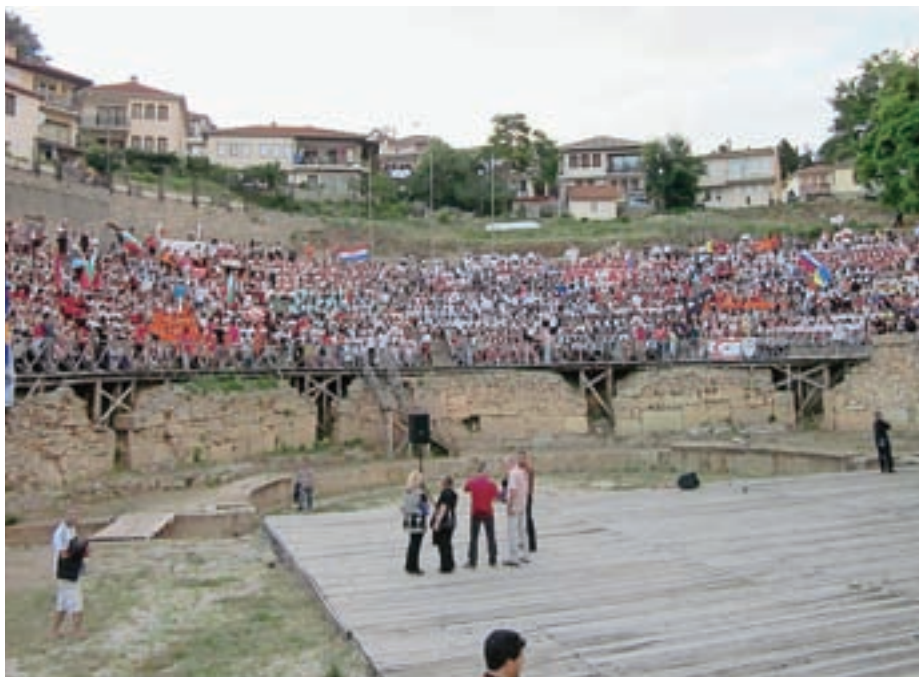
Odprtje festivala v Ohridu je bilo na antičnem amfiteatru, kjer so se zbrale folklorne skupine iz 16 držav, več kot 2.500 folklornikov.

Nekaj letošnjih naših nastopov in koncertov: ob prazniku dr. Franceta Prešerna smo sodelovali na predstavi v Predosljah in v Kranju, nismo pozabili tudi na naše zveste obiskovalce rosnih let, zato smo pripravili nastop tudi za DU, ker vemo, da knjiga daje človeku največje bogastvo, znanje in razgledanost, smo s plesom navdušili na prireditvi ob odprtju Mestne knjižnice Kranj, nastopali na festivalu Slovenska polka in valček 2011, Alpsem večeru, v Beljaku smo sodelovali pri predstavitvi Mestne občine Kranj, z največjim veseljem smo sodelovali na dobrodelnem koncertu za otroke z downovim sindromom, skupaj z več tisočimi smo na Joštu praznovali praznik 1. maja, v Goriških Brdih smo nastopali na Prazniku češenj. Maja smo bili v Riminiju v Italiji, junija v Slatini v BiH, julija na Mednarodnem festivalu v Ohridu v Makedoniji, avgusta v Beljaku v Avstriji, mogoče gremo še kam?, saj še ni konec leta ... Poleg vseh nastopov se redno udeležujemo tudi območne revije tako članska folklorna skupina, mladinska in skupina 40+. Seveda nas povsod spremljajo tudi glasbeniki, saj plesa brez "muzike" ni. Vsi vemo, da dobro ime