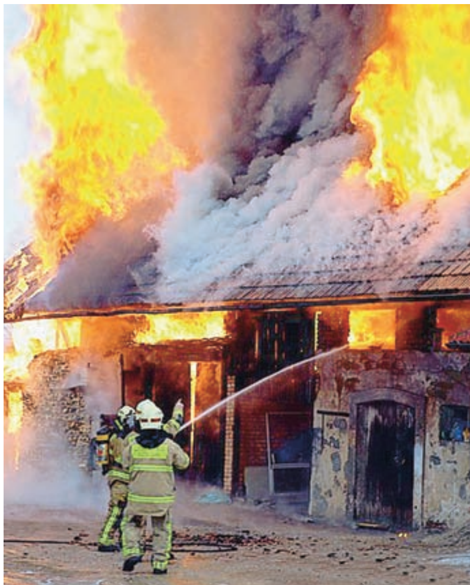
Ste storili vse za varen dom?

Iz zgoraj napisanega je lepo vidno, da društvo dela dobro in kvalitetno. Za svoje delo skozi celotno leto smo dobili tudi potrditev s strani Gasilske zveze Mestne občine Kranj, saj smo po točkovniku dela za ocenjevanje društev med šestnajstimi prostovoljnimi društvi v zvezi tudi letos dosegli drugo mesto.