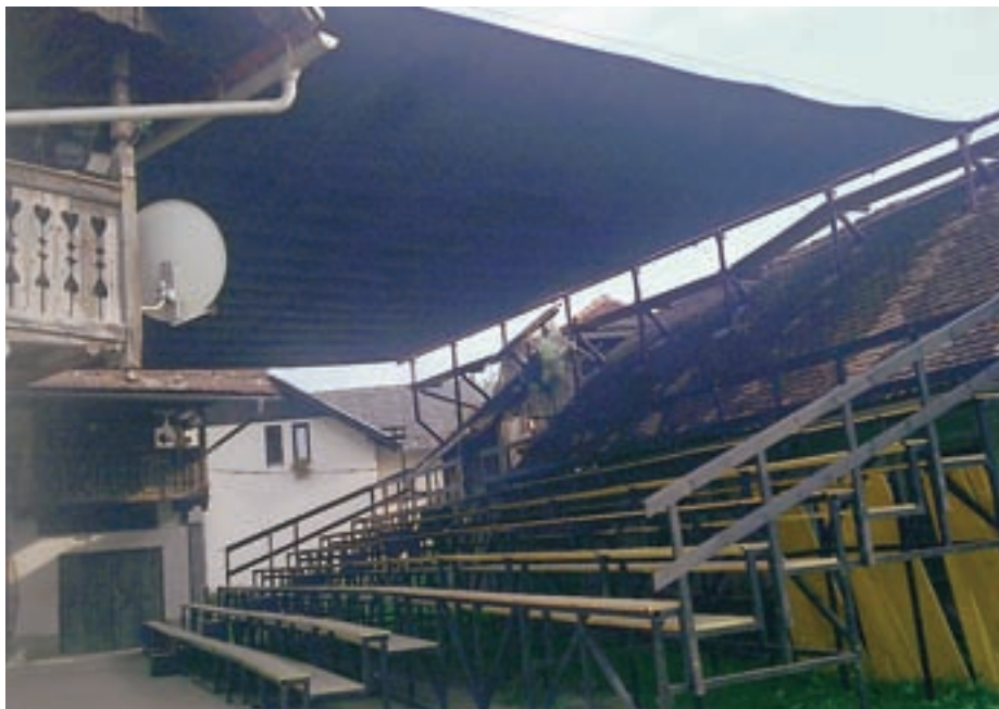
Ker so predstave na prostem preveč odvisne od vremena, so v letnem gledališču zgradili premično streho.