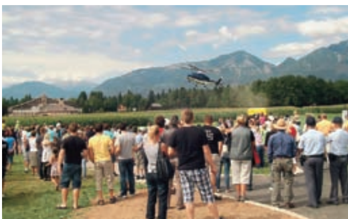
Predstavili so se nam policisti, gasilci, reševalci ...