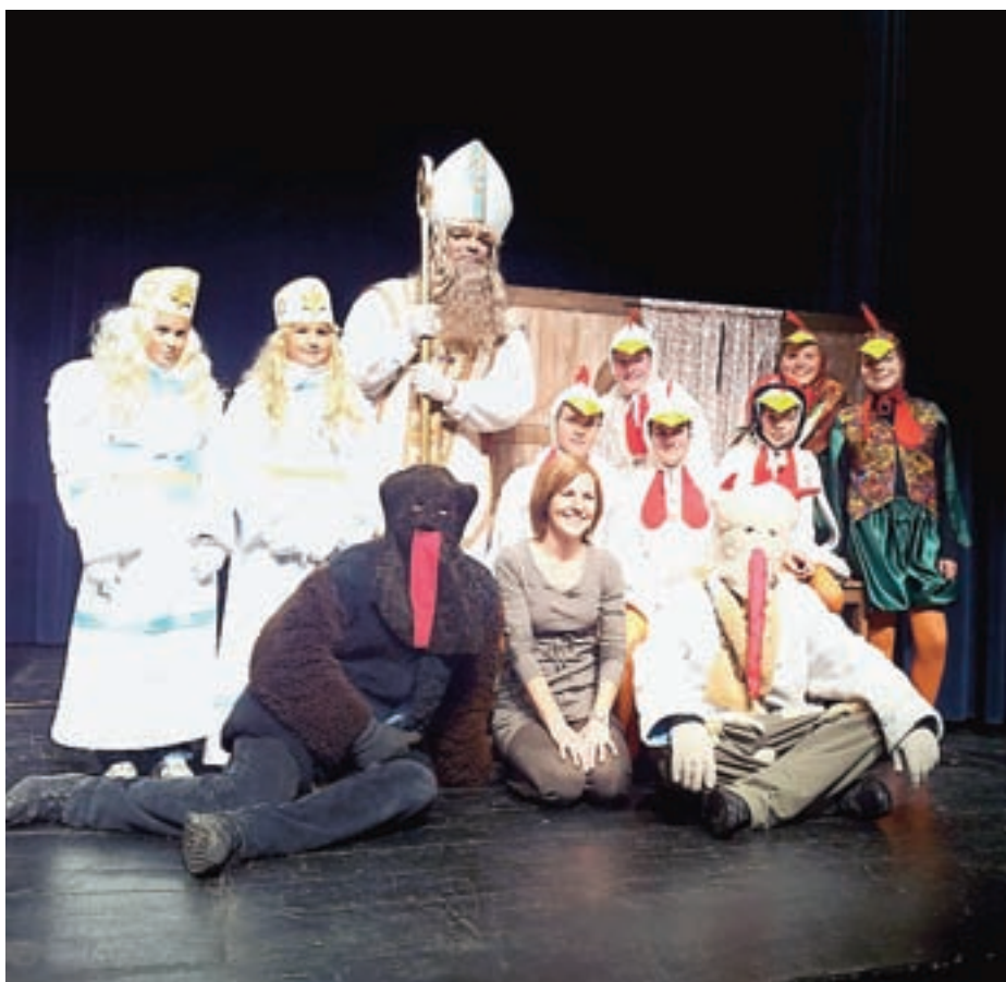
Po predstavi otroške skupine kulturnega društva je otroke razveselil še sveti Miklavž.

Mladi igralci so s predstavo že gostovali v Kamniku, Komendi in Kranju, čakajo pa jih še ponovitve na Jesenicah in na Visokem.