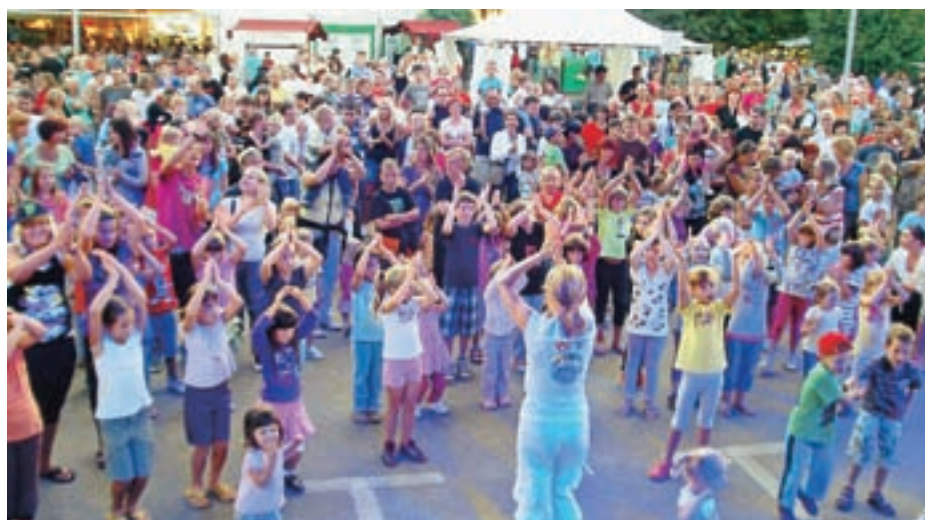
... in raznimi ustvarjalnimi delavnicami.