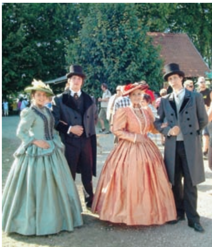
Folklorniki KD FS Iskraemeco v prelepih kostumih iz časa Žiga Zoisa