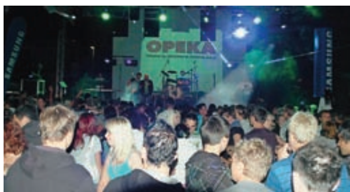
... do zgodnjih jutranjih ur.