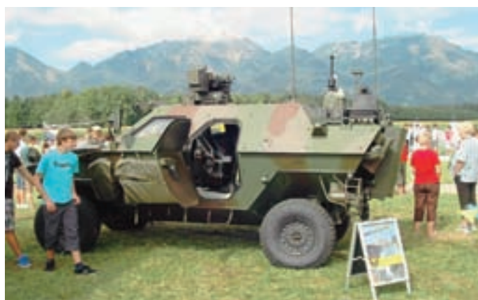
... in vojaki.