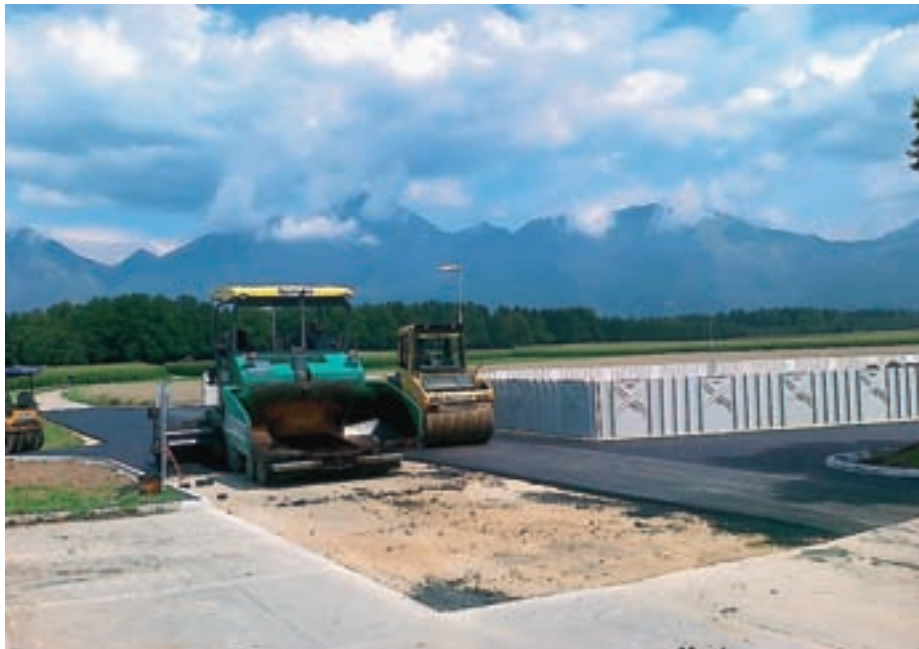
Z izgradnjo parkirišča pred novim pokopališčem je skorajda končan projekt pokopališča.

Ravno pri obnovi ceste se je pokazalo, da večina živih mej globoko posega v cestno telo, zato svet Krajevne skupnosti Predoslje apelira