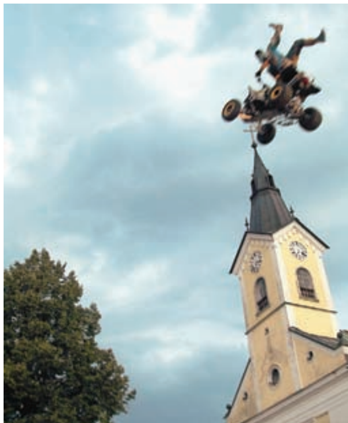
... in Aleš Rozman.