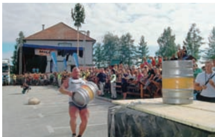
Silaki so morali nositi tudi polne sode piva.