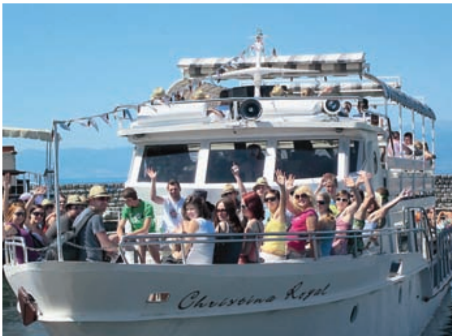
Imeli smo se zelo lepo ...