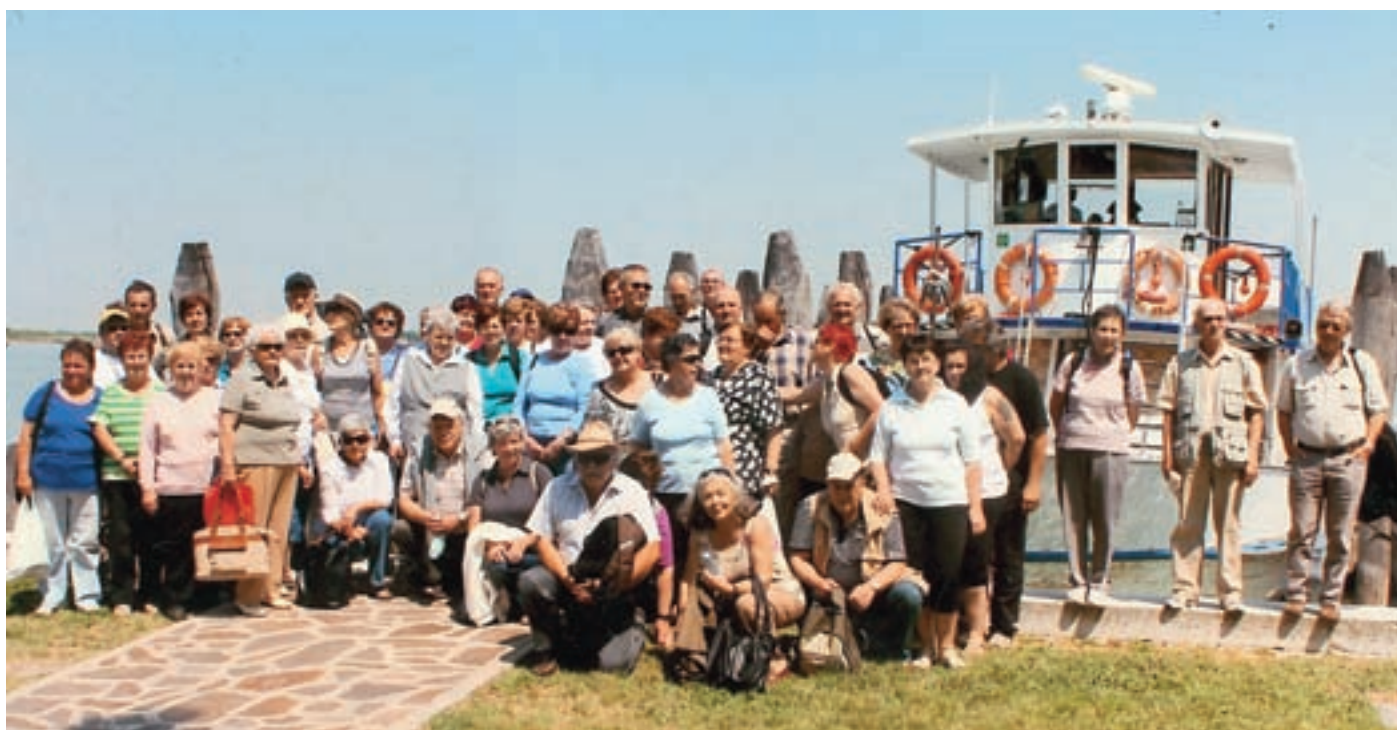
Izletniki na otoku Burano