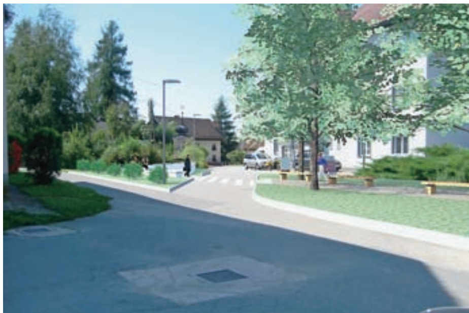
Bodoča zasnova vaškega jedra