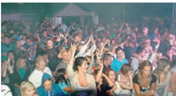
Žur je trajal ...