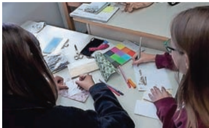
Ustvarjalna delavnica Kaligrafija

V četrtek, 8. oktobra, je potekala ustvarjalna delavnica – Vlivanje mavca, ki jo je vodila učiteljica Irena Gramc Zupan. Delavnice se je udeležilo sedem učenek iz sedmega razreda. Na delavnici so se učenke naučile osnovne tehnike vlivanja mavca v kalupe ter nadaljnje obdelave