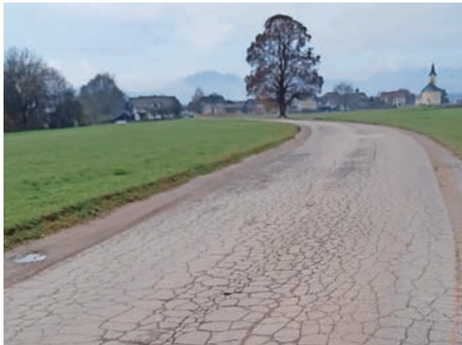
Močno dotrajana cesta Predoslje-Suha je nujno potrebna obnove, predlagali smo tudi izgradnjo pločnika.

Krajevna skupnost Predoslje, Predoslje 34, Kranj