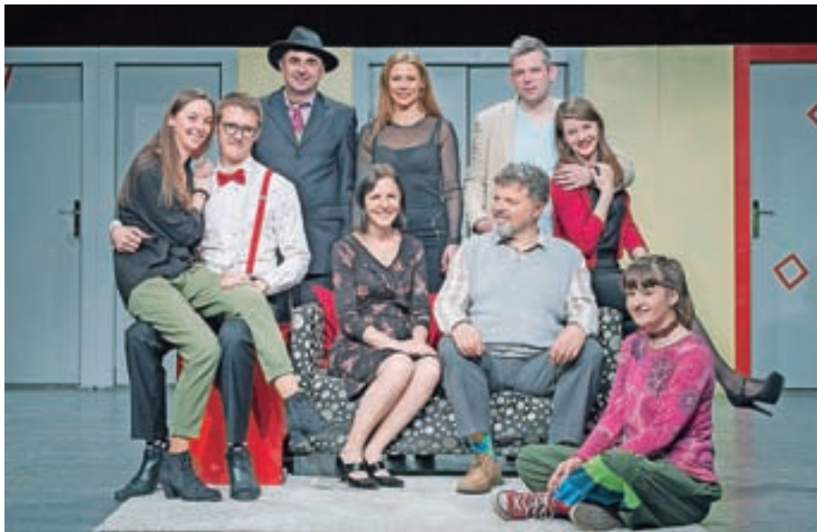
Komedija Spustite me pod kovter, gospa Markham

Predstavo bomo zagotovo še ponavljali, saj je bila med gledalci lepo sprejeta. Oživili jo bomo takoj, ko bodo to dovoljevale razmere.