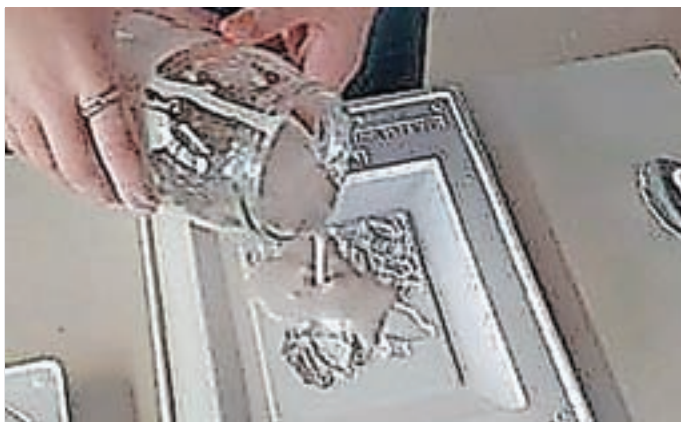
Ustvarjalna delavnica Vlivanje mavca

modelčkov z akrilnimi barvami. Nastala so prava umetniška dela. Kaj vse so učenke ustvarile, si lahko pogledate na slikah.