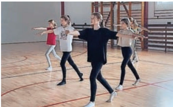
Plesna delavnica Jazz balet