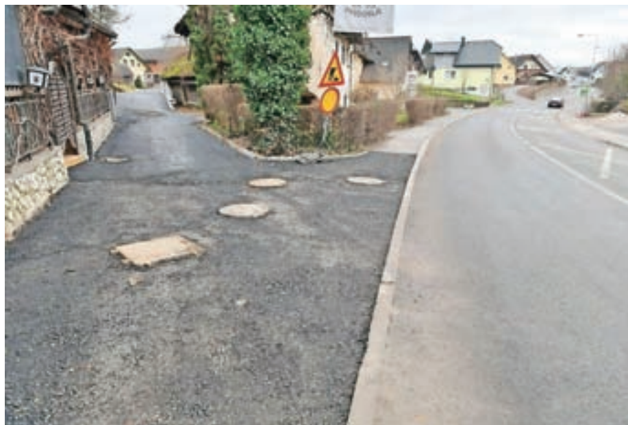
Vse nedokončane ulice bodo s finim asfaltom preplastili spomladi.

»V naseljih Britof, Predoslje, Orehovlje in Mlaka bomo skupno 2664 prebivalcem zagotovili izboljšano čiščenje odpadne vode. Pridobili bodo več kot 17 kilometrov novega kanalizacijskega omrežja, pet črpališč odpadne vode, več kot 15 kilometrov obnovljenega vodovoda, 13,5 kilometra obnovljene in dograjene meteorne kanalizacije ter 5,8 kilometra javne razsvetljave,« je ob pregledu del prejšnji teden povedal kranjski župan Matjaž Rakovec.