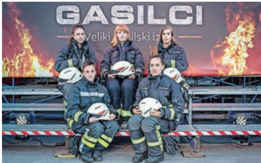
Članice PGD Predoslje