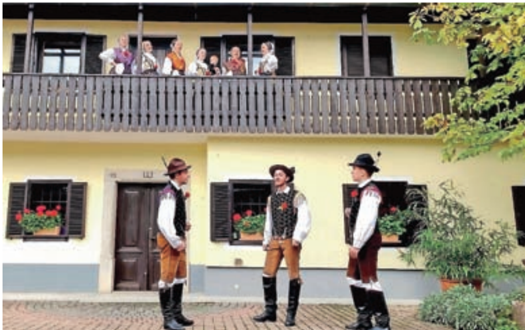
Vokalna skupina Iskraemeco

Dogajanje smo obogatili tudi z izvedbo projekta Grajska gospoda – Postani graščak za en dan. Obiskovalcem smo od blizu predstavili življenje in kulturo višjega sloja prebivalstva in bogatega meščanstva iz Kranja in bližnje oko-