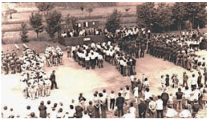
Leta 1973 smo praznovali ....