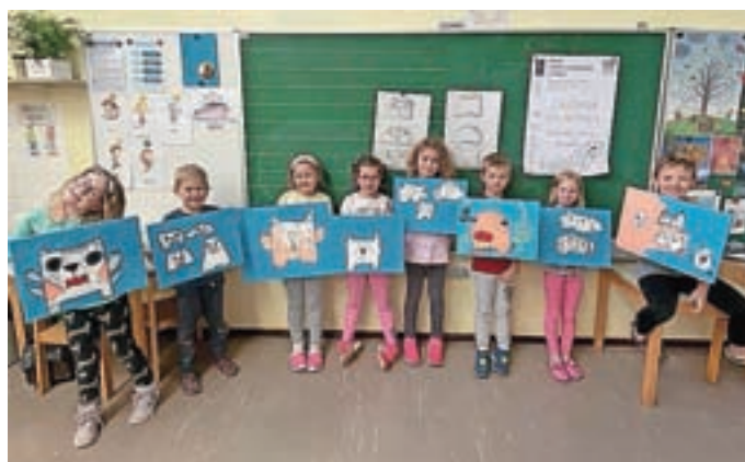
Likovna delavnica Domišljjska žival