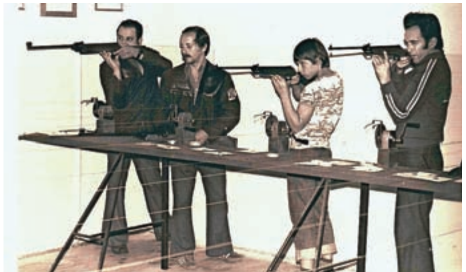
Na treningu približno pol stoletja nazaj

Ligaška tekmovanja so bila prekinjena in posledično ni bilo končnih rezultatov. Torej, društvo vsekakor še deluje, tudi treningi indivi-