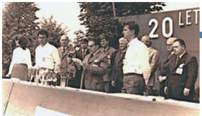
... 20-letnico strelskega društva.