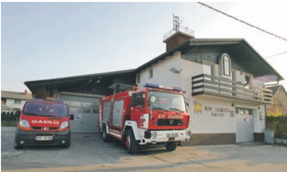
Obnovljen dom Andreja Kmeta