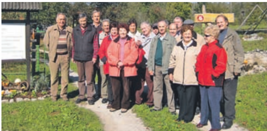
Skupina obiskovalcev pred vhodom na Fabjanovo domačijo