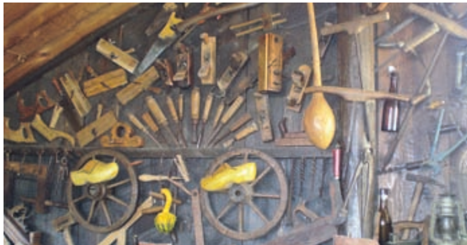
Matjaž rad zbira staro orodje.