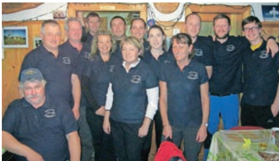
Udeleženci drugega gasilskega pohoda na Sv. Lovrenc nad Bašljem