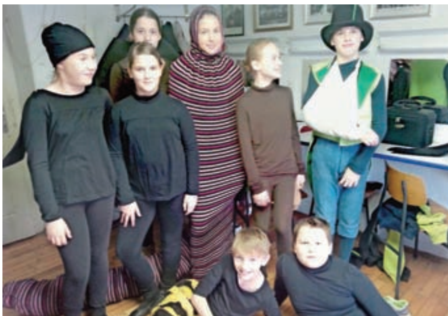
Otroci so s Čebelico Majo nadaljevali gostovanja tudi spomladi in jeseni.