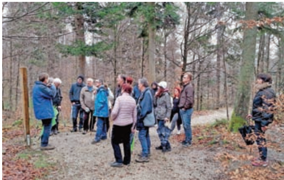
Odrasli del društva se je novembra odpravil na izlet v kočevske gozdove do Baze 20 ter preko Gorjancev v Belo krajino.

Med najbolj dejavnimi so bili v letošnjem letu otroci, ki jih družijo dramska igra. S Čebelico Majo so nadaljevali z gostovanji tudi spomladi in jeseni. Za svoj trud so bili poplačani z ogledom Brda in izletom. Odpravili so se na