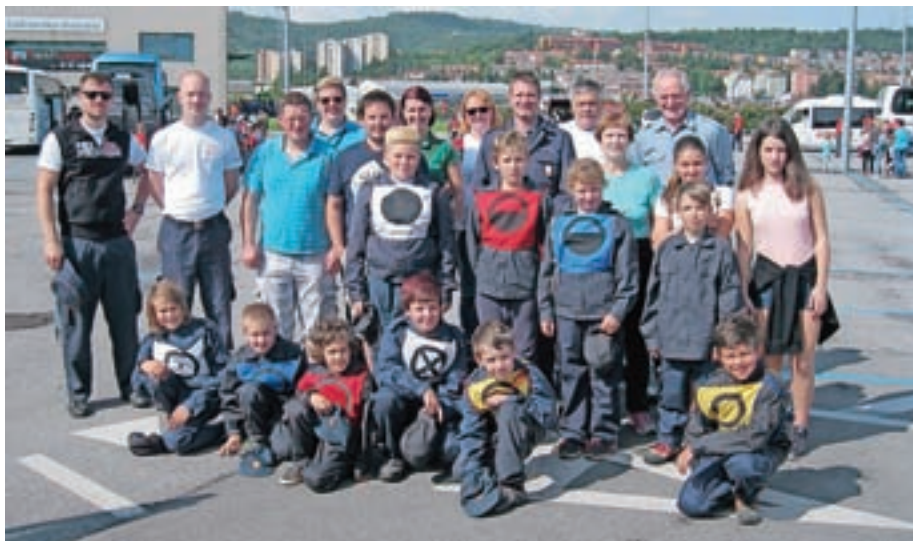
Udeleženci državnega mladinskega gasilskega tekmovanja

December je čas obdarovanja, radosti, praznikov, kuhančkov, zadnjega veselega meseca, preden stopimo v novo leto polni zaobljub in novih dogodivščin. Uporaba pirotehničnih sredstev je v tem času mnogim v zabavo, vendar pri tem ne pozabimo, da je takšno početje mnogim neprijetno in jim vzbuja strah, nelagodje in občutek nevarnosti. Zato bi vas radi spomnili, da denar, ki bi ga s petardami v glasnem poku pognali v zrak, raje namenite za druženje s prijatelji, za novoletna darila ali v dobrodelne namene. Ob koncu leta pa bi vam radi zaželeli še vesele božične praznike ter zdravo in uspešno leto 2017! PGD Predoslje