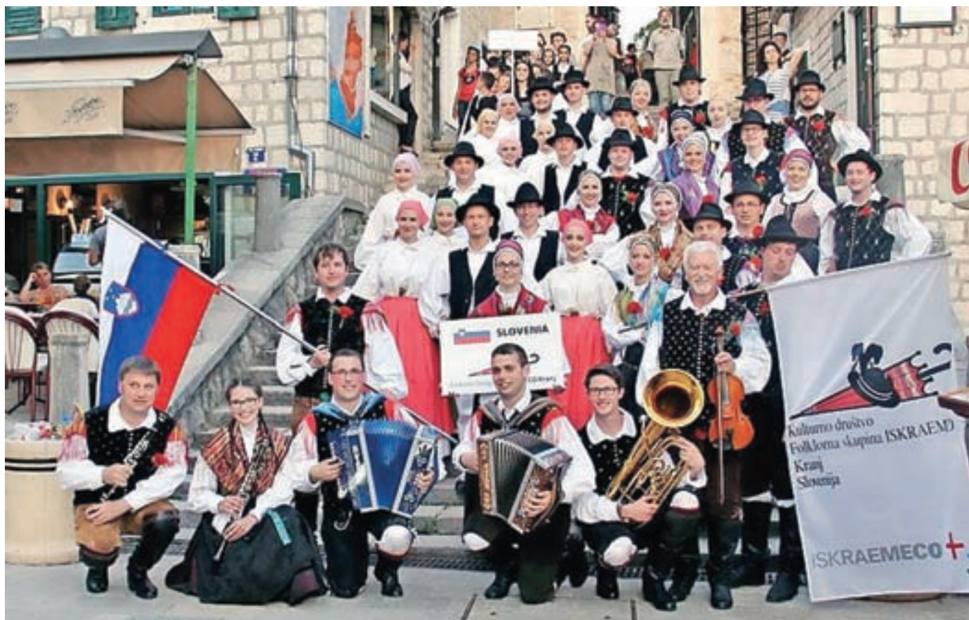
Turneja članov Folklorne skupine Iskraemeco v Črni gori