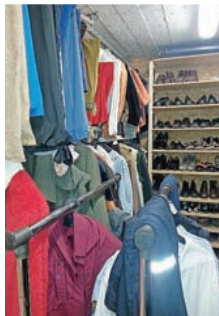
V novem fundusu so svoj prostor dobili kostumi.