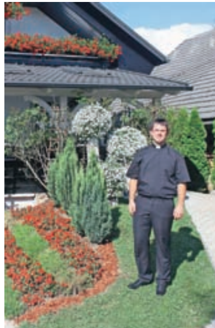
Pred domačo hišo