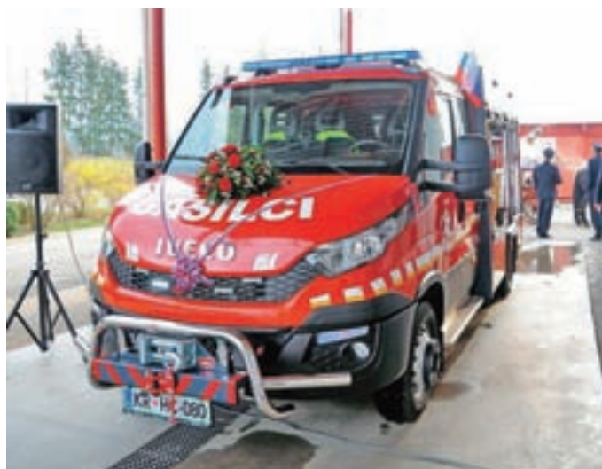
Novo gasilsko vozilo PGD Predoslje