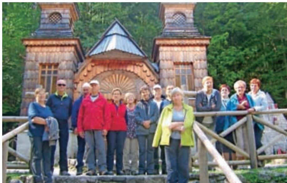
S planinskega izleta na Slemenovo špico in z obveznim postankom pri Ruski kapelici

Med dejavnostmi so najbolj vabljivi izleti, saj se vsaj enkrat na mesec odpeljemo s polnim avtobusom na ogled zanimivosti in naravnih lepot Slovenije, podamo se tudi v sosednje Avstrijo, Italijo, Hrvaško, letos sledi 14. decembra še