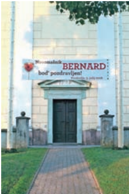
Cerkev je bila za novomašnika lepo pripravljena.