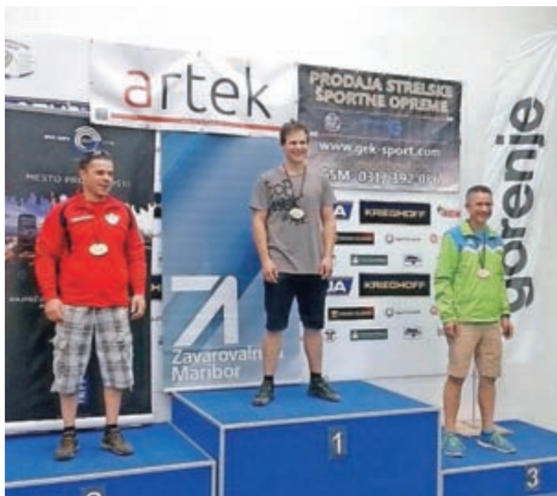
Jerneju Žižku je moral na državnem prvenstvu premoč priznati tudi zlati olimpijec Rajmond Debevec.

Za zaključek: triinšestdesetletno tradicijo strelskega društva v krajevni skupnosti vsekakor uspešno nadaljujemo! SD Predoslje