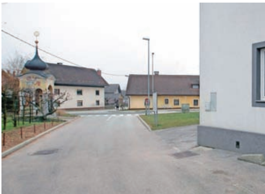
Poleg novih komunalnih vodov bo od kulturnega doma do glavne ceste zgrajen tudi pločnik, ki ga je KS pripravljena financirati sama.

Krajevna skupnost Predoslje, Predoslje 34, Kranj