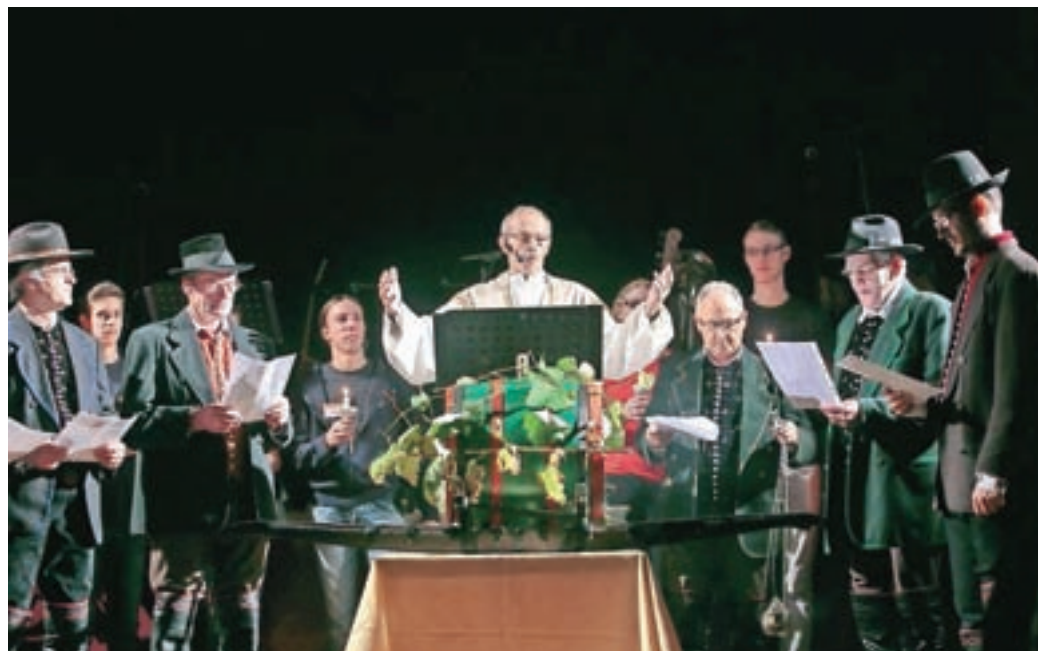
Moštek so po starem običaju krstili v vince.

Čeprav člani Akademске folklorne skupine Ozara ne prihajajo iz vinorodne pokrajine, pa do vina, te 'plemenite in včasih navihane pijače', kot so dejali, gojijo poseben odnos – in zato so v soboto, 5. novembra, nekaj dni pred uradnim praznikom svetega Martina, povabili na martinovanje v veliko dvorano Doma krajanov na Primskovo v Kranj. Mize so se šibile pod dobrotami martinove večerje in moštek so po starem