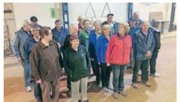
Najboljše veteranske ekipe zaključku zimske lige na dupliškem balinišču

in sicer so se veterani razvrstili takole: 1. mesto MDI Domžale, 2. mesto Društvo upokojencev Kamnik, 3. mesto BD Komenda ženske in 4. mesto BD Komenda moški. Med članskimi ekipami pa so najboljša mesta dosegli: 1. mesto BK Budničar Količevo, 2. mesto Montles Duplica, 3. mesto sekcija BK Duplica in 4. mesto BK Duplica. Vse najboljše uvrščene ekipe so prejele lične pokale, posamezniki pa medalje. Udeleženci zimske lige so bili z organizacijo tekmovanja v zimskem času zelo zadovoljni, saj jim je to tek-