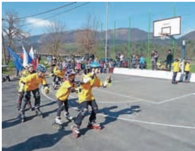
Za pravi krst nove večnamenske ploščadi so poskrbeli tudi učenci na rolerjih iz šolskega krožka Drug z drugim.