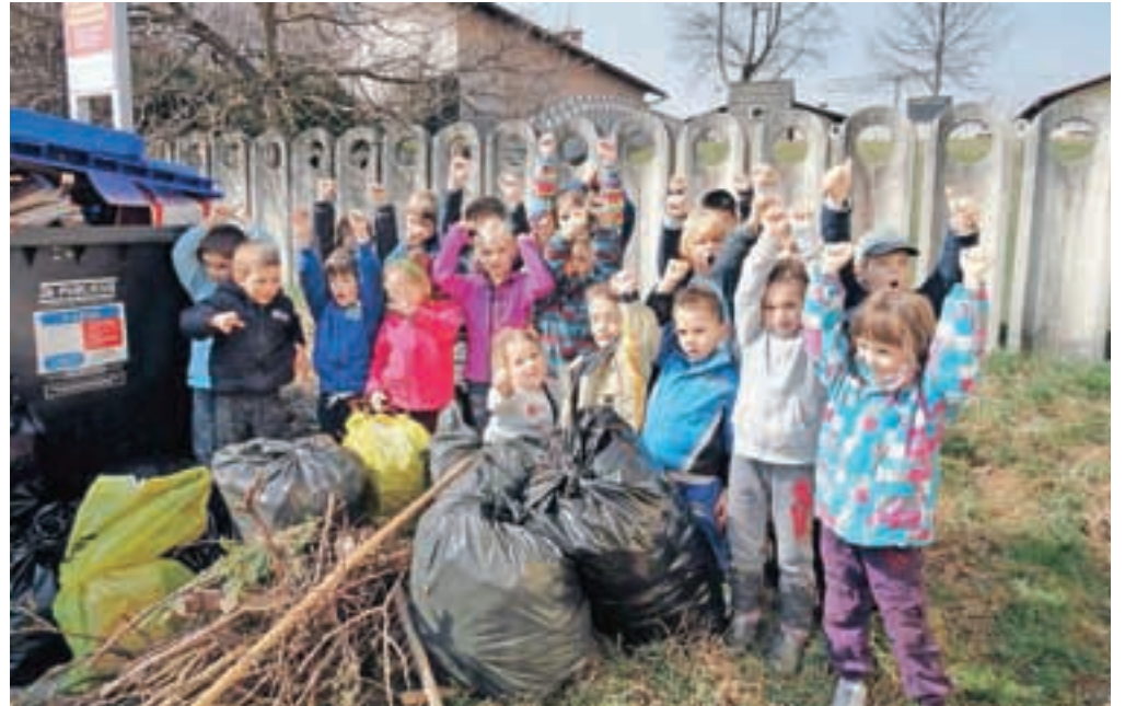
Čistilne akcije so se udeležili tudi najmlajši iz enote Tinkara, ki so očistili okolico svojega vrtca in ekološki otok na Klavčičevi ulici.

»Kljub ugotovitvi, da se število divjih odlagališč iz leta v leto nekoliko zmanjšuje, imajo udeleženci čistilnih akcij povsod po občini polne roke dela. Gozdne grape ter brežine potokov in rek so očitno zelo primerno odlagališče za odslužene avtomobile, gospodinjske aparate, gume, pa tudi najrazličnejšo kovinsko in plastično embalažo. Glede na to, da imamo dobro organiziran odvoz, saj lahko vsako gospodinjstvo dvakrat v letu naroči brezplačni odvoz kosovnih odpadkov, je zares nerazumljivo, zakaj se nekateri občani raje odločijo za odlaganje odpadkov v naravi,« ugotavljajo na Občini Kamnik, ki je občanom priskočila na pomoč z vrečami in rokavicami, skupaj z družbo Publicus pa so poskrbeli tudi za odvoz odpadkov. Teh se je nabralo za skoraj trinajst ton, in sicer je bilo iz