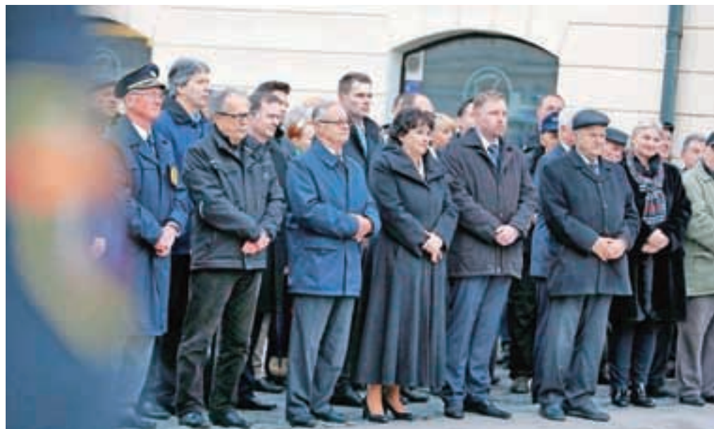
Zbrani gostje na slovesnosti ob spomeniku Rudolfa Maistra na Trgu talcev