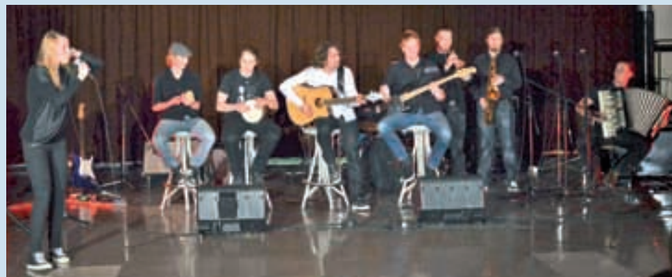
Koncert za dober namen na GSŠRM

Napovedujemo: Karierno tržnico in Prvi Maistrov pomladni ples v dobredelne namene.