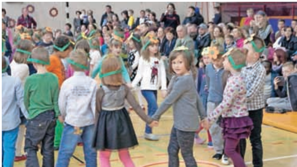
Že tradicionalna šolska prireditev Pomlad v Kamniku z dobredelno noto za Anino zvezdico je napolnila telovadnico na Duplici, največ aplavza pa so seveda s plesno točko poželi prvošolčki.

učencev višjih razredov, vse obiskovalce pa je nasmejala šolska folklorna skupina Verine zvezdice s točko Ovčke so nam ušle. Šolska prireditev je imela tudi dobrodelen značaj, saj so v šolski jedilnici zbirali hrano za Anino zvezdico in na šoli so zelo veseli in hvaležni za dober odziv vseh prisotnih na prireditvi. Ob koncu prireditve so se z žarom v očeh zahvalili vsem obiskovalcem za njihovo radodarnost, saj jim je uspelo ponovno zbrati veliko hrane za vse tiste, ki jo še kako potrebujejo.