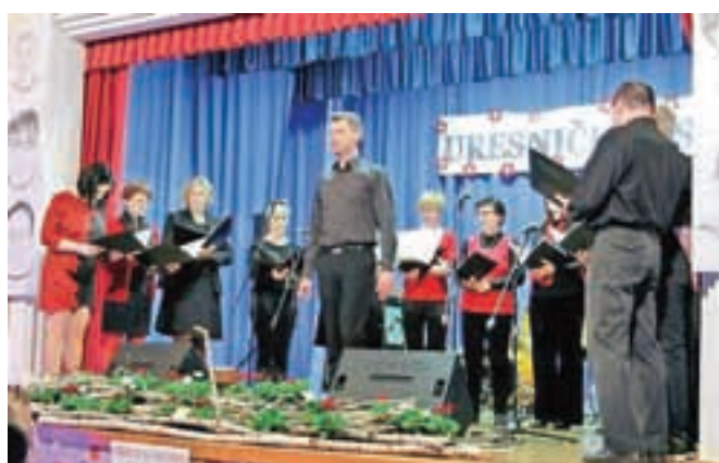
Komorni pevski zbor Šutna Kamnik