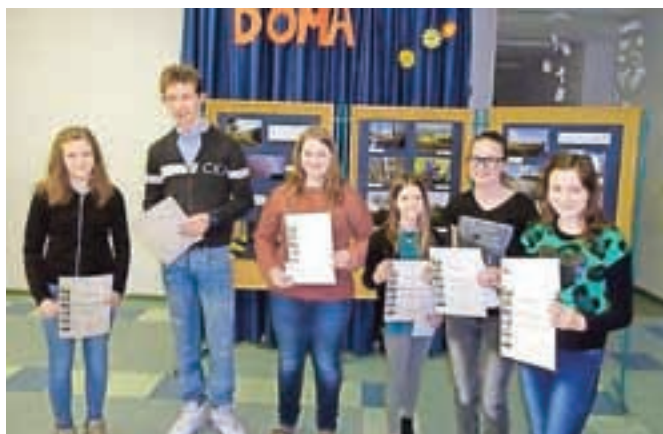
Avtorji nagradjenih fotografij natečaja To je moj kraj, ki bodo na ogled predvidoma do konca aprila.