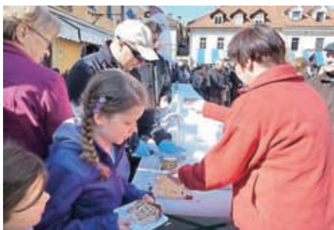
Razrez velikonočne potice velikanke