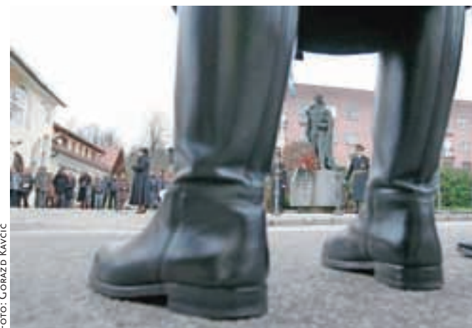
Kamničani si želijo vztrajati na poti, po kateri je stopal njihov rojak – general, domoljub in pesnik Rudolf Maister.