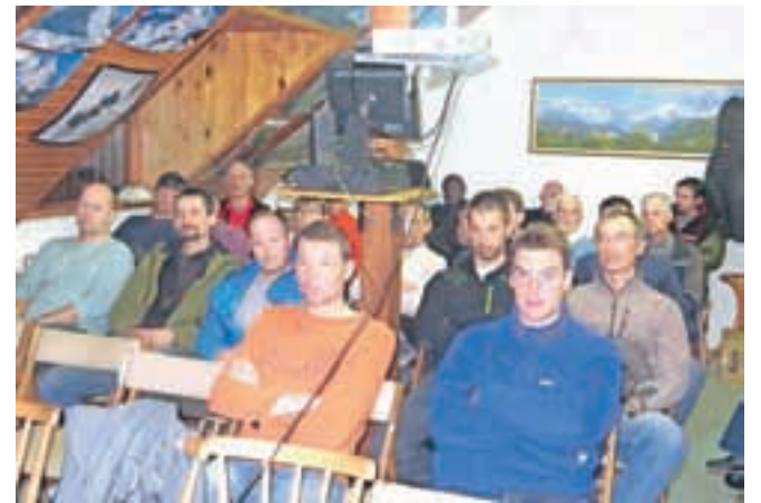
Na občnem zboru Alpinističnega odseka Kamnik