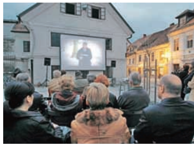
Projekcija kratkega filma na pročelju Maistrove rojstne hiše na Šutni