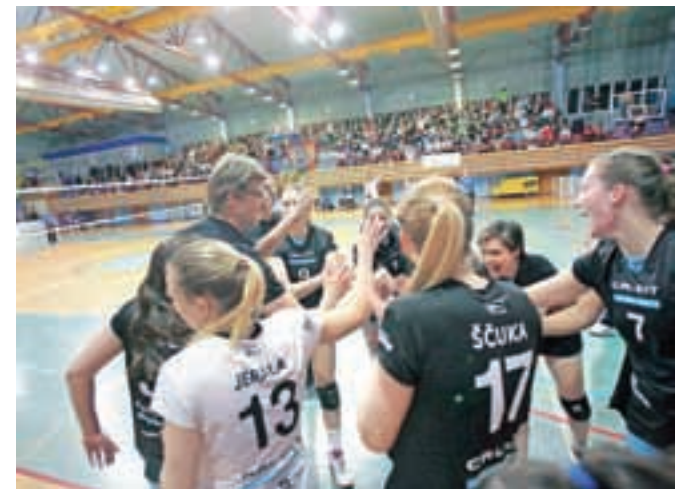
Kamniške odbojkarice so se za odlično navijaško vzdušje in polne tribune minulo soboto oddolžile na najboljši možni način – z zmago.