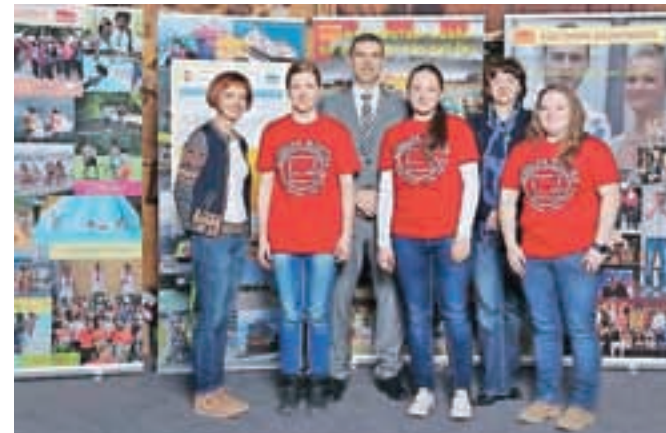
Ekipa Gimnazije in srednje šole Rudolfa Maistra Kamnik na letošnji Ekonomijadi