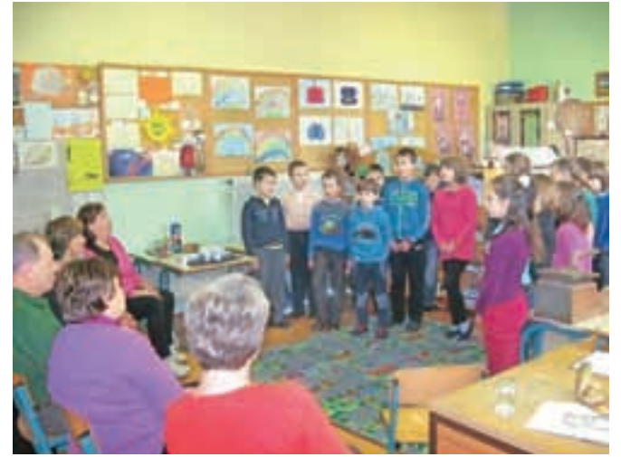
Sodelovanje med POŠ Motnik in Društvom upokojencev Motnik-Špitalič poteka že vrsto let.