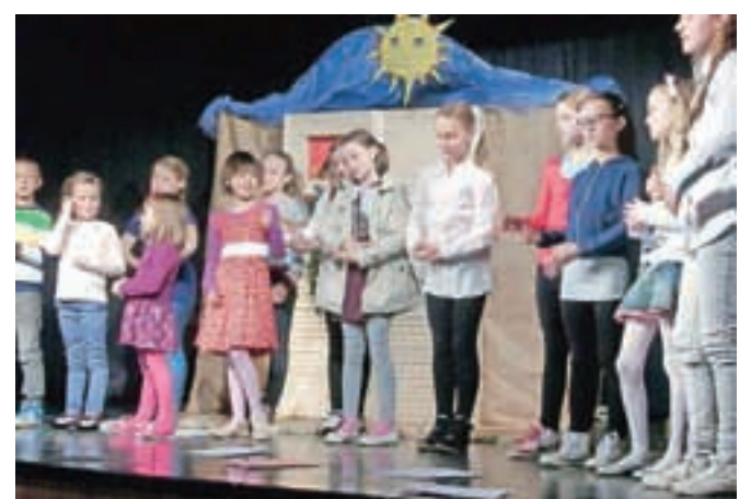
Učenci veroučne šole Zgornji Tuhinj

gem delu je vse razveselila igralska skupina iz Kureščka s poučno igrico Izgubljena ovčica in dobri pastir. Otroci od prvega do četrtega razreda so pred prireditvijo sodelovali tudi v delavnici, ki so jo vodili igralci v sodelovanju z mamicami in si sami izdelali ušeska in repke ovac. Preoblečeni v ovce so bili tako tudi vključeni v samo igrico in navdušeno sodelovali. Vse mame, stare mame in prababice so dobile tudi lepo izdelano voščilnico za materinski dan.