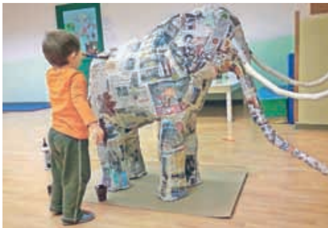
Izdelava mamutovega mladička

Za enoto Zvonček v Vrhpolju pa je Kamnik predaleč, da bi ga lahko spoznavali tako, kot prijatelji iz mesta. Na Mali grad so se otroci podali skupaj s svojimi starši. Dobili so navodila, ki so jim sledili. Ob vrnitvi so prinesli svojo risbo Malega gradu in kamen, ki so ga prilepili k maketi gradu. Izdelali smo tudi maketo Nevelj, na kateri smo označili pomembne zgradbe. Predvsem pa smo se posvetili prazgodovinski živali mamutu. Otroci so razmišljali o vprašanih: Kakšen je bil mamut? Zakaj je imel tako debelo dlako? Zakaj mamutov v Nevljah ni več? Po zaslugi tega projekta zdaj vsi