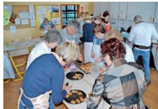
Udeleženci kuharske delavnice pri pripravi okusne kloštrske kremšnite

je namreč velik, saj šteje preko sto zaposlenih, poleg tega deluje na petih lokacijah, kar povečuje stalno skrb za ustvarjanje pogojev za sodelovanje. V delavnicah so zaposleni pridobivali timske izkušnje, se povezovali s sodelavci ter sebi omogočili nekaj časa za razvoj ustvarjalnih in drugih potencialov. V današnjih časih je sodelovanje med zaposlenimi še kako ključno za uspešnost in učinkovitost. Udeleženci so se pogloblje spoznali z izdelavo sveč, pripravo jedilnika Okusi Kamnika, z jogo, pohodom v naravi, izdelavo mozaika, glasbeno sproščenostjo in modnimi smernicami z osnovami ličenja.