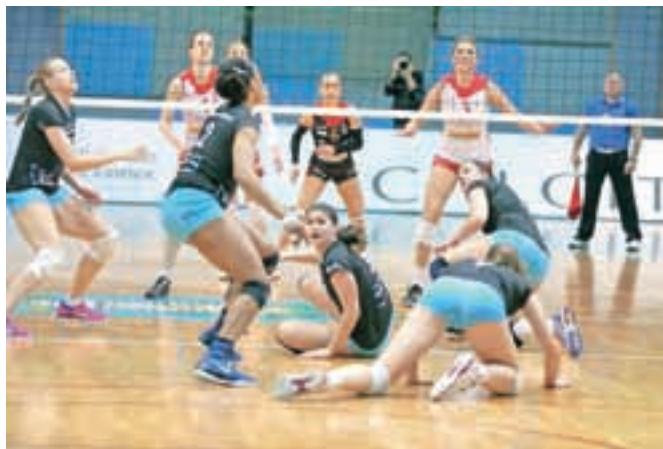
Kamniške odbojkarice so v soboto prikazale izredno borbeno igro.