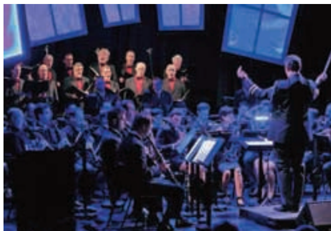
Za bogat kulturni program so med drugim poskrbeli člani Mestne godbe Kamnik in PSPD Lira.