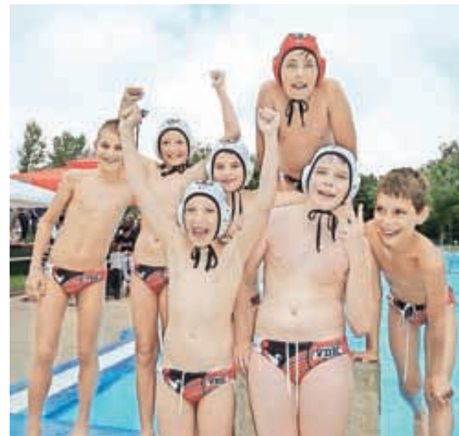
Selekcija U-11 Vaterpolskega društva Kamnik – odlično razpoloženi pred finalno tekmo na 22. Dnevu vaterpolistov Slovenije

V nedeljo, 21. junija, so bazen zavzeli mladi plavalci v tretjem kolu Gorenjske lige, ob 12. uri pa so se najbolj pogumni občani lahko pomerili na Cooperjevem testu, ki so ga pripravili čla-