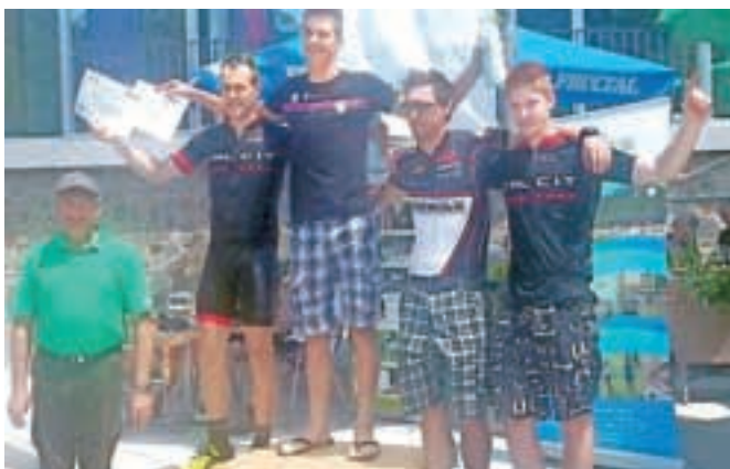
Najboljši moški absolutno