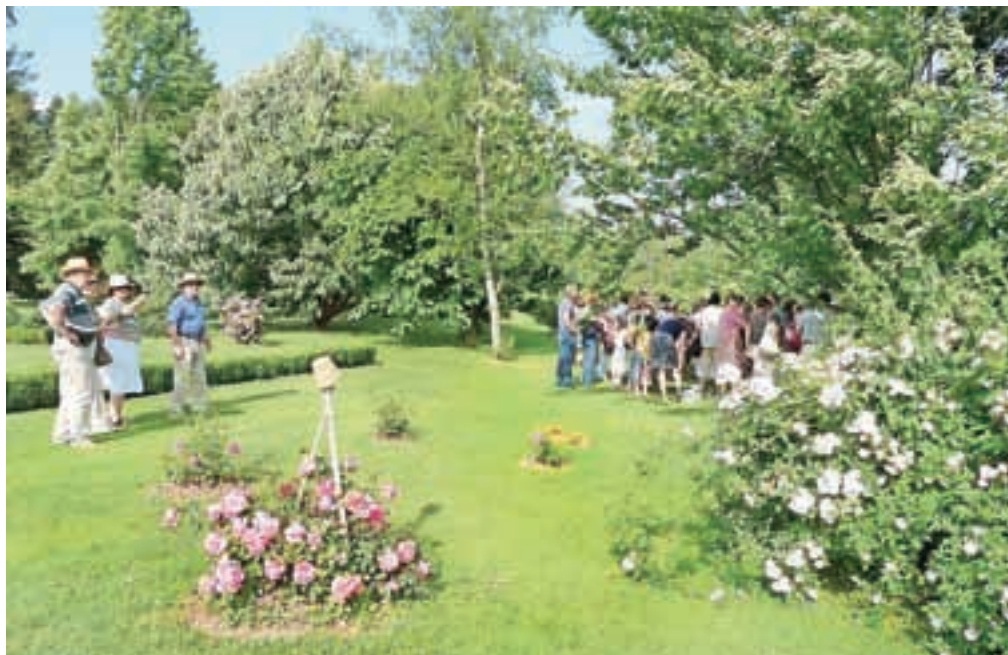
Ogled rožnih grmov v spodnjem rozariju, ki nastaja v podaljšku francoskega vrta