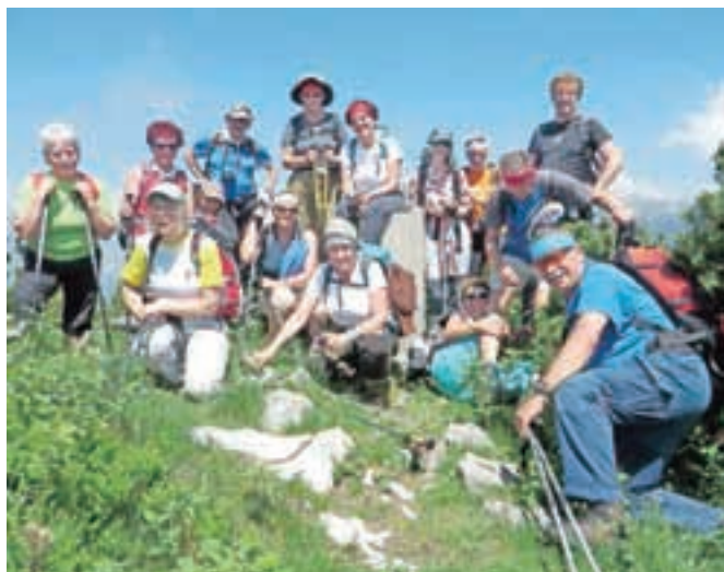
Udeleženci »trim pohoda« na Gradišču

V letu 1980 so v okviru PD Kamnik začeli s takrat popularnimi »trim pohodi«. Imeli so v programu tri – na Veliko planino, na Kamniško in na Kokrsko sedlo. Od vseh teh treh se je do današnjih dni ohranil samo tisti na Veliko planino, ki je že več kot dvajset let na prvo soboto v juniju. V začetku je potekal s Stahovice čez Pasjo peč gor in čez Dol na Kopišča dol. V zadnjih letih pa se je trasa spreminjala, tako da je potekal po vseh kolikor toliko »normalnih« poteh – od Martinj steze do poti čez Podkrajnik, v štirinajstih različnih smereh. Letošnji pohod se je odvijal od spodnje postaje nihalke do Praga in nato čez Kuklarje na Gradišče, nazaj pa čez Rigelj do spodnje postaje nihalke.