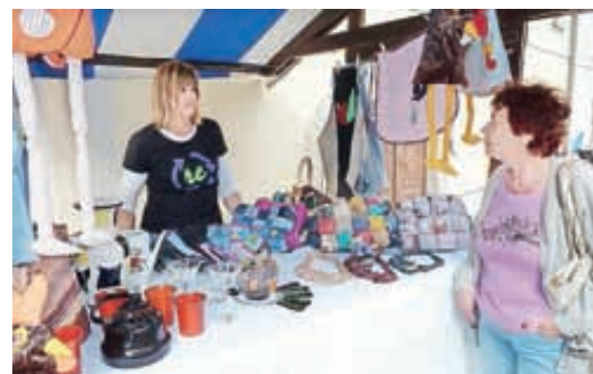
Pisana stojnica Reciklarnice