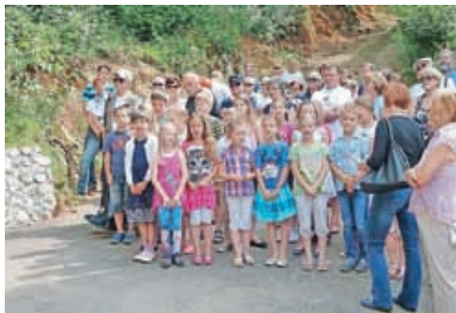
Na slovesnostih v Češnjicah že vsa leta sodelujejo tudi učenci Podružnične šole Zgornji Tuhinj.

gim povedal župan. Dodal je še, da največji sovražnik slovenskega naroda niso dogodki izpred sedemdesetih let, ampak seme zla, ki se s strani posameznih politikov, večinoma na desni strani, širi po Sloveniji, pa neuspešno sodstvo, ki osvobaja tiste, ki so bili že pravnomočno obsojeni, in neo-