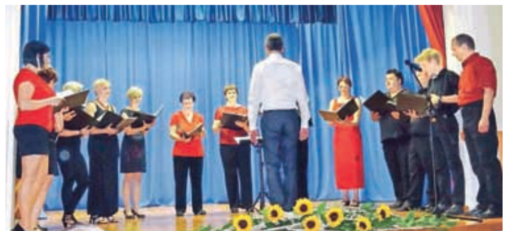
Na letnem koncertu v Šmarci

V prazničnem decembrskem času ste nas dva večera lahko videli in slišali na kamniških in ljubljanskih ulicah, kjer smo z božičnimi pesmimi prispevali svoj delček v sneženi pravljici. Resnoba, ponižna in pobožna drža, ki je navdihnila tudi naš nastop na Reviji pevskih zborov ob letošnjem kulturnem prazniku, nam pevcem ni prav dolgo odgovarjala. In ko je zadisalo po pomladi, smo se lotili novih, svežih, pozitivnih pesmi, ki smo jih predstavili na dobrodelnem koncertu za