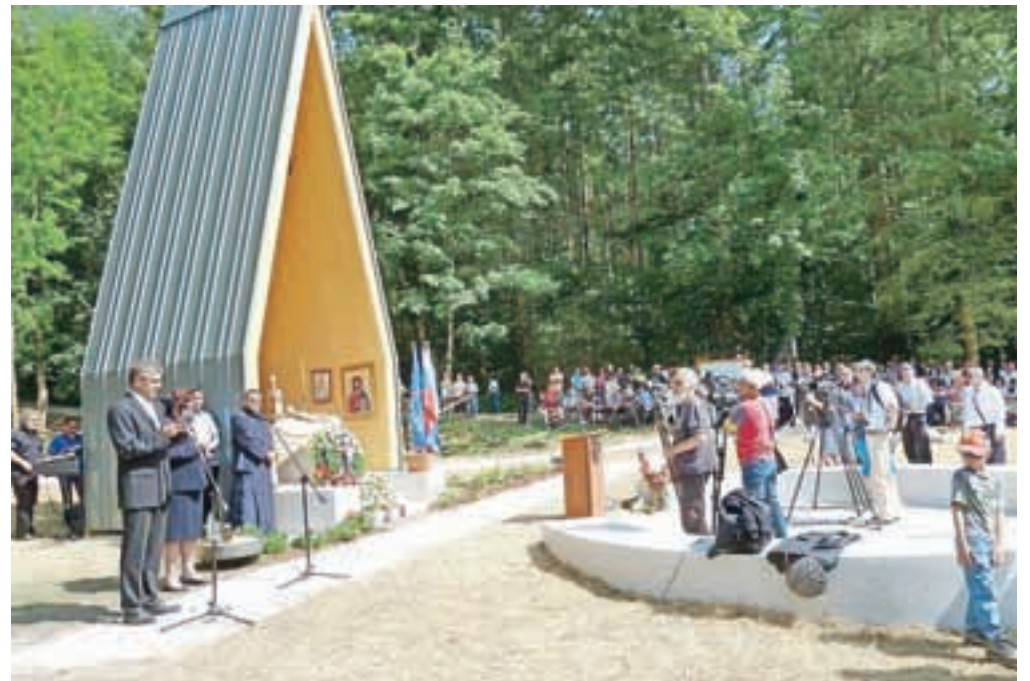
Blagoslovitev kapelice v Parku spomina in opomina na Kopskih

»Sedemdeset let je minilo od druge svetovne vojne, ki je pustila trajne posledice mnogim rodovom. Milijoni pobitih, ranjenih, preseljenih, izseljenih in mučenih. Vse to v imenu ideologij, ki sta želeli izbrisati druge narode z obličja zemlje. Ker nasilje vedno rodi novo nasilje, je bila naša zemlja takoj po koncu vojne prepojena z novo krvjo, vlogo so se zamenjale. Moramo se zavedati, da to ni slovenska posebnost, to se je dogajalo po vsej Evropi. Ne prikazujemo Slovenije v slabši luči, kot si zasluži. Državo in narod