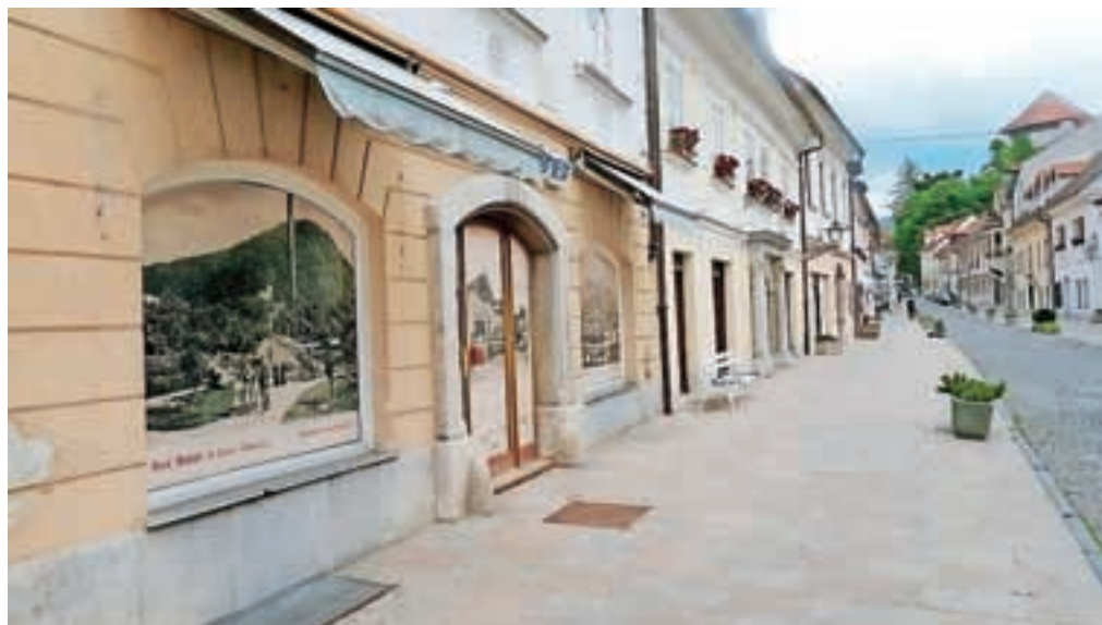
Stare razglednice v zapuščenih izložbah na Šutni

Seveda so bili nekateri lastniki pripravljene sodelovati pri projektu, spet drugi so to zaradi različnih razlogov zavrnil. Tako opremljene izložbe so namenjene lepšemu videzu pročelja hiš, marsikateremu domačinu in turistu pa se ob sprehodu po ulici oko lahko ustavi na lično urejenih oknih, na katerih so predstavljene pisane drobtinice iz preteklosti. Če boste hoteli po Šutni, se za trenutek le ustavite in se zazrite v »zgodbe« izložbenega okna, ki jih ne smemo pozabiti in bi jih morali poznati ne le meščani, temveč tudi tuji obiskovalci mesta.