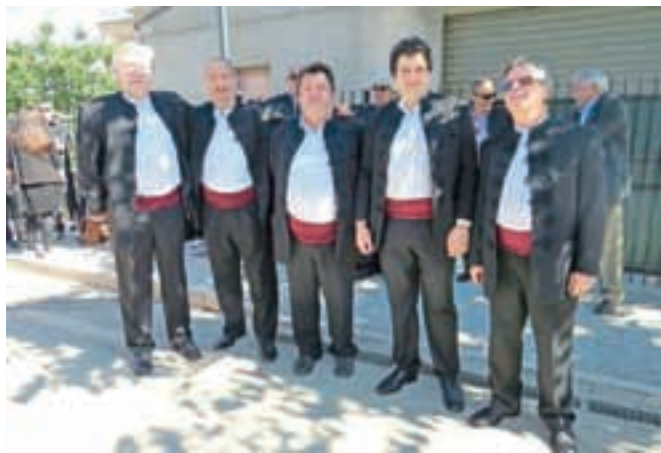
Klapa Mali grad v južni Italiji

Kamnik – Streljaj od ostroge na italijanskem škornju se nahaja pokrajina Molise. Pred približno petsto leti so tja iz zaledja jadranske obale in Dalmacije pred turškimi vpadi pribežali Hrvati. Najstarejšo manjšino naših sosedov tvori okoli tisoč tako imenovanih moliških Hrvatov, ki prebivajo po večini v krajih Acquaviva Collecroce (Kruč), San Felice del Molise (Filiči) in Montemitro (Mundmitar). Potomci prebeglih Hrvatov govorijo svoj jezik, nekakšno mešanico hrvaščine, staroslovjanščine in deloma italijanščine. Ko so prišli prek jadranskega morja – to naj bi bilo nekega petka v maju, so s seboj prinesli tudi kipec svete Lucije. Ker ne vedo, kateri je bil, prav vse namenijo čaščenju svetnice, in kar je sila ne navadno za katoliško cerkev, se te dni ne postijo. Zadnji petek v maju pa je še zlasti slavnostno, saj je takrat višek praznovanja (dela prost dan) z mašami, procesijo in