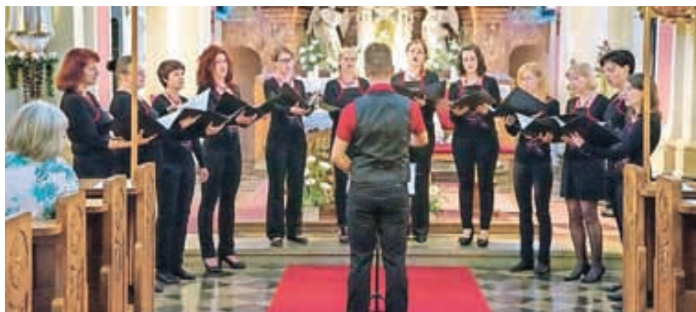
Pevski zbor Vox Annae iz Tunjic

Sezono zaključujemo na občinski proslavi v Komendi, sledi krajši dopust, jeseni pa regijsko tekmovanje pevskih zborov Gorenjske ter novi izzivi. Ker nas združuje veselje do petja, se rade odzovemo povabilu na kak dogodek ter ga s svojim petjem še polepšamo.