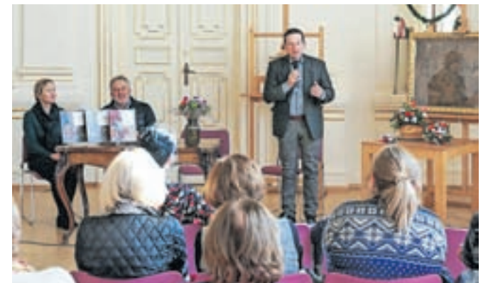
Knjigo Sporočilnost cvetic na slikah Narodne galerije so predstavili v Narodni galeriji Slovenije.

»Skozi tradicionalne načine uporabe smo Slovenci na