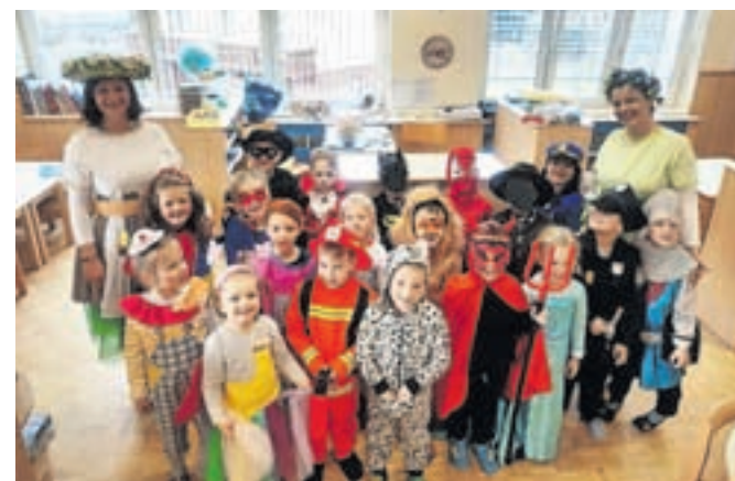
Pust v enoti Palček, Vrtec Antona Medveda Kamnik

V vrtcu nismo prišli otroci in vzgojiteljice, temveč maskare. Po zajtrku smo posvetili pozornost še zadnjim detajlom poslikave obrazov in se fotografirali. Sledila je modna revija, kjer so se predstavile vse maskare. Nato smo se zbrali pred vrtcem, kjer so nas že čakale navdušene velike maskare – starši, babice in dedki. Število udeležencev, ki so se vabilu odzvali, je presegllo vsa pričakovanja! V dolgi povorki smo se odpravili po Šmartnem v Tuhinjski dolini in se ponosno pokazali vaščanom. Kakor vsako leto smo se tudi tokrat ustavili pri trgovini, kjer so nas že pričakovali in bogato pogostili. Prijazna lastnica je za nas spekla tudi krhke flancate. Družili smo se, poklepotali, se zahvalili za gostoljubje in vse dobrote ter se odpravili naprej. Pot nas je vodila do šolskega igrišča, kjer se je prava zabava šele začela. Iz zvočnika se je zaslislala glasba, ob kateri smo rajali, plesali in se veselili. Vzgojiteljice smo vse prisotne pogostile s krofi in vročim čajem.