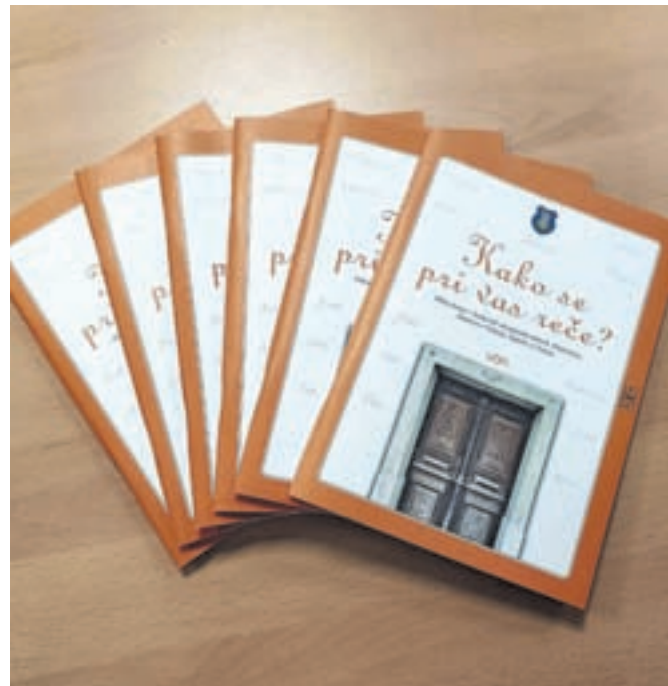
Knjižica predstavlja stara hišna imena na območju kamniške občine med Bučem in Motnikom.

Čeprav je bilo zbiranje hišnih imen na območju,