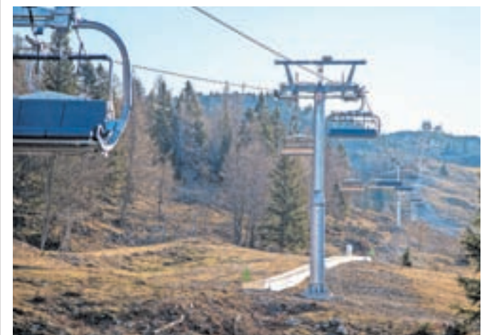
Sedežnica pot med Šimnovcem in Zelenim robom premeta v manj kot petih minutah.