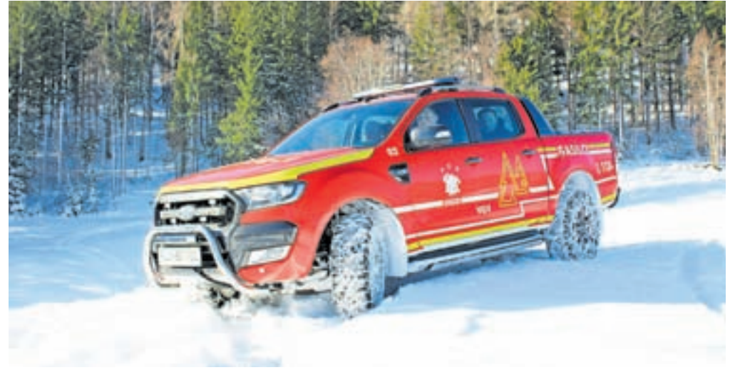
Novo večnamensko gasilsko vozilo PGD Gozd

Gasilci in gasilke PGD Gozd operativno pokrivamo razmeroma veliko in razgibano območje, ki zajema dolino Črne, okoliška naselja ter območje Male in Gojske planine. Območje je veliko več kot 22 kvadratnih kilometrov, v njem pa v desetih naseljih živi okrog 800 prebivalcev. Za uspešno posredovanje v vsakršnih razmerah je na tovrstnem terenu gasilsko vozilo s štirikolesnim pogonom nujno. To in pa pomanjkanje ponudbe kombijev s štirikolesnim pogonom pa je bil tudi razlog, da smo že aprila lani kupili rabljeno vozilo Ford Ranger Wildtrak s 3,2-litrskim motorjem, velikim tovornim prostorom, štirikolesnim pogonom in terenskimi zmogljivostmi. Vozilo, tudi če še ni bilo povsem »gasilsko«, je svojo uporabnost pokazalo že ob vseh večjih intervencijah v lanskem letu – v julijskih neurjih, avgustovskih ekstremnih poplavih in neurju ter v času jesenskih neurjih. Zaradi prostora za prevoz tovora in terenskih zmogljivosti je namreč ogromno pripomoglo k izvajanju intervencij in odpravi posledic omenjenih naravnih nesreč. Z avtom