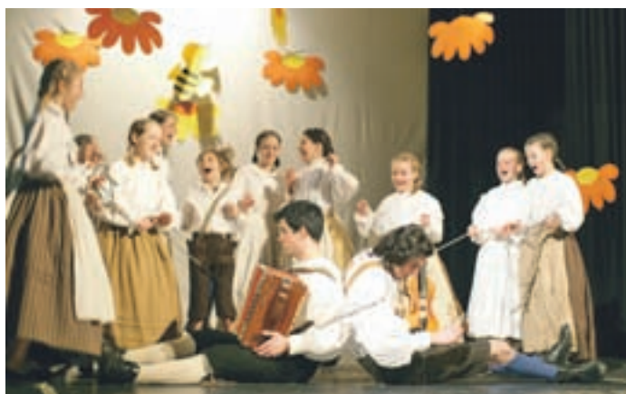
Utrinek s prireditve mladih folkloristov ob materinskem dnevu