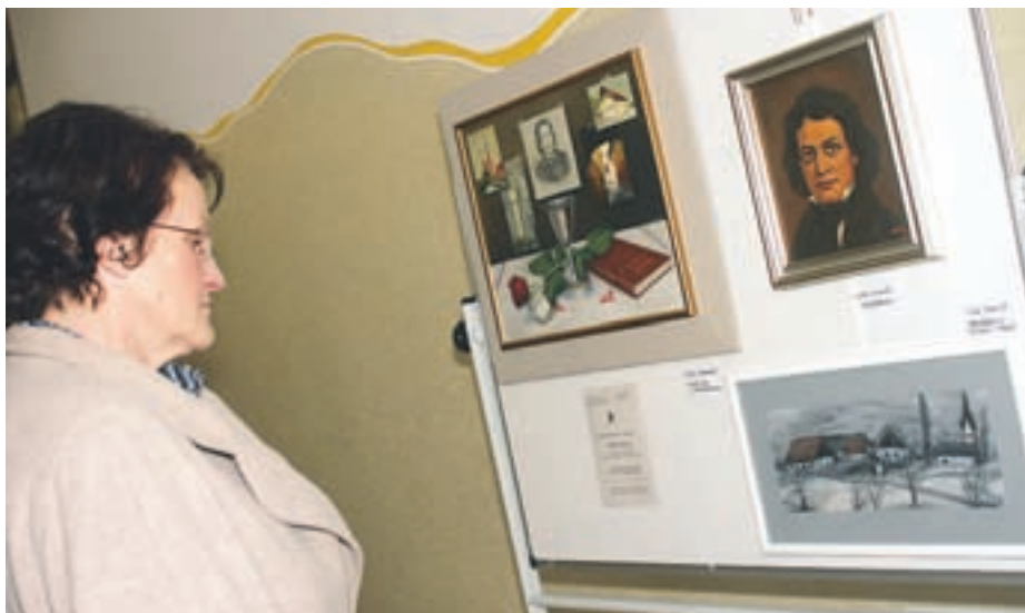
Na razstavi slikarske kolonije Vrba 2009 se je predstavilo 30 slovenskih slikarjev.