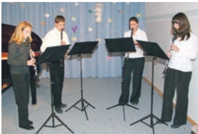
Kvartet klarinetov je na regijskem tekmovanju osvojil zlato priznanje, na državnem pa srebrno plaketo.