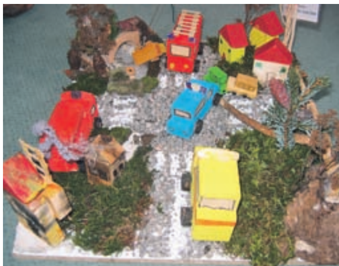
Maketa vrtčevskih otrok, ki predstavlja situacije, v katerih je ogroženo življenje.