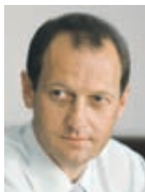
Župan Leopold Pogačar

”Rebalans proračuna je bil potreben zaradi prenosa nerealiziranih sredstev za investicije v letu 2008 in uskladitve z veljavnim načrtom razvojnih programov. V primerjavi s sprejetim proračunom so v rebalansu prihodki višji za 27 odstotkov in znašajo dobrih pet milijonov evrov, saj pričakujemo več državnih in evropskih sredstev (skupaj 1,8 milijona evrov), okoli 150 tisoč evrov pa naj bi bilo prihodkov od prodaje stavbnih zemljišč. Odhodki se bodo povišali za 80 odstotkov na 7,4 milijona evrov. Razliko med prihodki in odhodki bomo krili s prenosom sredstev iz preteklih let v višini 1,5 milijona evrov in že omenjenim zadolževanjem. Letos bo tako največji projekt gradnja večnamenske dvorane, za kar je v letošnjem proračunu predvide-