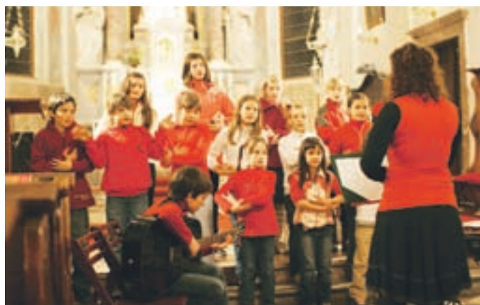
V župnijski cerkvi se je prvi predstavil Otroški pevski zbor Breznica.