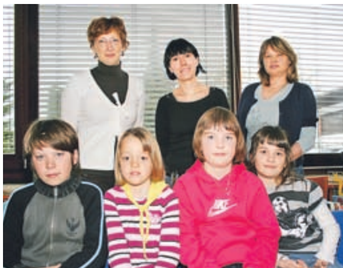
Nagrajeni osnovnošolci (manjka Rok Lužnik) z mentoricami