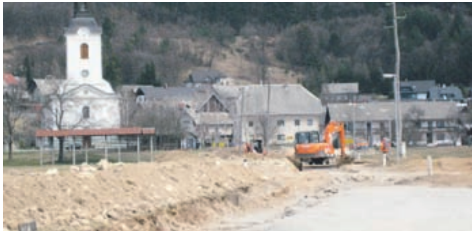
Gradnja kanalizacije v Vrbi in na Breznici je v polnem razmahu, dela v Zabreznici pa se bodo zaradi zamujanja države z razdelitvijo evropskih sredstev ter investicij v večnamensko dvorano in pločnik oddaljila za leto ali dve.