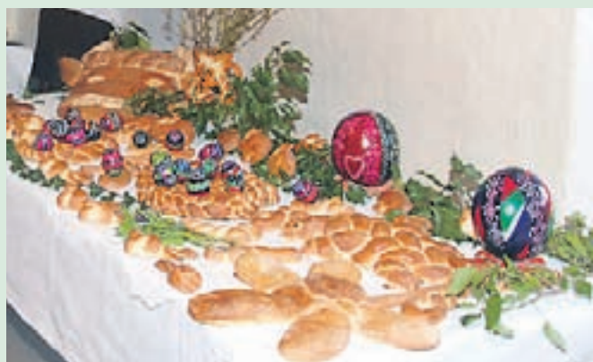
V Jalnovi rojstni hiši na Rodinah so v nedeljo, 22. marca, pripravili Jožefov sejem z razstavo kruha (Pekarna Resman). Na razstavi je bilo na ogled veliko vrst kruha in peciva, ki je značilno za bližajoče se velikonočne praznike. Morda pa še zanimivost, na embalaži peciva (medenjaki) so natisnili tudi odlomek iz povesti pisatelja Jalna 'Ovčar Marko', kar se nanaša na med, medenjake in medvede.