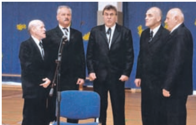
Moški kvintet KD dr. France Prešeren ima po dvajsetih letih delovanja za seboj več kot 800 nastopov.

Vsi so bili oz. so še vedno dejavni tudi v drugih pevskih zborih, s kvintetom pa se jim je v dvajsetih letih nabralo okoli 800 nastopov doma in v tu-