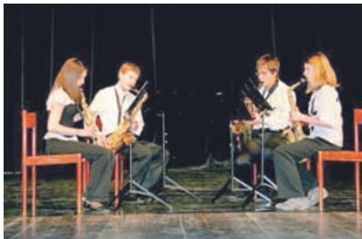
Kvartet saksofonov je na regijskem tekmovanju prejel srebrno priznanje.

Sredi februarja je bilo v prostorih Glasbene šole Jesenice 12. regijsko tekmovanje mladih glasbenikov Gorenjske, ki so ga organizirale glasbene šole Jesenice, Radovljica, Škofja Loka, Kranj in Tržič. Discipline letošnjega regijskega tekmovanja so bile kitara, violina, violončelo in komorne skupine s pihali, skupaj pa je nastopilo 57 tekmovalcev.