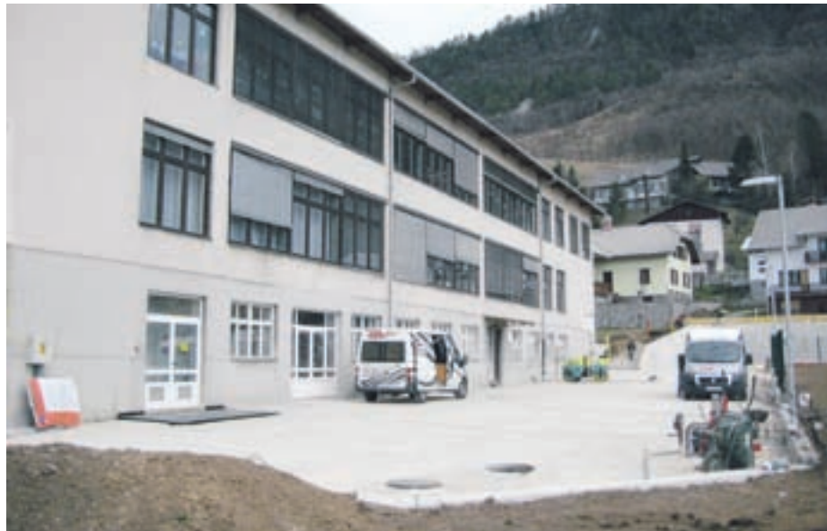
Gradnja parkirišč pri osnovni šoli bo predvidoma končana do 10. aprila.

Kot je bilo že večkrat napisano, se bo v letu 2009 začelo z izgradnjo večnamenske športne dvorane pri OŠ Žirovnica.