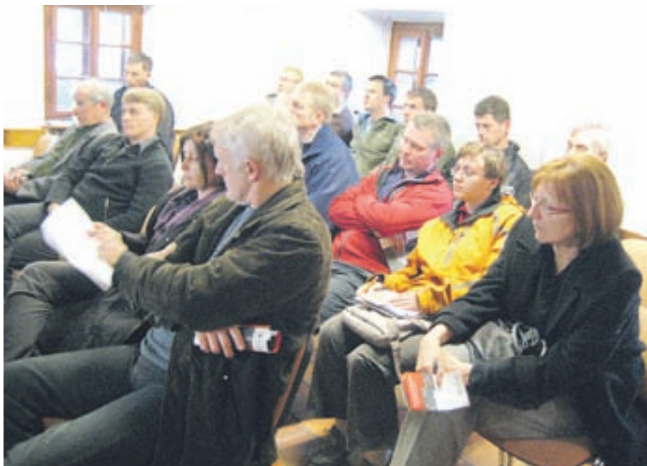
Obrtniki in zainteresirana javnost na okrogli mizi o poslovni coni

Zemljišča bodo velika od 1.200 do 6.000 kvadratnih metrov, prodajna cena kvadratnega metra komunalno opremljenega zemljišča pa se bo predvidoma gibala od 130 do 150 evrov,