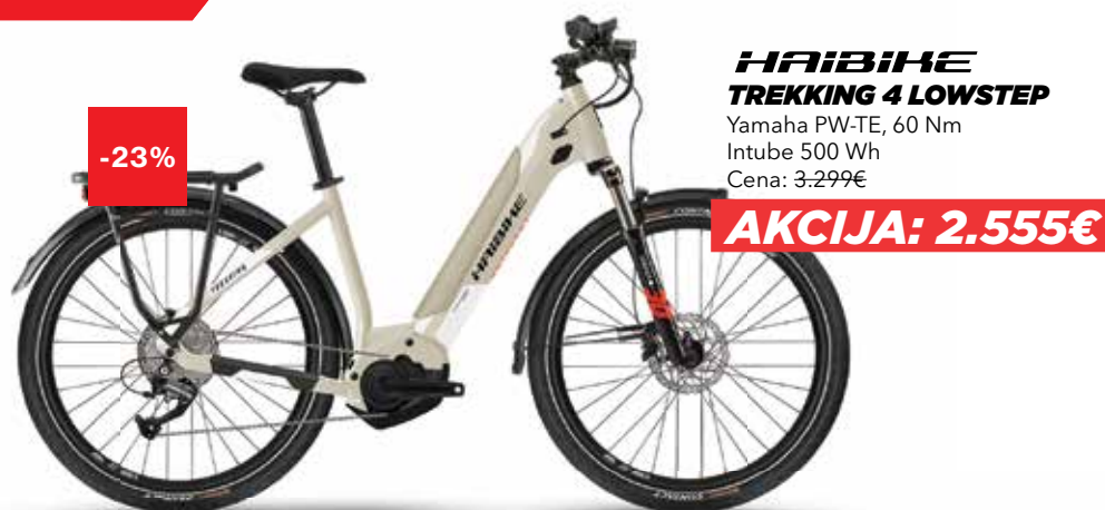
HAIBIKE TREKKING 4 LOWSTEP Yamaha PW-TE, 60 Nm Intube 500 Wh Cena: 3.299€