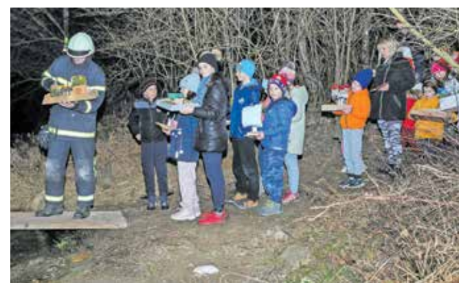
Gregorčke so spustili po reki Kokri.