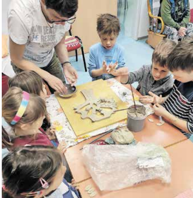
Na delavnici oblikovanja gline

Ker bomo sodelovali skozi celo leto, so nas v marcu povabili na delavnico oblikovanja gline, ki smo se je udeležili v treh skupinah. Otroci so v delavnicah zelo uživali. Zaposleni in varovanci so predhodno za vsako skupino izdelali drevo iz gline, na katero so otroci nalepili izdel-