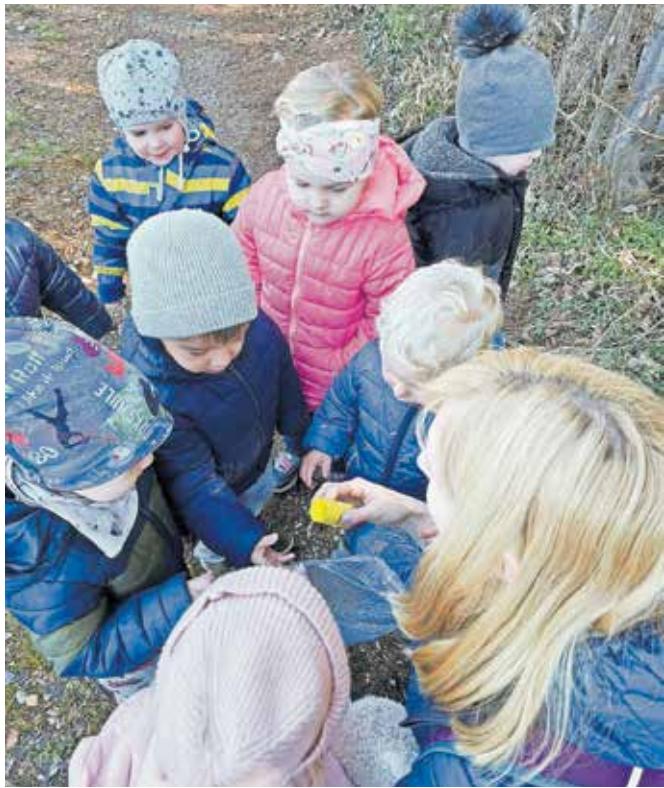
Pomladna razigranost Pri Dobri Metki

Skozi različne dejavnosti raziskujemo okolico, najbolj zanimive pa so nam luže, v katerih radi skačemo in uživamo, ko voda škropi na vse strani. Gozd je naš drugi dom, zato radovedne otroške oči hitro najdejo kakšno žival