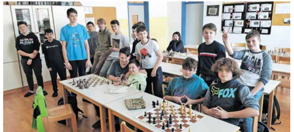
Učenci se na šahovskem krožku družijo vsak ponedeljek po koncu pete šolske ure.

pri vsem napisanem pomembni vztrajnost in vaja. Učenci se v šahovskem krožku družijo vsak ponedeljek po koncu pete šolske ure. V tem šolskem letu se še nismo udeleževali šahovskih tekmovanj, je pa naša skupna želja, da začnemo na tekmovanja hoditi v naslednjem šolskem letu. Kot skupina smo si zelo različni, tako po znanju igranja šaha kot po starosti, krožka se udeležujejo tako fantje kot dekleta. Družijo pa nas veselje do igranja šaha in komaj čakamo, da pride ponedeljek, ko se lahko družimo ob partijah.