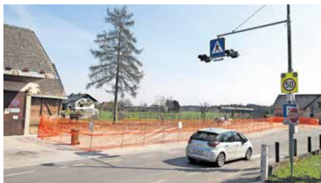
Kmetijska zadruga Cerklje ob robu središča Šenčurja gradi nov objekt.