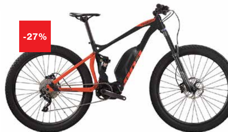
WILIER e803TRB COMP Shimano STEPS MTB, 60 Nm External 630 Wh Cena: 4.099€

A2U Koper Ankaranska cesta 5c, 6000 Koper T: 05 63 94 111