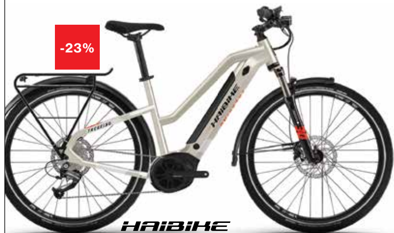
HAIBIKE TREKKING 4 TRAPEZ Yamaha PW-TE, 60 Nm Intube 500 Wh Cena: 3.299€