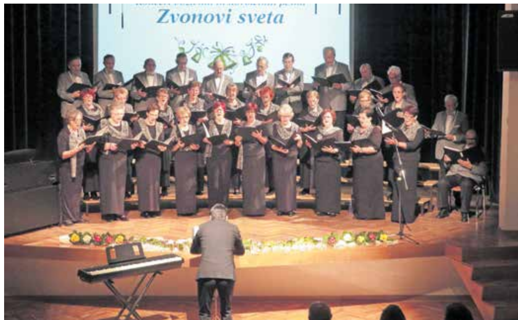
Mešani pevski zbor Društva upokojencev Šenčur

Po poletnih počitnicah smo si zadali nov projekt koncert božičnih pesmi. Do tedaj se nismo srečevali s petjem sakralne glasbe, zato smo se