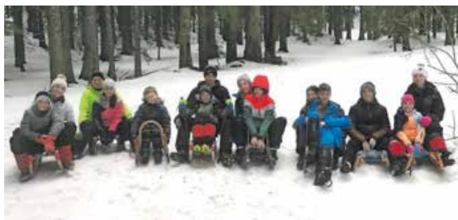
PGD Hotemaže na taboru na Pokljuki

vih vojaških spalnicah, nato pa kosilo v vojaški jedilnici. Popoldan smo šli na daljši pohod na Uskovnico, po večerji pa smo se družili ob družabnih igrah. Sobotno dopoldne smo preživeli v znamenju urjenja gasilskih veščin ter učenju streljanja z zračno puško, popoldan pa smo ta znanja združili in uporabili na tekmovanju Mini biatlon. Popoldan smo po skupinah skopali snežne luknje ter pripravili čaj iz stopljenega snega ter smrekovih vejic. Po večerji je sle-