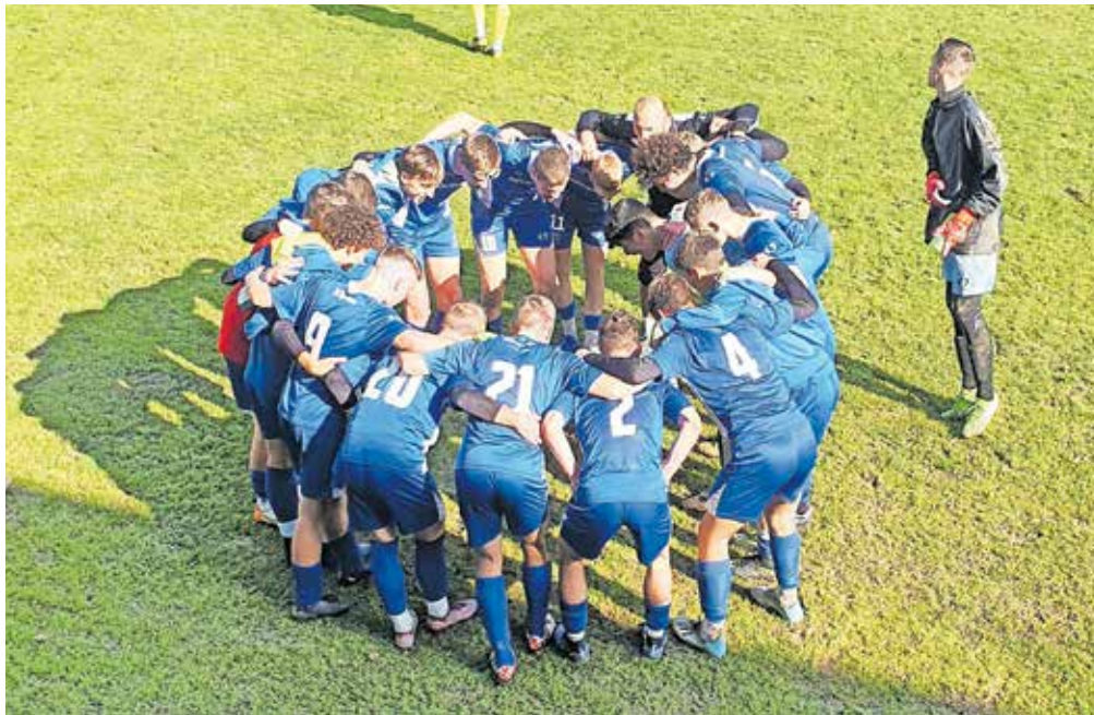
V Šenčurju igra nogomet skoraj 270 nogometašev.

Trenutno organizirano igra nogomet skoraj 270 nogometašev in ponosni smo, da se število povečuje iz dneva v dan. Nogometaši so razporejeni v 16 selekcij – starostnih skupin, tako da pokrivamo celotno nogometno piramido.