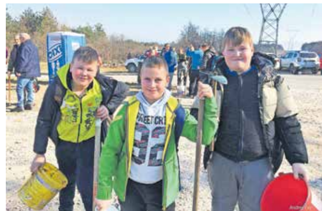
Pridružili so se nam tudi mladi čebelarji.

Zavoda za gozdove Slovenije smo se v skupinah odpravili vsaka na svoj hektar pogorišča. Pot nas je vodila mimo zgoznelih dreves, brez podrastja. Na vsakem koraku kamen. Čeprav je bil prijeten dan, je bil pogled na požgano zemljo