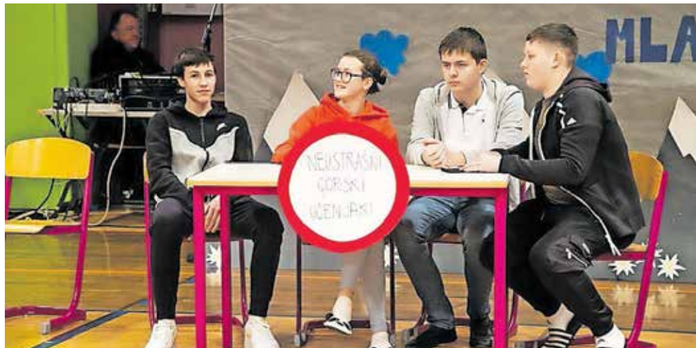
Zmage se je veselila ekipa Neustrašni gorski učenci.