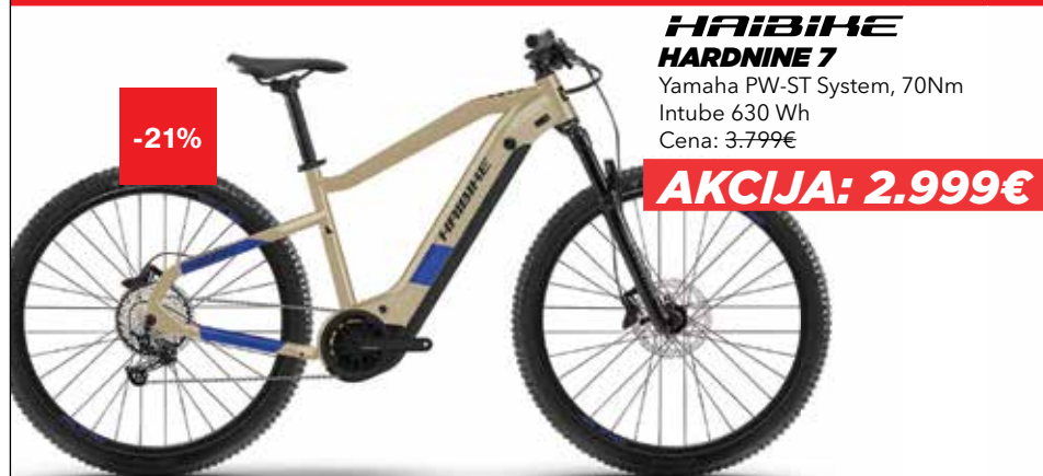
HAIBIKE HARDNINE 7 Yamaha PW-ST System, 70Nm Intube 630 Wh Cena: 3.799€