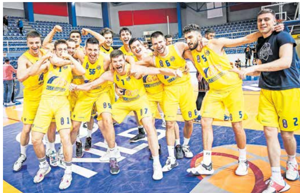
Članska ekipa Gorenjske gradbene družbe Šenčur

Trener Pavković je uvodno sezono lige ABA 2 pospremil z naslednjimi besedami: »Tekmovalje v ligi ABA 2 je nagrada za naš klub, ki je stabilen slovenski prvotigaš že nekaj let. To so tudi neprecenljive izkušnje za košarkarje, ki še niso imeli priložnosti igrati v regionalni ligi. V drugem delu lige se je razpoloženje popravilo, pa tudi samoza-