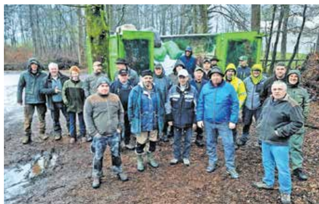
Čistilni akciji so se pridružili tudi člani LD Šenčur.