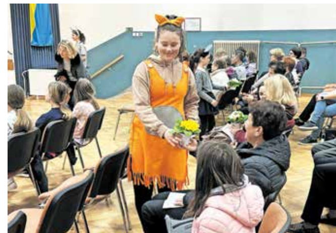
Mamam so podarili trobentice.