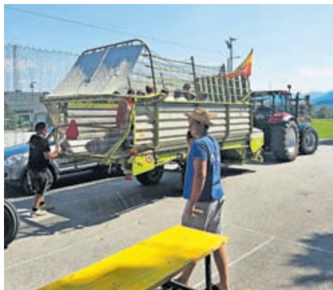
Takole so se ekipe za nogometno tekmo »debeli – suhi« peljale iz Ljubnega na Posavec.