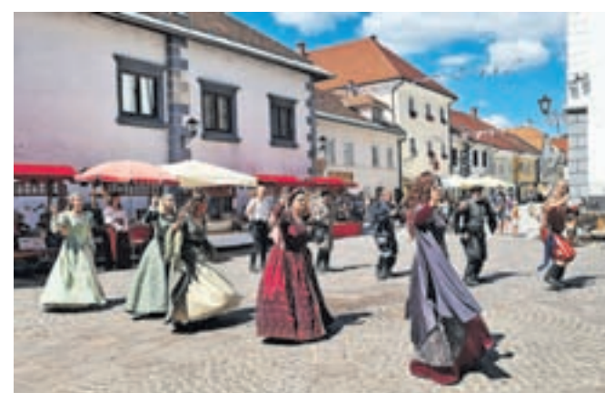
V nedeljo bo Radovljica spet zaživela v duhu starih časov.

Ime Srečanje mest na Venerini poti je dogodek dobil v devetdesetih letih, ko je Občina Radovljica s projektom treh prireditev želela poskrbeti za ohranjanje srednjeveške kulturne dediščine in bogatenja kulturnih vsebin na gradu Kamen, na Pustem gradu in v Radovljici, pojasnjujejo na Turističnem