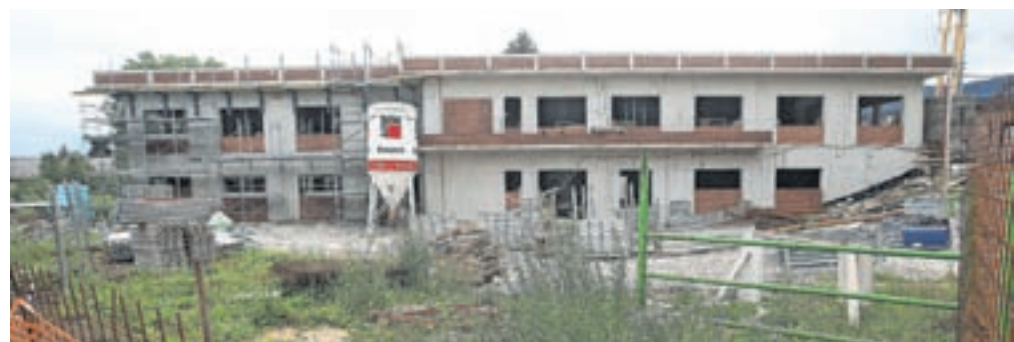
Gradnja prizidka k radovljiškemu vrtcu za zadaj teče po načrtih, zaključena naj bi bila v enem letu.

pojasnili na občinski upravi. V novem prizidku bo, kot rečeno, tudi prostor za razvojni oddelek. V radovljiških vrtcih takšnega oddelka še ni – otroci s težjimi in težkimi motnjami v razvoju so vključeni v redne oddelke oziroma v ra-