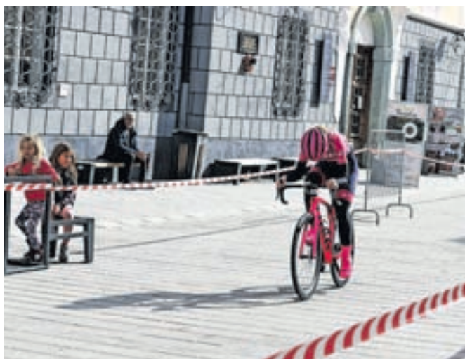
Cilj dirke bo tudi letos na Linhartovem trgu.

Koncept dirke, ki jo organizira Občina Radovljica v sodelovanju s skupino prostovoljcev Prava smer in Pedalerji.org, omogoča sodelovanje širokemu krogu vseh vrst kolesarjev. Prijateljem, da se pomerijo med sabo, posameznikom, da občutijo malo tekmovalnosti in predvsem navijaškega vzdušja ob progi, tako kot na največjih svetovnih dirkah. Zato so še posebej vabljeni tudi gledalci, navijači in pri-