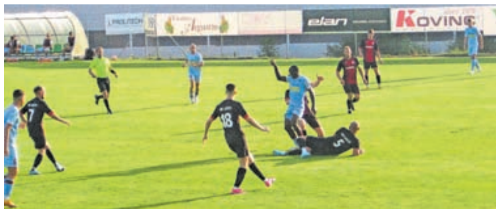
Pokalna tekma med Šobcem Lesce in Triglavom Kranj

ekipo zrelostni test. Moji fantje me s tem, kar so pokazali na igrišču, niso niti malo razočarali. Treba je vedeti, da je med ligami v Sloveniji velika razlika. Jožef je posebej omenil še mladinsko ekipo in kadete