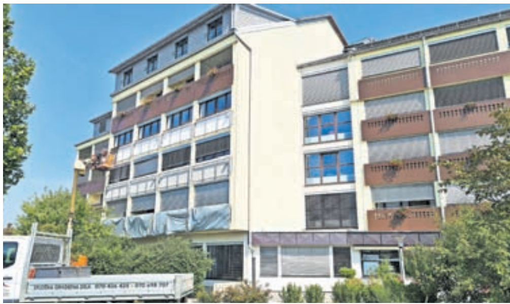
Obnova sob na dveh oddelkih je končana, do konca leta bodo stavbo opremili še z novimi dvigali za stanovalce.