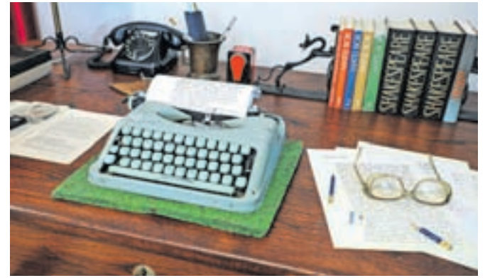
V knjižnici hranijo tudi nekatere kose pohištva in osebne predmete, ki jih je Matej Bor uporabljal, ko je živel v Radovljici.

Dokumentarna razstava v tretjem nadstropju radovljiške knjižnice nosi naslov po eni od Borovih pesmi – Šel je popotnik skozi atomski vek. Kot pravi avtor razstave mag. Jure Sinobad, je posvečena zapuščini pesnika, pisatelja, dramatika, prevajalca, literarnega kritika in akademika Vladimirja Pavšiča - Mateja Bora. Rodil se je 14. aprila v Grgarju pri Gorici, umrl pa 29. septembra 1993 v Radovljici, kjer je po drugi svetovni vojni živel in ustvarjal. »Vladimir Pavšič - Matej bor je bil osebnost, ki je zaznamovala dvajseto stoletje. Bil je edini od velike peterice slovenskih medvojnih pesnikov (Balantič, Bor, Hribovšek, Jarc, Kajuh), ki mu je bilo dano previhariti viharje druge svetovne vojne,« je v uvod k razstavi zapisal Sinobad.