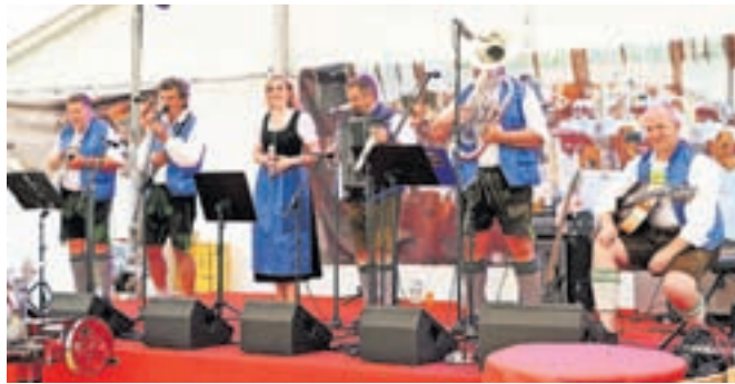
Za dobro narodno in zabavno vzdušje na prireditvi poskrbijo tako domači kot tudi tuji ansambli.

treh dneh nastopili še Okrogli muzikanti, Ansambel Roberta Zupana, Hišni ansambel Avsenik, Ufinger 6, Godba na pihala Mengeš, Slovenski muzikantje, Slovenski zvoki, Amersee kwintet, Kwintet Dori, Ansambel Wankmüller, Aleks