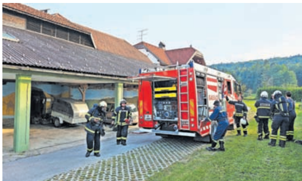
Gasilska vaja v Otočah