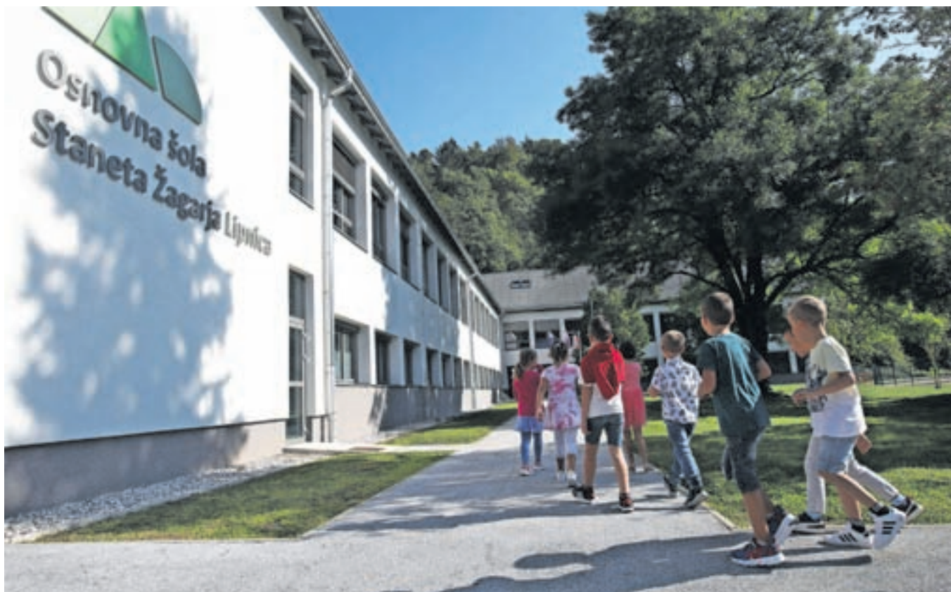
Prvi šolski dan na Osnovni šoli Staneta Žagarja Lipnica

gradbenih del v okviru dozdave razvojne ambulante ter urejanja nove kuhinje je bila poleti zaprta enota Radovljica. Občina za projekt letos v proračunu namenja skoraj 1,8 milijona evrov, nekaj sredstev pa se namenja še za izdelavo projektne dokumentacije kot pripravo na projekte, ki bodo izvedeni v naslednjih letih, so pojasnili na občinski upravi.