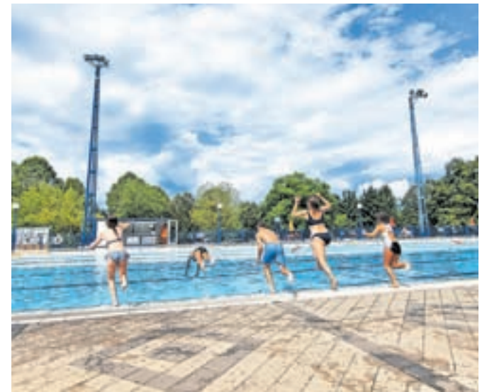
Kar nekaj časa so počitnikarji preživeli tudi na radovljiškem kopalnišču.

Radovljici, zadnja počitniška aktivnost pa je bila namenjena spoznavanju vojašnice na Bohinjski Beli. Vojaki so otrokom prijazno predstavili zaščitno opremo vojaka gornika, gorniško opremo in sanitetni komplet. »Po tem, ko