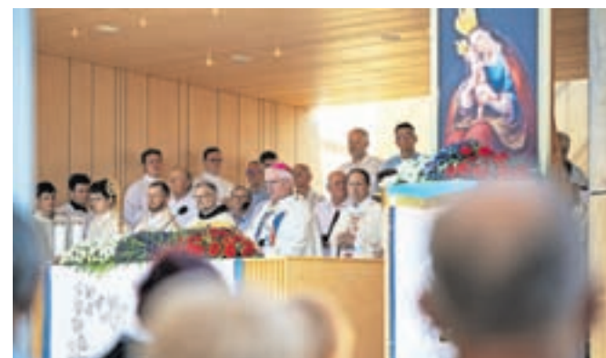
Slovesna sveta maša ob prazniku Marijinega vnebovzetja na Brezjah / Foto: PRIMOŽ PIČULIN

»Potrebujemo ga zaradi stisk, ki smo jih doživljali v zadnjih dneh in jih mnogi še vedno doživljajo. Ko se je zdelo, da je v naravi zmaj ušel z verige in je grozilo, da bo požrl vse, kar je našel na poti. Koliko klicev se je v teh dneh in nočeh dvignilo k