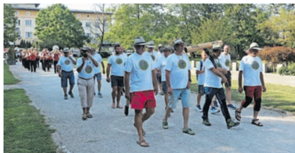
Povorka pohodnikov in pihalnih orkestrrov skozi Grajski park na Linhartov trg