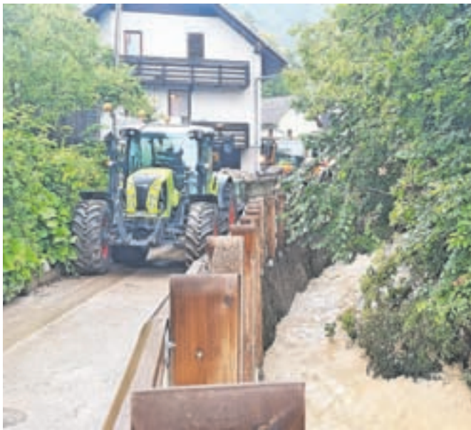
Največ škode je vodna ujma povzročila v Begunjah.

»Ob tem pa se zavedam, da moramo biti solidarni z najhujše prizadetimi območji in temu ustrezno prilagoditi svoja pričakovanja.«