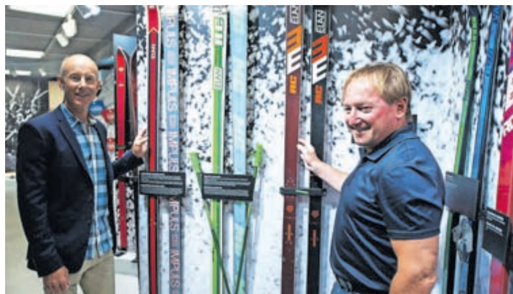
Muzej redno obiskujejo tudi smučarske legende, kakrši sta Ingemar Stenmark in Bojan Križaj.

Tudi otroci so eni ključnih obiskovalcev, poudarjajo v muzeju. Elanovo zgodbo pripoveduje maskota Elanko, ki skupaj z otroki odkriva kulturno dediščino smučarskega sveta, postavlja vprašanja, spodbuja radovednost in približa otrokom zanimanje za muzejski prostor. Otroke poučuje o smučanju danes in nekoč, razlaga jim različne načine smučanja, jih ozavešča o smučarski varnosti, predstavlja Elanove zaščitne znake, jih poučuje o sestavnih delih in materialih smuči, za konec pa jim ponudi zabavo na gibalnem simulatorju.