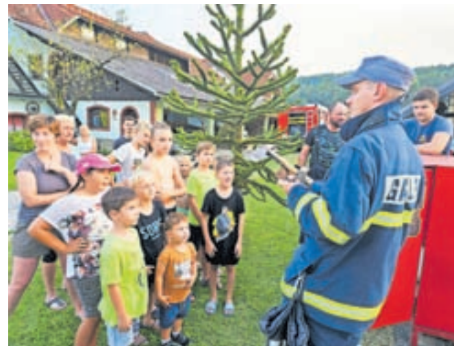
Zanimanje za gasilsko vajo ter predstavitev gasilskega orodja in hidranta je bilo zelo veliko.

»Seveda ne gre brez težav. Počasi teče pridobivanje dovoljenj in soglasij, kjer so ta