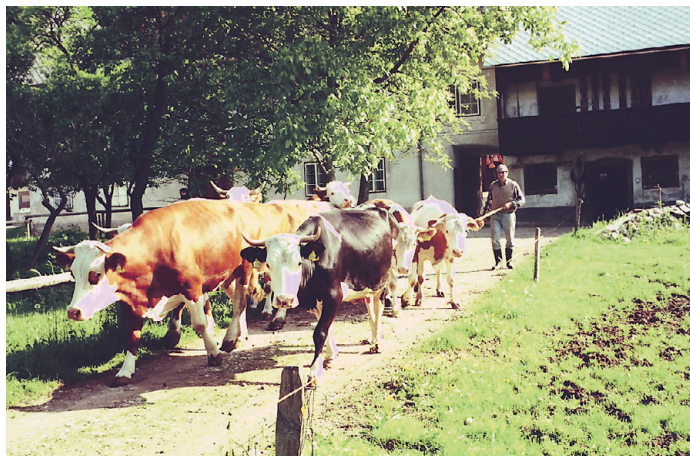
Druga nagrada: Na pašo, avtor Franci Jamar z Breznice