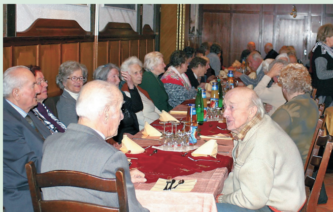
Srečanja se je udeležilo 40 občanov, starejših 80 let.