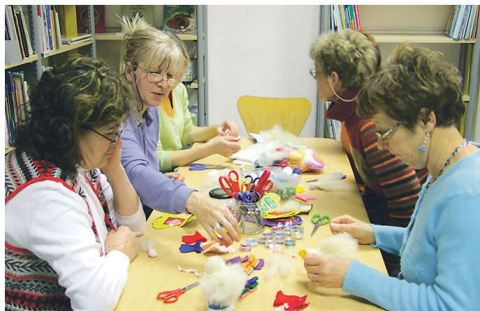
Takole so pod spretnimi prsti nastajali okraski iz filca.

Nadaljevali bodo tudi z ustvarjalnimi delavnicami in urami pravljic za