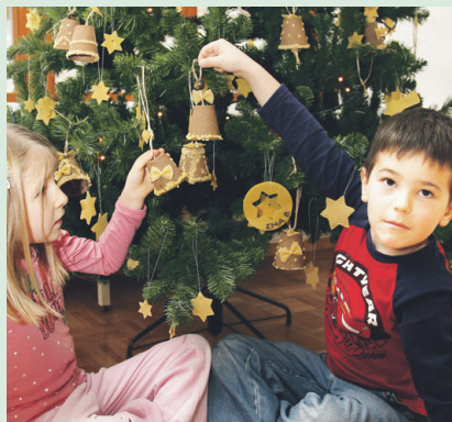
Na naslovnici: Praznično vzdušje v vrtcu

NOVICE OBČINE ŽIROVNICA (ISSN 1854-4932) - Ustanovitelj in izdajatelj: Občina Žirovnica, Breznica 3, 4274 Žirovnica. Pravice izdajatelja izvaja: Gorenjski glas, d. o. o., Kranj, Bleiweisova cesta 4, 4000 Kranj. Odgovorna urednica: Marija Volčjak. Urednica in novinarka: Ana Hartman. Časopis izhaja v nakladi 1.550 izvodov, brezplačno ga prejemajo vsa gospodinjstva v Občini Žirovnica. Tisk: Set, d. d., Ljubljana. Naslov uredništva: Gorenjski glas, d. o. o., Kranj, Bleiweisova cesta 4, 4000 Kranj, tel. 04/201-42-00, fax: 04/201-42-13, e-pošta: ana.hartman@g-glas.si ; trženje oglasov: Aleš Šenk, ales.senk@g-glas.si , tel.: 041/638-980.