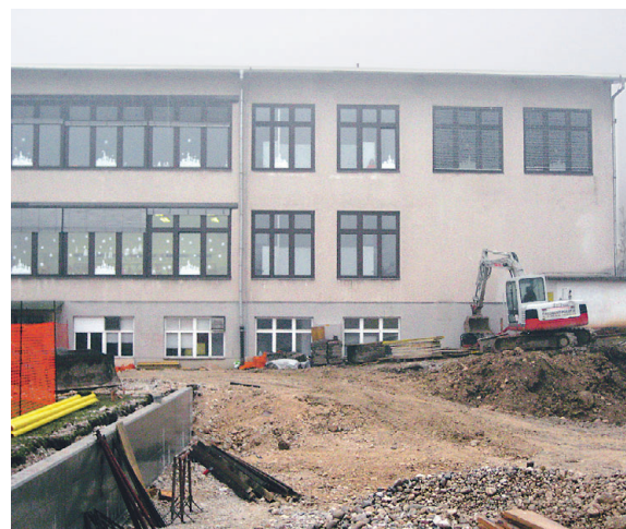
Gradnja parkirišč pri Osnovni šoli Žirovnica

dodatne zobne ambulante za območje naše občine. A na OZG in kranjskem zavodu za zdravstveno zavarovanje so nam odgovorili, da sprejeti Področni dogovor za zdravstvene domove in zasebno zdravniško dejavnost v letu 2008 ne vključuje nobene širitve mreže na področju zobozdravstva za odrasle v občini Žirovnica. Tako smo na ministrstvo za zdravje novembra naslovili prošnjo za pojasnilo, kdaj lahko pričakujemo širitev mreže na področju zobozdravstva, a še nismo prejeli odgovora. Vsekakor si bomo prizadevali za dodatnega zobozdravnika, saj ga nujno potrebujemo.”