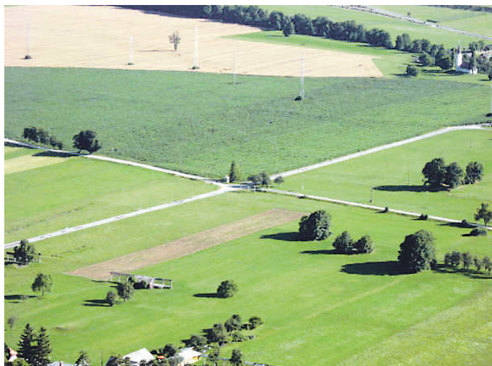
Tretja nagrada: Križišče med Breznico in Vrbo, avtorica Maja Jauh iz Zabreznice