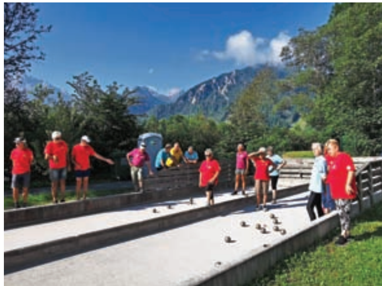
Meddruštveni balinarski turnir