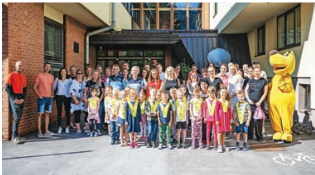
S prvošolci v Mojstrani

V novo šolsko leto je vstopilo 171 učencev v devetih oddelkih, v šestih oddelkih vrtca pri šoli pa 93 otrok. »Trenutno zaključujemo še zadnja dela pri vrtcu,