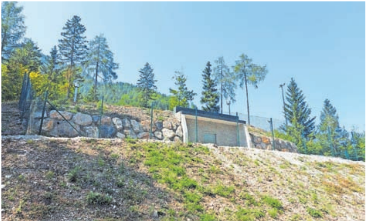
Občina Kranjska gora, Kolodvorska ulica 1 b, Kranjska gora

Vodohran je po zagotovilih Komunale Kranjska Gora, ki je ves čas – od idejne zasnove do izvedbe – bdela nad projektom, narejen kvalitetno po najsodobnejših standardih in je računalniško voden. Izbrani izvajalec del je bilo podjetje Semago, d. o. o., iz Trziča.