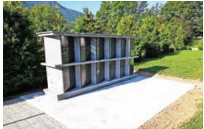
Žarni zid v Ratečah

V kratkem bodo začeli urejati gozdno cesto Belca-Jepca, rušitvena dela na objektu za namen izgradnje novega večstanovanjskega objekta na Delavski ulici 32 v Mojstrani in ureditev struge Dovškega potoka ob regionalni cesti na Dovjem. V kratkem se bo začela tudi obnova Vitranške ceste v Kranjski Gori, kjer bodo sanirali še vodovod, javno razsvetlavo in meteorno kanalizacijo. Prav kmalu bo na vrsti tudi obnova ceste v Naselju Ivana Krivca v Jasni (fazna gradnja), kjer bodo uredili še javno razsvetlavo in