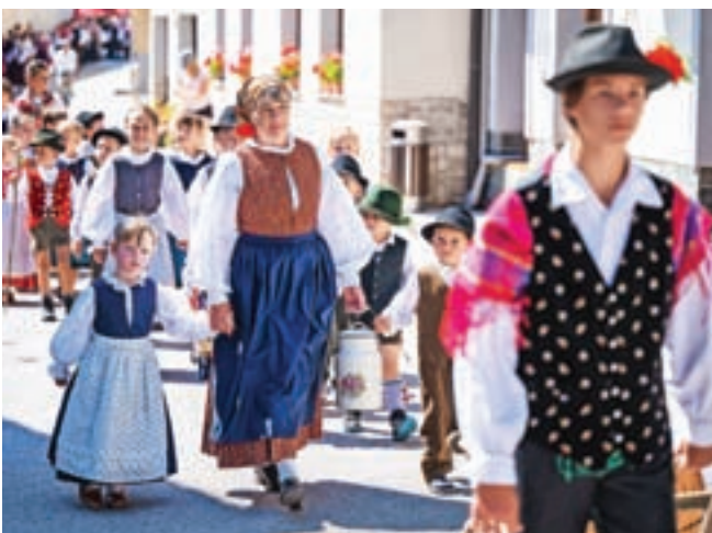
Sprevod narodnih noš skozi vas