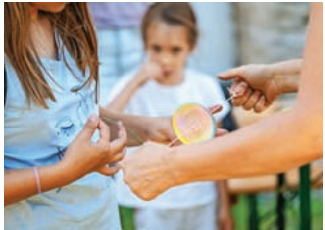
V Kajžnkovi hiši so imeli od 14. do 18. avgusta etnološke ustvarjalnice. Na Vaški dan so otroci izdelali igračo 'preteklosti'.