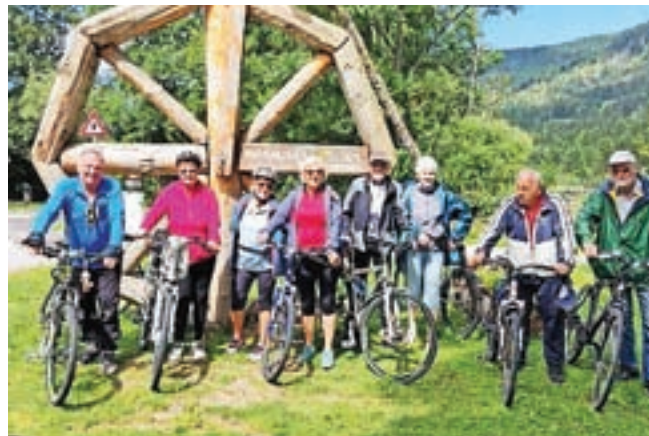
Z dobro voljo tudi na kolo

Društvo invalidov občine Kranjska Gora je avgusta za svoje člane organiziralo tradicionalno kolesarjenje ob občinskem prazniku. Na kolesarski poti Kranjska Gora–Rateče in nazaj so v četrtek, 10. avgusta, udeleženci vrteli pedale vsak po svojih zmogljivostih, rekreaciji na svežem zraku pa dodali prav tako pomembno noto: druženje in prijateljevanje. S. K.