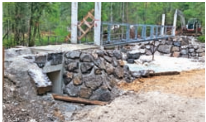
Gradnja viseče brvi čez Triglavsko Bistrico

meteorno kanalizacijo. Med projekti, ki se bodo začeli v kratkem, so še sanacije mostu v Bezjah, mostu v Korziki v Gozdu - Martuljku in podpornega zidu ob avtobusni postaji v Ratečah.