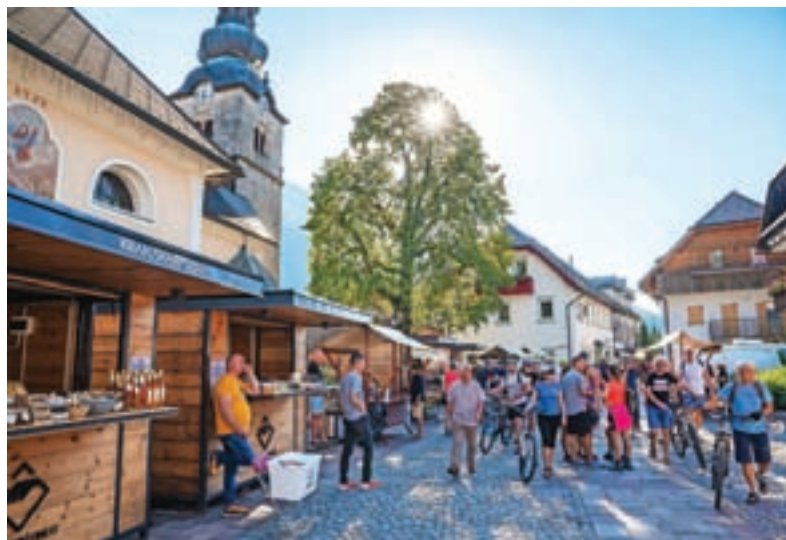
Poletni turistični utrip