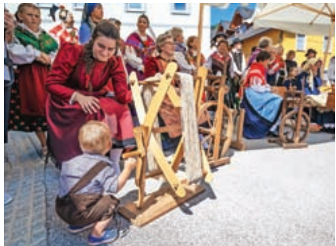
Predstavili so tradicionalne obrti.