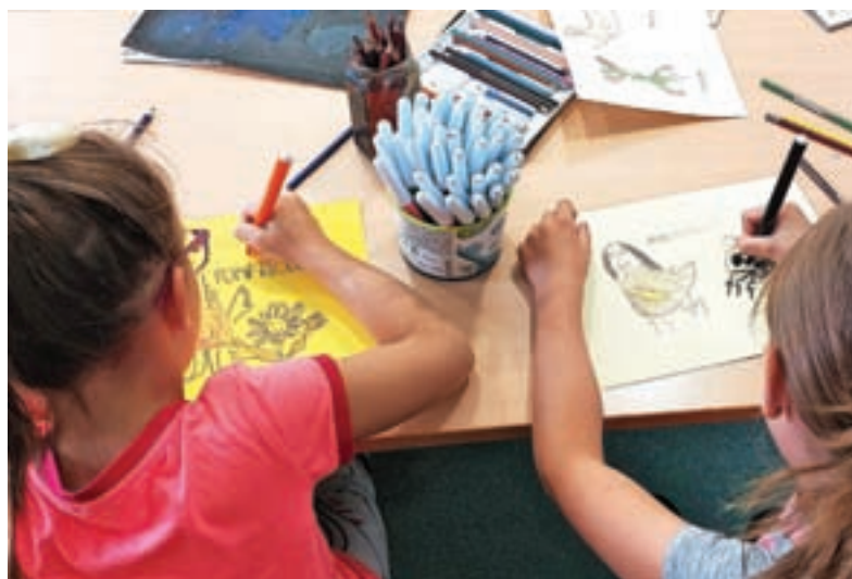
Pestro poletno dogajanje v knjižnici