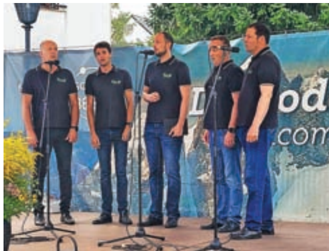
Vokalna skupina Lipa iz Trziča