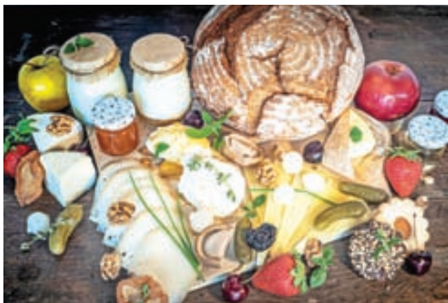
Na voljo so štiri različne vrste zajtrkov.

Gorska klasika za dva, vegetarijanska radost za dva, fitko za dva in hribovska malca za dva, ki še najbolj tekne takrat, ko osvojimo kak vrh. Imena nakazujejo, kaj se zna skrivati v vsakem od štirih različnih zajtrkov, ki so na voljo, dobrote pa so večinoma pridelane in predelane v Zgornjesavski dolini. »Pomembno se mi zdi, da se med seboj povezujemo in sodelujemo.« Odvisno seveda od izbranega zajtrka, a na voljo so mlečni izdelki, kot so skuta, kozji in kravji sir, mesnine, zaseka, med, marmelada, maslo, kruh iz krušne peči, suho sadje, bezgov sirup, piškoti, granola in misli ... Pohodniški malici je celo dodano pivo iz lokalne družinske pivovarne. Lokalno sezonsko sveže sadje pa, ker tega v Zgornjesavski dolini ni toliko, Nini dostavljajo z drugega konca Slovenije, prav tako domačo vloženo zelenjavo.