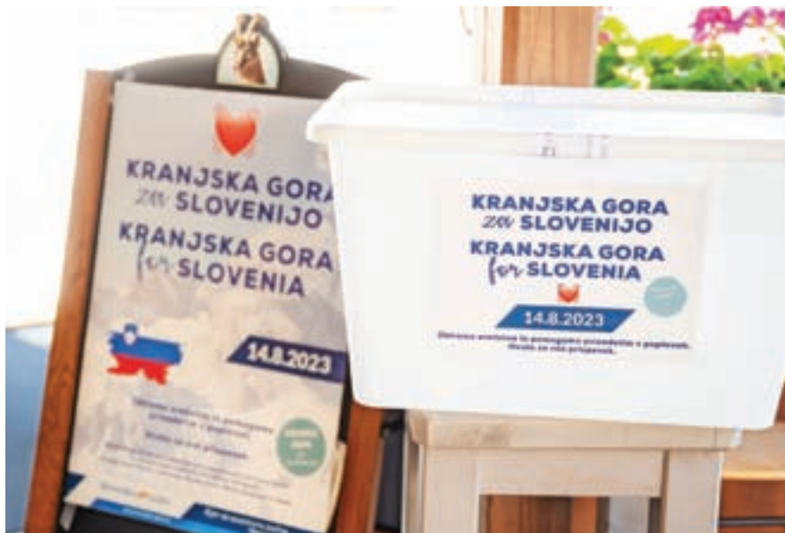
Zbiranje prostovoljnih prispevkov

spevke pa so zbirali v sodelovanju z Območnim združenjem Rdečega križa Jesenice. Iz Zgornjesavske doline