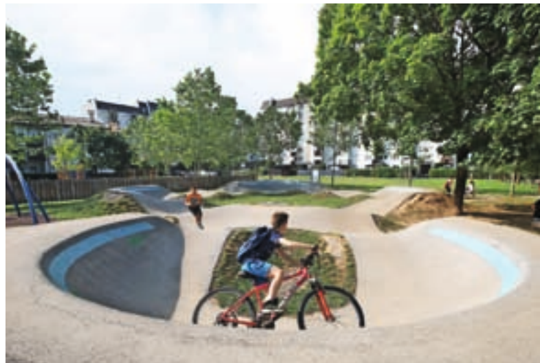
Poleg otroškega igrišča na Planini 3 je mladim za preživljanje prostega časa namenjen tudi grbinasti poligon.

Investicija v tekaško stezo ob šoli na Primskovem je bila s participativnim proračunom že izglasovana, a je še ni. »Na MO Kranj smo večkrat urgirali in tudi krajanje so opozarjali na to. Del zemljišča, ki ni bil občinski, je zdaj odkupljen, gradbeno dovoljenje v pridobivanju, tekaška steza pa naj bi bila po mojih informacijah letos realizirana. Bojim se, da ljudje ne bodo dajali več predlogov za participativni proračun, če izglasovani