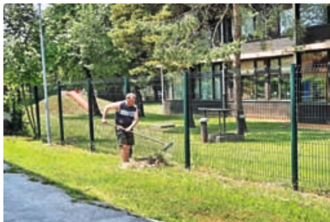
Za urejeno okolico skrbijo tudi krajan