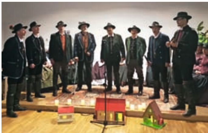
Kranjski furmani

mani so se radi odzvali, mogoče tudi zato, ker pesem pravi: Le pridi na moj dom, poljub ti dala bom ... Vse pesmi večera so govorile o ljubezni in odnosih med moškimi in ženskami. Večer je prehajal od resnega in celo žalostnega k veselemu in nagajivemu. Pesem se je krepila, se rojevala v vse več grlih in ob koncu se je porodila v močno vez, saj je z Bodečimi nežami in Kranjskimi furmani zapela vsa dvorana. Spontano, z nasmehom, v toplém vzdušju, ki smo ga ponesli s seboj domov. Z zavedanjem, da se slovenski človek nikoli ni utopil v skrbeh in trpljenju, temveč je skozi vse zgodovinske in osebne vihre hodil pokončen ter je ohranjal iskričnost, ljubezen in življenjsko moč.