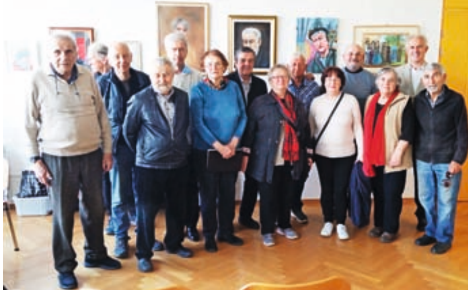
Z odprtja razstave likovnih del aprila letos v galeriji prizidka Doma krajanov Primskovo

Posamezni člani so sodelovali tudi na drugih slovenskih in mednarodnih razstavah, kjer so prejeli več nagrad in priznanj. Pri tem izstopajo: razpis Javnega sklada RS za kulturne dejavnosti, tekmovanje za zlato paletu Zveze likovnih društev RS, mednarodno tekmovanje