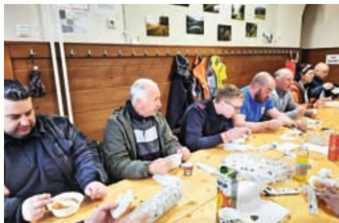
Druženje ob zaključku čistilne akcije