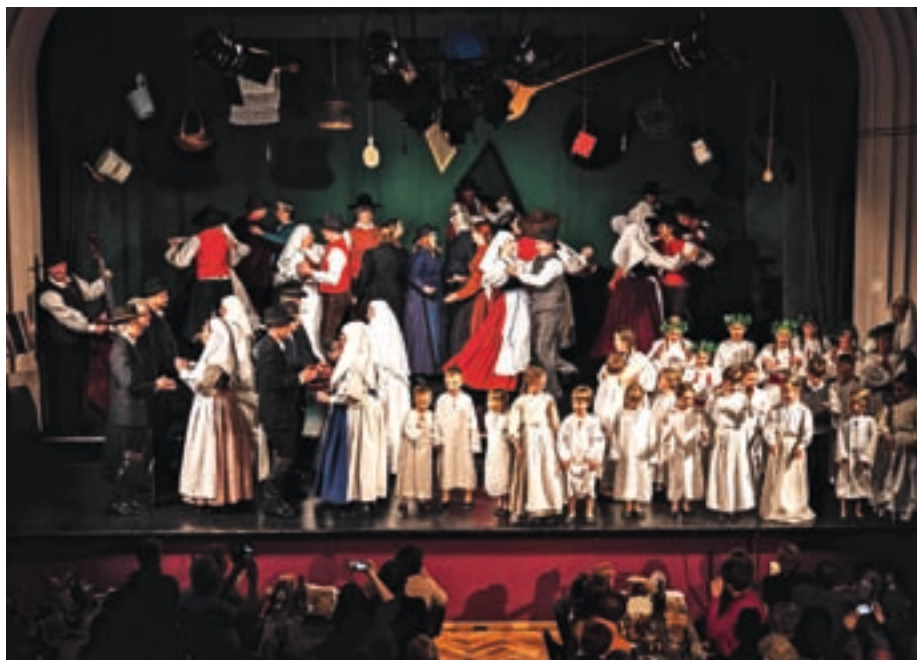
Veliki finale je bila Šentjernejska ohcet.

Večer se je začel s prikazom krsta vina v izvedbi Kranjskih furmanov, ki so mu sledili spretnostni plesi iz spleta Kranjsko žeganje, pri čemer so plesalci prikazali svoje veščine plesa s kozarci, štefanom vina in majoliko na glavah. Otroški skupini sta ogreli srca gledalcev z novim belokranjskim spletom, v katerem so prikazali šego tepežkanja, gledalci pa so ob tem okušali testene ptičke z marmelado, kar je bilo v preteklosti darilo otrokom ob tepežkanju. Posebno bogat je bil prikaz plesov, pesmi in šeg v pustnem času, pospremljen z okusnimi suhimi mesninami – videli in poslušali smo rezijanske plese in pesmi, mladinska skupina se je predstavila s štajerski-