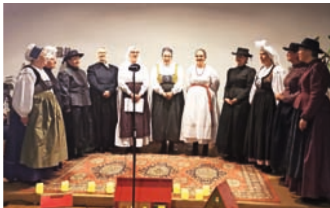
Bodeče neže

Bodeče neže smo v minulem letu praznovali 30-letnico delovanja s koncertom Na hribčku je moj dom. Letos pa smo, kot se pesem nadaljuje, letni koncert poimenovali Le pridi na moj dom. In koga drugega naj bi povabile k skupnemu prepevanju, če ne Ozarine moške pevce, Kranjske furmane? Fur-