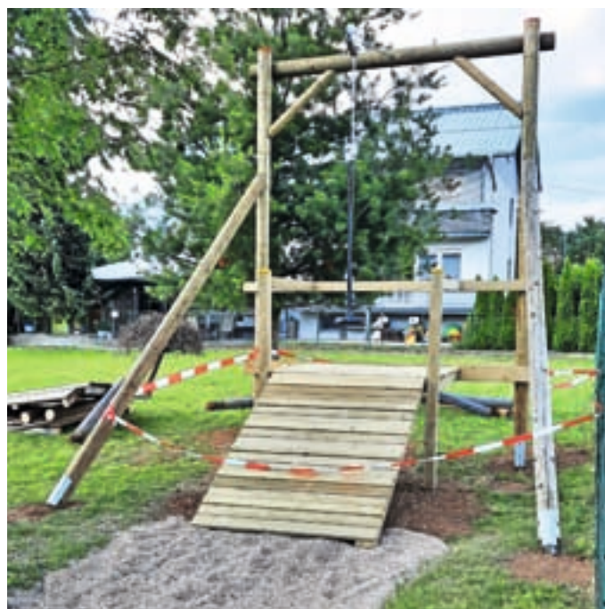
Ob zaključku del

Postavitev t. i. ziplina pri podružnični šoli na Primskovem je zaključena, v soboto, 17. junija, je bila napeljana še jeklenica s sedežem.