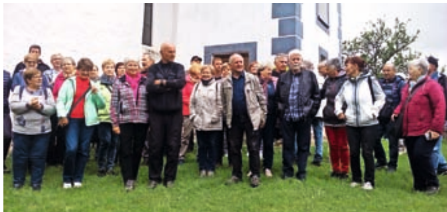
Udeleženci izleta

Najprej smo si ogledali spominsko zbirko Toneta Pavčka v Šentjurju pri Mirni Peči. Bil je pesnik, esejist in prevajalec. Ogledali smo si zbirko in se seznanili z njegovim obsežnim delom. Nadaljevali smo proti