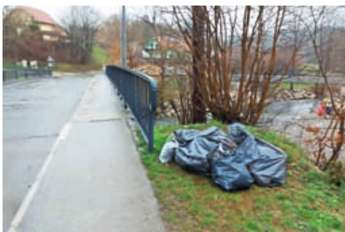
Vreče zbranih odpadkov na sprehajalni poti