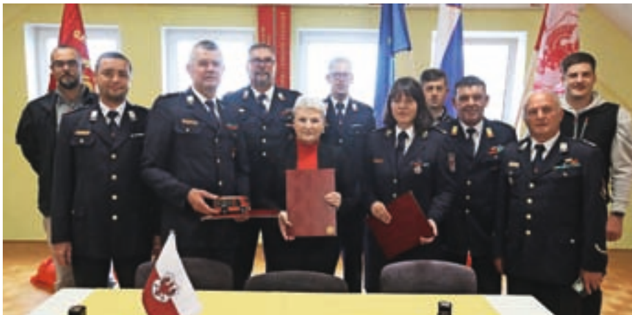
Ob podpisu pogodbe za nakup novega gasilskega vozila v prostorih PGD Kranj Primskovo

Marec, ko smo zadnjič oddajali prispevek za Stike, ni tako daleč. Tako rekoč nedavno, a za prostovoljne člane društva je bilo to zelo lepo obdobje. Maja smo namreč podpisali pogodbo za nakup novega gasilskega vozila, gasilske cisterne GVC-1. Zelo smo bili veseli, ko smo kmalu po odprtju novega gasilskega doma od javnega zavoda Gasilsko reševalne službe (GARS) Kranj prevzeli rabljeno gasilsko cisterno. Veliko let nam je tovornjak odlično služil, a smo bili po 28 letih raznih akcij, še posebej po zadnji ob gašenju požara na Potoški gori, primorani razmišljati še v drugo, konkretno smer. Vodstvo Mestne občine (MO) Kranj, Gasilska zveza (GZ) MO Kranj, Civilna zaščita Kranj in GARS Kranj so sprevideli, da za konkretne in-