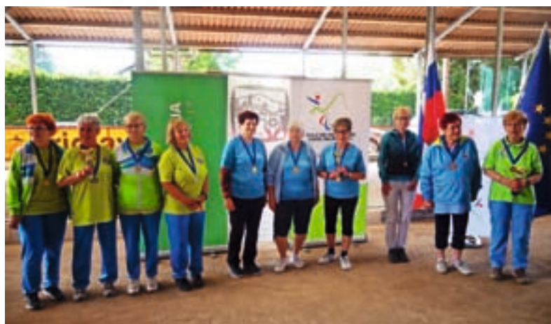
Osvojeni pokali za prva tri mesta, Kranjčanke so levo

Pri izvajanju programov ne ločujejo invalidov glede na kategorijo invalidnosti in na prispevek občine, mora pa imeti stalno bivališče v eni od navedenih občin, ki jih pokriva MDI Kranj.