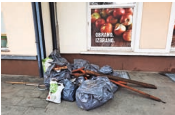
Vreče zbranih odpadkov pred Domom krajanov Primskovo

govini Mercator, ki so prizadevno očistili kletno stopnišče. »Tudi oni si prizadevajo, da bi bila okolica trgovine urejena in čista.«