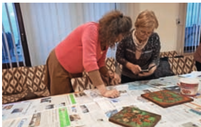
Na delavnici Ljudski ornamenti in tradicija poslikave na les

V Domu krajanov na Primskovem so letos v sodelovanju s KS Primskovo že izvedli delavnico Pomen zelišč in začimb v prehranski samooskrbi in pri varovanju našega zdravja pod vod-