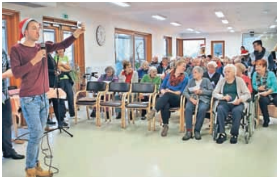
Mladi so se družili s starejšimi.