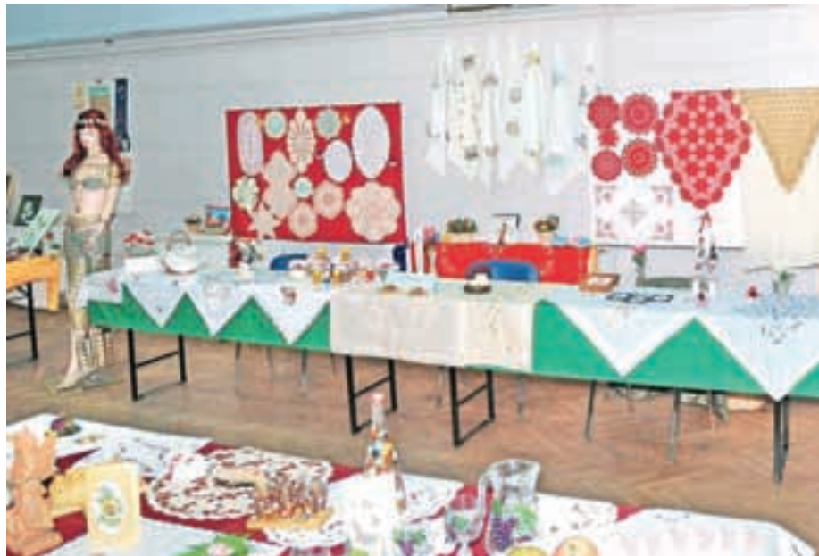
Izdelki pridnih rok

Da napolnimo avtobus, smo se dogovorili z DU Šenčur za skupno organizacijo. Še dve, tri leta nazaj je bilo za izlet toliko prijavnjav, da sta odpeljala dva avtobusa, danes pa je kriza zdesetkala naše vrste, naši člani so se postarali, mladi upokojenci pa se žal ne vključujejo v naše društvo. Vsak drugi torek v mesecu organiziramo merjenje krvnega tlaka, sladkorja in holesterola v krvi, ki ga brezplačno meri višja medicinska sestra iz Doma