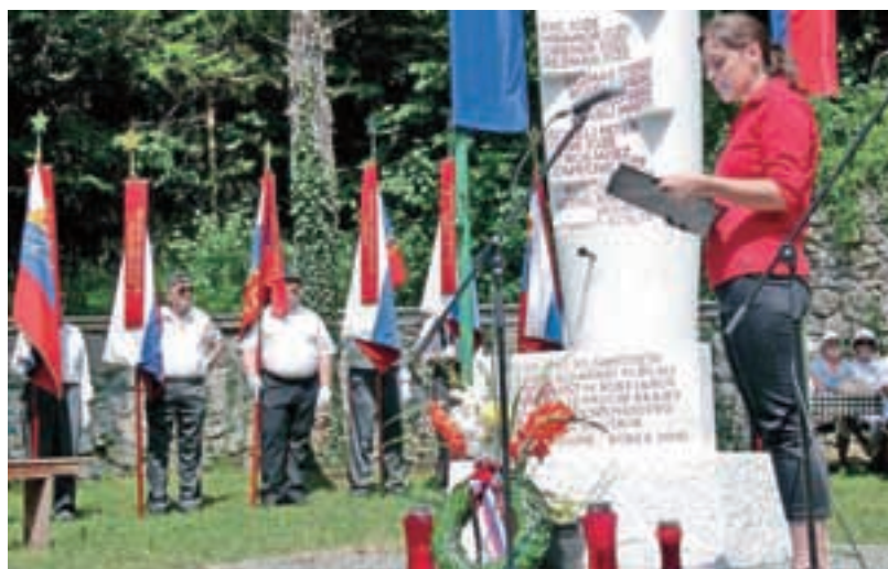
Z letošnje slovesnosti pri spomeniku v Kokri

Spomenik na Zgornji Beli je bil obnovljen leta 2008, obnova osrednjega spomenika v Kokri je potekala v letih 2012, 2013, 2014. Obnovili smo tudi spomenik oziroma okolico na pokopališču v Preddvoru, postavili novo ploščo Petru Šenku v Novi vasi. Obnova bolnice Košuta poteka že od leta 2010. Bolnico Košuta obiskujemo že od leta 2007, letos smo opravili že deveti pohod, v tem obdobju jo je obiskalo več kot 700 pohodnikov. V letu 2008 smo ustanovili pevski zbor Kokrški odred, ki danes šteje 14 članic in članov. Letos je zbor nastopil že na devetih prireditvah, zadnji nastop je bil 29. novembra v spominskem