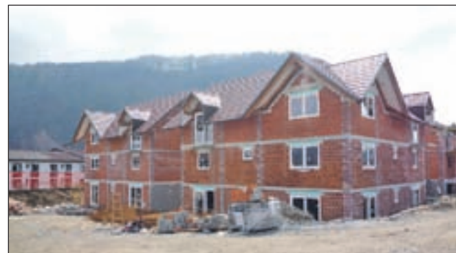
Stanovanja bodo vseljiva predvidoma septembra letos.

Gradnja tridesetih oskrbovanih stanovanj, ki jih je zasebni investitor v neposredni bližini doma starejših občanov začel graditi septembra lani, poteka po načrtih. Štirje objekti so zgrajeni, v teh dneh pa delavci že napeljujejo vse potrebne instalacije. Maja bodo javnosti predstavili prvo vzorčno opremljeno stanovanje, da si bodo kupci lažje predstavljali, kakšna je oprema, prilagojena starejšim in gibalno oviranim osebam. Zanimanje za nakup je sicer precejšnje, saj je rezerviranih že tretjina vseh stanovanj, ki bodo vseljiva jeseni, ko se bo gradnja skupaj z urejanjem okolice tudi zaključila. J. P.