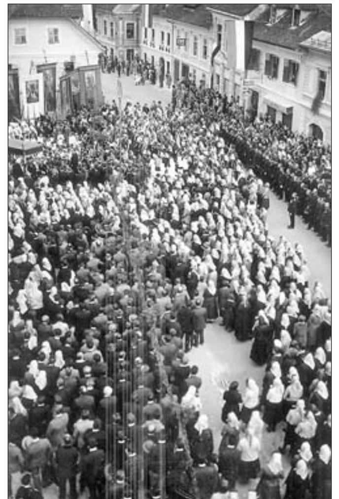
Odkritje spominske plošče Rudolfu Maistru na Šutni leta 1938