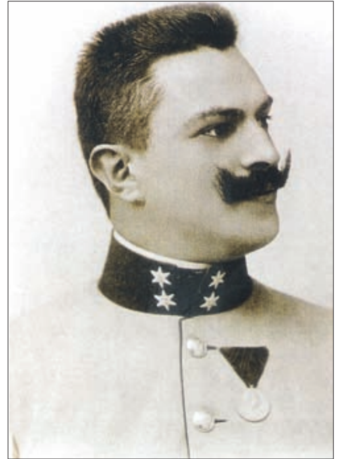
Rudolf Maister leta 1901