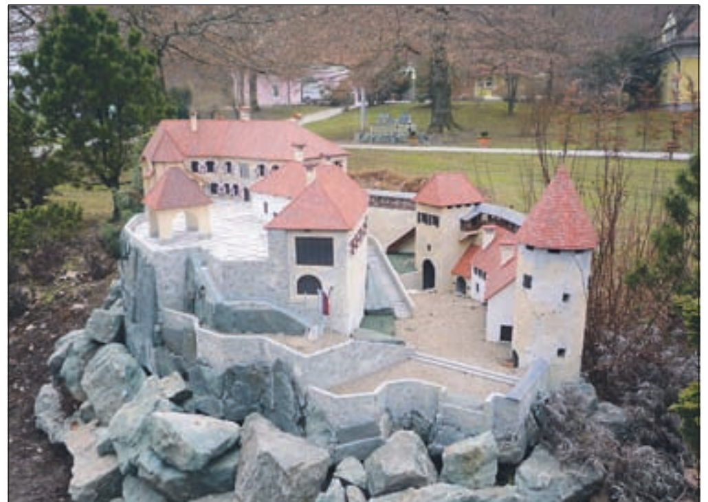
Maketa Blejskega gradu in druge miniature Minimundusa bodo na ogled do 6. aprila.

Volčji Potok - Tulipani in narcise še niso zacveteli, so pa zato park Arboretuma v teh dneh popestrile miniature Minimundusa, ki v Volčjem Potoku gostuje že nekaj let zapored. Na ogled je nekaj zanimivih maket stavb, ki so v svojem naravnem okolju prave turistične zanimivosti - stara mestna hiša v Pragi, sinagoga iz Gradca, portugalski stolp Belem, majhna vasica San Andres Xecul iz Gvatemale, OMV rafinerija iz Avstrije in mnoge druge. Pri