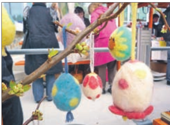
Velikonočni pirhi so lahko izdelani iz različnih materialov.