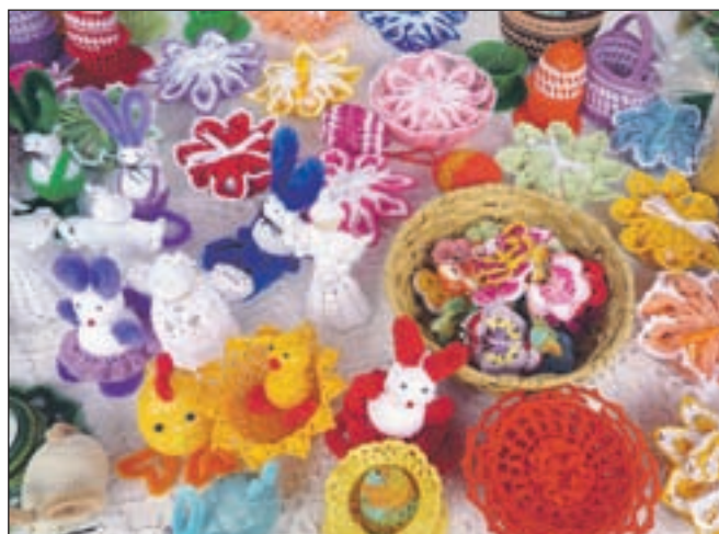
Izdelki Dragice Jagodic iz Srednje vasi