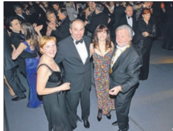
Utrinek z lanskoletnega Županovega plesa

"V tem hipu niti ne vem, koliko kandidatov že je, koliko jih bo, pojavljajo se različna imena. Ko bo čas, verjetno v drugem krogu, bom podprl tistega, ki bo moje dobro zastavljene aktivnosti in vsebine znal tudi pravilno nadaljevati in to na vseh področjih, predvsem pa v smislu celovitega in enakomerne razvoja občine. Podprl bom tistega, ki bo znal priznati, da v Kamniku v šestnajstih letih ni bilo vse slabo. Če me bo novi župan potreboval za nasvet in pomoč, mu bom z veseljem pomagal, če bo le pravi človek."