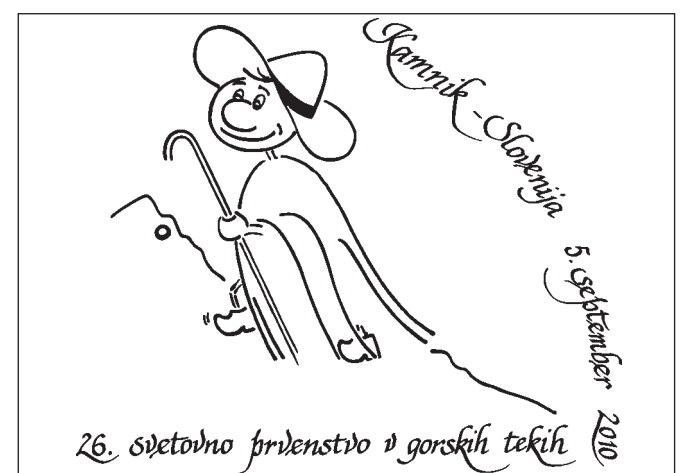
Za logotip svetovnega prvenstva v gorskih tekih, ki bo 5. septembra potekalo v Kamniku, so izbrali pastirja z Velike planine.

zaključek prvenstva bosta na Glavnem trgu v Kamniku, izbran pa je tudi uradni logotip, ki ga predstavlja pastir z Velike planine.