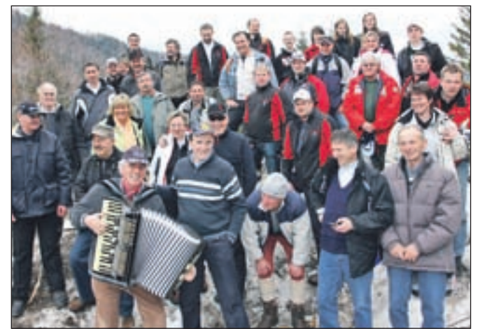
Na svetovnem prvenstvu v Planici so navijali tudi člani Športnega društva Podgorje.