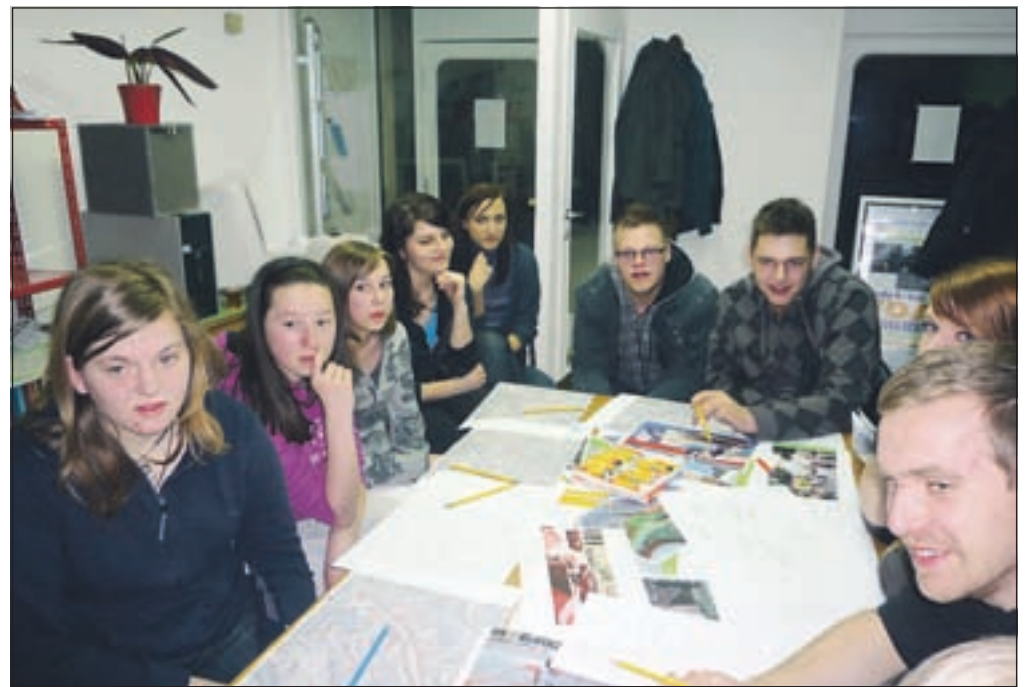
Svoje ideje, kako z urbano opremo oživiti Šutno in nanjo privabiti čim več mladih, bodo udeleženci projekta že kmalu predstavili tudi s konkretnimi izdelki.

Kamnik - Člani Kulturnega društva Priden možic (KDPM) in Skupine Štajn so po lanskem Kamfestu ponovno združili moči in tokrat pripravili skupen projekt Šutna - dnevna soba Kamnik, ki je sofinanciran s strani evropskega programa Mladi v akciji. K sodelovanju so povabili mlade iz OŠ Toma Brejca, OŠ Frana Albrehta, ŠCRM in Cirusa, projekt, ki bo sicer trajal vse do jeseni, pa so pred dnevi začeli z delavnico, na kateri so mladim predstavili lokalno politiko, problematiko oživljanja mestnih središč in možnosti, ki jih imajo pri tem mladi. "Cilj naše pobude je zainteresiranim mladim dati možnost, da spoznajo lokalno politiko, problematiko oživljanja starega mestnega jedra in aktivno sodelujejo pri podajanju predlogov rešitev in realizaciji le-teh. Rezultat projekta bo urbana infrastruktura, ki jo bodo mladi izdelali sami in s katero bomo opremili Šutno. Zamislili smo si namreč zelo konstruktiven predlog, kako bi Šutno vsaj malce približali tako mladim, kot tudi drugim prebivalcem in obiskovalcem Kamnika, preden pa ga realiziramo, pa bi radi slišali mnenja čim več mladih, ki svoj