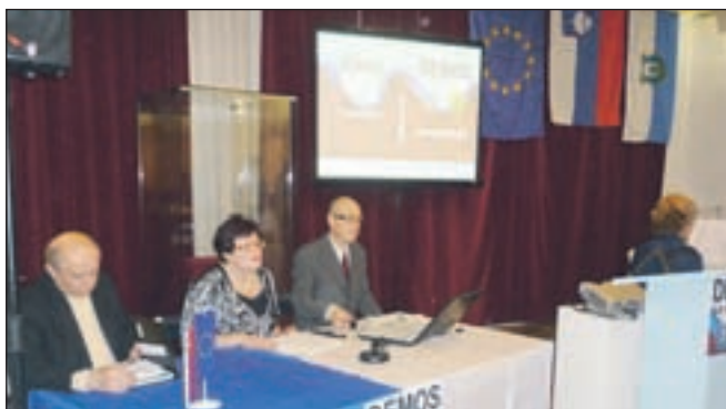
Zbornik bodo v prihodnjih dneh predstavili tudi v Komendi.