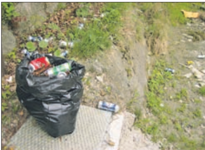
Cilj akcije je pobrati več kot 20 tisoč ton odpadkov.

Dodana vrednost akcije Očistimo Slovenijo v enem dnevu je popis črnih odlagališč in njihova sanacija, s čimer si organizatorji želijo dvigniti zavest občanov, naj odpadkov ne odlagajo v naravo in naj takšna odlagališča, če nanje naletijo, prijavijo. Občina Kamnik ima v letošnjem proračunu za čiščenje divjih odlagališč namenjenih 9.500 evrov, 600 evrov za odvoz opuščenih avtomobilov in 7000 evrov za organizacijo ekološkega ozaveščanja in ekoloških aktivnosti.