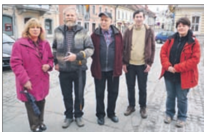
Udeleženci nedeljskega ogleda vodnih virov v dolini Kamniške Bistrice

lini, za katere še ne skrbi koncesionar, analize pa so pokazale, da voda v njih ni kakovostna.