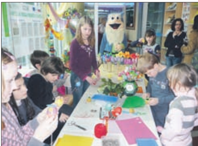
Otroška velikonočna delavnica v Termah Snovik