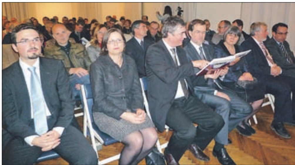
Predstavitve zbornika sta se udeležila tudi evropska poslanca Milan Zver in Lojze Peterle.