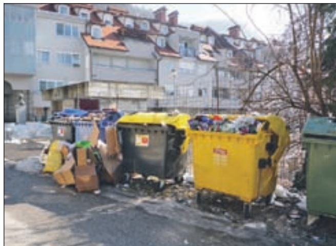
Čistilni akciji se bodo pridružila društva po vsej občini.