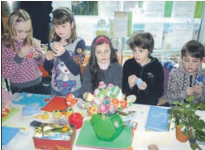
Mladi so pirhe okraševali z različnimi tehnikami.

Osnovna šola Šmartno v Tuhinju je v okviru velikonočnega sejma v Termah Snovik pripravila ustvarjalno delavnico za najmlajše. Kot je povedala Zdenka Potnik, učiteljica iz Podružnične šole Zgornji Tuhinj, je delavnica, na kateri so otroci z različnimi tehnikami krasili plastična jajca, vsako leto zelo obiskana, zato jo bodo v istem času zagotovo ponovili tudi prihodnje leto. Učencem iz domače osnovne šole so se pri ustvarjanju pridružili tudi najmlajši obiskovalci term. J. P.