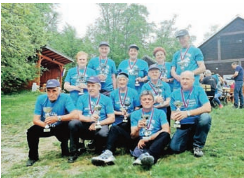
Pohodniki, ki so bili v enem letu več kot tristokrat na Štefanji gori