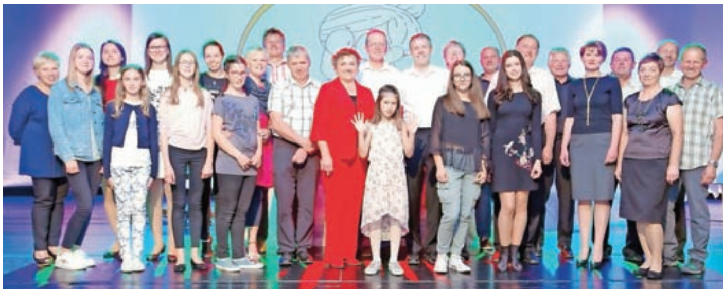
Nastopajoči na prireditvi