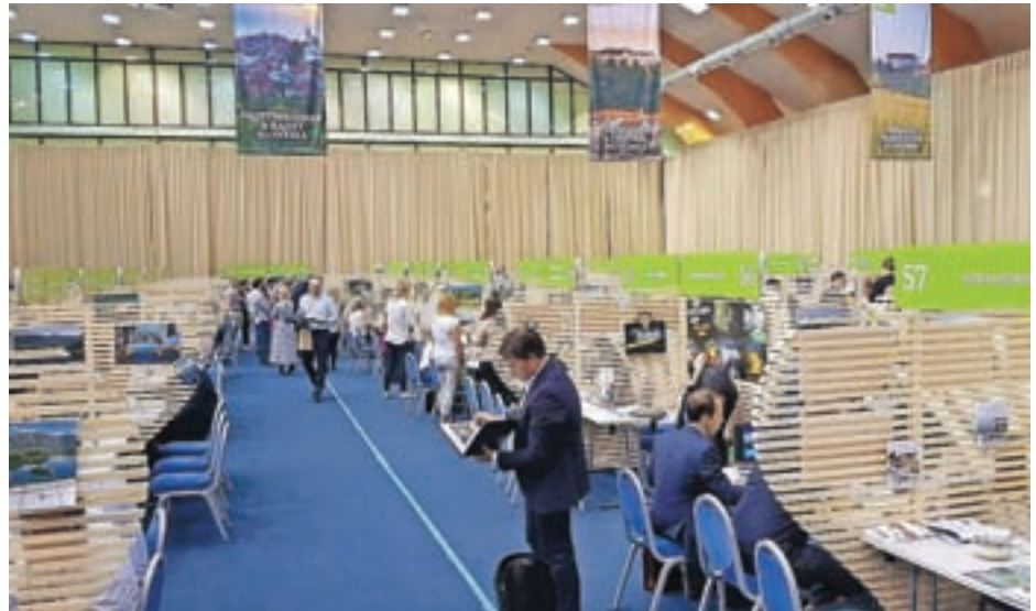
Mednarodne turistične borze se je udeležilo okoli dvesto turističnih agencij s celega sveta.

V Zavodu za Turizem smo aktivno začeli tudi digitalno promocijo in aktivno delovanje na družbenih omrežjih. Največ aktivnosti je usmerjenih v Messenger, Facebook in Instagram. Preko Messenger bota smo za naše nove in seveda zveste sledilce pripravili nagradni kviz. Svoje znamenitosti in aktivnosti smo predstavili tudi na Čarobni simfoniji,