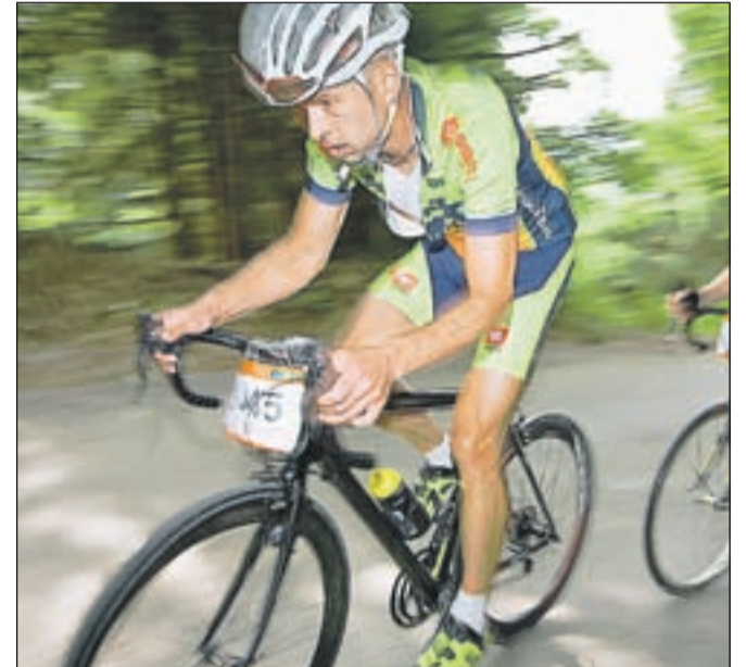
Vzpon na Jošt

Proga Maratona Franja BTC City poteka od starta v BTC Cityju levo na Šmartinsko cesto, zavije levo na Kajuhovo, nadaljuje po Zaloški, Litijški in Poljanski cesti čez Zmajski most mimo kavarne Evropa na Slovensko cesto. Prva kontrolna točka malega in velikega maratona je na Zmajskem mostu. S Slovenske ceste zavijemo na Aškerčevo in naprej po Tržaški cesti. Trasa se nadaljuje po Tržaški cesti do Brezovice, kjer je uradni start maratona (pri podjetju Prigo). Nato pot nadaljujemo do Vrhničke, naprej čez vrhniški klanec do Logatca in Kalc, kjer zavijemo desno proti Godoviču. Iz Godoviča se spustimo proti Idriji in Želinu. V Želinu zavijemo desno na cesto proti Cerknemu, kjer je na glavnem trgu okrepčevalnica. Sledi glavni vzpon na maratonu - vzpon na Kladje. Na Kladju je naslednja okrepčevalna postaja. Pot se nato spusti do Trebije. V Trebiji zavijemo levo proti Gorenji vasi. Pred občinsko stavbo v Gorenji vasi je naslednja okrepčevalna postaja. Nadaljujemo proti Škofji Loki. Na vrhu klanca v Škofji Loki je okrepčevalna