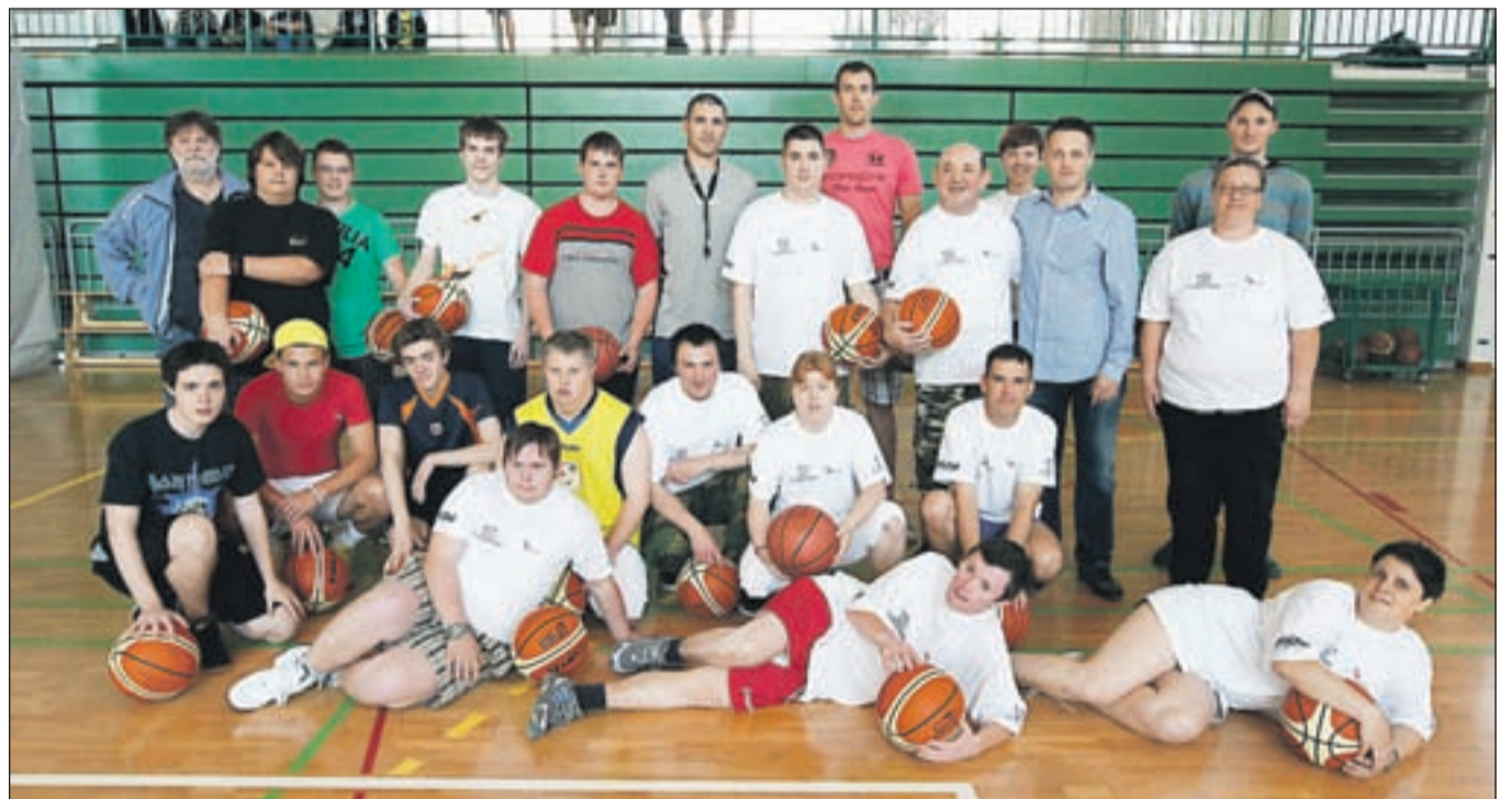
Projekt Košarka je življenje so z navdušenjem sprejeli tudi varovanci VDC Kranj, ki so povedali, da radi igrajo košarko in se družijo, veseli pa so bili tudi obiska znanih košarkarjev, ki so jim na majskem treningu pokazali nekaj svojih spretnosti.