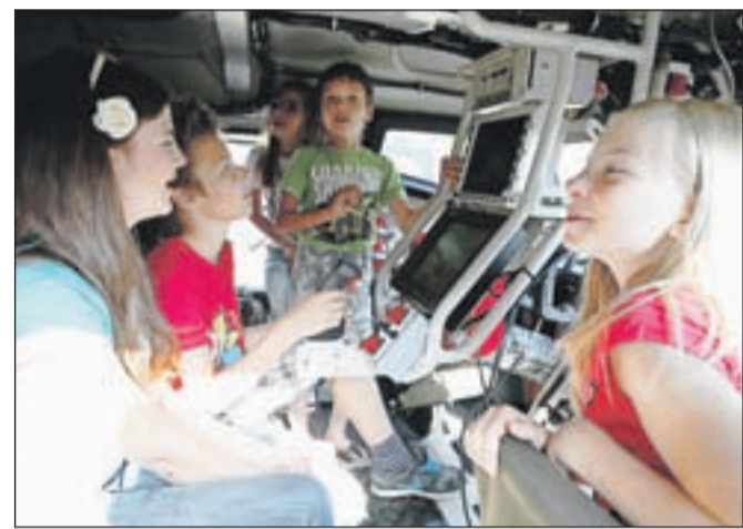
Nad sodobno vojaško tehnologijo so bili navdušeni zlasti otroci.