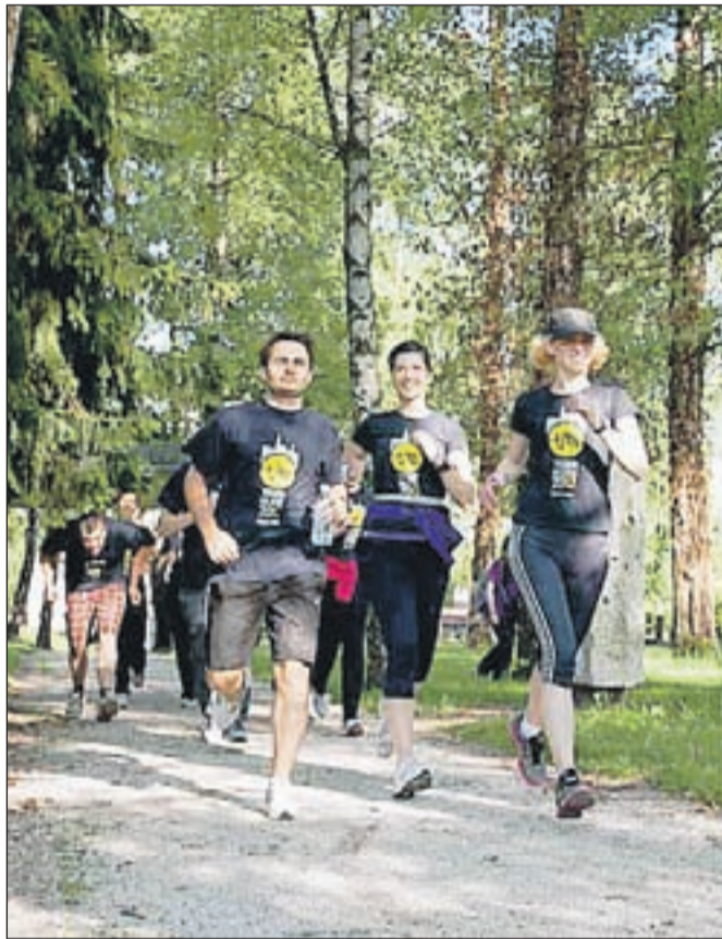
Tekaška sekcija