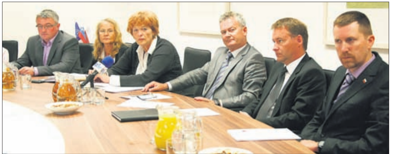
Člani občinske uprave so predlagane sklepe majske seje predstavili tudi na novinarski konferenci.

ter jo posreduje mestnemu svetu v potrditev. Svetniki so na majski seji sprejeli tudi spremenjen in dopolnjen odlok o občinskih taksah in odlok o prevozih z avtotaksijem. Izvedeli so marsikaj o delu Razvojnega centra informacijsko-komunikacijskih tehnologij na Laborah, govorili pa so tudi o obnovi kompleksa Khislstein oziroma poplačilu Vegrada, ki je v stečaju in s katerim so prekinili gradbeno pogodbo. Odločili so se, da bo občina začela sodni postopek za izplačilo 3,6 milijona bančne garancije, še prej pa bo pridobila mnenje resornega ministrstva.