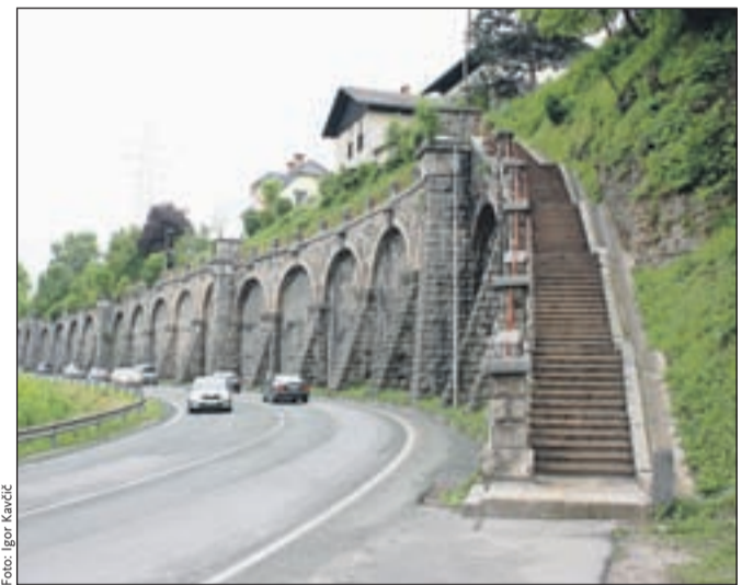
Gaštejski klanec s kamnitim opornim zidom še danes predstavlja prepoznaven arhitektonski element mesta Kranja.

Med Slavčevimi mojstrovini vsekakor izstopa Gaštejski klanec, ki ga je gradil med letoma 1936 in 1938 in s kamnitim opornim zidom še danes predstavlja prepoznaven arhitektonski element mesta Kranja. Tudi to je bil eden izmed razlogov, da je objekt že vpisan v register kulturne dediščine, kot je povedala Jesenko Filipičeva, pa je tudi že pripravljena potrebna strokovna podlaga za razglasitev Gaštejskega klanca za kulturni spome-