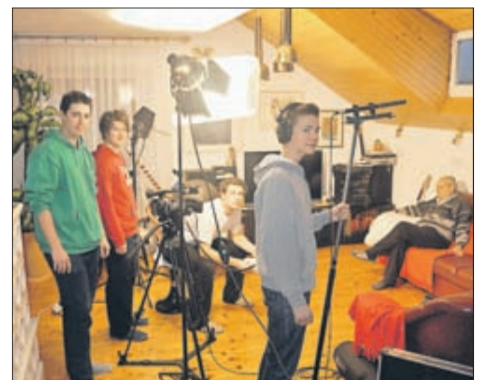
Dijaki med snemanjem intervjuja

http://www.memoriesatschool.eu/lang/sk http://www.kr.sik.si/aktualno/projekti/semas/