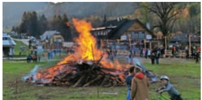
Kres v Kranjski Gori