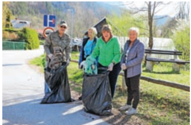
Srečali smo jih v Gozdu - Martuljku.