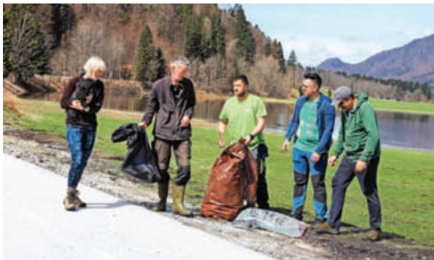
Da bo tudi okolje Ledin čisto ...