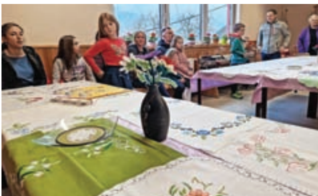
Na razstavi ročnih del v Podkorenu