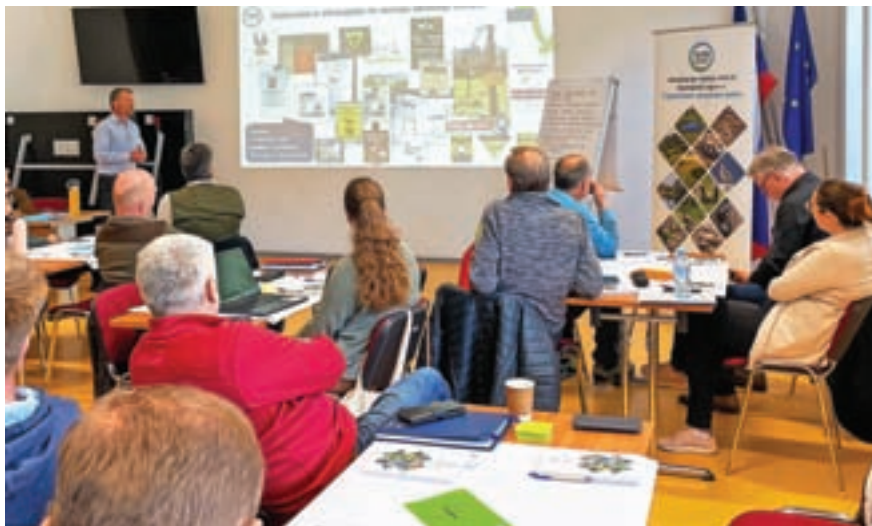
Zelo dober odziv na delavnici

Območje Vitranca je v zadnjih desetih letih doživelo veliko sprememb: začetek obnove stare žičnice in urejanje smučarske poti, hitra rast obiskovalcev, pojav podlubnikov v gozdovih ... Udeleženci delavnice so poudarili, da različne dejavnosti vplivajo na stanje narave, kakovost voda in gozdov, z ohranjanjem teh pa zagotavljamo tudi dobre pogoje za življenje v dolini. Različne dejavnosti je zato treba usmerjati na način, da je vpliv na živalske in rastlinske vrste ter gozdove čim