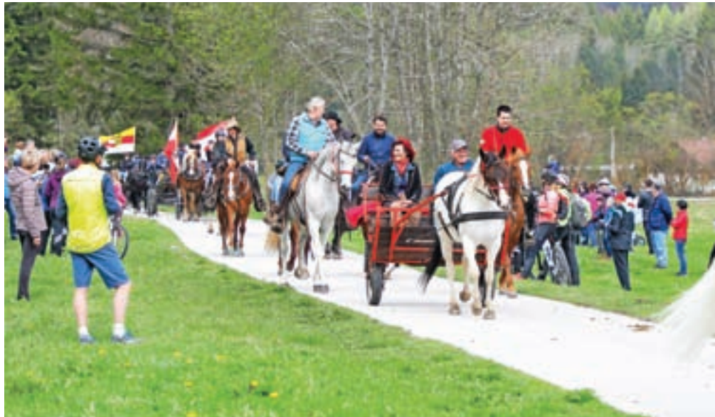
Naj se tradicija nadaljuje še mnogo let.