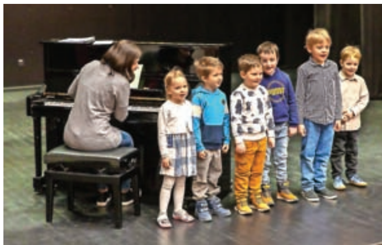
Nastop učencev predšolske glasbene vzgoje in glasbene pripravnice

Cepilni center Zdravstvenega doma (ZD) Jesenice bo imel v torek, 16. maja, med 8. in 15. uro dan odprtih vrat za cepljenje proti pnevmokoknim okužbam (brez predhodnega naročanja). Za starejše od 65 let in osebe s kroničnimi obolenji stroške cepljenja proti pnevmokoknim okužbam krije zavarovalnica. Za vse druge je cepljenje samoplačniško (33 evrov). S. K.