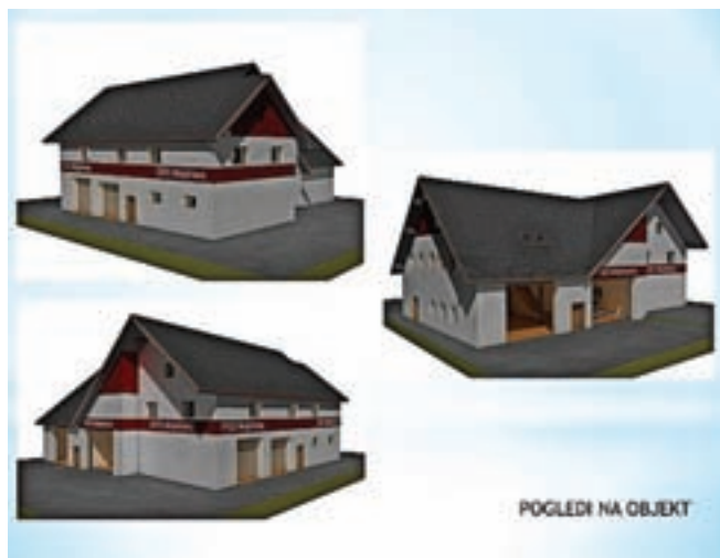
Projekt Doma reševalcev

»Oboji smo reševalci, zato bi bil to skupni Dom reševalcev,« je poudaril Iztok Arnol, Franci Zima pa dodal, da imajo tudi gasilci vse več dela, za kar je potrebne več opreme, prostor pa se tudi njim zmanjšuje. »Načrt za obstoječi gasilski dom je bil narejen leta 1950, gradili so ga od 1957 do 1963 in je tak ostal. Včasih je bilo notri 10, 15 oblek, zdaj ima vsak član po tri. Okrog 110 nas je vseh skupaj, od tega operativnih gasilcev od 25 do 35.« Potrebna bo tudi sanacija obstoječe stavbe z izolacijo in zamenjavo stavbnega pohištva.