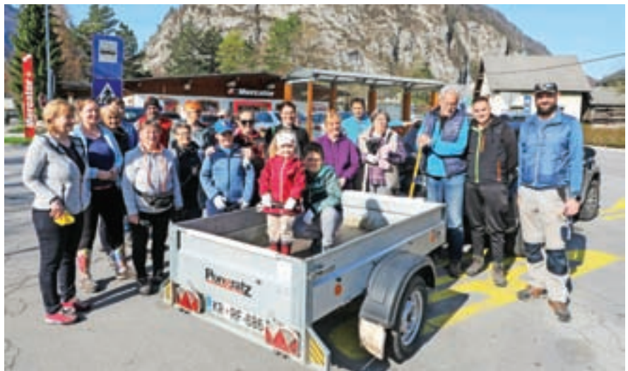
Zbor v Mojstrani, veliko udeležencev je bilo že na terenu drugje

V Triglavskem gaju v Mojstrani je z družino in člani društva, in letos ne prvič, čistila predsednica Turističnega