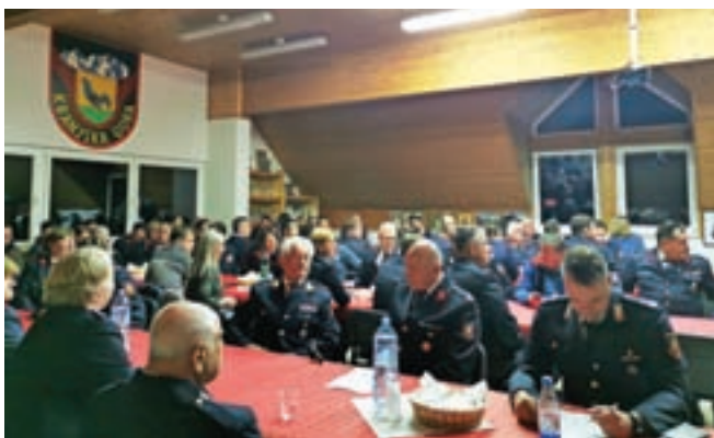
Občni zbor PGD Kranjska Gora