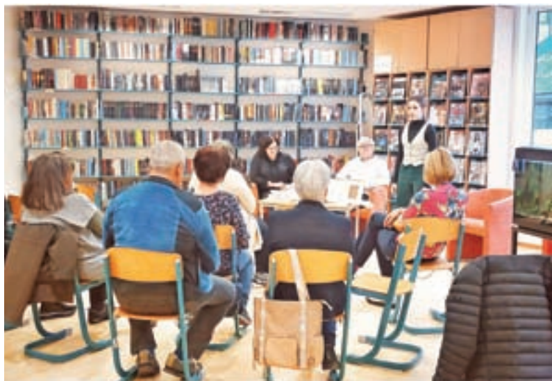
Predstavitve pesniške zbirke v kranjskogorski knjižnici