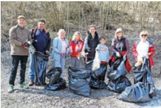
V Kranjski Gori je ena skupina odstranila »šjavke« pod smučiščem.

»TD Kranjska Gora je letos že imelo eno čistilno akcijo, za naprej pa predlagamo, da se pridružimo županijini pobudi