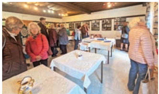
Na razstavi ročnih del na Dovjem