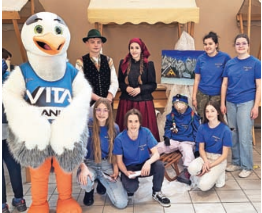
Nagrajeni turistični podmladek