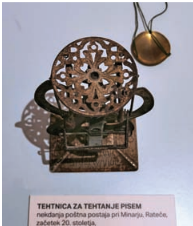
TEHTNICA ZA TEHTANJE PISEM nekdanja poštna postaja pri Minarju, Rateče, začetek 20. stoletja.