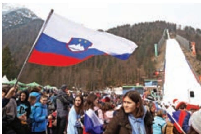
Poleti v Planici so znova privabili številne navijače.

In komaj dobro je padel zastor pod uspešno izvedbo letošnjega tekmovanja, je iz Smučarske zveze Slovenije prišla informacija, da so vložili kandidaturo za FIS svetovno pr-