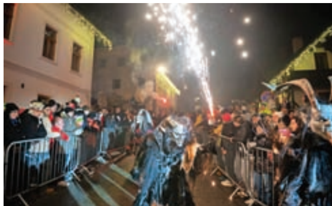
Prišlo je več kot 30 skupin in več kot 550 parkeljnov, kar je rekord v Podkorenu.