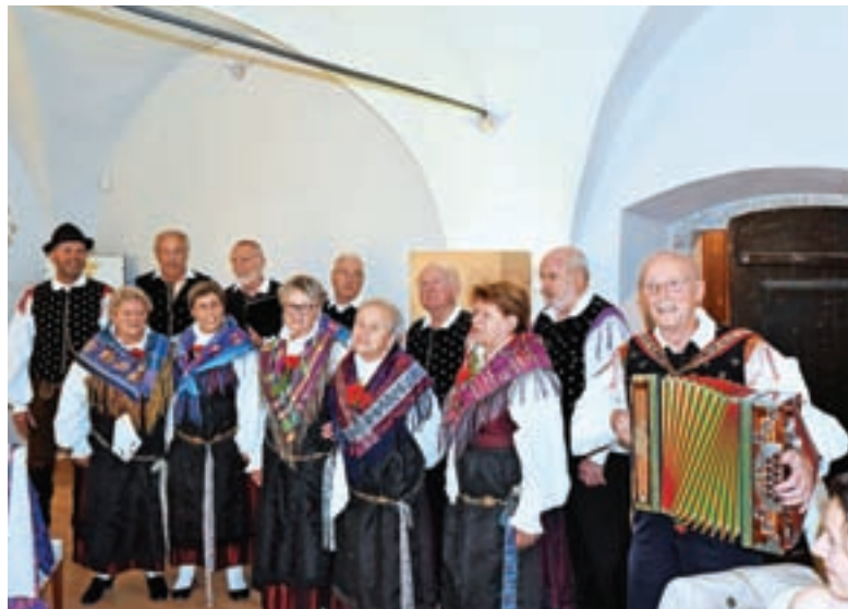
V Tavčarjevem dvorcu so zapeli priznanim kardiologom, ki delajo doma in v tujini. Mariskomu se je orosilo oko.

Dodala je še: »Najlepše darilo za naše delo je, če občutimo, da s pesmijo polepšamo dan. Prav zato se že pripravljamo na koncerte božičnih pesmi. Kot vsako leto bomo peli v cerkvah po mašah; v Podkorenu 27. decembra, v Kranjski Gori 28. decembra in 29. decembra v Ratečah. Ne bomo pa pozabili tudi na naše starostnike v domu Viharnik in dr. Franceta Bergelja. Skupaj bomo doživeli čarobnost božičnih in novoletnih praznikov.«