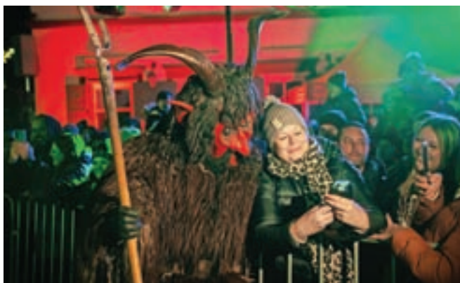
Nekateri so pa pogumni. / Foto: Primož Pičulin