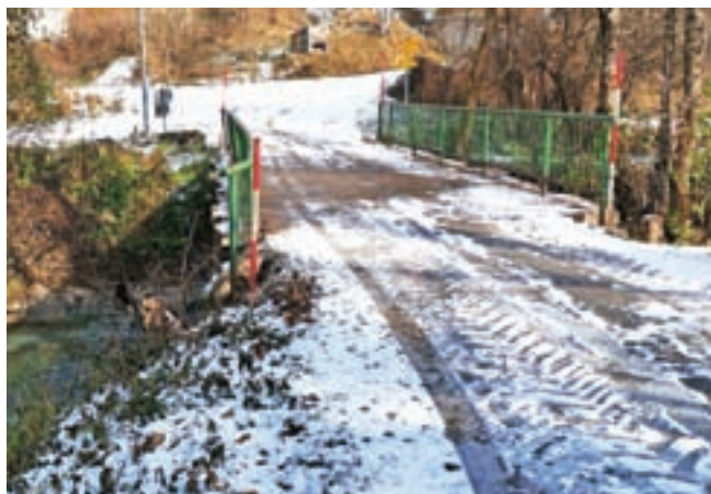
Obnovljen bo tudi most v Bezju v Kranjski Gori.