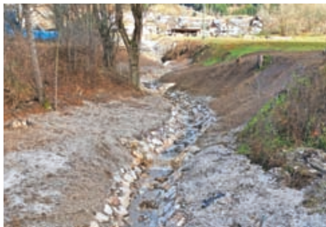
Urejena je brežina struge Dovškega potoka z obložitvijo kamnov.