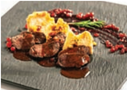
Jelenova tagliata v brusnični omaki v družbi domačega sirovega štruklja

lokalnih sestavin. Vključuje divjačino jelena gorenjskih gozdov, brusnice v omaki, ki so gozdno sadje, tipično za naše kraje, in jedi dodajo blago sladke poseben okus. Domači sirov štrukelj, v katerem je skuta lokalnega kmeta, pa nežno dopolni jed.»