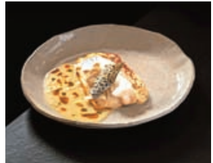
Parjen postrvji file

ajdove raviole s skuto in suho tepko, parjen postrvji file in slivove cmoke. Za predstavitev so izbrali parjen postrvji file. »Ob njem ponudimo zažgan pire gomoljne zelene, fermentiran koromač in masleno omako. Brbončice gostov navdušimo z lahko jedjo, avtohtona jezerska postrv je zvezda krožnika, ki jo v različnih letnih časih dopolnjujejo izbrane sestavine. Celoto krožnika zaokrožuje serviranje jedi, saj jo ponudimo na ročno izdelanem keramičnem krožniku lokalnega oblikovalca.«