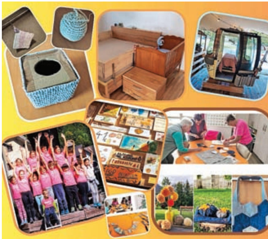
Kolaž izdelkov

Občina Kranjska Gora svoje občane že vrsto let spodbuja k vračanju k naravi, povečani samooskrbi ter premišljene- mu ravnanju z naravnimi viri. Letošnji projekt Nazaj k naravi, ki ga izvajajo v Razvojni agenciji Zgornje Gorenjske (Ragor), poteka pod sloganom Varujmo – varčujmo. »V sklopu projekta smo izvedli praktično delavnico izdelave repelenta ter spletno predavanje na temo fermentiranja domačih pridelkov. Od poletja do jeseni pa je potekal natečaj uporabe, popravila oz. recikliranja obstoječega izdelka ali materiala. V natečaju sta sodelovali dve skupini, gasilski podmladek iz Podkorena ter stanovalke Doma Viharnik in trije posamezniki,« je povedala Martina Hribar Brus, sodelavka Ragorja. Pojasnila je še: »Številna ekipa gasilskega podmladka je iz ostankov lesa izdelala različne jesenske dekoracije, stanovalke Doma Viharnik so 'oživile' zgoščence v ogrlice, staro volno v šopke, iztrošene kavbojke v torbice ter renovirale star okvir za fotografijo. Nadvse izvirni so bili tudi vsi sodelujoči posamezniki. Mlada starša sta v projektu Oliver izboljšala in dodelala pohištvo, uporab-