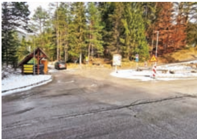
Obnavljajo cesto v Naselju Ivana Krivca v Jasni. Dela so prekinile slabe vremenske razmere, nadaljevala se bodo v prihodnjem letu.

Koledarsko leto se zaključuje, navajamo še nekaj investicij, ki so že zaključene ali pa so v teku, kot sta gradnja vodohrana Srednji Vrh in sanacija Dovškega pritoka.