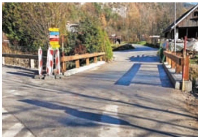
Končana je sanacija mostu Korzika v Gozdu - Martuljku.