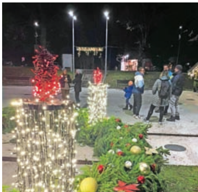
Praznična krasitev v Mojstrani

Na zadnji dan v tem letu bo na Trgu olimpijcev silvestrovanje. Začelo se bo ob 20. uri s prihodom dedka Mraza, na-