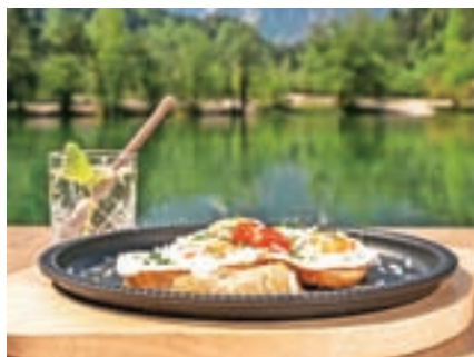
Alpski zajtrk z razgledom

Jasna Chalet Resort je certifikat prejela za Alpski zajtrk z razgledom. »Alpski zajtrk združuje avtentičnost lokalnih sestavin, kot so domača jajčca na bohinjski zaseki z naribanim kozjim sirom iz Rateč. Vrhunski okus dopolnjuje zdravilna gorska kreša, ki spremlja jed, ter svež domač kruh z drožmi, ki oživlja tradicijo naših babic. Ponosno poudarjamo uporabo lokalnih surovin in trajnostno izvedbo. Ob zajtrku lahko okusite tudi domačo šabeso, ki jo pripravljamo po tradicionalnih receptih.«