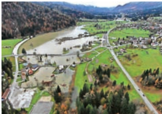
Razlilo se je jezero Ledine.

Poveljnik občinske CZ Blaž Lavtižar je izdal odredbo o izkopu kanala za odvod vode iz jezera Ledine, in sicer kot preventivni ukrep ter z namenom preprečevanja nadaljnje škode na objektih in cestni infrastrukturi. Gladino vode v