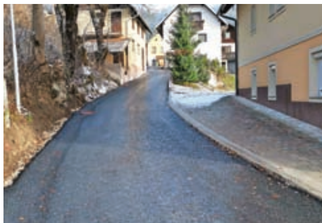
Obnovljena je občinska cesta za Rutom v Ratečah.