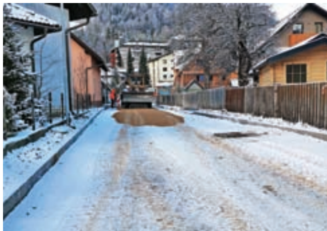
Sanacija Vitranške ceste v Kranjski Gori bo predvidoma končana v teh dneh. / Tekst: S. K., foto: Občina Kranjska Gora