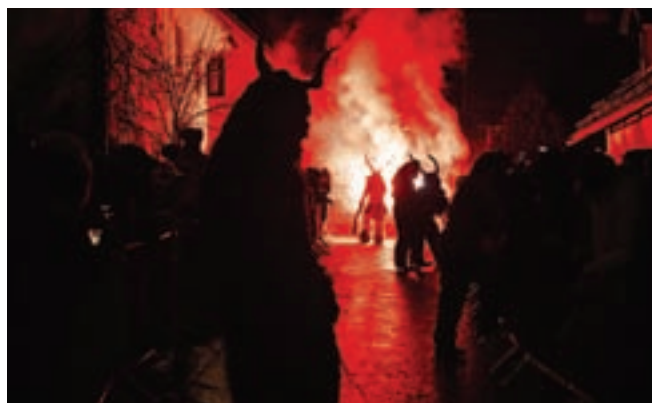
Resnično je bil pravi ognjeni spektakel.