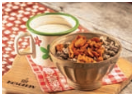
Ajdovi žganci z Angeličinim mlekom