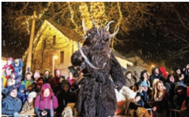
»Če ne boš priden, bodo parkeljni prišli in Trentar,« je ena od strašljivk tudi za današnje otroke.

Prijetno vzdušje se je nato preselilo v dvorano Vitranc v Kranjski Gori, kjer je bila zelo dobro obiskana tudi zabava s Petkovo pumpo in Mambo Kingsi.