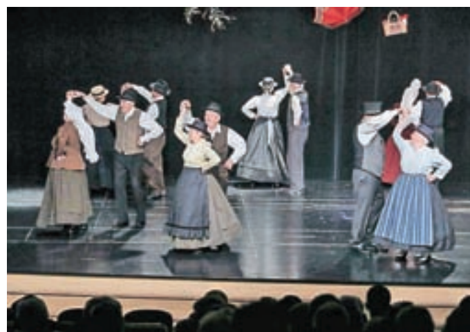
Cerkljanski folkloristi s plesom, petjem in glasbo ohranjajo kulturno dediščino prednikov.