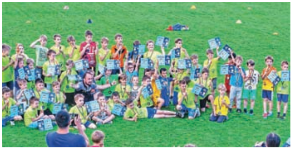
Mladi nogometaši so prejeli medalje in diplome.

Aprila je v Nogometnem klubu Velesovo Cerklje potekal redni občni zbor, ki je bil zaradi iztekajočega se mandata dotodanjega vodstva hkrati tudi volilni in na katerem so člani izvolili novo vodstvo, katerega naloga je predvsem ponovno vzpostaviti tekmovalno piramido od najmlajših selekcij do članske ekipe. S tem namenom je novo vodstvo zopet obudilo sodelovanje s sosednjim klubom iz Šenčurja, predvsem pri mlajših selekcijah, in sicer tako, kot sodelovanje potekalo že v preteklosti.