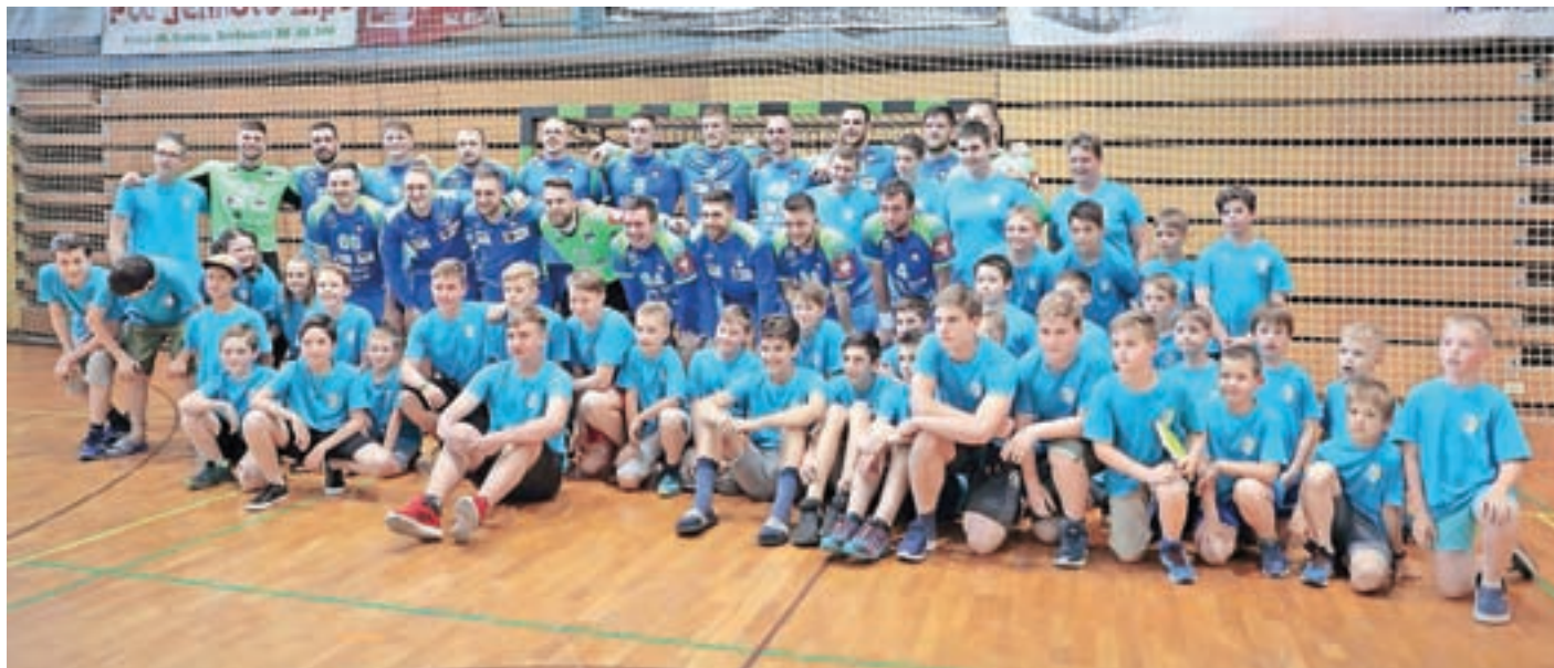
Cerkljanski rokometiški klub skupaj s slovenskimi reprezentanti

V Cerkljah so obletnico delovanja kluba kronali s prijateljsko tekmo reprezentanc Slovenije in Avstrije.