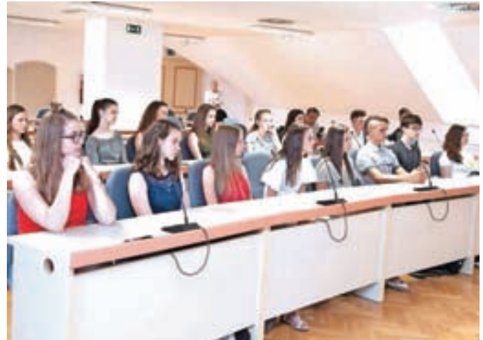
Letošnji najuspešnejši osnovnošolci na sprejemu pri županu