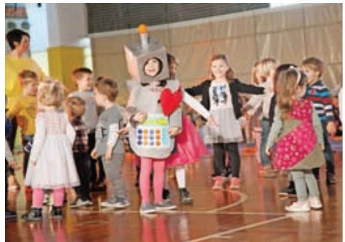
Pester program ob praznovanju petdesetletnice vrtca Murenčki

Leta 1972 so začeli gradnjo novega vrtca, ki je pod imenom Kurirček Robi v začetku leta 1973 sprejel šestdeset otrok, konec sedemdesetih let pa so en oddelek odprli tudi v podružnični enoti v Zalogu. Pomemben mejnik v zgodovini vrtca predstavlja tudi leto 2001, ko je občina zgradila sodobnim standardom prilagojen Vrtec Murenčki, poimenovan po pesniku Josipu Murnu. V