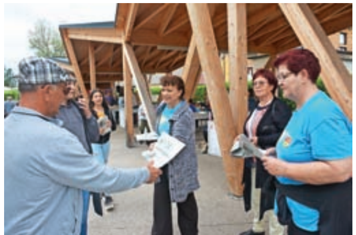
Medvoški prostovoljci so na Tržnici Medvode ob zaznamovanju Veselega dne prostovoljstva delili izvode časopisa Slovenske filantropije Skozinsko filantrop. Tovrstna akcija je potekala v 55 slovenskih krajih. M. B. / Foto: Maja Bertoncelj