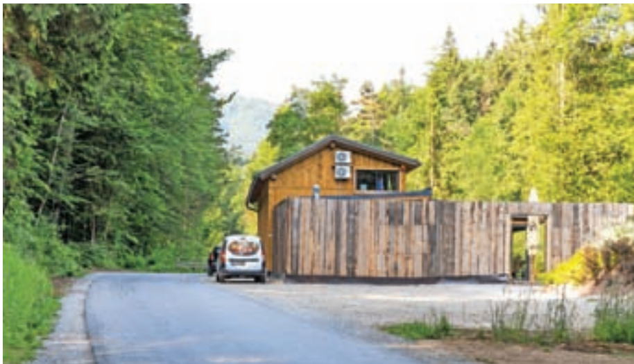
Ranč Maček je tik ob cesti med Presko in Studenčicami.

In kaj pravijo pristojne inšpekcijske službe? Z Inšpektorata Republike Slovenije za naravne vire in prostor smo 31. maja na naša vprašanja prejeli naslednji odgovor: »Gradbeni inšpektor je v inšpekcijskem postopku ugotovil, da investitor objekta na zemljišču s parc. št. 680/2, k. o. Preska,