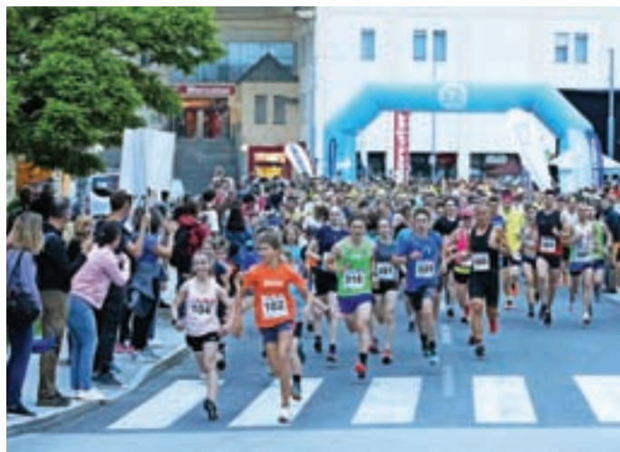
Vrhunec je bil 6. Nočni tek Medvode s tekom na pet in deset kilometrov.