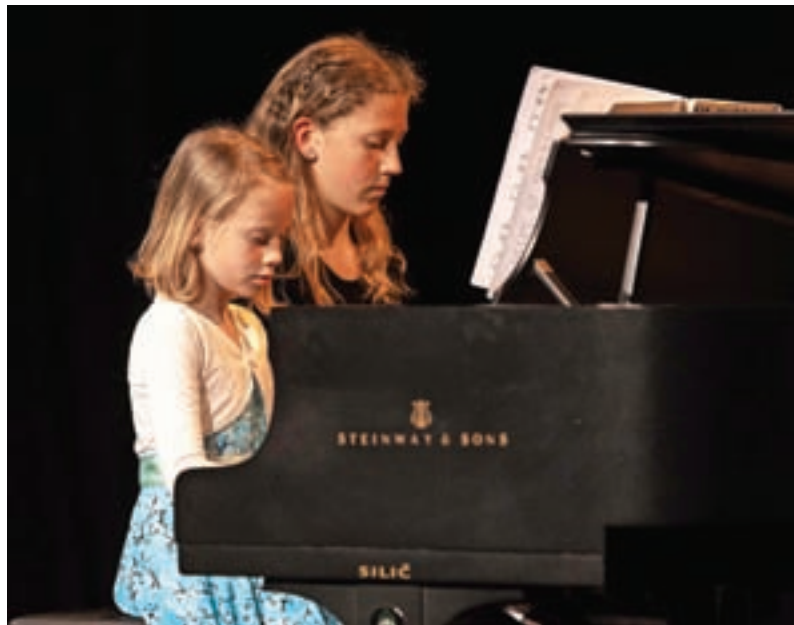
Na predstavitvenem nastopu so nastopili uspešni učenci medvoške podružnice Glasbene šole Franca Šturma.