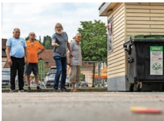
Udeleženci so se lahko preskusili v različnih športih, tudi v prstometu.