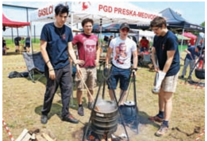
Letos so pred domom PGD Trata v Škofji Loki že tretjič organizirali Golažijado. V pripravi najboljšega golaža se je pomerilo 21 ekip. Kuhala je tudi ekipa PGD Preska - Medvode. A. B.