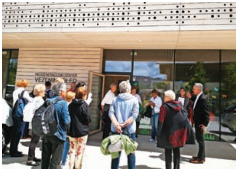
S posebnim zanimanjem so si ogledali Medgeneracijski center Vezenine Bled, center, kakršnega v Medvodah ni.

»Namen strokovne ekskurzije je bil, da čeprav si želimo in podpiramo oskrbo starejših ljudi v domačem okolju, hkrati želimo občane informirati tudi o drugih načinih oskrbe, ko ta v domačem okolju ni več mogoča. V Domu dr. Janka Bene-