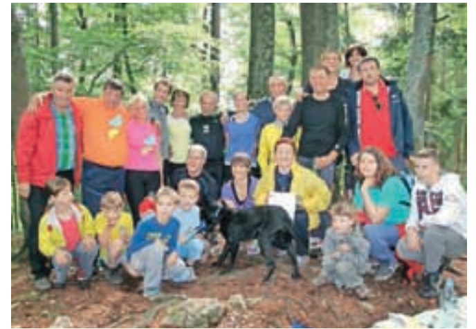
Udeleženci teka na vrhu Vovarja

Izmučene, a zadovoljne tekače so na vrhu z bučno podporo pozdravili zvesti navijači, ki so vse navzoče pogostili z dobrotami iz svojih nahrbtnikov. Po vpisu rezultatov v vpisno knjigo in skupinskem slikanju je sledilo druženje z razglasitvijo rezultatov in drugimi športnimi aktivnostmi.