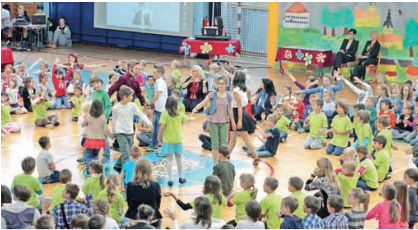
Učenci podružničnih šol iz Nevelj, Mekinj, Tunjic in Vranje Peči so polni energije in žara predstavili svoje majhne šole, ki poleg njih bogatijo tudi kraje same.

Osnovna šola Frana Albrehta je na matični šoli in svojih podružnicah v Tunjicah, Nevljah, Mekinjah in na Vranji Peči minuli konec tedna gostila petnajsti strokovni posvet učiteljev podružničnih šol Slovenije. »Majhnost je lahko tudi prednost, če le ni v glavah,« je poudaril župan Marjan Šarec.