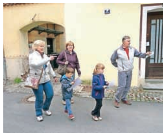
Tekmovanja so se udeležile tudi cele družine.