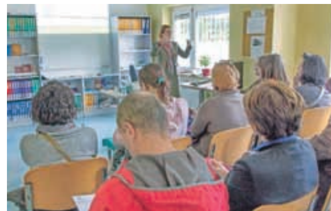
Na dnevu odprtih vrat Urada za delo Kamnik je vladalo veliko zanimanje.