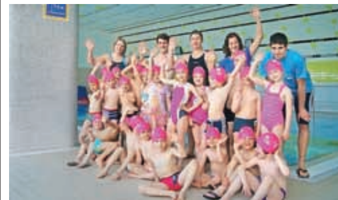
Otroci iz Vrta Zarja z vaditelji Plavalnega kluba Kamnik