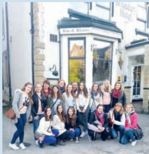
Bodoče kamniške vzgojiteljice so uživale pri delu v angleških vrtcih

»Za nas je bilo to nekaj čisto novega, nismo vedele, v kaj se podajamo. Na koncu nobeni ni žal, da smo se prijavile. Bila je neprecenljiva izkušnja, saj smo pridobile nova znanja, ki jih bomo lahko uporabljale kot bodoče vzgojiteljice. Opazile smo veliko razlik med slovenskimi in tujimi vrtci in šolami, nekatere dobre, nekatere slabe. Tudi ljudje so bili neverjetno prijazni. Ob tej priložnosti bi se rade zahvalile vsem, ki so se potrudili in nam omogočili to nepozabno izkušnjo.«