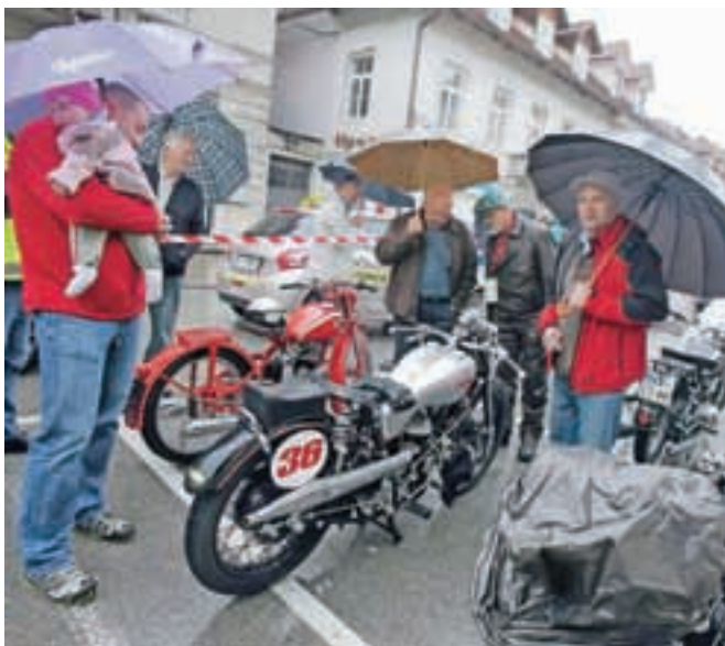
Številne poglede so pritegnili tudi starodobni motorji; najstarejši med njimi je bil izdelan leta 1909.

»Avtomobili so se rojevali in vozili tudi v dežju, tako da s tega vidika težav nimamo, je pa obisk vseeno nekoliko okrnjen. Med lastniki starodobnih avtomobilov jih je udeležbo odpovedalo petnajst, žal tudi najstarejši z letnico 1889 z Madžarske, ki se brez strehe po dežju pač ne more voziti. Med motoristi so udeležbo odpovedali le štirje, tako da so očitno pogumnejši od voznikov avtomobilov. Najstarejši motor danes tako nosi letnico 1909, najstarejši avto pa 1913. Dobra plat deževnega in hladnejšega vremena pa je ta, da je verjetnost, da kateri od jeklenih konjičkov kje zakuha, precej manjša,« je optimistično na dogodek,