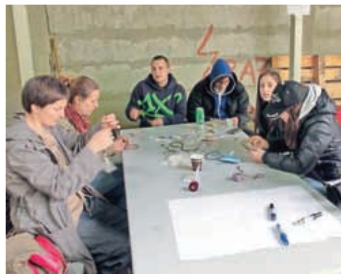
Že tradicionalni Pozdrav iz Kotla so letos mladi Kamničani začeli na KIKštarter vrtu z druženjem in delavnicami, nadaljevali v skejtparku in zaključili s koncerti v Kotlovnici.