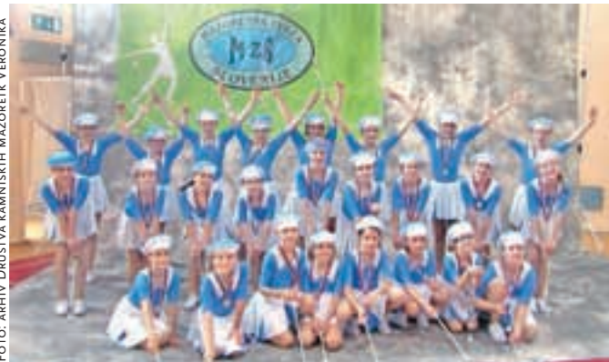
Kamniške mažoretke na državnem prvenstvu

Kamniške mažoretke so sredi maja uspešno nastopile na državnem prvenstvu, čez nekaj dni pa bodo s slavnostno prireditvijo obeležile že dvajsetletnico svojega delovanja.