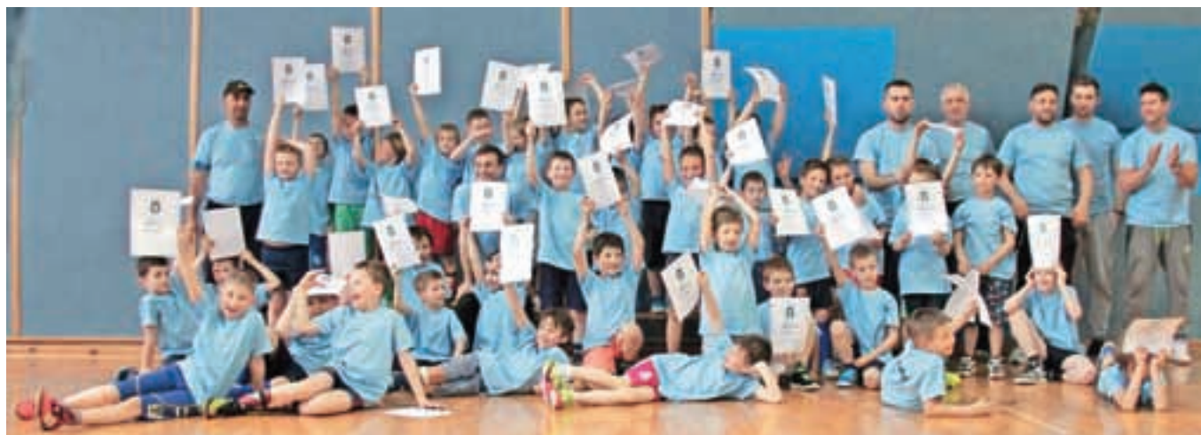
Najmlajši nogometnaši so bili za svoj trud nagajeni z diplomami.

trud nagajeni z diplomami. Na koncu je bilo največje zadovoljstvo, ko smo skozi vsoprireditve opazovali nasmejane in igrive otroke, zato se bomo v Otroški nogometni šoli in Nogometnem klubu Kamnik zavzemali za še več tovrstnih prireditev za nabodubne nogometnaše.