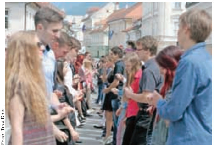
Maturanti so takole zaplesali tradicionalno četvorko.