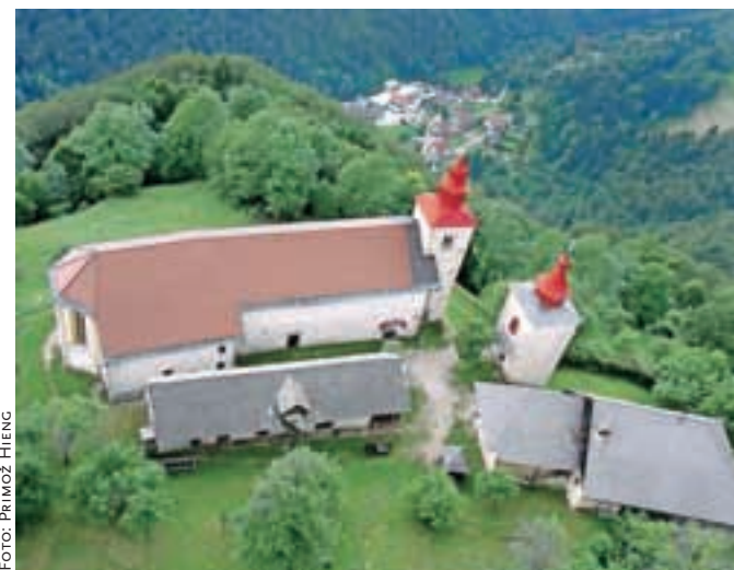
Kot med drugim lahko preberemo v vodniku, je energijsko izjemno močno tudi območje sv. Primoža nad Kamnikom.