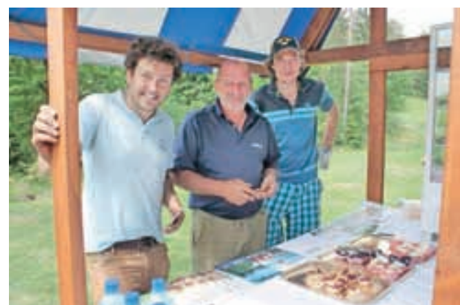
Mini kloštrske kremšnite in trničeve princeske so poskrbele za sladke nasmehe udeležencev turnirja.

V idiličnem okolju in s pogledom na Kamniško-Savinjske Alpe Golf Arboretum velja za enega najlepših golfskih igrišč pri nas, Okusi Kamnika pa so eden prvih regijskih kulinarčnih produktov v Sloveniji. Med drugimi obsegajo trnič, kamniško kajžerco, tuhinjsko filo ... Zanimiva je kloštrska kremšnita iz uršulinskega samostana, na turnirju pa ste lahko poskusili tudi Tarangelino trničovo princesko s trničem, vaniljevo kremo, ingverjem, oblito s čokolado in okrašeno z nariibanim trničem.