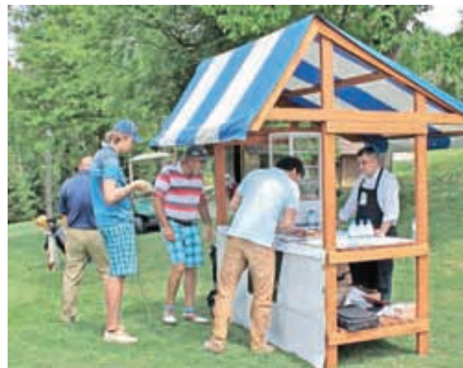
Udeleženci golfskega turnirja se ponudbe stojnic niso branili. Z veseljem so okušali ponujene dobrote.

Okuse Kamnika smo lahko tokrat okušali v Golf Arboretumu, kjer so tipične jedi Kamnika in okolice razvajale udeležence turnirja v golfu v okviru Festivala treh tulipanov.