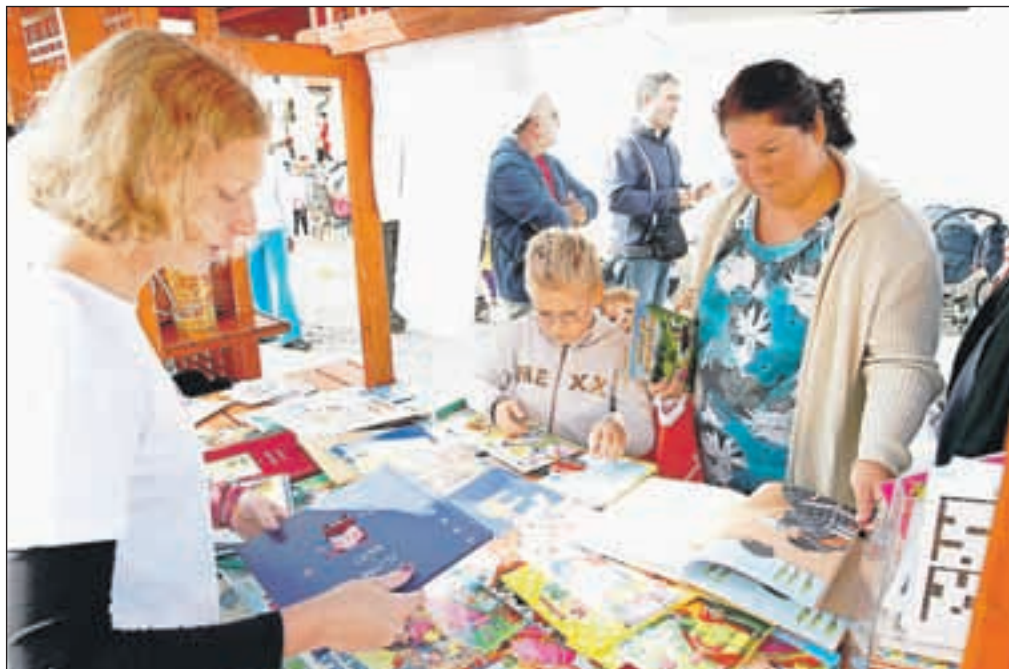
Otroci radi gledajo slikanice in berejo knjige, zato je bila dobrodošla tudi knjižna menjalnica, kjer so si otroci in straši lahko ogledali in tudi zamenjali knjige.

Tretja sobota v septembru je bila na Pungertu rezervirana za najmlajše, pa tudi njihove starše in vse, ki se radi zabavajo. Na koncu mesta smo lahko videli klovne, pravljčne junake, manjkali niso niti kapitan Glista, zobati Jack, Mojca, Kaličopko, čarovnik Grega in še kdo. Ogledali smo si lahko obnovljen stolp, ustvarjali v delavnicah, vse skupaj pa je že deveto leto potekalo pod imenom Živ-žav.