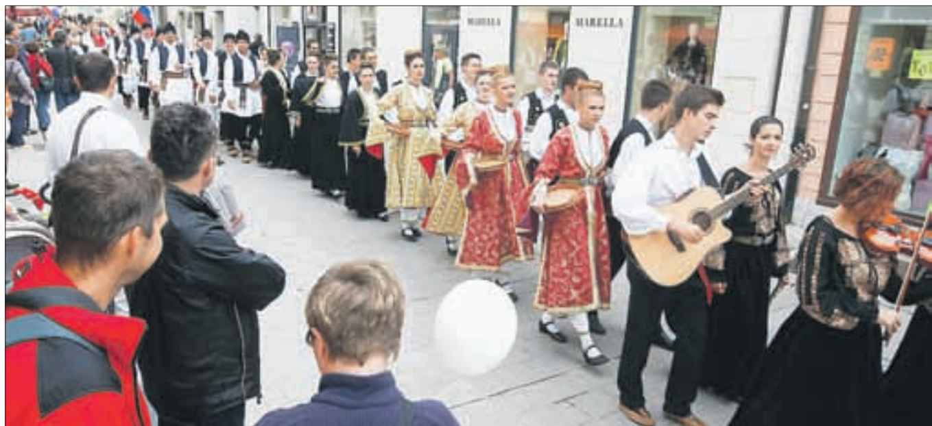
V Kranju je potekala pisana parada folklornih skupin, prav tako pa je SKPD Sveti Sava v okviru letošnjega Svetosavskega folklornega festivala pripravil vrsto prireditev, od razstav, literarnih večerov do koncerta.