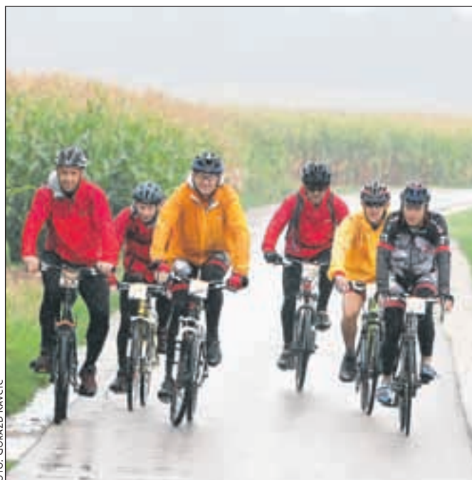
Kolesarji so na Gorenjsko pripeljali v nalivu.

Na koncu je zmagala ekipa, ki se najbolj približa povprečnemu času vožnje vseh ekip. Letos jih je sodelovalo devetintrideset, povprečen čas v cilju pa je bil 24:12:17. Najbolj se mu je približala ekipa Ta zadni, ki je osvojila prvo mesto.