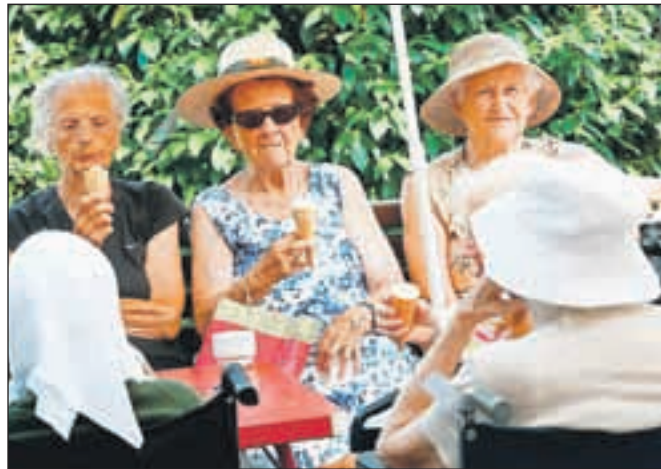
Stanovalci doma upokoјencev gradnjo in hrup potrpežljivo prenašajo, v domu pa so jim na vroč dan v parku pripravili tudi sladoleadni piknik.