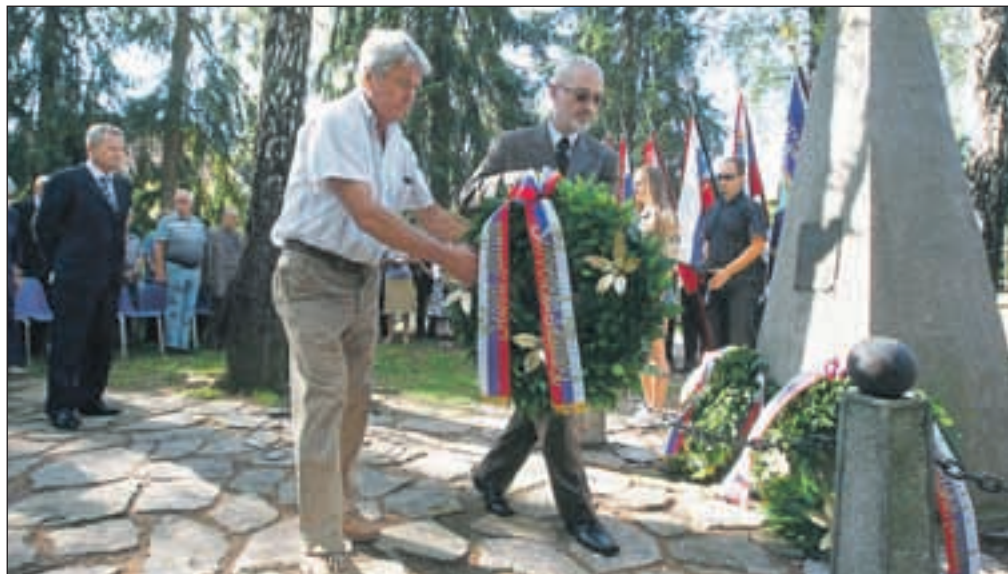
Z vencu so se poklonili bazoviškim junakom.