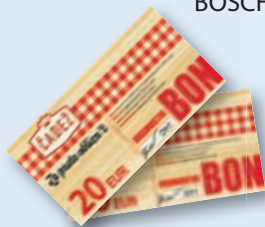
ali darilni bon mesarstva Čadež v vrednosti 20 EUR