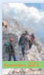
ali knjiga Pozdravljene gore II