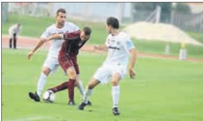
Nogometaši Triglava so minulo nedeljo na domačem igrišču gostili Celje in iztržili točko.