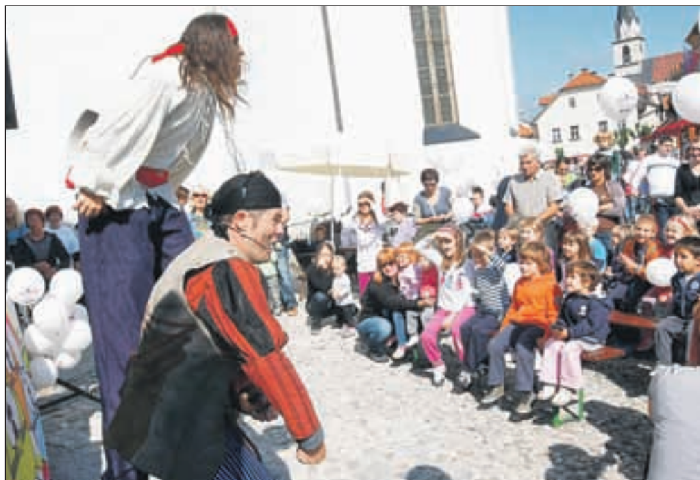
Živ žav je obiskalo vsaj 500 otrok, organizatorji iz Društva Pungert Kranj pa obljublajo, da bo drugo leto, ob desetem jubileju, ta še posebej igriv, nagajiv in zanimiv.