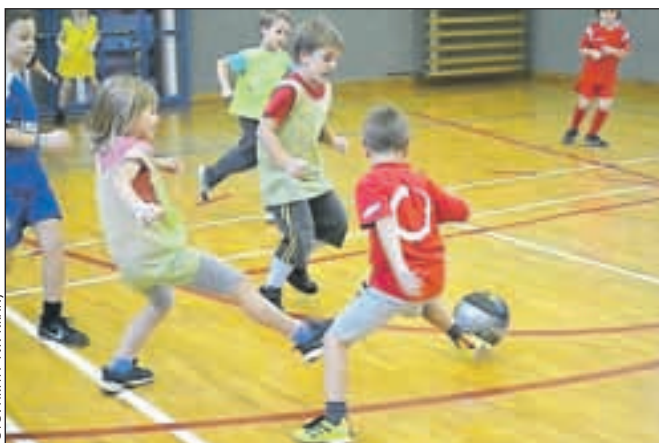
Nogomet je vedno popularnejši tudi med dekleti.