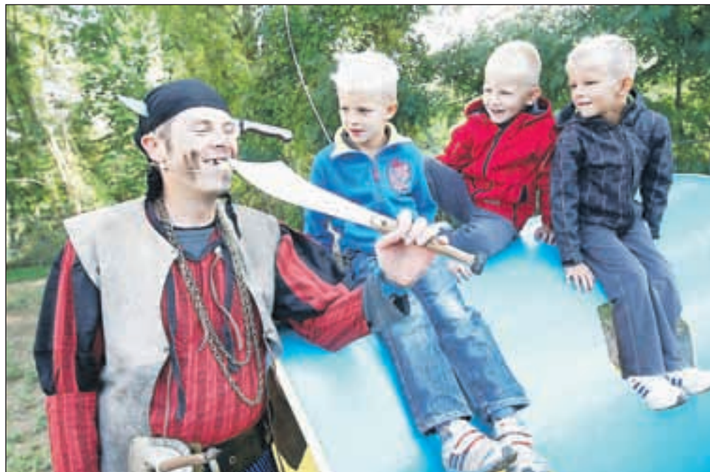
Na glavnem odru je med drugim za zabavo poskrbel Teater Cizamo s predstavo Kapitan Glista in zobati Jack, junaka pa so občudovali zlasti fantje.