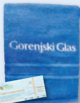
ali kopalna brisača s celodnevno vstopnico za Terme Snovik