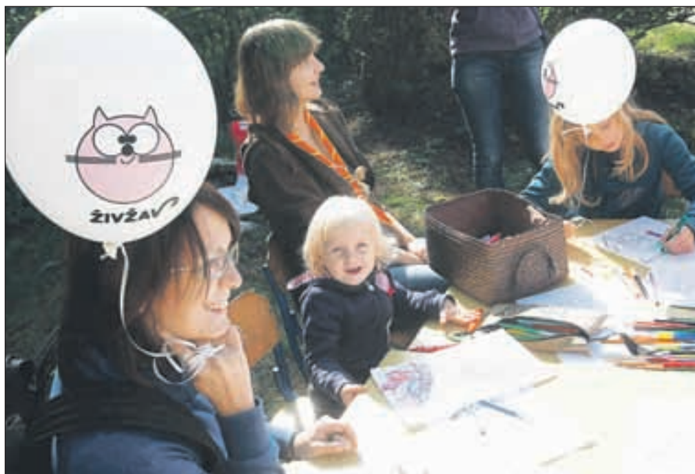
Otroci so se v mali jezikovni šoli lahko učili prvih besed v angleškem jeziku, kot vedno pa je bilo veliko zanimanja za risanje, saj so mladi radi upodabljali, kar so videli.