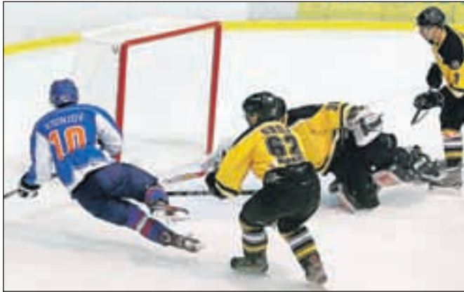
Hokejisti Triglava so mednarodno sezono doma začeli z zmago proti Slaviji (na sliki), ekipe Feldkircha minulo nedeljo pa jim ni uspelo premagati.