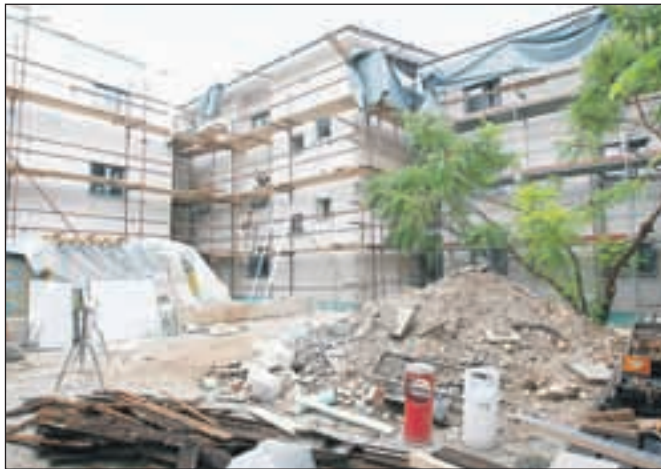
Trenutno stavbe prenavljajo, kar je le mogoče hitro, če bo gradbenikom služilo vreme, pa naj bi bila vsaj zunanja dela zaključena do konca novembra.