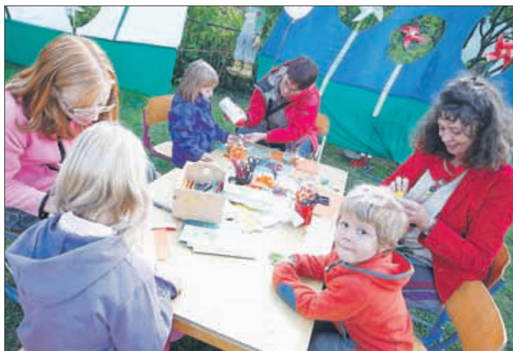
Poleg barvanja obrazkov so potekale različne delavnice, od športne, taborniške in Krice Krace delavnica, kjer so mladi lahko ustvarjali z različnimi materiali.