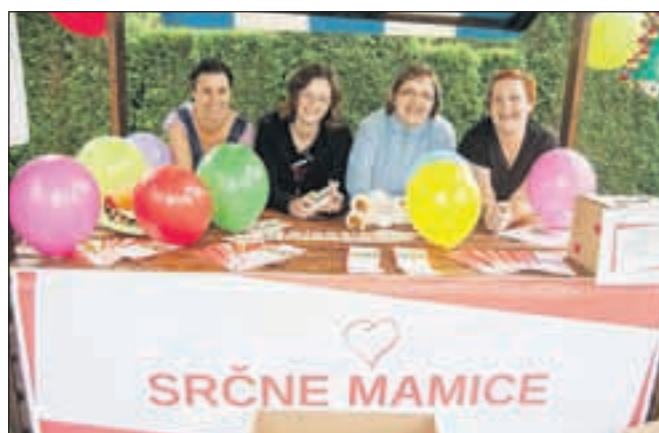
Srčne mamice na Čarobnem dnevu

Donacije za njihovo delovanje prispevajo različna podjetja po Sloveniji. Z njihovimi