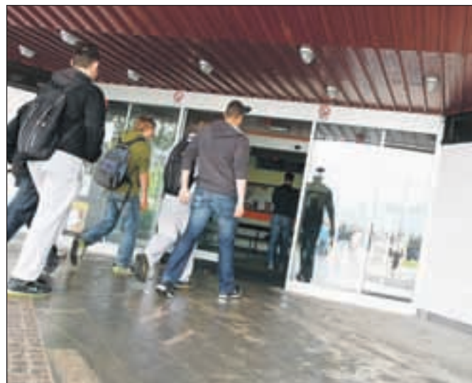
Tehniški šolski center in ESIC Kranj naj bi v prihodnje združili v Šolski center Kranj, gimnazija, ki zdaj deluje v okviru ESIC, pa bi se osamosvojila.