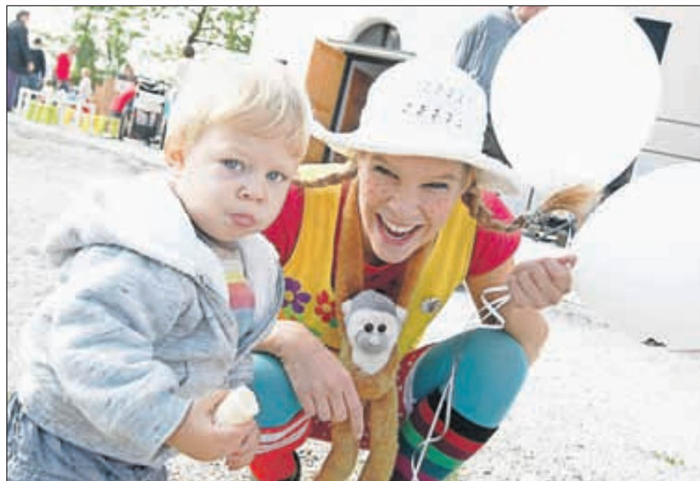
V starem Kranju so otroke pričakali klovni in različni pravljčni junaki, za dobro voljo pa je skrbela tudi vedno prikupna Pika Nogavička. / BESEDILO: VILMA STANOVNIK