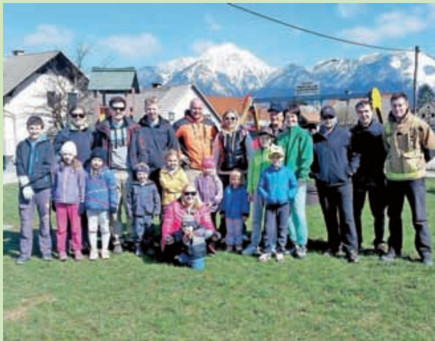
Udeleženci letošnje čistilne akcije