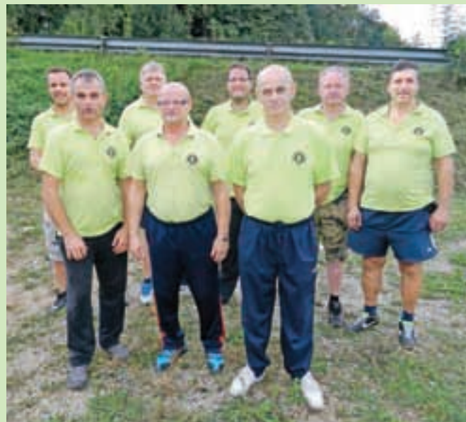
Prstometna ekipa Rokce drugo leto sodeluje v 2. gorenjski ligi.

»Prstomet je zanimiva igra, med katero se tudi dobro razmigaš,« je še pojasnil Borovnica in dodal, da lahko njihovo igrišče za prstomet v dogovoru z društvom brezplačno uporabljajo tudi krajani. Simon Šubic