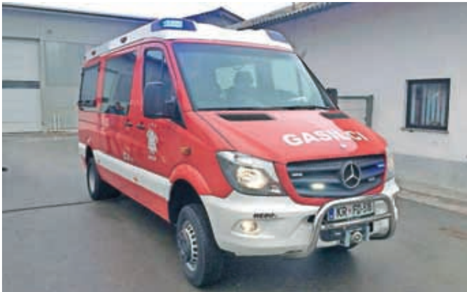
Novo gasilsko vozilo so v PGD Britof dobili že februarja, uradni prevzem pa bodo opravili prihodnje leto.