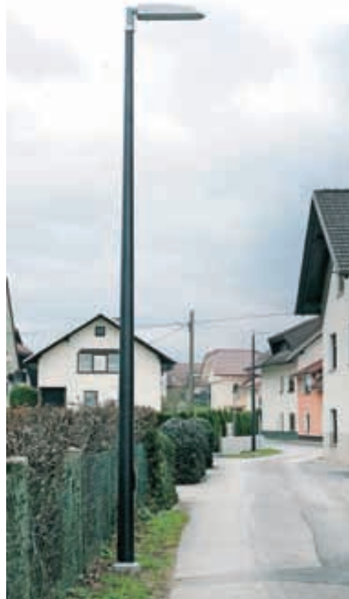
Nova razsvetljava pri kitajski restavraciji

Pred vrati pa je zelo velik projekt – gradnja omrežja fekalne kanalizacije v okviru tretje faze projekta Gorki. Na območju KS manjka še približno polovica kanalizacijskega omrežja, ki bo predvidoma zgrajeno v letih 2016 in 2017. »Po zagotovitvi občinskih uradnikov naj bi gradbeno dovoljenje pridobili še ta mesec, služnostne poti pa so že zagotovljene v 95 odstotkih. Po pridobitvi gradbenega dovoljenja sledi objava javnega razpisa za izbiro izvajalca del, tako da pričakujem, da se bodo v juliju ali avgustu gradbena dela tudi začela,« je ra-