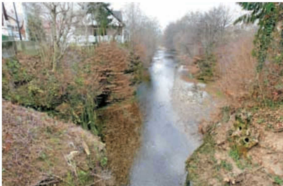
Očiščen kanjon Kokre pri Čira Čari

»V KS Britof-Orehovlje delujejo gasilsko društvo, nogometni klub, Rdeči križ, društvo upokojencev in klub prstometa, morda sem koga izpustil, zato že vnaprej opravičilo. Gasilsko in nogometno društvo sta najbolj popularni v naši KS. Gasilci delajo zelo dobro, prisotni so na vseh akcijah ob naravnih ujmah, požarih in drugih aktivnostih. Nogometni klub po mojih informacijah stoji zelo slabo, stvari bo zato treba postaviti na bolj zdrave temelje, za kar bo potrebno veliko truda. Klub za prstomet – tudi sam sem član – deluje dobro in se nagiba k izgradnji dodatnih petih igrišč ter spremljevalnega objekta za hrambo