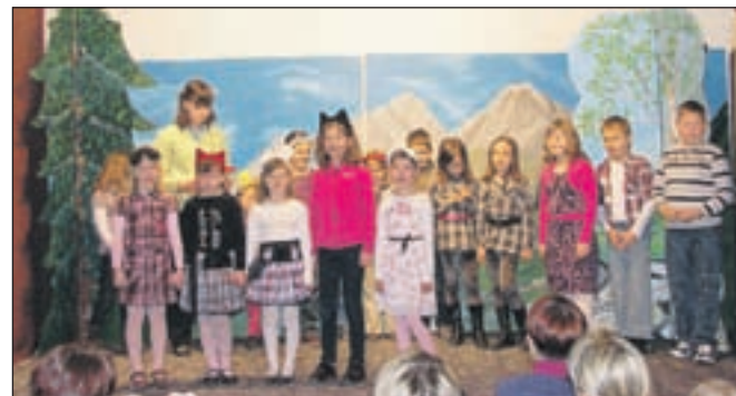
Nastop najmlajših članov

Kulturno-umetniško društvo Krvavec Spodnji Brnik ima že kar dolgo tradicijo, saj je bilo ustanovljeno v začetku sedemdesetih let, člani pa so se že prej kulturno udeleževali v okviru takratne mladinske organizacije. Vseskozi društvo deluje v gasilskem domu na Spodnjem Brniku, združuje pa krajanje iz Vopovelj in Spodnjega Brnika in ima trenutno petinštirideset članov. V društvu pripravljamo eno do tri predstave na leto. Nastopajo predvsem otroci in mladinci iz obeh vasi. Repertoar moramo prilagoditi prostorskim razmeram. Tako pripravljamo proslavo ob materinskem dnevu, božično-novoletno predstavo in eno do dve otroški igrici. Letos smo uvedli še zabavno urico za mlajše mladince in jim tako omogočili druženje v domačem kraju. Prav druženje in spoznavanje otrok, mladincev in posledično tudi staršev izven uradnih institucij je pomemben dejavnik delovanja društva. Nastopajoči pa si pridobijo prve izkušnje z javnim nastopanjem. Seveda si prizadevamo, da bi v delovanje vključili še več občanov in razširili dejavnost še na druga področja in tako oživili in popestrili druženje vaščanov. Š. L.