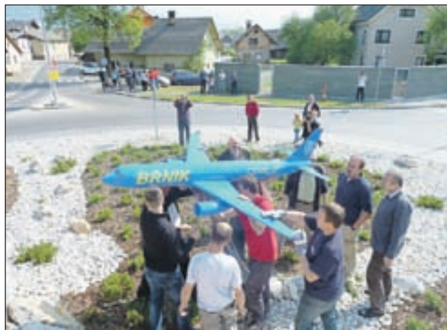
Brničani so letalo na krožišču sprejeli z navdušenjem in ponosom.