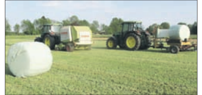
Kmetje pod Krvavcem se vse bolj odločajo, da seno na travnikih balirajo s traktorsko balirko.

V začetku maja se je začela košnja trave v okolici Kranja, Šenčurja in Cerkelj. Ker je bila aprila na Gorenjskem kar močna suša, je najbolj vlage primanjkovalo travam, žitom in oljni ogrščici. Posevki zaostajajo v rasti, predvsem pa so se zaradi nadpovprečno toplega in suhega aprila tudi slabše razraščali, kar že kaže na to, da letos ni pričakovati zelo visokih pridelkov na travnikih in pri žitih. Ker je bilo več padavin šele ob koncu aprila, so posevki slabši, saj je trava zaradi suhega vremena v aprilu počrpala kar precej zimske vlage. Kmetje ocenjujejo, da je letošnja prva košnja slabša najmanj za 20 do 30 odstotkov. J. K.