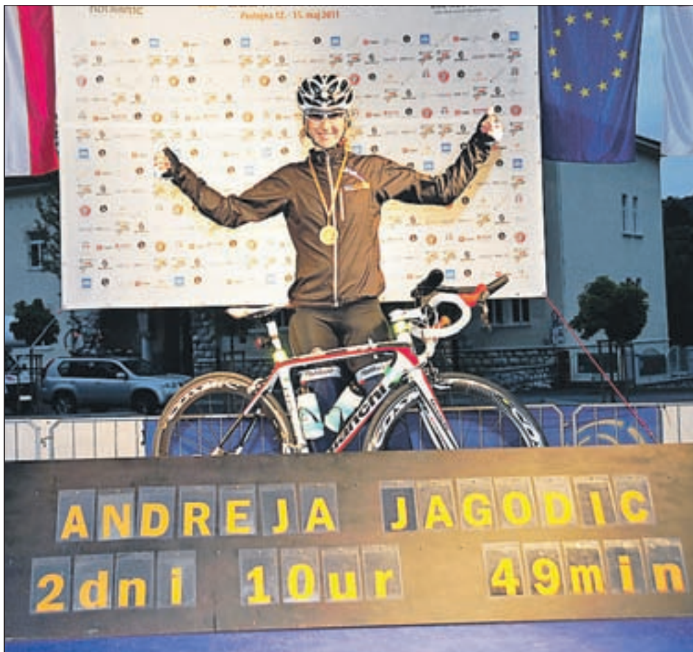
V 2 dneh, 10 urah in 49 minutah je prekolesarila 1138 km. Veselje na cilju je bilo veliko.

"Občutki tega dne so še zelo živi. Kar začutim adrenalin. Zadnji dnevi pred dirko so zame vedno najtežji. Ko sem čakala, da me pokličejo na start, sem si že neskončno želela, da grem. Lepo je bilo videti veselje in navijaške vzklike, a sem res samo še komaj čakala, da se začne. Začutila sem pravo olajšanje, ko sem se spustila po rampi. Vedno komaj čakam, da hrup popusti in da se zlijem z naravo."