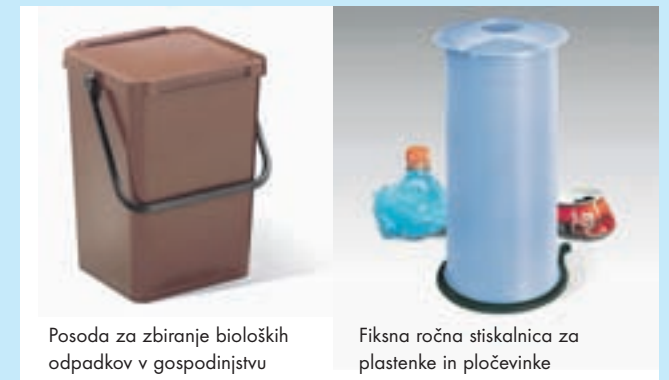
Posoda za zbiranje bioloških odpadkov v gospodinjstvu