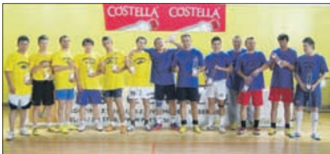
V nogometu je slavila ekipa rumenih.

V organizaciji ŠD Krvavec je 21. in 22. maja v Cerkljah potekal Maraton 12 ur košarke in malega nogometa - Pozdrav poletju. Prvi dan so 12 ur igrali košarko, drugi dan pa še mali nogomet. Športna dvorana je gostila več kot 140 igralcev. Imena ekip so vzeli po vaseh cerkljanske občine, ki so bile razdeljene na severne in južne. Ekipa s severnega predela občine so nosile modre majice, južne vasi pa rumene. Dogodek je bil v prvi vrsti namenjen druženju in rekreaciji, igrali pa so tudi za rezultat. Po dvanajstih urah košarke je bil rezultat kar tesen, s 725 : 710 pa je zmagala ekipa modrih. V nogometu je z rezultatom 65 : 72 slavila ekipa rumenih. M. B.