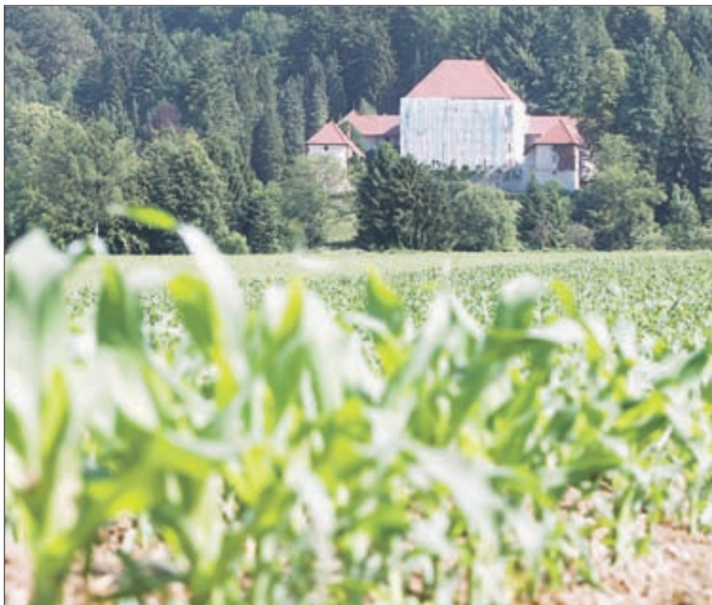
Grad Strmol je eden izmed dveh gradov v Sloveniji, ki ima ohranjeno tudi vso notranjo opremo.

"Grad je bil sicer vzorno vzdrževan, vendar pa so bile vse inštalacije dotrajane in so že ogrožale kulturni spomenik. Stavba je imela na posameznih mestih tudi statične poškodbe, ki jih je bilo potrebno nujno sanirati. Fasada je bila zelo poškodovana zaradi plezavke, dotrajana so bila tudi okna. Statične poškodbe, dotrajane lesene elemente, stavbno pohištvo in strešno kritino so imeli tudi gospodarski poslopji in lovski koč, ki jih bomo prav tako temeljito obnovili," so nam sporočili z ministrstva in dodali, da bodo z obnovo uredili tudi ožjo okolico gradu. Obnova gradu Strmol s pripadajočimi pristavami se izvaja v okviru evropskega projekta Povezovanje naravnih in kulturnih potencialov, vrednost investicije pa je ocenjena na 3,5 mi-