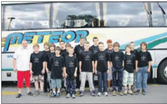
Ekipa pionirjev pred odhodom v Francijo