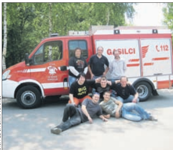
Prevoz vozila na Ptujski gori

Izvajalca za izdelavo in dobavo novega orodnega vozila smo izbrali preko javnega razpisa. To delo smo zaupali podjetju SVIT-Zolar s Ptujске Gore. Vozilo je na podvozju Iveco Turbo Daily, prevaža lahko sedem oseb, vgrajena je visokotlačna črpalka s 1000-litrskim rezervoarjem z vgrajenim električnim agregatom, električnim vitlom in ostalo opremo, ki je predpisana s tipizacijo za tako vozilo. Težko pričakovano vozilo smo 14. maja 2011 prevzeli pri izvajalcu. Novo vozilo bo nadomestilo našega "tamčka", ki bo kmalu dobil novega lastnika.