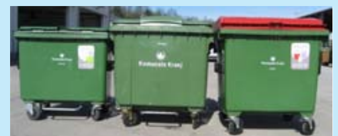
V zabojnike z rdečim pokrovom boste odlagali vse vrste odpadnih sveč.

Obstoječe zabojnike za mešane komunalne odpadke smo nadomestili z zabojniki za ločeno zbiranje sveč, cvetja in mešanih komunalnih odpadkov. Zabojniki so označeni, tako da bo ločevanje odpadkov z malo dobre volje zelo enostavno.