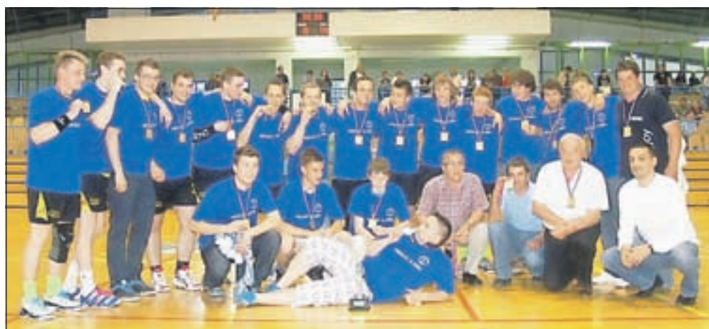
Rokometaši Cerkelj s pokalom in medaljami za prvo mesto v drugi državni ligi