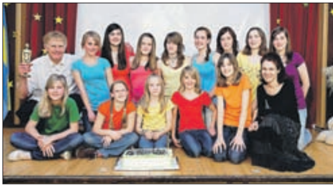
Pevci MIPZ KUD Pod lipo Adergas

2011 ob 19. uri s sveto mašo za domovino, po maši pa nadaljujemo kulturni program pred cerkvijo v Adergasu. V primeru slabega vremena se bo program izvedel v hramu Ignacija Borštnika v Cerkljah. Zato že sedaj vabimo vse občane in občanke, da se nam pridružijo. Naj vas že sedaj opozorim na jesenske prireditve, ki jih pripravljamo v KUD-u Pod lipo Adergas. Septembra bomo ob 30. obletnici MIPZ in Orffovega orkestra KUD-a Pod lipo Adergas pripravili razstavo s kratkim kulturnim programom. V oktobru smo si izbrali projekt Družina se predstavi, kjer se bodo družine predstavile na odru s petjem, igro, skeči, recitacijami. Vse informacije o teh prireditvah boste dobili na internetni strani društva www.kudpodlipo.si . Vsem skupaj želimo čim bolj brezskrbne počitnice in veliko lepih doživetij v poletnih dneh.