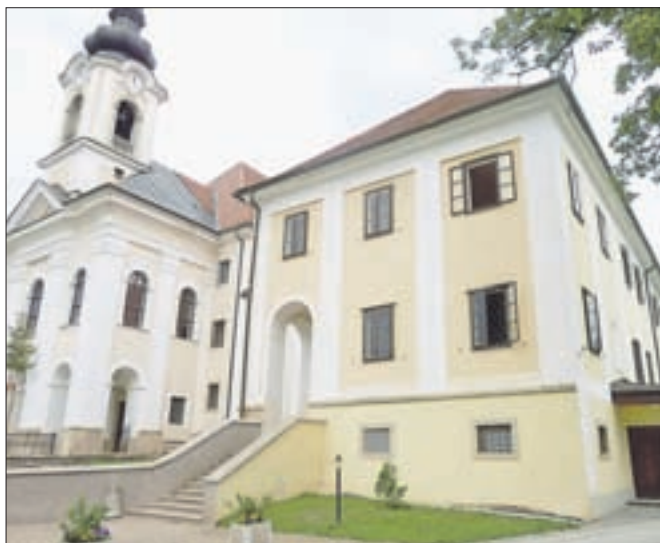
Prostori samostana bodo po prenovi namenjeni mladini.