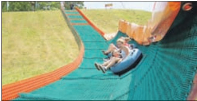
Na Krvavcu bodo to poletje v okviru Poletnega parka organizirali vrsto doživljajskih in zabavnih aktivnosti.

Na Krvavcu bo tudi letošnje poletje nekaj tradicionalnih prireditev - 13. in 14. avgusta bo Florjanova jadralna regata na vrhu Zvoha, 21. avgusta žegnanijska maša v kapele Marije Snežne, 27. avgusta pa kolesarska dirka Vzpon za kralja in kraljico Krvavca.