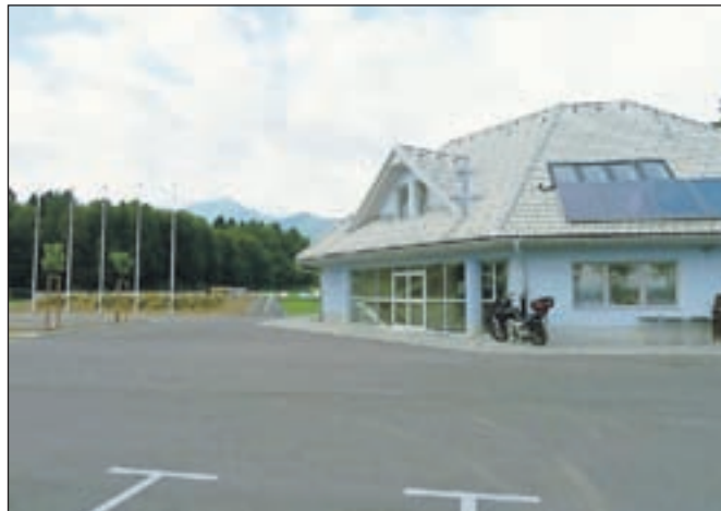
Nogometni center Velesovo bo v celoti zaživel jeseni.

Športno-nogometni center Velesovo, ki ga je občina v zadnjih letih uredila na skoraj 4 hektarih zemljišč, je praktično končan. Nogometne površine že od spomladi pridno uporabljajo nogometaši, ki s svojimi rezultati razveseljujejo v vseh selekcijah, do konca poletja pa bo dokončana tudi zgradba z vsemi potrebnimi prostori. Gostinski lokal že obratuje, jeseni pa bodo zaživeli tudi prostor za fitnes ali fizioterapijo, masažni salon, sejna dvorana ter prostori za klub, sodnike in športne delegate. Montirali bodo še del tribun, na katerih bo skupno prostora za okoli tisoč obiskovalcev, urejeno pa je tudi parkirišče za več kot sto vozil. J. P.