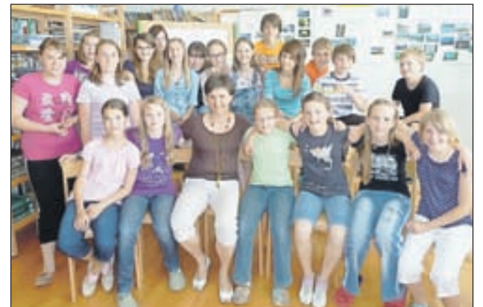
Pevci mladinskega zbora so navdušili tudi v muzikalu Vaška banda.