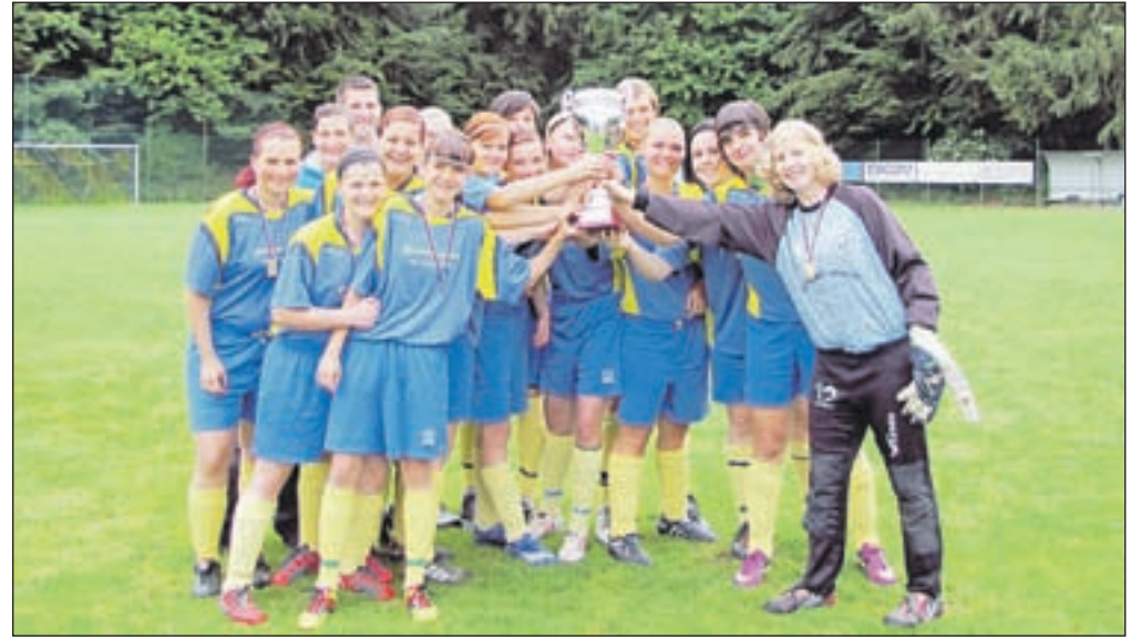
Ekipa U17 Velesovega se je veselila naslova državnih prvakinj.