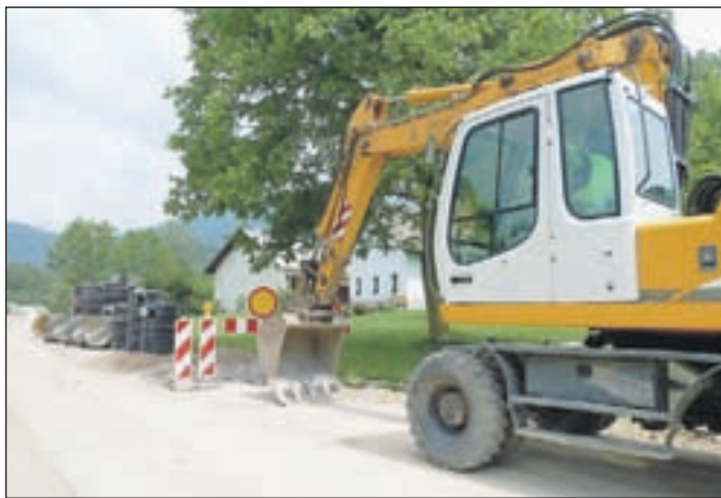
Gradnja fekalne kanalizacije v naselju Glinje

V poletnih mesecih bodo na odsekih ceste na Štefanjo Goro izvedli kamnite zložbe in popravili vtočne jaške, na cesti Grad-Ravne bodo julija izvedli zaščito brežine s sidranim pocinkanim pletivom. Kot so še pojasnili na Občini, bodo tekom poletja poleg rednih vzdrževalnih del preplastili ceste Zg. Brnik-farma KŽK, Stiška vas-Ambrož, sp. postaja žičnice-Štefanja Gora in namestili protizdrsnne prevleke v Zalogu ter Pšenični Polici.