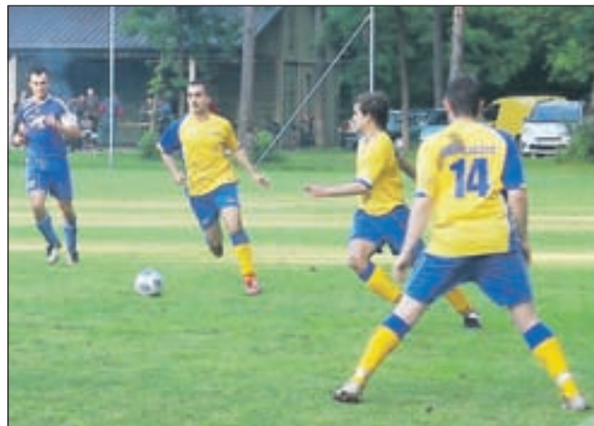
Člani so bili tretji v 1. Gorenjski nogometni ligi.