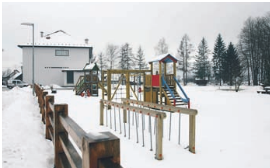
V Predosljah so za otroke uredili nova igrala.