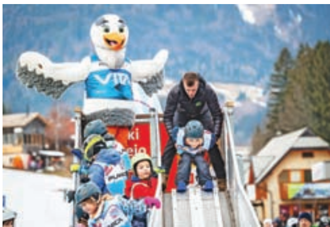
Čaplja Vita je poskrbela, da so se po Mini Planici spustili tudi tisti, ki so morda prva malce oklevali.