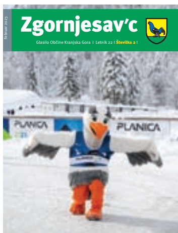
Na naslovnici: Vita, maskota FIS svetovnega prvenstva v nordijskem smučanju Planica 2023