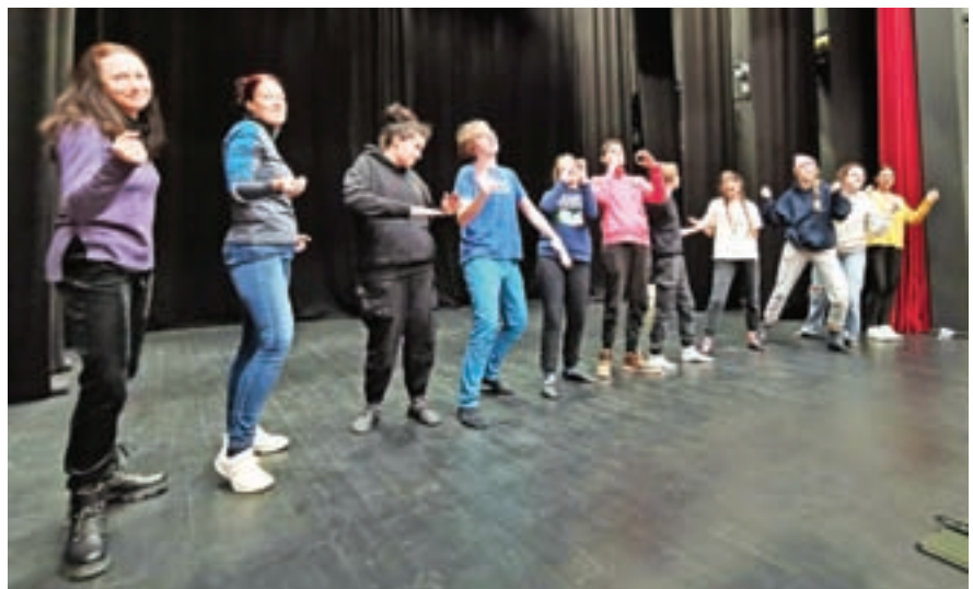
Razigrani mladi gledališčniki bodo letos upodobili mravlje.

»Ko smo začeli vaje, sem jih vprašala, česa si želijo. Takoj so rekli, da bi bili gozdne živali, ker so zelo zabavne. In tako zdaj nastaja predstava Huda mravlja,« je povedala Brgantova in dodala: »V našem mravljišču se dogajajo različne stvari. Imamo ljubezenski trikotnik, operativce, ki skrbijo za delovanje