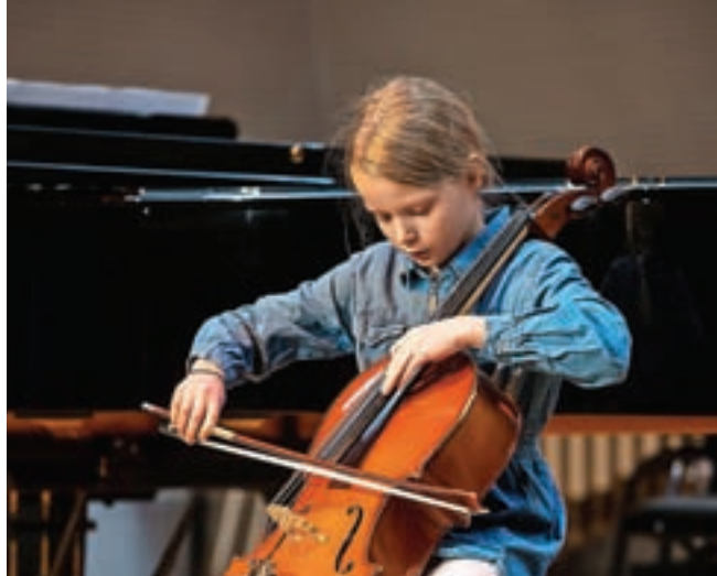
Lucija Marija Mesec

Obiskovalci osnovne informacije o oglarjenju na območju Rut pridobijo tudi na informativnih tablah TNP ob kopišču.