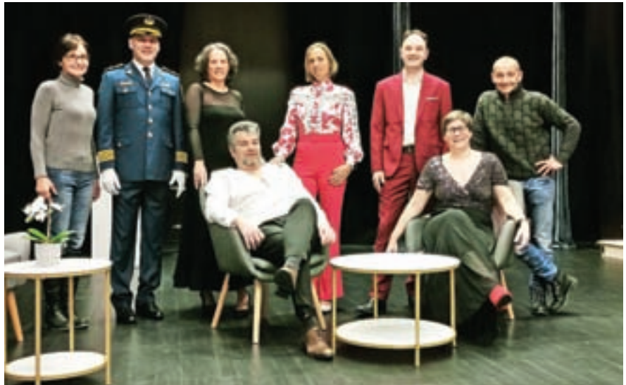
Ta bol teater letos znova s komedijo