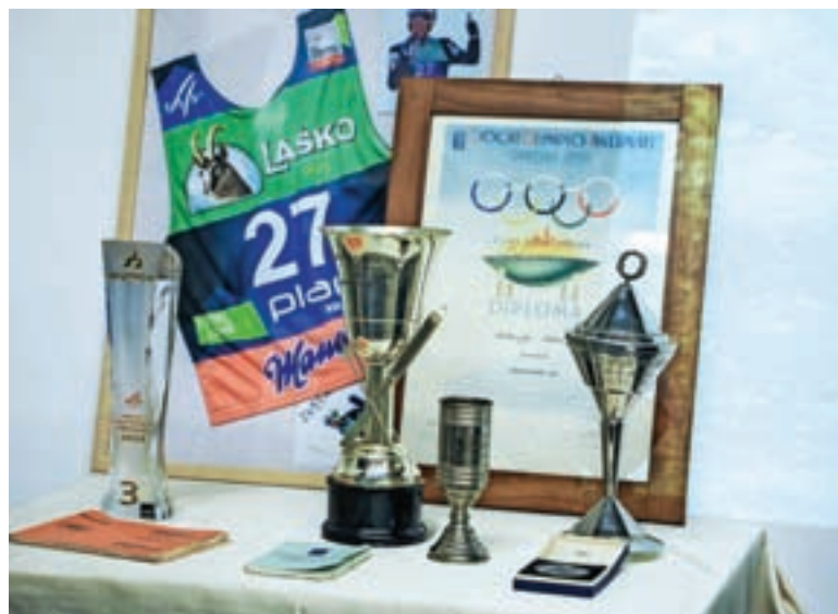
Razstava bo ponudila nekaj edinstvenih zgodb in eksponatov, ki jih doslej še nismo videli.