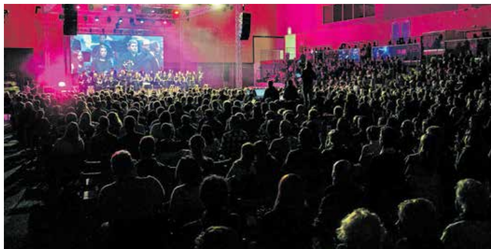
Na lanskem koncertu so povsem napolnili športno dvorano v Žireh.