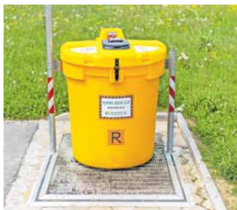
Zbiralnica odpadnega jedilnega olja