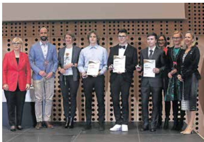
Prejemniki zlatih priznanj s Šolskega centra Škofja Loka