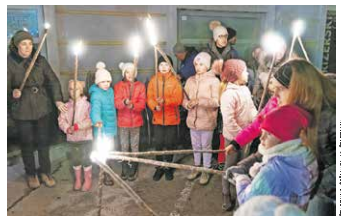
Baklada je pritegnila okoli 160 udeležencev.