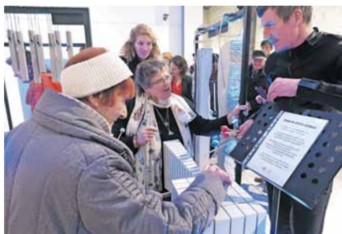
Obiskovalci so lahko preizkusili zven kamna. / FOTO: IGOR KAVČIČ

V Galeriji Sokolskega doma je na ogled še osem grafičnih del mlade umetnice Monike Plemen. Gre za litografije, ki so izdelane v posebni grafični tehniki z uporabo kamna, ki se ji umetnica v zadnjem času največ posveča. Ena izmed grafik je bila pripravljena posebej za to razstavo, ki bo na ogled do 8. februarja.