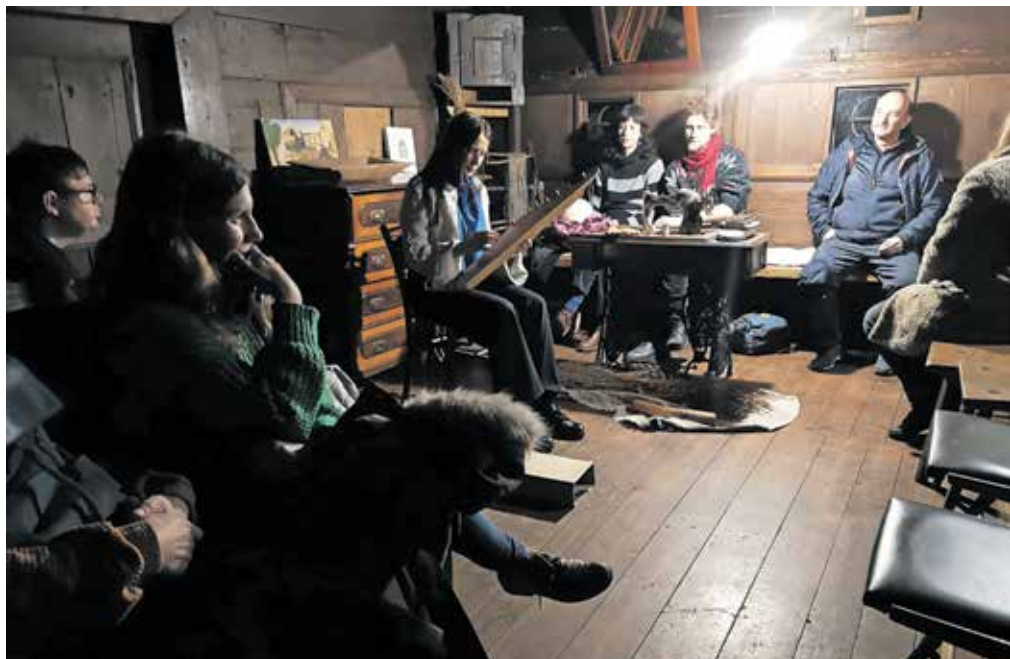
Topla izba in vzdušje sta spomnila na pripovedovanje zgodb v starih časih.

ko. Pozdravila sem jo in jo objela. Pa je rekla, če sem prišla iz Istanbula in ali sem bila v Hagiji Sofiji. Mene je to čisto prevzelo, to, kako moja mama ve za Hagijo Sofijo. Mi je rekla: 'Veš, ti greš po svetu, jaz sem pa čisto pri miru, pa svet k meni pride ...' V Škoparjevi hiši je ob tej pripovedi zavladala tišina, obiskovalci so imeli solze v očeh. »Ves čas tako bezljamo, neki tok nas je zgrabil