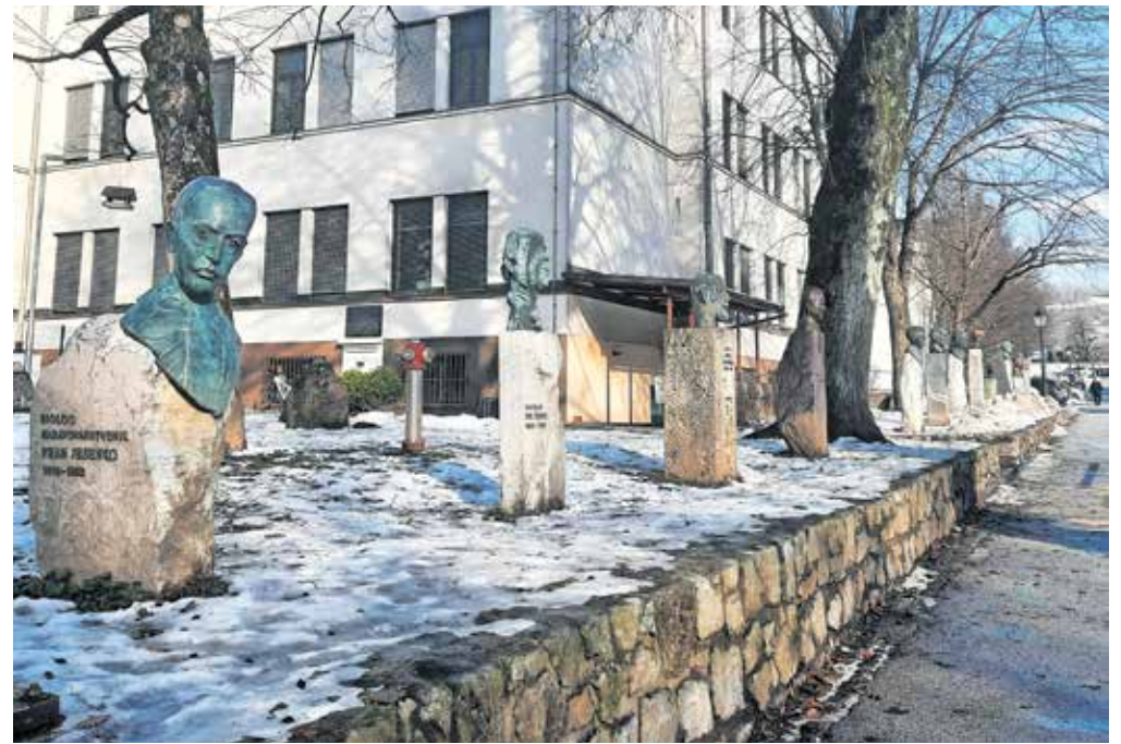
Štirinajstim kipom na Šolski ulici se bodo v prihodnjih letih pridružili še trije.

nega poslanstva uršulink in poživitev redovnega duha in duhovnega življenja samostanske skupnosti.