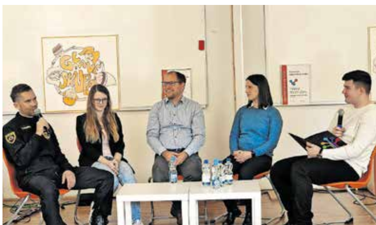
Okrogla miza na prireditvi projekta Inženirke in inženirji bomo!

zapored pometla s konkurenco in zmagala na 3. IKT natečaju na področju multimedije. Zelo uspešni pa sta bili tudi dijakinji