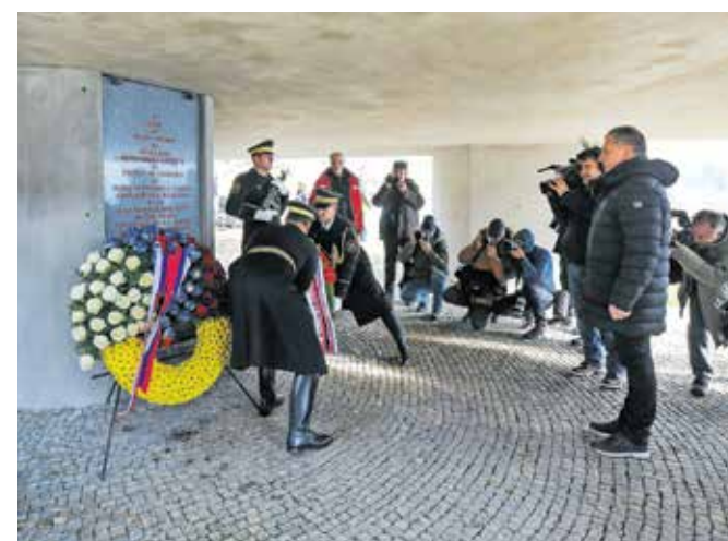
Spominske slovesnosti se je udeležil tudi predsednik državnega sveta Marko Lotrič in k spomeniku položil venec. / FOTO: TINA DOKL