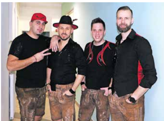
Člani priljubljene zasedbe Fehtarji