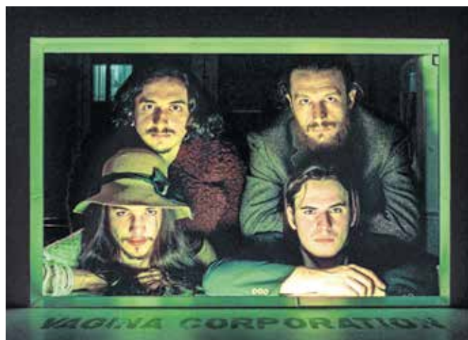
Skopski multižanrski Vagina Corporation

Škofja Loka – Koncert bo v petek, 23. februarja, in po nekaj več kot pol leta ponovno združuje moči s škofjeloškim društvom Jadran. Tokrat v goste prihajajo (severno)makedonski multižanrski odpiljenci Vagina Corporation in prekmurski noise rokovski muzikantje Moving as a giant. Že nekaj let sodelujejo pri izvedbi koncertnega dela Hafnerjevega memoriala v Železnikih, lani pa so v avli Kulturnega doma skupaj pripravili tudi koncert zasedb Klotljudi in Disdrug. Po pričevanju vpletenih jih združuje veliko stvari. Ne govorimo samo o glasbi, ampak tudi medsebojni podpori na način obiskovanja koncertov kot tudi pomoči pri izvedbi različnih projektov. Navsezadnje je tu tudi brezdolnost, saj obe društvu še vedno ne premo-