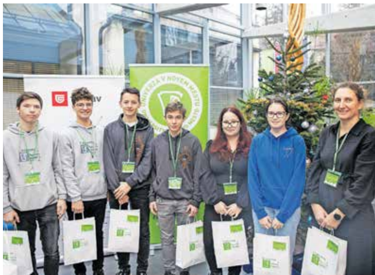
Ekipe Strokovne tehniške gimnazije na 3. IKT natečaju

V svojih več kot dvajsetih letih delovanja so se naučili, kako dijake uspešno pripeljati do mature in jih pospremiti na fakulteto. Predvsem pa se na Strokovni tehniški gimnaziji ŠC Kranj zavedajo, da dijake pripravljajo na prihodnost, za katero nihče ne ve, kakšna bo, kar je seveda svojevrsten izziv. Iz izkušenj so se naučili, da je pri tem ključno, da dijakom pomagajo pri tem, da jih naučijo timskega dela, veščin nastopanja in dobre komunikacije, da razvijajo kompetenco podjetnosti in že v srednješolskih letih pri njih spodbujajo inovativnost. Tako na šoli že nekaj let deluje skupina inovativnih dijakov z imenom Glave skupaj. Dijaki pa