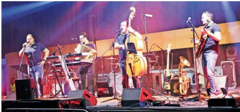
Člani Kvarteta za 5 prihajajo iz Selške doline.