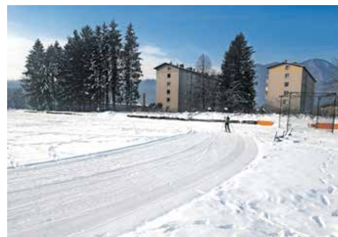
Od prejšnjega tedna tekači na smučeh lahko uporabljajo progo v nekdanji vojašnici.

dobro obiskana. Sneg, ki je zapadel pred dobrim tednom, je razveselil tudi druge, ki imajo radi zimo, od prejšnjega tedna pa je poskrbljeno tudi za smučarske tekače. V Zavodu za šport so namreč v nekdanji vojašnici pripravili progo za tek na smučeh. Ob tem sprehajalce prosijo, da se ne sprehajajo po progi ter da njihovi hišni ljubljenci na njej ne opravljajo potrebe.