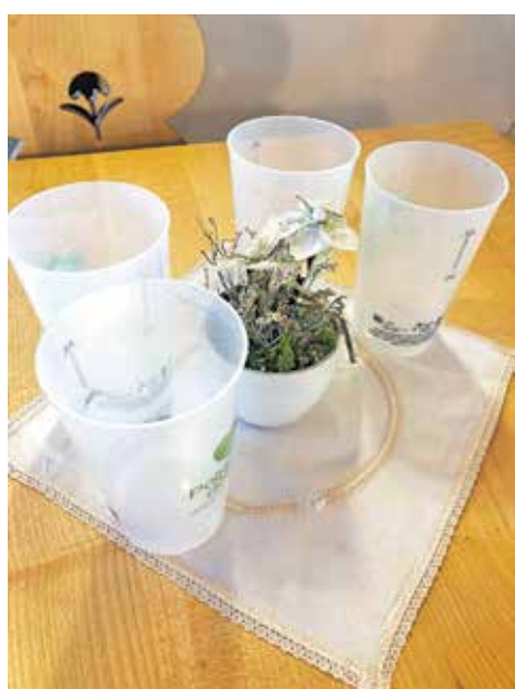
Ekozarčki za večkratno uporabo Zavoda Poljanska dolina