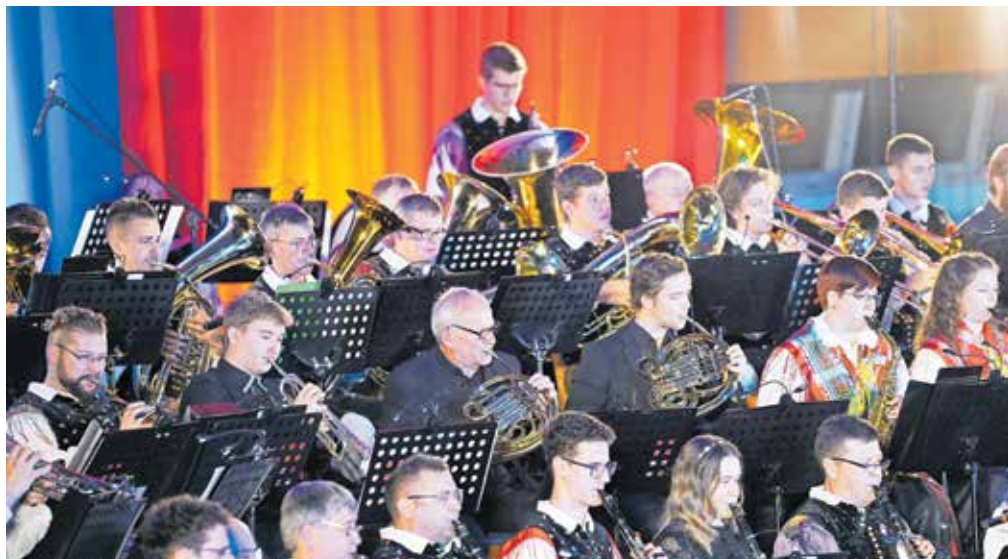
Koncert je občinstvu postregel z raznolikim glasbenim programom.