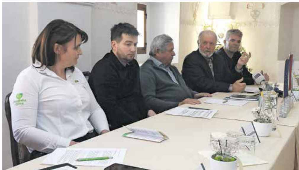
Na okrogli mizi so o drobnjakovih štrukljih spregovorili strokovnjaki s področja etnologije, kulinarike, gostinstva in turizma.

od mejnikov promocije te jedi, za katero si želi, da bi se najprej močno ukoreninila v njihovi dolini. Pri vpisu na Unescov seznam nesnovne dediščine pa so se odločili za majhne korake, saj gre za tako zahteven projekt, da nima smisla hiteti, je poudaril župan. Drobnjakove štruklje na žup bo mogoče še ta in prihodnji konec tedna poskusiti tudi v Kavarni Visoko, kjer jutri ob 17. uri pripravljajo tudi delavnico izdelave drobnjakovih štrukljev s Petro Potočnik.