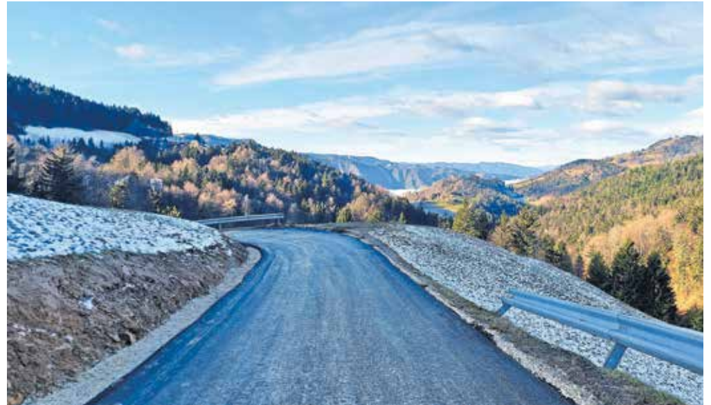
Obnovljeni odsek ceste v Javorjevem Dolu