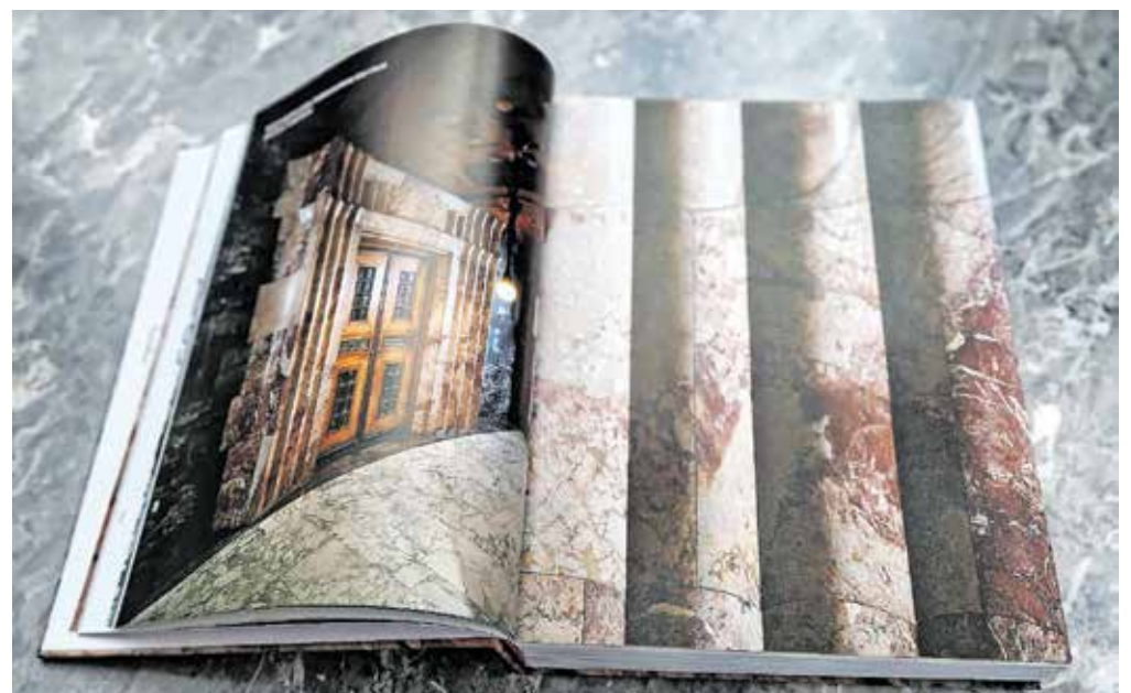
Ob tristoletnici kamnoseštva na Hotavljah so v podjetju Marmor Hotavlje izdali monografijo z naslovom 300+.

Za monografijo, ki so jo naslovlili 300+, so po Čeferinovi besedah dolgo časa zbirali pričevanja ljudi, povezanih z Marmorjem Hotavlje, in zbirali fotografije, ki dokumentirajo razvoj podjetja. »Gradivo smo sestavili kot sestavljenko. Kronologije dogodkov se nismo vedno držali, prav tako nismo razvrščali dogodkov po pomembnosti za gospodarsko uspešnost podjetja. Vodila nas je želja, da bi dobili čim bolj verodostojno sliko podjetja, ki bi pripovedovala o težkih, prijetnih, usodnih, zabavnih, pomembnih, pa tudi o čisto običajnih dogodkih na Hotavljah in v drugih krajih po vsem svetu.« Tako je nastala edinstvena publikacija, ki so ob jubileju podarili vsem zaposlenim in poslovnim