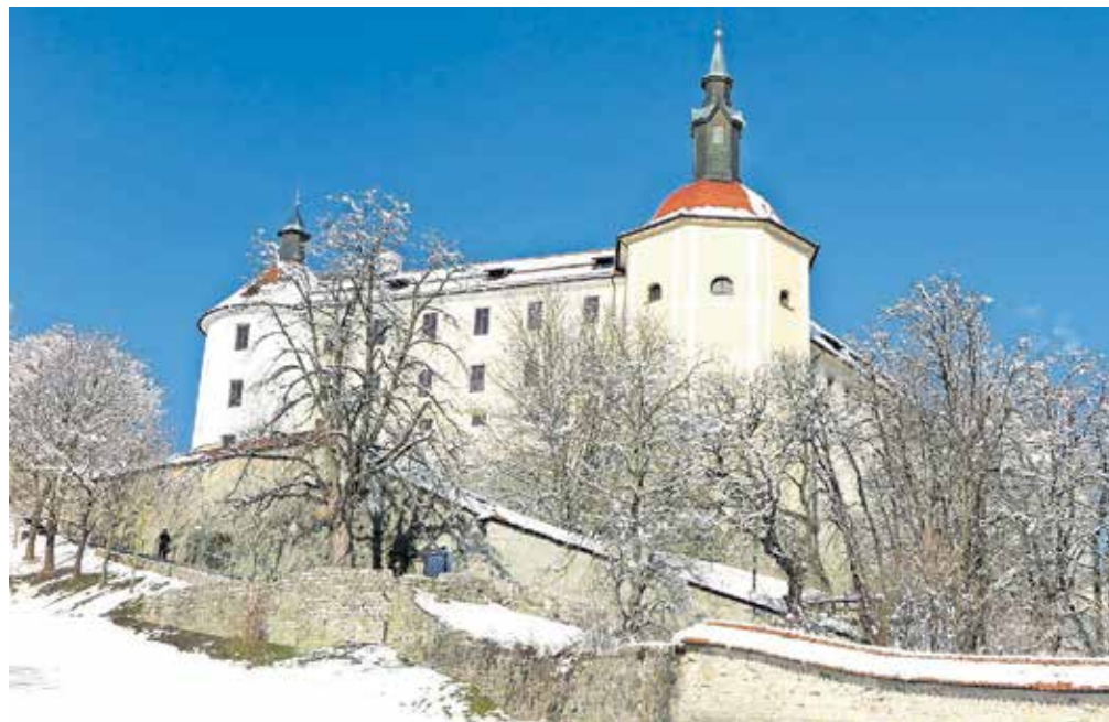
Loški grad je po zunanji in notranji prenovi ter energetski sanaciji sedaj ponos mesta.

Začela se je statična sanacija ter obnova fasade jugozahodnega oziroma okroglega stolpa, južnega in severnega dela gradu ter veznega trakta, ki grad povezuje z objektom nekdanjega Nunskega samostana. Ta je vključevala tudi celovito energetsko pre-