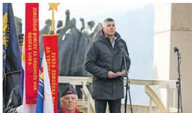
Slavnostni govornik Matjaž Nemeč

Slavnostni govornik je bil evropski poslanec Matjaž Nemeč. Dejal je, da sta sporočili Dražgošo upor in resnica in da je bila dražgoška bitka eno od najpomembnejših dejanj odporniškega gibanja na leta od nacizma zasedenih ozemljih. Opozoril je na nevarno oživiljanje idej fašizma in nacizma in na vojne, ki pretresajo svet in terjajo na tisoče žrtev. Zlo nikoli ne