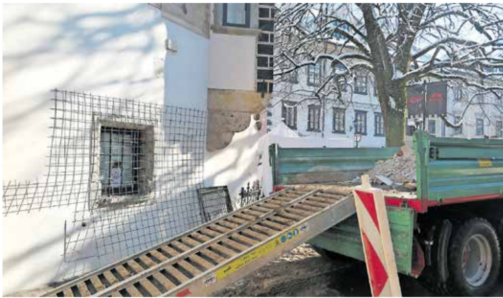
Prenova Homana poteka že od novega leta.

»Za razumevanje prosim tako stanovalce kot vse druge, saj je kakšen dan zaradi del tudi malce bolj hrupno. Računam, da bo prenova potekala najmanj tri mese-