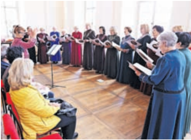
Srečanje gorenjskih upokojskih pevskih zborov je letos gostila Radovljica.

O reviji je povedala: »Bila sem počaščena, da so me povabili na funkcijo selektorice, ker resnično gojim veliko spoštovanje do ljudi, ki zavzeto in vestno pojejo tudi v obdobju, ko niso več službeno aktivni. Nekateri pojejo že vse življenje, nekateri