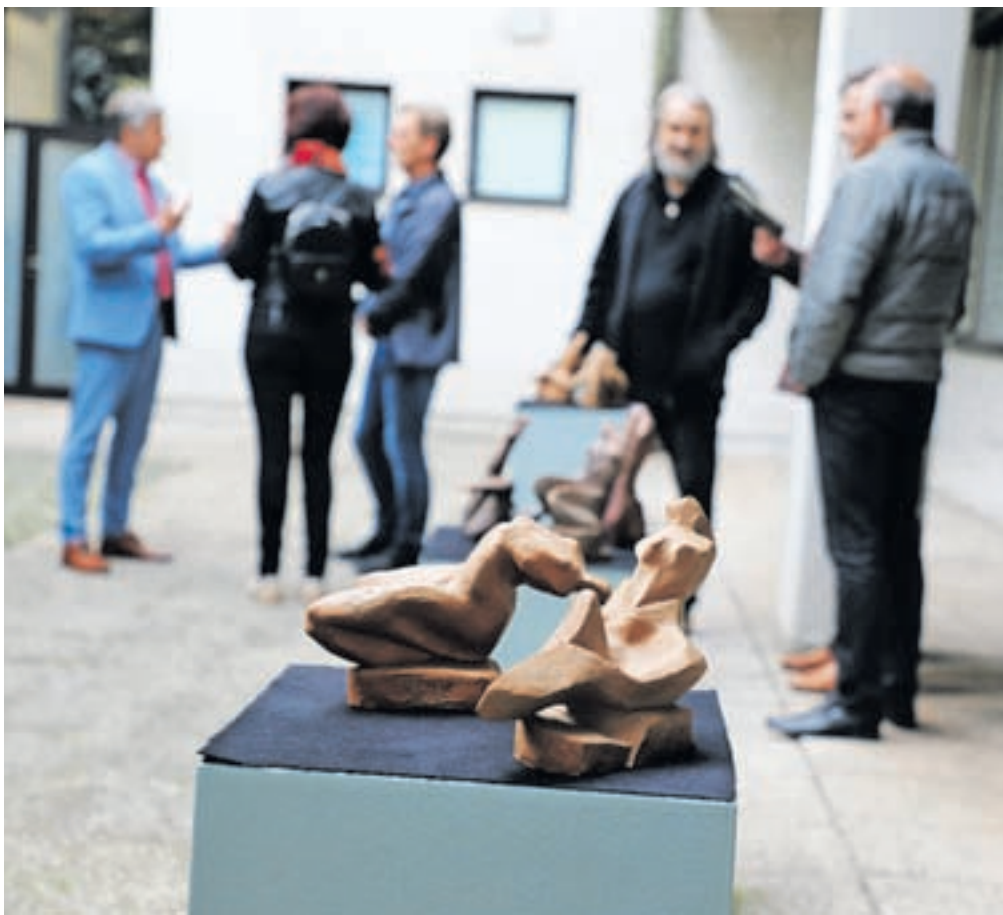
Odprije razstave v atriju Izobraževalnega centra Radovljica prejšnji četrtek

Njegovi so tudi bronasta portretna kompozicija pesnika Ivana Hribovška pri cerkvi sv. Petra v Radovljici, prav tako bronasta Langusova paleta pred vhomom v Dom krajanov v Kamni Gorici ter portret škofa Antona Bonaventure Jegliča pred cerkvijo v Begunjah. Na razstavi v Radovljici so