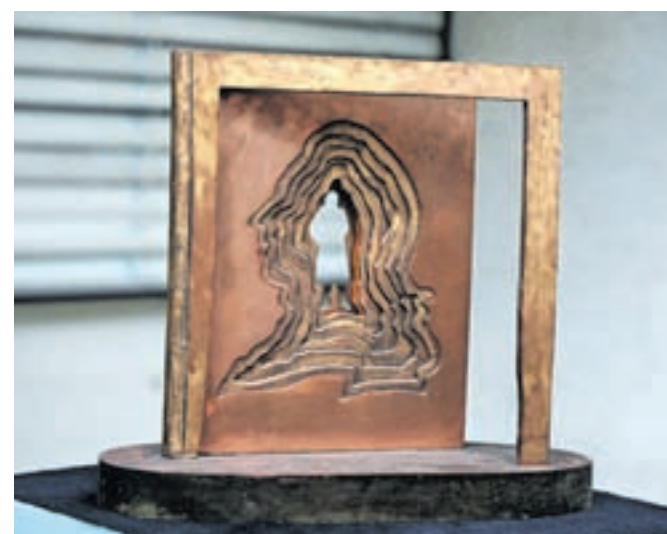
Tudi spomenik Antonu Tomažu Linhartu v Radovljici je delo Staneta Kolmana. Na fotografiji v pomanjšanem merilu.