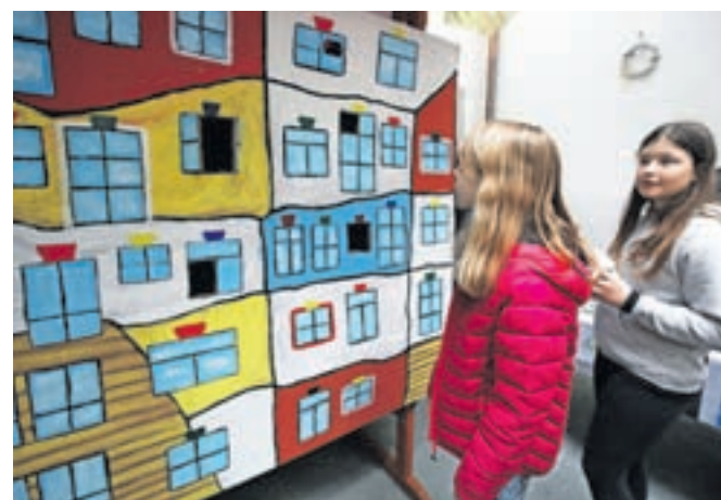
Posebno zanimivo predstavitev sosednje Avstrije so pripravili učenci OŠ Antona Janše iz Radovljice.

Kot je povedala Anita Hrvat, pomočnica ravnateljice OŠ A. T. Linharta Radovljica in koordinatorica projekta, ideja Evropske vasi vse od leta 2006, ko so jo pripravili prvič, ostaja enaka, in sicer spodbujanje medkulturnih kompetenc – od raziskovanja lastne kulture in s tem