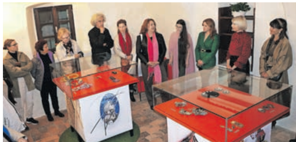
V Šivčevi hiši je svoj nakit razstavilo deset umetnikov, oblikovalcev nakita. Tematsko so izbrali tradicijo v nakitu v sedanosti in preteklosti.