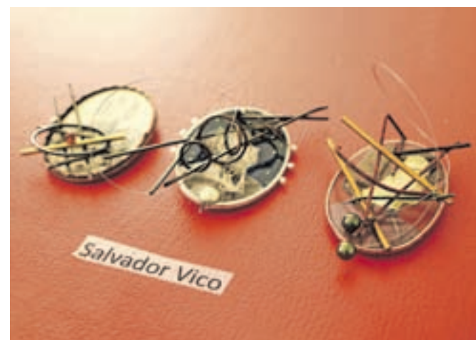
V nakit so ujete zanimive zgodbe ustvarjalcev.