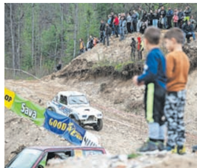
Petnajsta izvedba dogodka Slovenija OffRoad letos pod organizacijo Off Road Cluba White Tiger