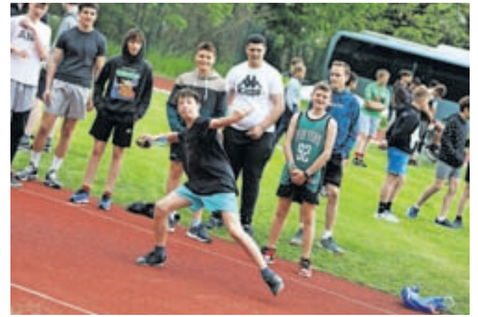
Učenci so se pomerili v različnih disciplinah, med drugim v metu vorteksa.