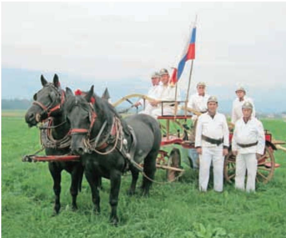
Veterani s staro ročno gasilsko brizgalno iz leta 1905

Med člani prostovoljnega gasilskega društva Predoslje imajo posebno mesto njihovi vetera-