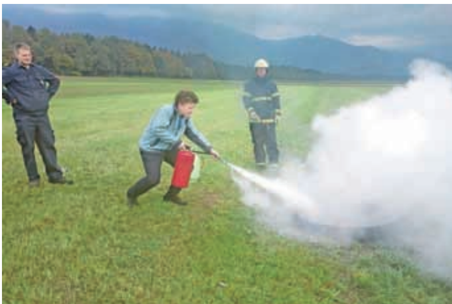
Prikaz uporabe gasilnika