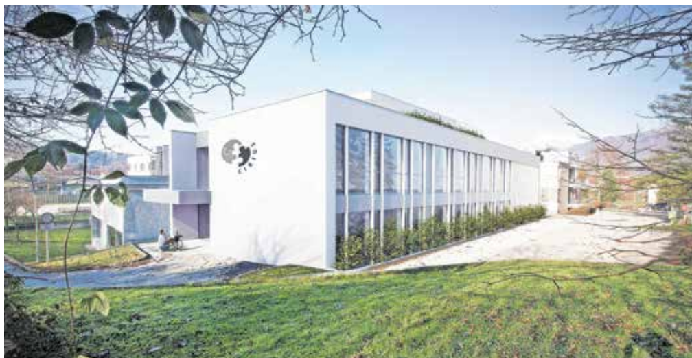
Dodatne prostore bodo začeli uporabljati z novim šolskim letom. / FOTO: CIRIUS KAMNIK

Z novim prizidkom bodo rešili prostorsko stisko, saj se bodo na ta način sprostili nekateri prostori, ki jih zdaj zaseda poseben program vzgoje in izobraževanja. »V zadnjih letih beležimo konstanten vpis otrok in mladostnikov. Se pa s prostorsko stisko za program, za katerega se gradijo prostori, spopadamo že zadnjih osem let. Z novimi prostori bomo predvsem zagotovili dobre pogoje za vzgojno-izobraževalno delo in dobro počutje tako otrok kot zaposlenih,« so nam še pojasnili na Cirusu Kamnik. Ustanova z daljšim imenom Center za izobraževanje, rehabilitacijo in usposabljanje Kamnik deluje od leta 1947 in predstavlja osrednjo državno izobraževalno rehabilitacijsko ustanovo za gibalno ovirane otroke in mladostnike in tiste, ki imajo poleg gibalne oviranosti še druge posebne potrebe.