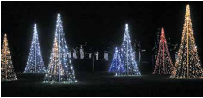
Čarobni gozd

Sprehod med lučkami obiskovalca popelje od enega do drugega prizora, možen pa bo vse do drugega tedna v januarju.