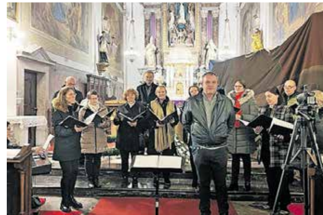
Koncert v cerkvi Marijinega brezmadežnega spočetja na Šutni

Kamnik – Nekako na sredini adventa smo in dan je skoraj dvakrat krajši kot noč, k slabšemu počutju pa v nižje ležečih krajih pripomore tudi megla. Ni čudno torej, da se tako zelo veselimo lučk, ki dodatno razsvetljujejo mesta in naše domove ter napovedujejo skorajšnje izboljšanje. Pevci Komornega pevskega zbora Šutna se tudi veselimo! In sicer vsakoletnega srečanja s pevskimi prijatelji v cerkvi Marijinega brezmadežnega spočetja na Šutni. Z njimi ne zaznamujemo le Marijinega praznika, ampak tudi prijateljstvo ljudi dobre volje in ustvarjanja pevske harmonije. Tokrat smo se družili s Polanskimi dekleti, ki so odprle večer. Zapele so tri pesmi ob kitarski spremljavi. Domači zbor se je predstavil s tremi Marijinimi pesmimi. Da smo lahko prisluhnili milozvočnim melodijam citer, se lahko