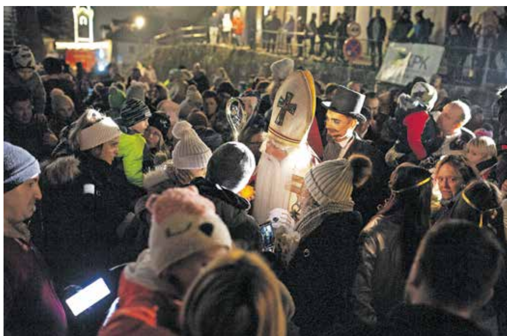
Miklavžev obisk je razveselil otroke.

Že v začetku decembra so otroci kamniških šol in vrtcev okrasili božična drevesca, med katerimi se lahko sprehodijo obiskovalci Šuťne. Glavni trg zaseda drsališče, ob odprtju pa so otroci kamniških vrtcev pripravili tudi novoletni bazar. Želje so oddali v Božičkov nabiralnik, pisma pa so s posebno