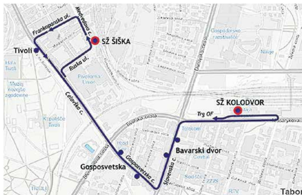
Trasa nove avtobusne povezave med glavno železniško postajo in postajo Ljubljana Šiška

Zaradi prenove železniške in gradnje nove avtobusne postaje, ki se začne v Ljubljani, je v Ljubljani precej sprememb v prometu. Poleg zapore Dunajske ceste je prilagojenih tudi več tras in vozni redov vlakov in avtobusov. Na Slovenskih železnicah so tako že vzpostavili začasno novo postajališče Ljubljana Šiška, ki bo izven prometnih konic končna postaja tudi za kamniški vlak. Kot pojasnjujejo na Slovenskih železnicah, na progi Kamnik Graben-Jarše Mengeš-Domžale-Ljubljana Šiška-Ljubljana ob delavnikih vozil 48 vlakov, od tega 19 do oz. s postaje Ljubljana Šiška. Vsi vlaki, ki bodo vozili do oz. s postaje Ljubljana Šiška, imajo tudi povezavo z novo linijo Ljubljanskega potniškega prometa SŽ Šiška-SŽ Kolodvor. Gre za integrirano ponudbo, ko vo-