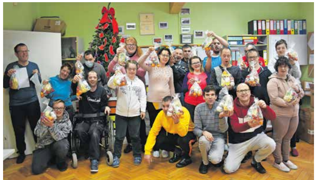
Miklavž je z darili razveselil tudi varovance Sožitja.

darila za prav vsakega od nas. Čeprav smo odrasli, smo ohranili delček otroškega veselja ob odvijanju in občudovanju darilc, hvaležni, da Miklavž, prvi od dobrih decembrskih mož, ni pozabil na nas. Naj ob koncu sežem po besedah občinskega svetnika