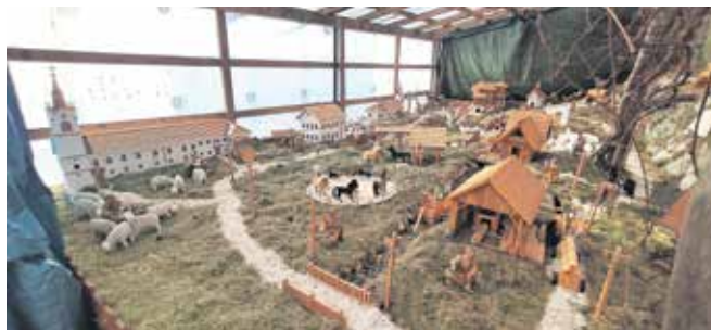
Jaslje Antona Podjeda

Godič – V Godiču je ponovno na ogled razstava jaslje Antona Podjeda, ki vabi obiskovalce, da doživijo čarobnost božične umetnosti. Razstava je odprta na naslovu Godič 81c, Stahovica, vsak dan med 10. in 19. uro. K. P.