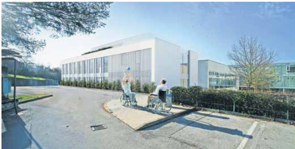
Investicija v nove prostore znaša skoraj štiri milijone evrov.

V objektu v dveh etažah bo šest novih učilnic, po tri v vsakem nadstropju, vsaka pa bo imela tudi sobo za počivanje in jih bodo zaradi gibljivih notranjih sten lahko povezali v en prostor. V vsakem nadstropju bodo sanitarije s previjalnico, v objektu bodo tudi soba za razgovore, soba za umirja-