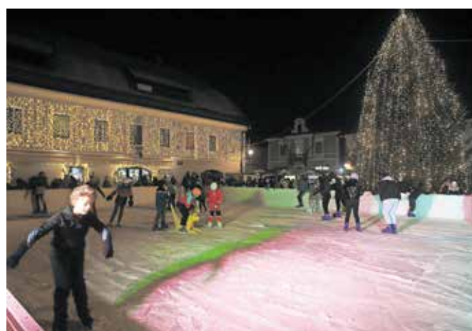
Na drsališču najbolj uživajo otroci.