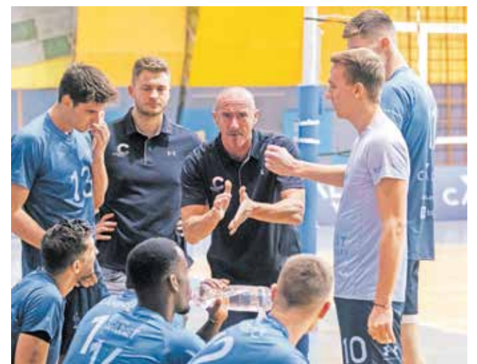
Odbojkarje jutri čaka pomemben obračun.

Vse pohvale si zaslužijo tudi odbojkarice druge članske ekipe Calcita Volleyja, ki so osvojile prvo mesto v 1. B DOL za ženske, in to z veliko prednostjo pred Krimom. Kamniške princeske bodo pod vodstvom Tjaše Gadža sezono nadaljevale v zeleni skupini, v kateri bodo še ATK Grosuplje iz 1. A DOL za ženske ter Krim, Šentvid in Braslovče iz 1. B DOL za ženske. Ali bodo v zeleni skupini igrali tudi odbojkarji druge kamniške moške