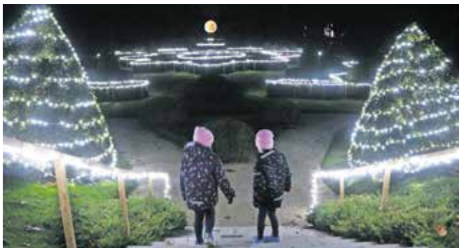
Predvsem najmlajšim večerni sprehod med lučkami spodbudi domišljijo.