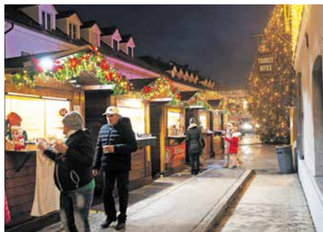
Božično-novoletni sejem, na katerem je mogoče najti tudi lokalne izdelke za obdaritev.