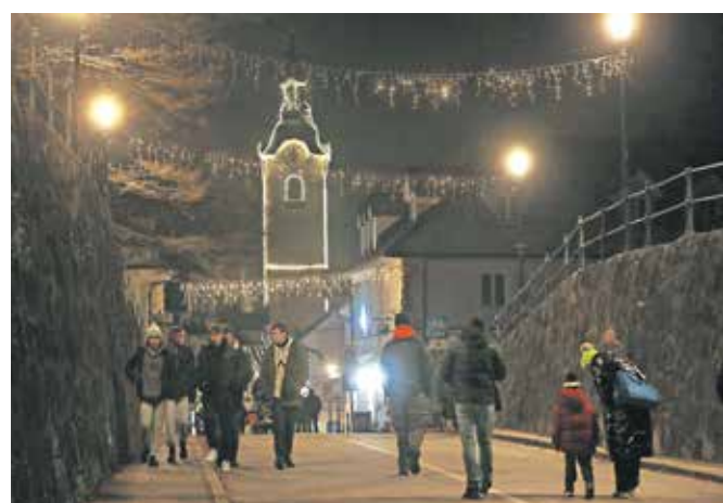
Praznično osvetljeno mesto

pošto odpotovala na Laponsko. Sledil je prižig lučk na božični smreki in praznične okrasitve, ki je razsvetlila stari del mesta.