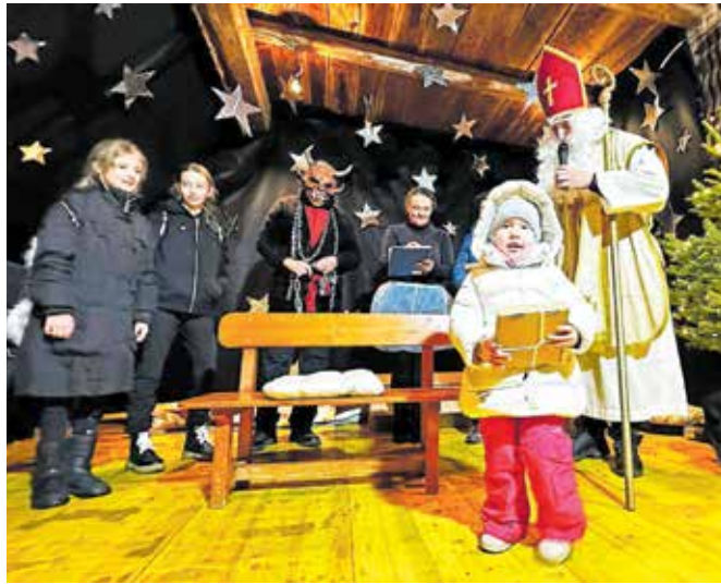
Tudi Brezjane je obiskal Miklavž.