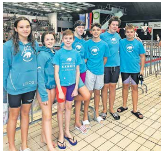
Mladi kamniški plavalci na Mišovem memorialu