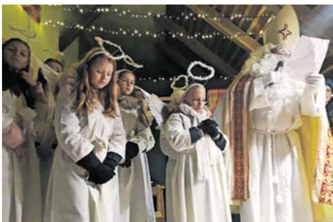
Miklavž v Nevljah