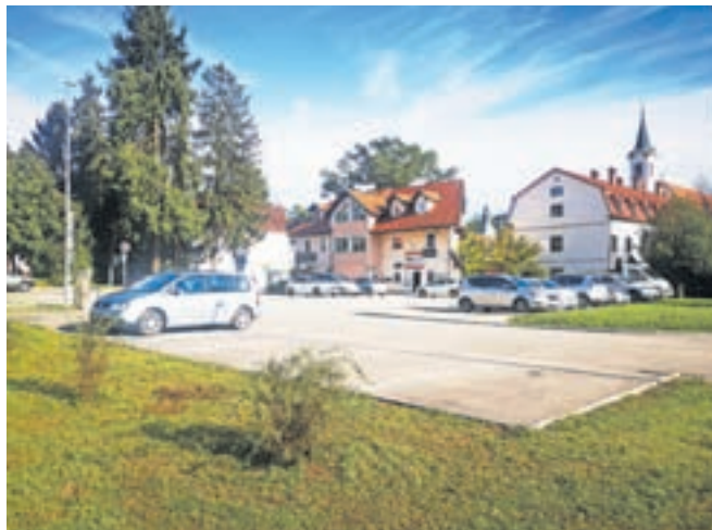
Popisovalci so ugotovili, da je v središču Škofje Loke vedno moč najti prazna parkirišča.

Ob tem naj bi se najprej uveljavile parkirne cone, kjer bi bile različne cene, lahko pa bi bile tudi brezplačne. Znotraj stanovanjskih soosesk naj bi poskušali poiskati dogovore o parkiranju, ki bi bili za določeno sooseko najboljši.