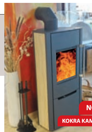
NOVO KOKRA KAMEN