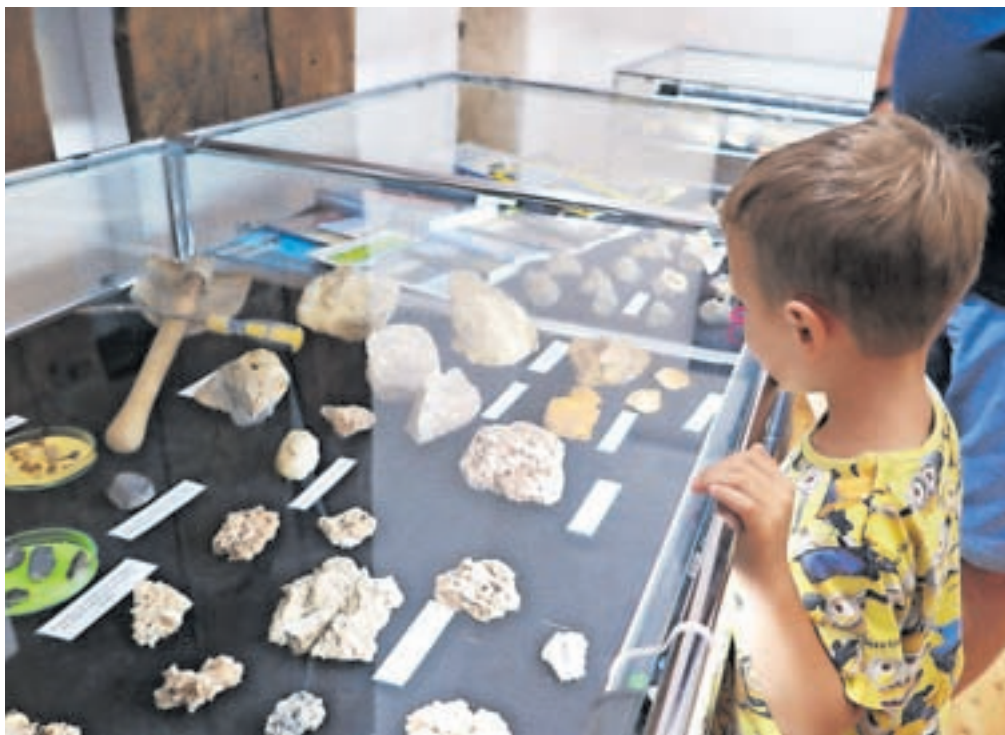
Razstava v cerkvi v Crngrobu je privlačna tako za starejše kot najmlajše.