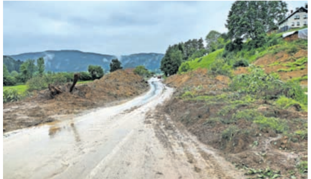
V poplavah so se sprožili številni plazovi, med drugim na glavni cesti v Srednji vasi.

Dela tako potekajo na številnih deloviščih v občini, v nadaljevanju so omenjena le največja. V Delnicah, kjer je hudournik na posameznih mestih povsem odnesel cesto, urejajo novo cesto, v Podobenem pa načrtujejo še ureditev obrežnega varovanja. Na cesti Volča-Podobeno potekajo priprave na vzpostavitev mostu, izdelan je projekt sanacije plazov na cesti v Zakobiljek, zdaj čakajo na izvajalca. Na Volči poteka sanacija večjega števila plazov, od tega dveh na veli-