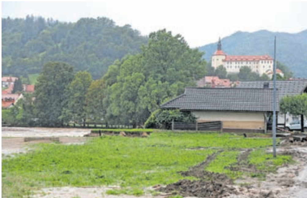
Škoda ob avgustovskih poplavah in zemeljskih plazovih je ogromna.

»To je potrebno, saj želimo, da ceste postanejo čim bolj varne in da se vodotoki, zlasti poškodovani, ki jih je res veliko, vzpostavimo vsaj v prejšnje, če ne v boljše stanje pretočnosti. Prav tako se intenzivno pripravljamo na sanacijo, projektiranje in načrtovanje. Iščejo se rešitve za struge, korita, ogromno dela pa prinašajo tudi sproženi in grozeči zemeljski plazovi. Teh je v naši občini več kot