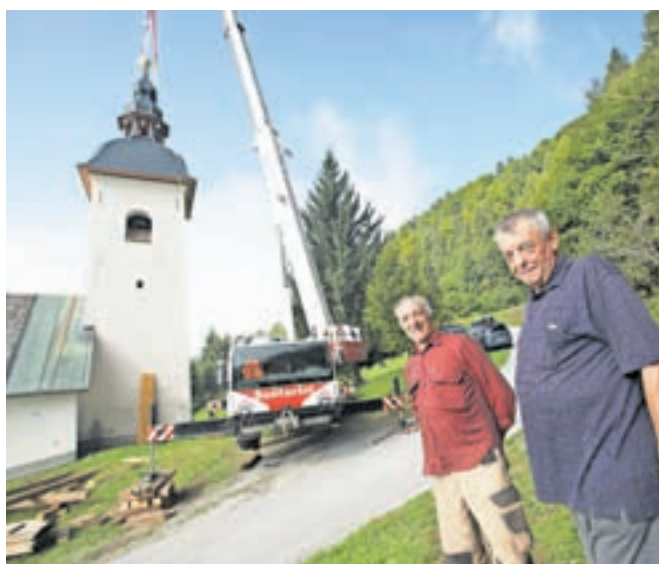
Najbolj zahteven del je bil dvig strešne kupole, težke kar štiri tone, na vrh štirideset metrov visokega zvonika.