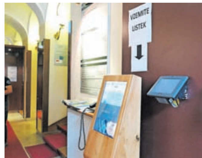
Ob vходу v stavbo Upravne enote po novem prevzamete listek s številko.

pa pomeni, da v primeru daljše čakalne dobe strankam ni več treba stati v vrsti, ampak si ta čas lahko drugače organizirajo, kdaj bodo na vrsti, pa spremljajo po aplikaciji, ki jim sporoča, koliko oseb je še v čakalni vrsti pred njimi.