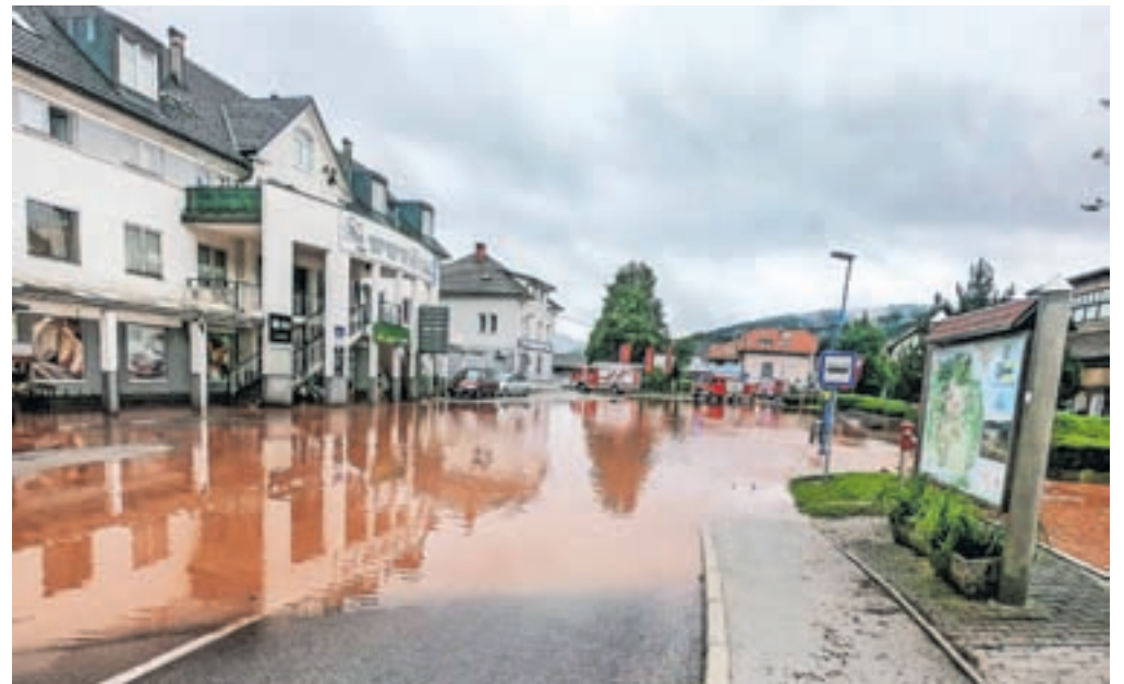
Poplavljen je bilo tudi središče Žirov.

so vsak po svojih močeh in na svojem območju reševali situacijo. »Večino poti smo uredili in po njih znova normalno poteka promet, še vedno pa je zaprt del ceste proti Mrzlemu Vrhu, kjer bodo v okviru sanacije zaradi usadov potrebni večji posegi. Prav tako je težje dostopen