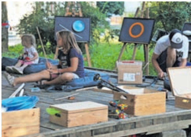
Cirkuške delavnice na letošnjem festivalu

Z letošnjo izvedbo festivala sem zadovoljna, prostora za napredek pa je še veliko. V prihodnosti si želimo še obogatiti program, predvsem s cirkuškimi nastopi, ki so letos vsekakor umanjali. Še vedno sem prepričana, da je bil program dovolj razgiban, tako v smislu samih dogodkov kot tudi publike, saj je zajel vse generacije in tipe obiskovalcev. Na eni strani so bili dnevni obiskovalci, predvsem družine, ki so spoznavali cirkus preko pop up galerije, se preizkušali v žonglerskih veščinah ter se udeležili delavnic. Na drugi strani smo z večernim programom skušali nagovoriti