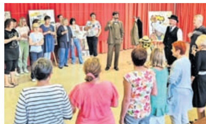
Prireditev so sklenili z zdravico, namenjeno Tavčarju.