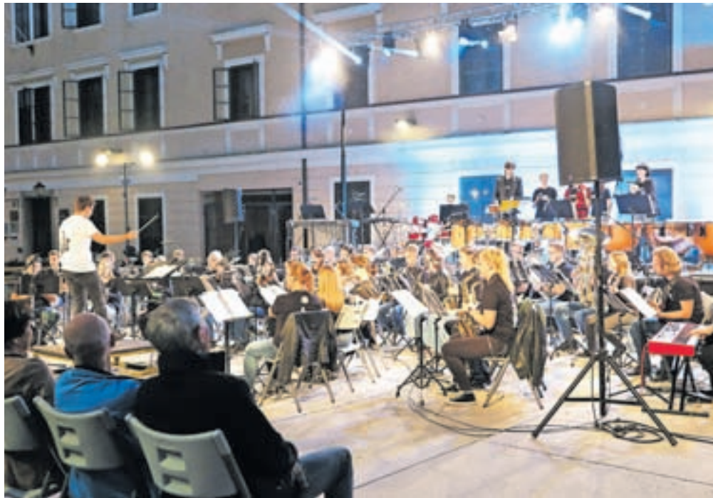
Pihalni orkester Škofja Loka je znova navdušil.

Drugi dan, v soboto, dopoldan pa je Škofja Loka gostila štiri orkestre. V promena-di in skupnem koncertu so nastopili domači Mestni pihalni orkester Škofja Loka, Pihalni orkester Glasbene šole Škofja Loka, Pihalni orkester Alpina Žiri in Pihalni orkester Alpines Železniki.