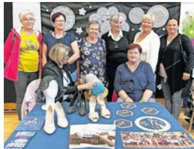
Cvetke na svetovnem čipkarskem kongresu OIDFA v Novi Gorici