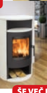
KRANJA KAMEN 160