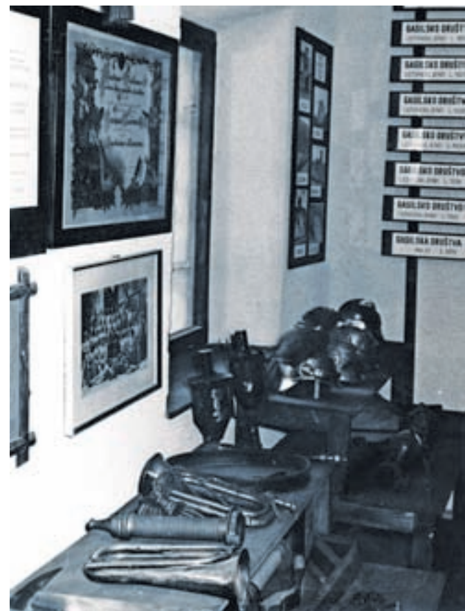
Fotografija gasilske muzejske zbirke v Železnikih iz leta 1978