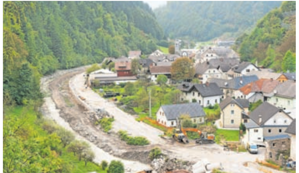
Protipoplavnim ukrepom na Selški Sori mimo starega dela Železnikov sledi še gradnja obvoznice, ki bo potekala na obrežnem zidu.