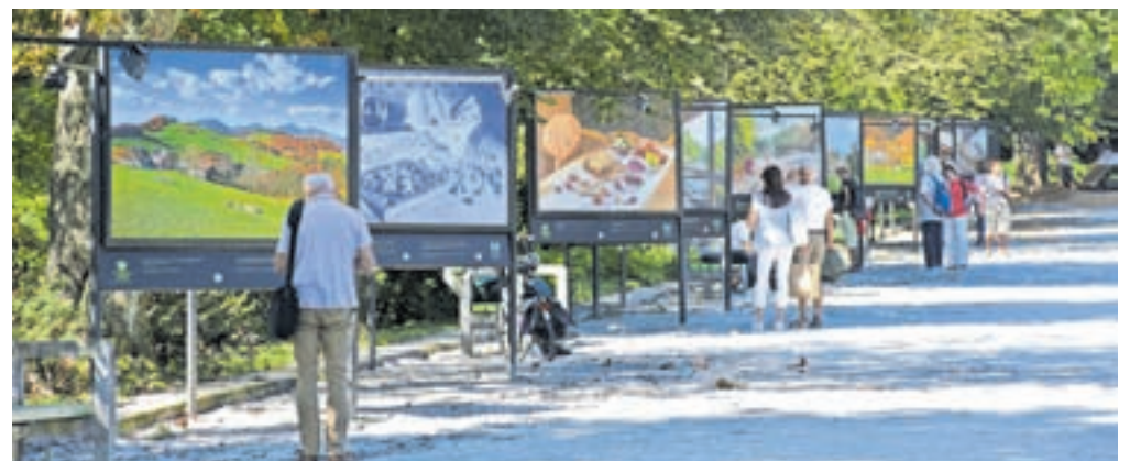
Razstavo Cvetje v jeseni si je na Jakopičevem sprehajališču v parku Tivoli mogoče ogledati do sredine oktobra.

Z razstavljenimi fotografijami so želeli prikazati širino in raznolikost Tavčarjevega udejstvovanja. Razstava je vsebinsko razdeljena na dva dela. »Prvi del osvetljuje življenjsko pot dr. Ivana Tavčarja, priznanega odvetnika,