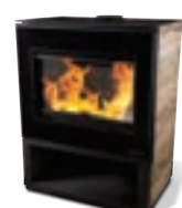
KRPAN KERAMIKA 110