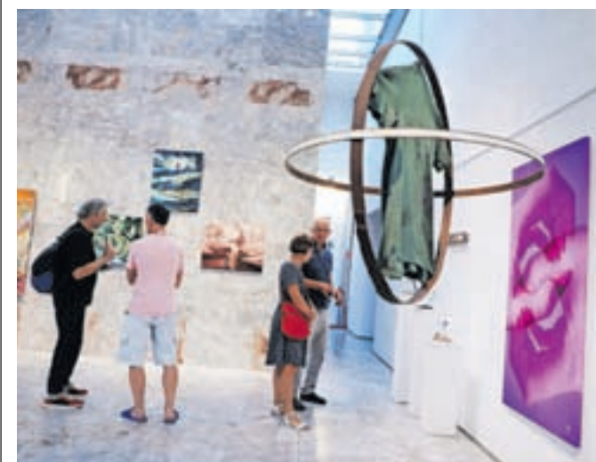
Razstava del kolonije Iveta Šubica je bila v Sokolskem domu, katalog pa bo izšel pozimi.

»Dela umetnikov so zelo različna in ponujajo široko paleto predstav o tem, kaj je umetnik želel povedati. O