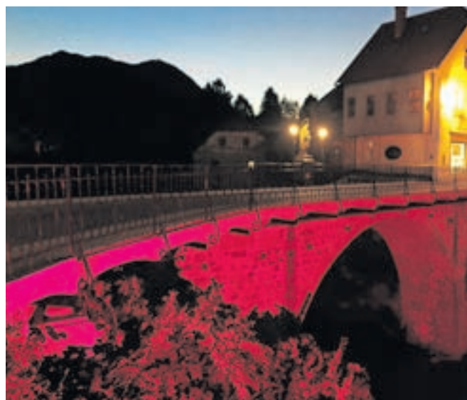
Kamniti most je bil prejšnji konec tedna osvetljen z rdečo lučjo.

Škofja Loka – Humanitarno Društvo bolnikov s krvnimi boleznimi Slovenije svojim članom, bolnikom in njihovim svojcem že 28 let nudi različno podporo, v sodelovanju z medicinskim osebjem pa tudi dodatno strokovno pomoč. Tudi z aktivnostmi ob dnevu krvnih bolezni, 16. septembra, želijo še bolj osvetliti področje krvnih bolezni in njihovo zdravljenje ter še povečati podporo bolnikom. Tako so letos v Ljubljani postavili izobraževalno-informativno stojnico in pripravili pohod v rdečem, v večernih urah so zasijali tudi nekateri pre-