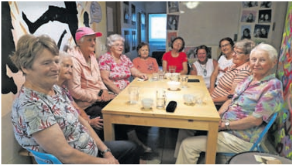
Srečevalnica od letošnjega marca živi tudi na Trati, kjer je poučno in zabavno vsak torek in četrtek.

Letos marca je Srečevalnica zaživela tudi v MDC bloku na Trati, tam pa poteka ob torkih in četrkih med 9. in 12. uro. Podobno kot v Podlubniku se družijo ob ročnih delih, klepetu, igrah, branju, predavanjih, včasih pa se odpravijo tudi na potep. Pred kratkim sem jih zmotila sredi pogovora o tem, kaj lahko naredijo, da bi s Trate ter iz Frankovega in Hafnerjevega naselja imeli lažjo pot z javnim prevozom po opravkih v mesto. »V Škofji Loki se lahko z Jurijem ali Agato pelješ iz Centra slepih, slabovidnih in upokojencev na grad, mi pa z njima niti do mesta ne moremo, čeprav smo povedali, po kateri cesti bi se lah-