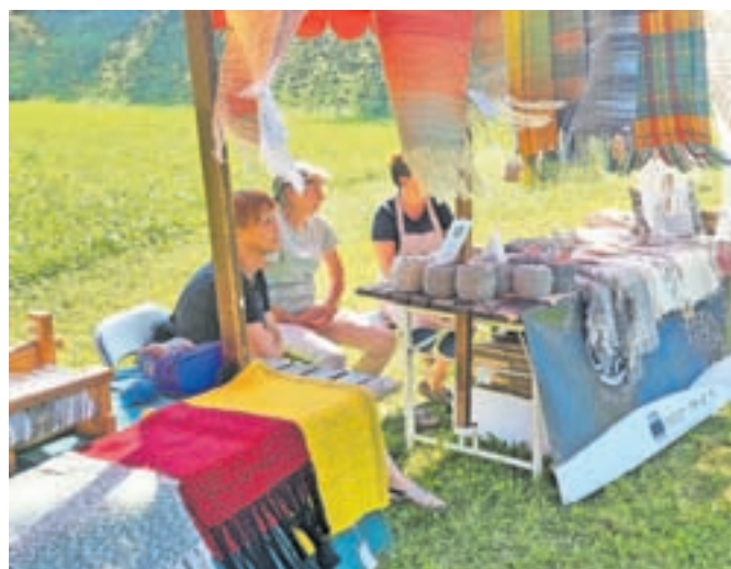
Rokodelci so na Visokem predstavili svojo ustvarjalnost.