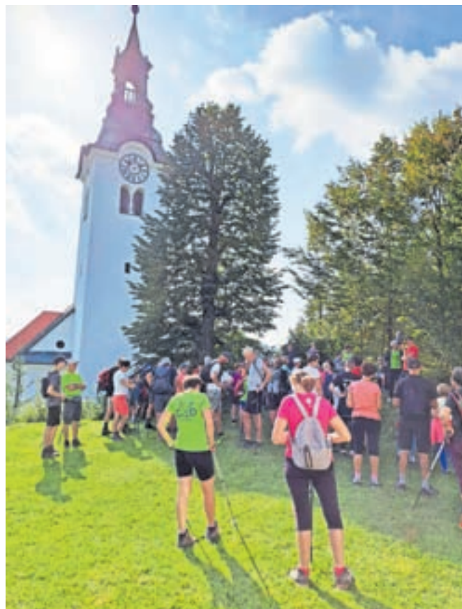
Pohoda se je letos udeležilo več kot 130 pohodnikov.