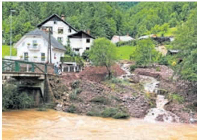
Sprožili so se številni plazovi.

Že takoj po poplavih je bilo na terenu 15 ekip strojnikov z gradbeno mehanizacijo, ki