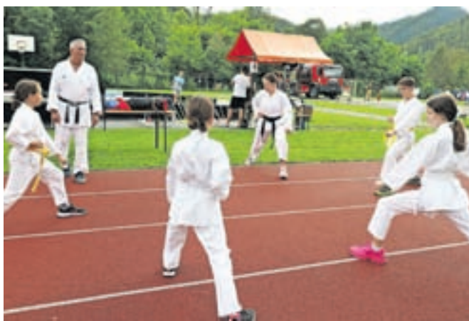
Na letošnji akciji Veter v laseh so sodelovali številni klubi in društva, tudi Judo klub Škofja Loka.

Nekaj prireditev so zaradi slabega vremena prestavili, živahno pa je bilo na Mestnem trgu minulo sredo, ko so pripravili kolesarski dan. Pred občinsko stavbo so postavili stojnico, vsi kolesarji, ki so se pripeljali mimo, pa so dobili malico. V posebnem šotoru je bilo