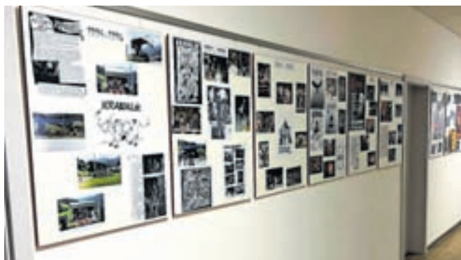
Na hodniku Občine Železniki poteka razstava Krawal 30 let.