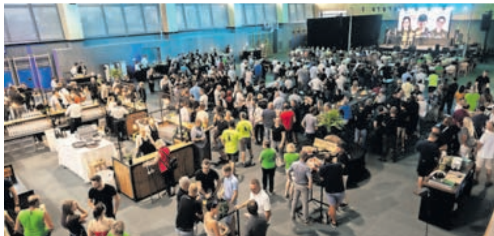
Na prireditvi v športni dvorani v Žireh so zaznamovali 75. obletnico ustanovitve KGZ M Sora in tridesetletnico delovanja njihove enote Norica.

A svet je danes precej drugačen kot pred petimi leti, je poudaril Dolenc. »Žal ni boljši in nič ne kaže, da bo kmalu drugače. Preživeli smo covid, razmetavanje denarja za blaženje njegovih posledic se nam je vrnilo v obliki visoke inflacije, vojna v Ukrajini je povzročila pomanjkanje energije in surovin, cene so poletele v nebo.« A kot pravi Dolenc, so negotovih razmerjavajeni. »Ni bilo lahko, a smo se prilagodili novi realnosti.« Po vseh krizah, je poudaril, je