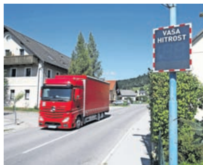
Nov merilnik hitrosti na Loški cesti