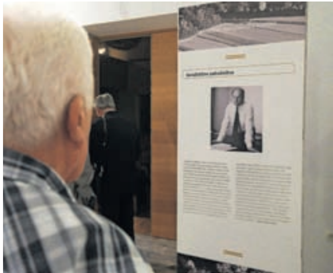
V preddverju Sokolskega doma so pripravili razstavo Kmetijske zadruge ščitijo prebivalstvo na deželi, ki jo je ob 150-letnici zadružništva na Slovenskem pripravila Zadružna zveza Slovenije.