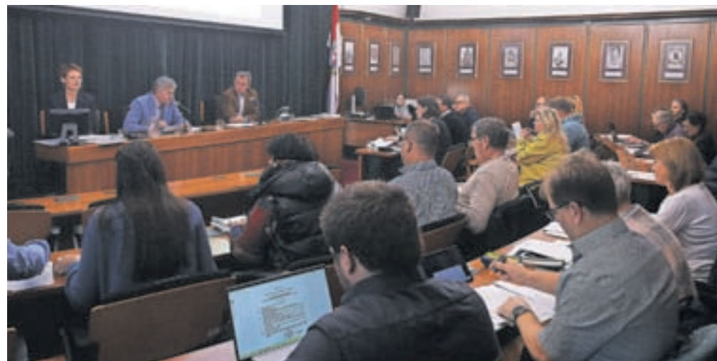
Občinski svet je na novembrski redni seji potrdil rebalans proračuna za letošnje leto in spremembe proračuna za prihodnje leto.