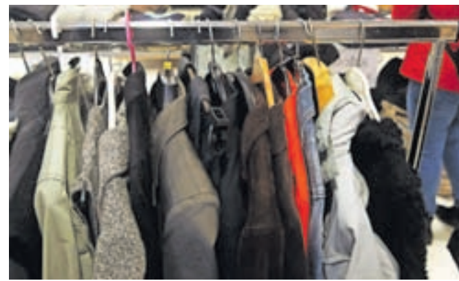
Izmenjava oblačil je v zadnjih letih že postala trend; ljudem se ne zdi več sramotno, če oblečejo nekaj, kar je pred njimi nosil nekdo drug.

smo lepe udeležbe, ljudje ne le prinesejo, ampak tudi odnesejo veliko oblačil, tako da že lahko rečemo, da se je tudi ta način 'nabave' tekstila lepo prijel,« je povedal Gregor Tomše, generalni sekretar fundacije. Posebno, pravi, jih veseli, da prihajajo mladi, pri katerih je izmenjava oblačil v zadnjih letih postala pravi trend; pa tudi starejšim se ne zdi več sramotno, če oblečejo nekaj, kar je pred njimi nosil nekdo drug.