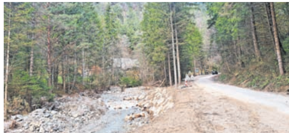
Sredstva so namenjena obnovi v ujmi poškodovanih občinskih cest, med njimi tudi ceste v dolini Draga.

Zaradi nejasnosti glede izračunov pri določitvi cene storitve pomoči na domu pa svetniki niso potrdili predlaganega enajstodstotnega povišanja cen storitve, ki jo izvaja Dom dr. Janka Benedika Radovljica.