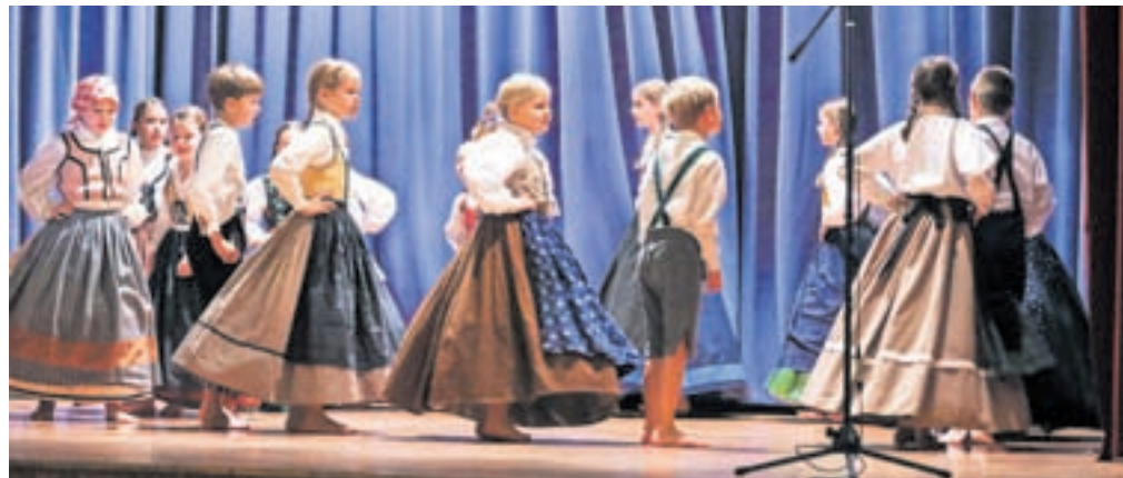
Tudi tokrat je program prireditve popestril nastop otroške folklorne skupine Voše.

predstavila na poljuden, izjemno zanimiv in iskrih način. Občinstvo ji je z navdušenjem pozorno prisluhnilo. Praznovanje v Podnartu je popestril nastop otroške folklorne skupine Voše, zaključil pa krajši koncert violinista Urbana Rozmana in pianista Boruta Zupana.