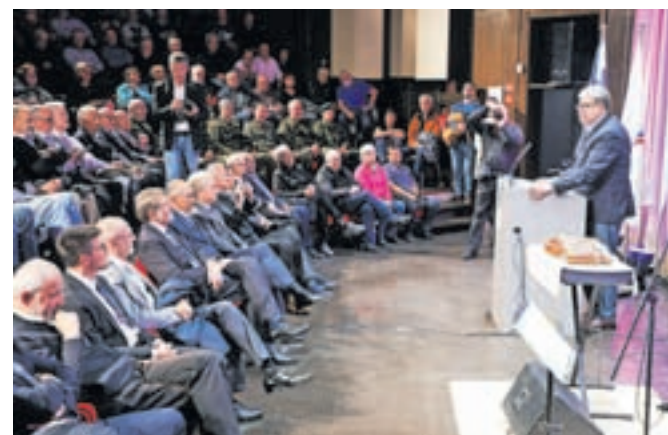
Slavnostni govornik Igor Bavčar je opozoril na prelomnost časa, v katerem živimo.

»Danes je podoba sveta povsem drugačna kot takrat, ko smo snovali samostojno državo. Stebri mednarodne stabilnosti se majejo, svet, kakršen je nastal na rezultatu druge svetovne vojne, odhaja,« je dejal in opozoril na prelomnost časa, v katerem živimo danes. »Treba se je znati soočiti z zgodovino in z odločitvami,