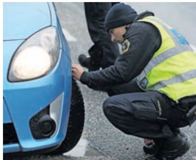
Vsaka pnevmatika naj ima najmanj tri milimetre profila; policisti opozarjajo, da je pomembna tudi starost pnevmatik.