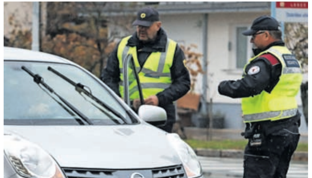
Policisti in občinski redarji redno sodelujejo, tokrat so bili skupaj v preventivni akciji, s katero so voznike opozarjali na primerno zimsko opremo.

»Opozorili smo jih, da morajo biti vozila tehnično brezhibna, in jim priporočili, da se izogibajo uporabi letnih pnevmatik v kombinaciji z verigami.«