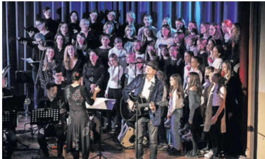
Mladinski in učiteljski pevski zbori OŠ A. T. Linhartaradovljica in Vlado Kreslin so konec novembra navdušili na odru kulturnega doma v Podnartu.

praznoval sedemdeseti rojstni dan. Skozi Kreslinovo glasbo je zbrane popeljalo skoraj 60 pevcev mladinskega in učiteljskega pevskega zbora OŠ A. T. Linhartaradovljica, ki so jih spremljali instrumentalisti skupine Orion. Koncert je organiziralo Kulturno društvo Podnart.