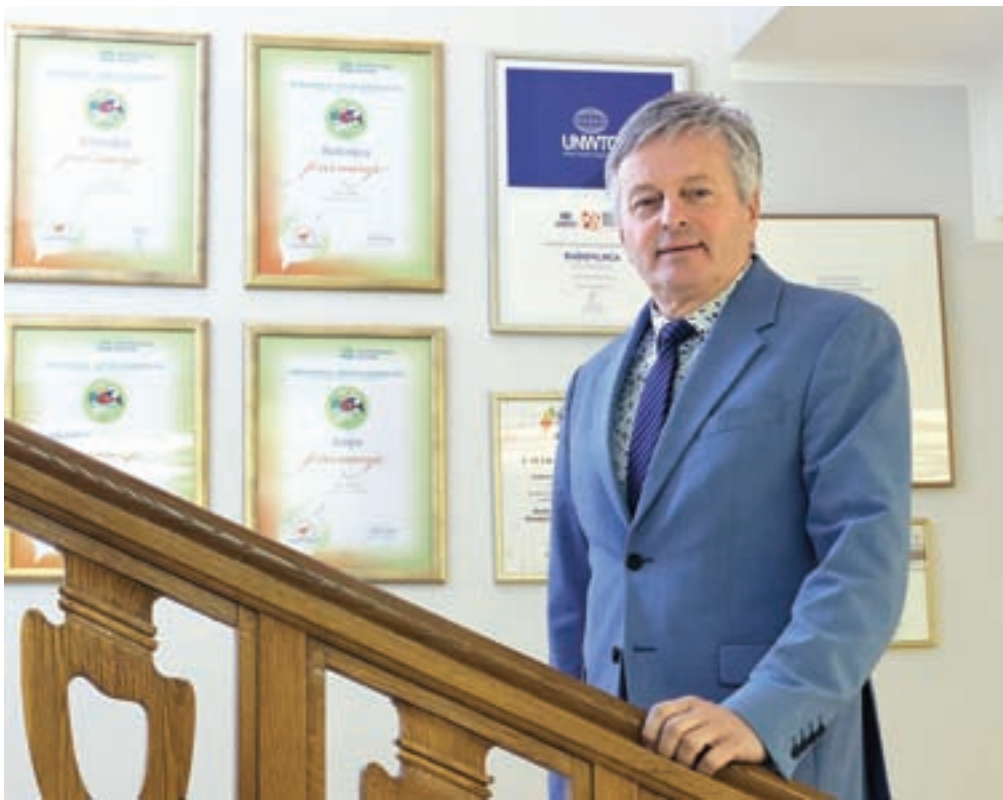
Župan Ciril Globočnik

Na področju oskrbe starejših je bila sicer letos v občini uvedena nova nadstandar-