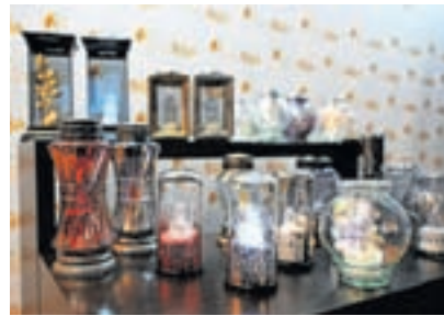
Novost pri elektronskih svečah je tudi goreči angelček.

čilnost je, da dolgo gorijo; v litrski embalaži tudi do dva tedna, kar izdelek poceni v primerjavi z drugimi ponudniki in ga obenem naredi bolj trajnostnega. K slednjemu pripomore tudi možnost recikliranja in s tem ponovne uporabe embalaže.