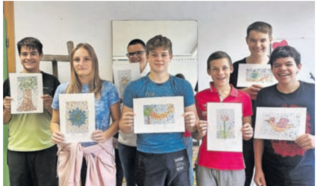
Skupno je nastalo dvajset risb, ki že krasijo stene prijaznih ljudi, ki so sodelovali na dobrodelni dražbi.