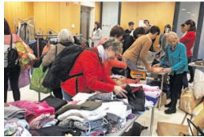
Tudi tokratna izmenjevalnica je v zgornje nadstropje radovljiške knjižnice privabila veliko ljudi.

Z dogodkom so bili zadovoljni tudi v Fundaciji Vincenca Drakslerja. »Veseli