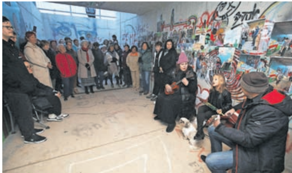
Tudi odprtje poslikanega podhoda je bil pravi umetniški dogodek v malem. Popestril ga je imeniten nastop glasbeno-gledališke družine Vester-Trseglav iz Radovljice.

Izrazil pa je tudi pričakovanje, da bodo vsi tisti, ki podhod uporabljajo, znali ceniti opravljeno delo in da bodo nove poslikave tudi v prihodnje ostale takšne, kot so v osnovi – iskreno in zanimivo umetniško delo.