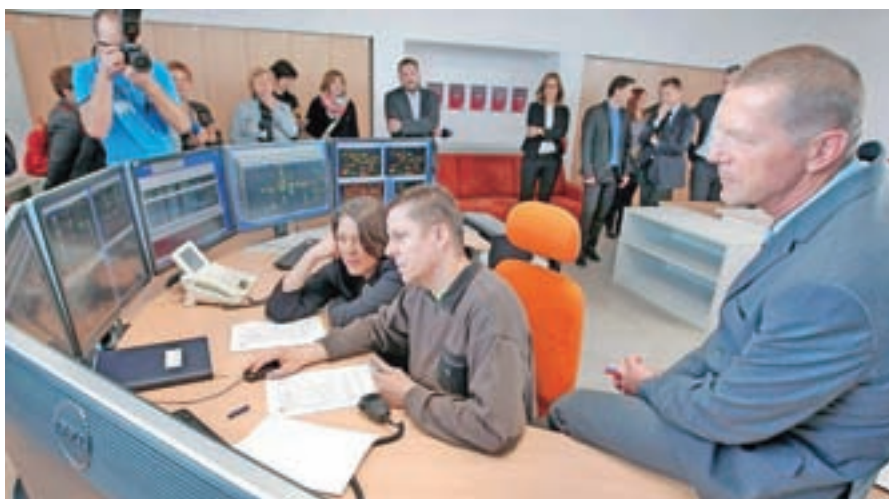
Nov distribucijski center vodenja sta svojemu namenu uradno predala evropska komisarka za mobilnost in promet Violeta Bulc in predsednik uprave Bojan Luskovec.