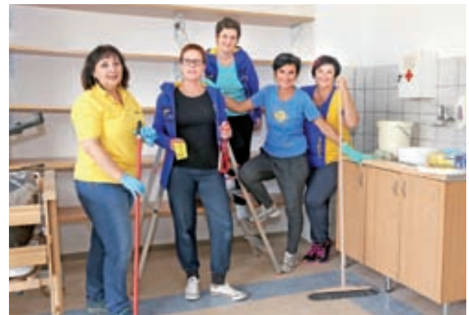
GOODYEAR DUNLOP SAVA TIRES, D.O.O., ŠKOFJELOŠKA CESTA 6, KRANJ