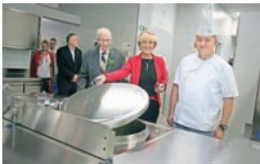
Od oktobra imajo prenovljeno in dograjeno kuhinjo.