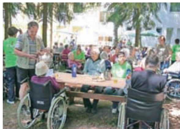
Vsakoletni piknik stanovalcev, svojcev in zaposlenih je lepo skupno doživetje.