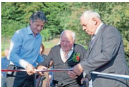
Pomembna pridobitev letošnjega leta je tudi urejen park, ki so ga odprli konec septembra.