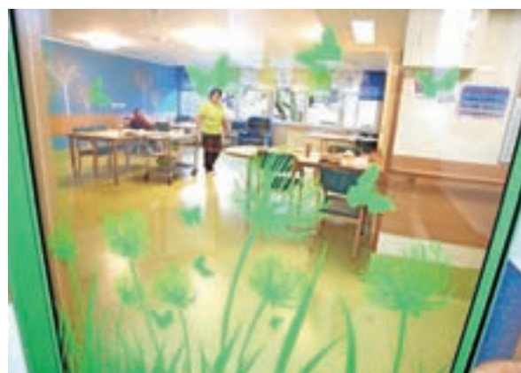
Letos so odprli obnovljeni oddelek Livada v prvem nadstropju Centra.