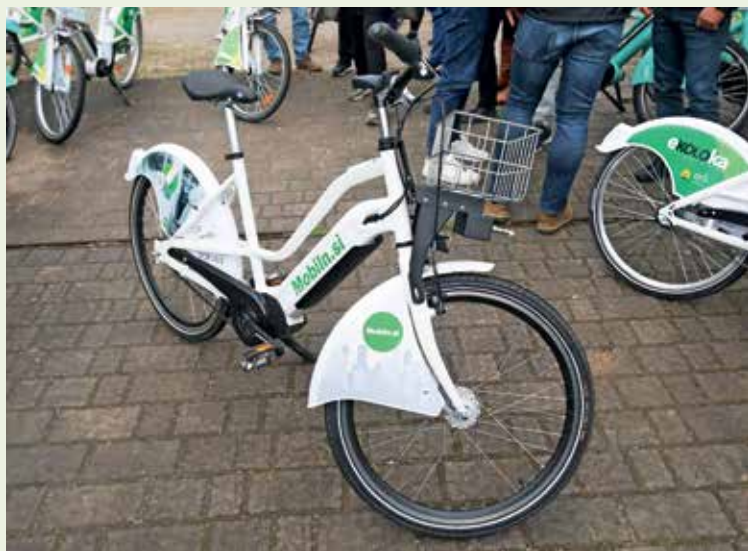
V sistemu eKOLOka je na voljo 25 električnih in 24 navadnih koles.

Kot se za postanek na kolesarskem izletu spodobi, pa je Janja Bernik na družinski kmetiji Punčar udeležencem postregla z loško medlo z ajdovo moko in maslom,