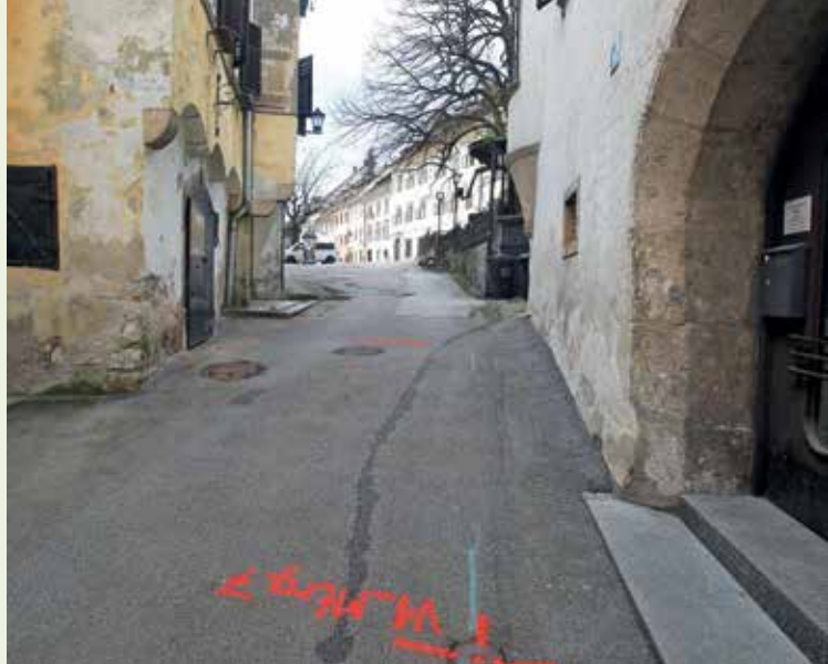
Dela na Mestnem trgu se bodo začela iz smeri cerkve svetega Jakoba proti Mestnemu trgu.

Dnevi Škofjeloškega pasijona so bili letos še posebno široki, bolj geografsko razpršeni. Deležni smo bili čudovitega dogajanja, ki je v naše mesto prineslo pasijonski duh v predvelikonočnem in velikonočnem času ter hkrati že najavilo novo uprizoritev Škofjeloškega pasijona