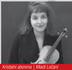
Kristalni abonma | Mladi Ločani