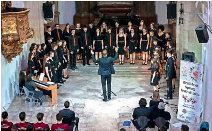
Škofjeloški gimnazijci so občinstvo še posebno navdušili z zaključno skladbo Ritmo.

veda ne preseneča, da mu je žirija namenila kar 96 točk od 100 možnih, kar je pomenilo zlato priznanje in zmago v kategoriji zborov do 21 let, hkrati pa je postal tudi zmagovalni zbor celotnega tekmovanja.