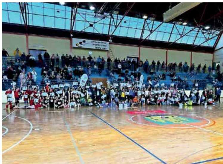
Mladi so tekmovali v dvorani na Podnu.

To je bil letos že tretji turnir, prav dva sta bila v Radovljici in Trzinu. Na njih mladi igralci pokažejo, kaj so se naučili na treningih, in so jim dobra motivacija za nadaljnje treninge.