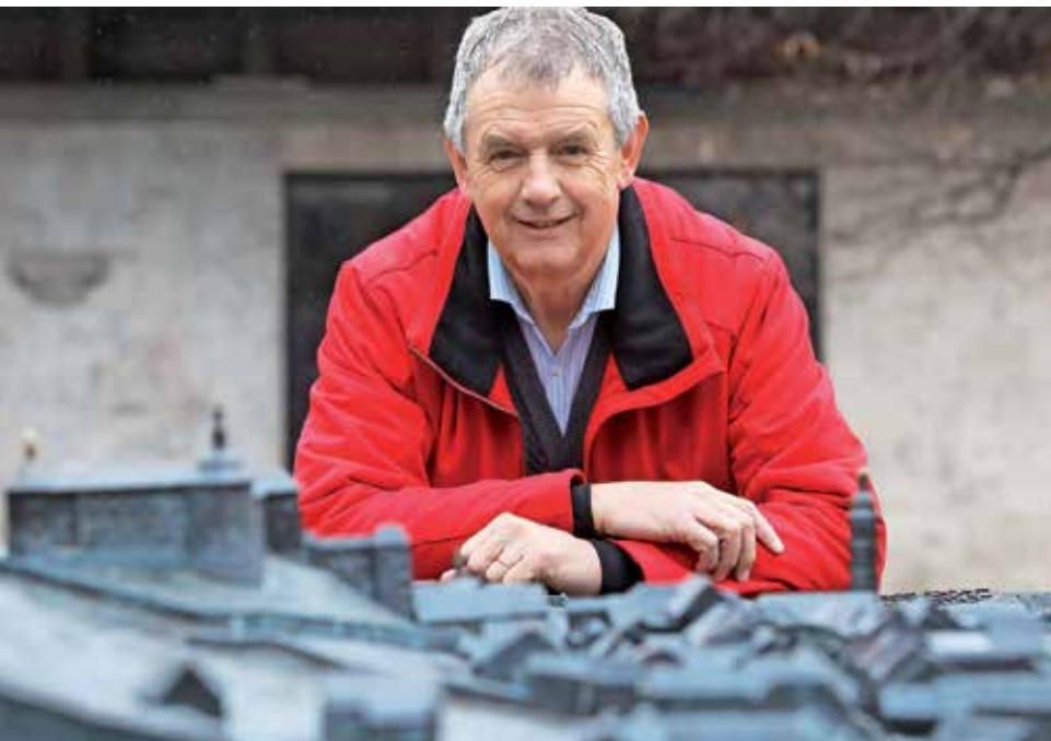
Za študij ekonomije se je odločil, ker je imel občutek, da ponuja več možnosti; ljubezen do zgodovine pa je ostala in je prišla na plan skozi delovanje ob tisočletnici Godešiča in v muzejskem društvu.

Največja sprememba, ki jo opazim kot predavatelj, je drugačen odnos s študenti – se spoštujemo, obenem pa so odnosi med nami zelo odprti in tega sem vesel. V času, ko sem sam študiral, je bila namreč razdalja v odnosu med profesorji in študenti veliko večja.