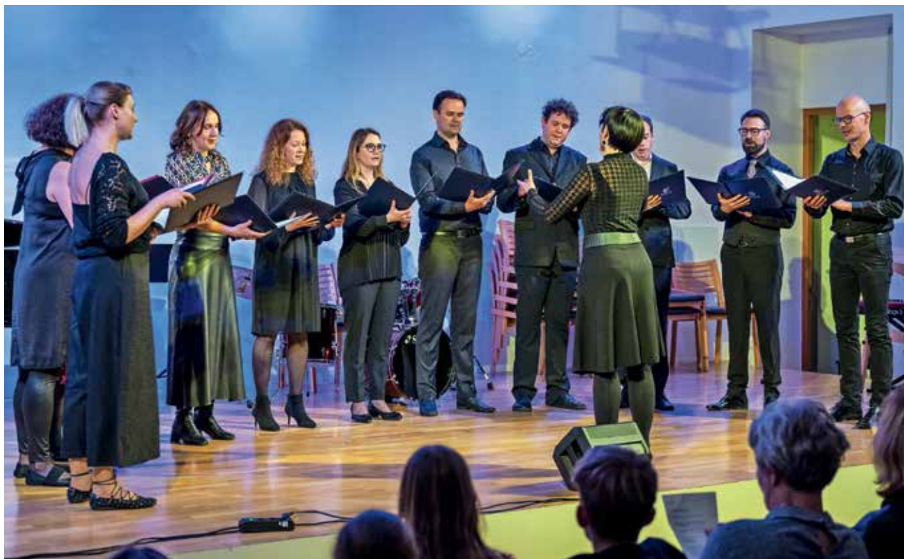
Vokalna skupina Ad hoc je presenetila z zimzeleno Brez besed Mojmirja Sepeta in Elze Budau.

žilice nujno potreben za ustvarjalno in kvalitetno poučevanje glasbene umetnosti.