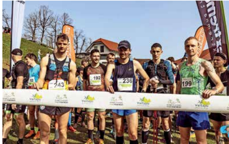
Na štartu se je zbralo 215 tekmovalk in tekmovalcev.