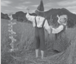
Otroški abonma | Na planincih luštno je