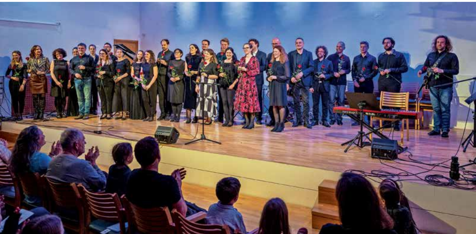
Osemindvajset učiteljic in učiteljev škofjeloške glasbene šole je pripravilo raznolik koncertni program.

larnejših zvrsti večnih zimzelenih Sepeta, Myleasa in Dorhama) je pokazal ne samo raznolikost in barvitost udeleževanja glasbenih pedagogov, temveč tudi visok nivo glasbenega poustvarjanja, ki je poleg pedagoške