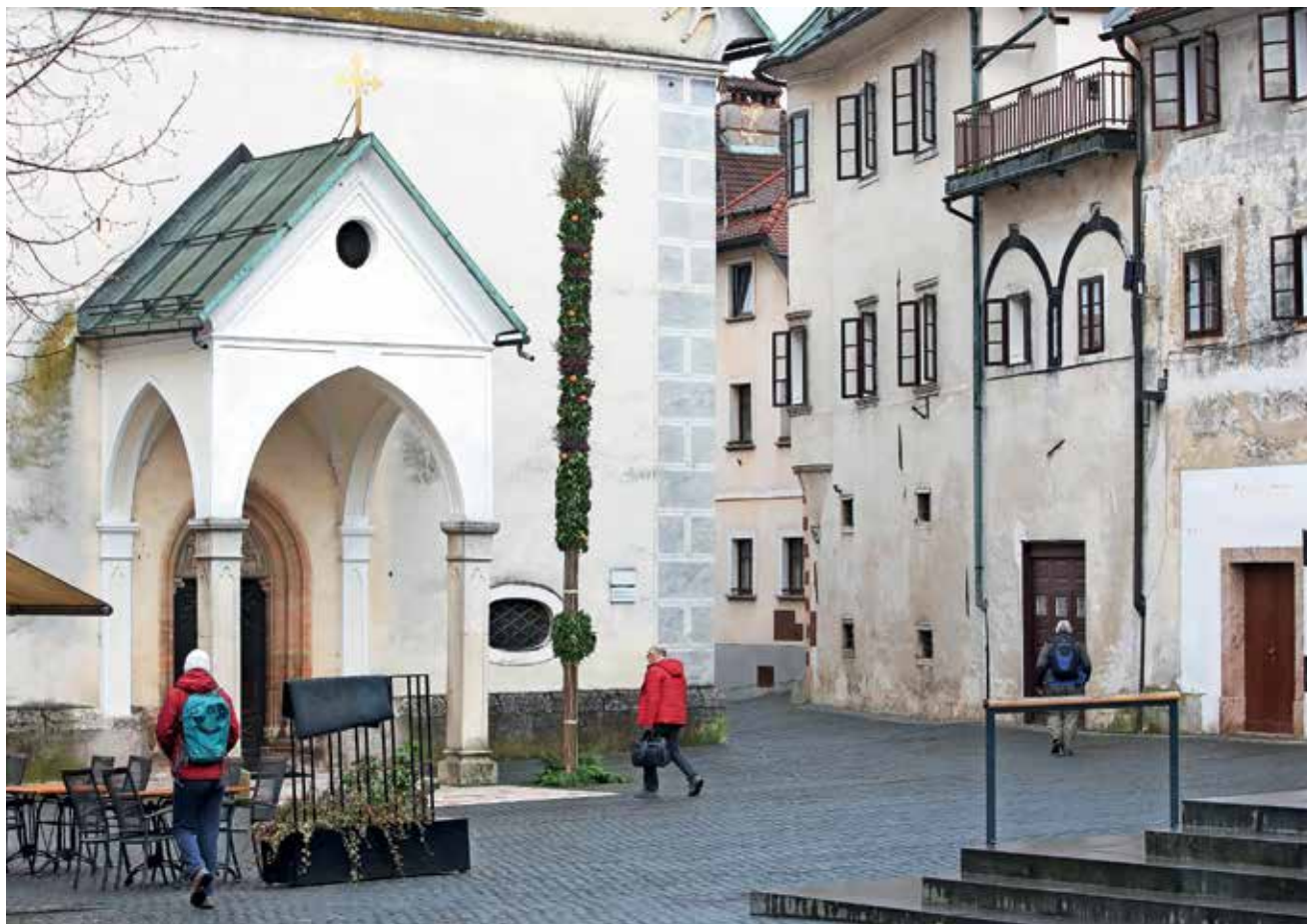
Na velikonočno soboto so po tradiciji pred cerkvijo sv. Jakoba na Cankarjevem trgu Loški skavti – s pomočjo nekdanjih skavtov, pa tudi staršev in župnika – izdelovali butaro velikanko, ki so jo nato postavili ob vhodna vrata v cerkev. V. S.