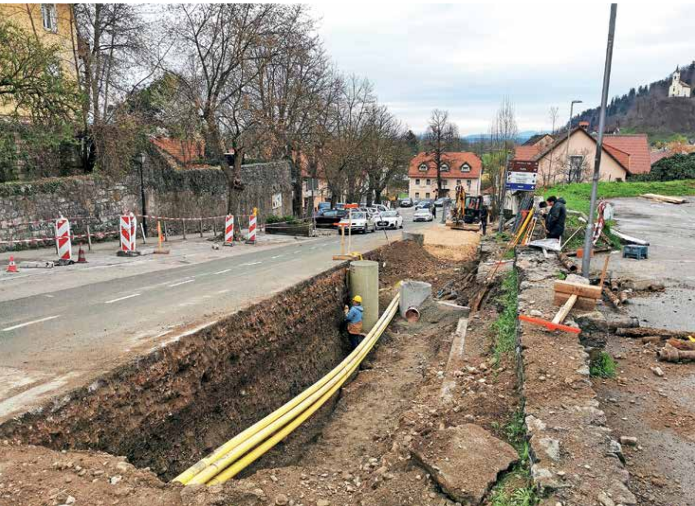
Na območju Grabna trenutno potekajo obsežna zemeljska dela.

Obzidje je Škofji Loki zagotavljalo varnost, hkrati pa je bilo zunanji znak mestnih pravic. Za potrebo po dodatni varnosti so obzidje obdali še z obrambnim jarkom – grabnom.