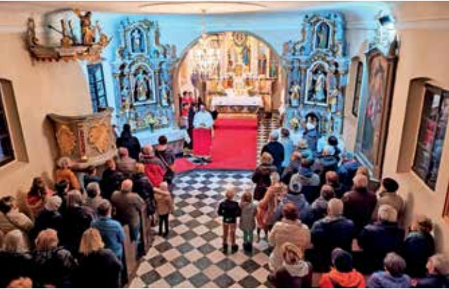
Romanje so zaključili z udeležbo pri praznični maši.

Na praznik sv. Jožefa, v torek, 19. marca, je Prosvetno društvo Sotočje organiziralo romanje k njemu posvečeni cerkvi na Hujah v Kranju.