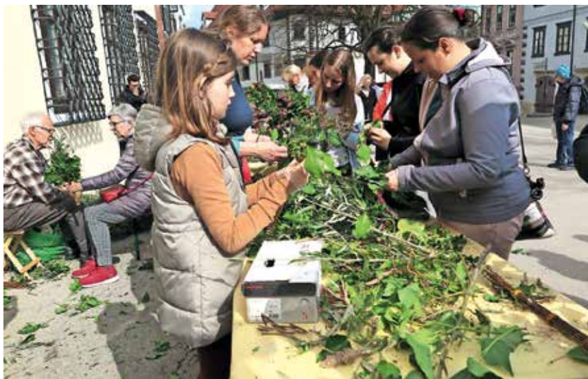
Na cvetno soboto so na Mestnem trgu izdelovali tudi butarice.

V kapucinski cerkvi sv. Ane bo 12. aprila ob 19.30 predstavitev pasijonskih slik, razmišljanje o Škofjeloškem pasijonu pa bo pripravil Marjan Kokalj. Obogatila ga bo gostujoča pasijonska igra članov Kulturnega