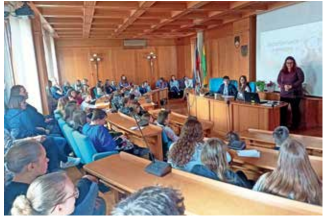
Udeleženci občinskega otroškega parlamenta so razpravljali o duševnem zdravju.