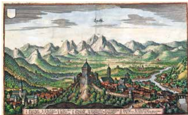
Pogled na mesto Škofja Loka po Merianu iz leta 1649, kjer je lepo vidno tudi mestno obzidje z jarkom.

V letu 1399 so gradbena dela za izdelavo mestnega jarka potekala 18 tednov od 18. maja dalje. Sodelovali so zidarji, lomilci kamenja, delavci, ki so pripravljali malto, in hlapci. Gradbeni stroški so znašali 130 mark. V letu 1400 se je obseg del povečal. O tem priča podatek, da so za zidarska dela samo v obdobju od 25. aprila do 25. julija porabili 5039 vozov kamenja, 644 vozov peska in 222 vozov apna. Skupni izdatek celoletnih gradbenih stroškov pa je znašal 441 mark. V letu 1401 so se gradbena dela začela umirjati. Skupno so trajala 33 tednov od februarja do oktobra, porabili pa so 4928 vozov kamenja