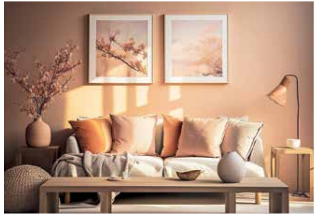
Ker je marelična v jedru oranžna, se odlično ujema s komplementarno lestvico oranžnih odtenkov.

Marelična barva vpliva tudi na počutje, denimo ljubezen in romantiko. »Romantičen odtenek marelice simbolizira ljubezen, naklonjenost in toplino. Spodbuja ljubeč in skrben odnos med partnerji ter je nepogrešljiv del poročnih dekoracij.«