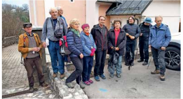
Romarji iz Stare Loke na cilju pred cerkvijo sv. Jožefa na Hujah