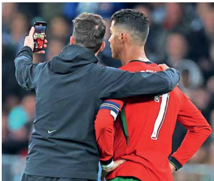
Ronaldo je Kozeljev vdor na zelenico sprejel mirno. / Foto: Borut Živulović/Boho

Policijski upravi Ljubljana so povedali, da so med tekmo zabeležili zgolj eno kršitev. »Med samo tekmo je bila beležena le ena kršitev, kjer je navijač stekel na igrišče. Varnostna služba ga je z igrišča odstranila in predala v postopek policiji. Na podlagi 38. člena Zakona o javnih zbiranjih mu je bila izrečena globa v višini 250 evrov,«