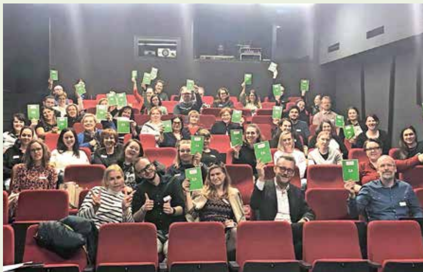
Člani Združenja KUDUS so se zbrali na redni letni skupščini v Velenju. / Foto: arhiv Zavoda 973

V Združenje KUDUS so vključene zainteresirane pravne osebe, ki izvajajo kulturne programe v javnem interesu s ciljem medsebojnega sodelovanja, uveljavljanja in zaščite njihovih interesov ter izmenjave dobrih pra-