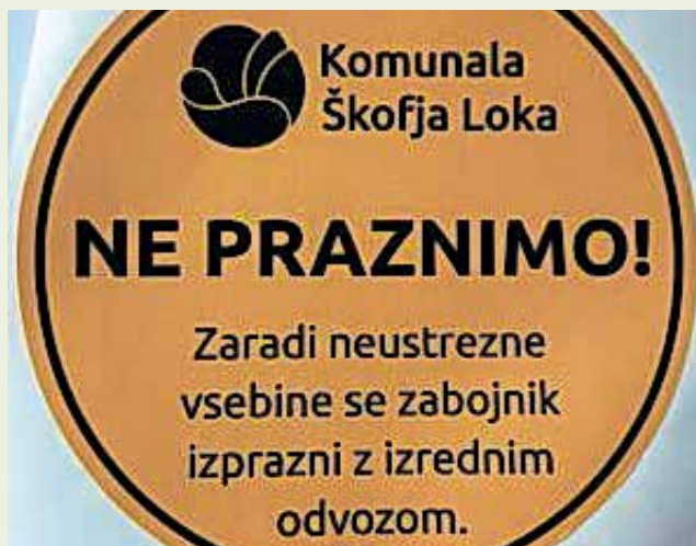
Na nepravilno odlaganje smeti bodo občane opozarjali z nalepkami.

Nalepke z napisom Ne pobiramo se bodo pojavljale na netipiziranih vrečah, za katere stranke menijo, da sodijo v službo odvoza odpadkov in jih zato postavijo zraven polnih zabojnikov. Teh vreč zaposleni ne pobirajo, saj niso vključene v strošek rednega odvoza odpadkov. Pobirajo pa smeti, ki so na dan odvoza v tipizirani vreči. Te vreče lahko uporabniki kupite na blagajni sedeža podjetja po veljavnem ceniku. V primeru, da bo stranka sporočila, da smeti niso odpeljali, izkazalo pa se bo, da so označene z nalepko, se bodo zaračunali dodatni stroški.