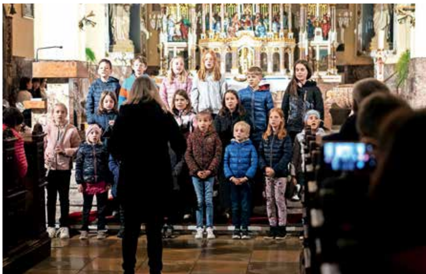
V Stari Loki so pripravili pasijonski večer.

Na veliki petek je po mestnem središču Škofje Loke potekal križev pot, na velikonočni ponedeljek pa je bil v cerkvi Marije Brezmadežne oziroma Nunski cerkvi velikonočni koncert Orkestra Amadeo.