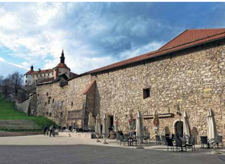
Pogled na del ohranjenega loškega mestnega obzidja od Martinove hiše proti Loškemu gradu

ga gospostva 1346 mark. Kljub mogočni in dragi gradnji sta mestno obzidje in jarek skozi stoletja odslužila svojemu namenu in postajala vse večja ovira pri razvoju in širitvi mesta. Tako so mestno obzidje leta 1789 opustili, podrli obrambne stolpe, mestna vrata pa prodali na dražbi. Obzidje se je počasi začelo podirati, izdatno pa so k temu procesu pripomogli tudi loški meščani, ki so kamenje odnašali in ga uporabljali kot gradbeni material pri zidavi in popravljanju svojih hiš. Tako je obzidje počasi izginjalo. Danes je ohranjeno še na predelu od Kamnitega mostu proti Vincarjem in od Martinove hiše proti Loškemu gradu, kjer je deloma viden tudi mestni jarek. Kot ste prebivalci starega mestnega jedra najverjetneje že opazili, na področju Grabna že nekaj časa poteka strojni izkop, ki se bo v tej fazi nadaljeval vse do vrha klanca do nekdanjih Poljanskih mestnih vrat. Ker gre za zaščiteno mestno območje, se ob tem izvaja tudi arheološki nadzor. O morebitnih odkritjih vas bomo sproti obveščali.