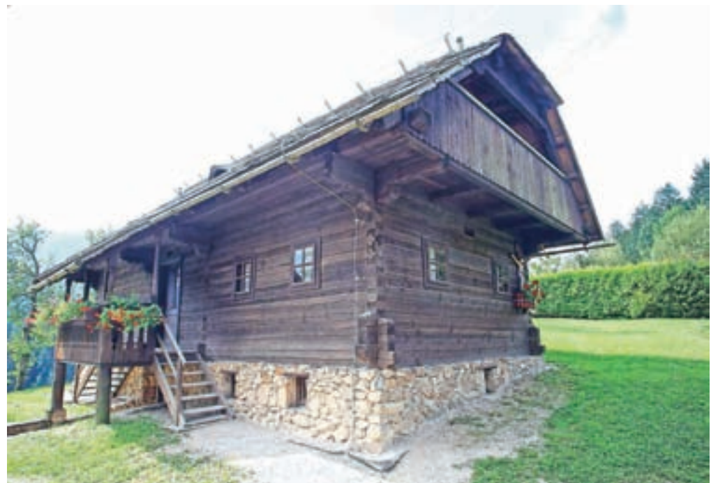
Prežihova bajta na Preškem Vrhu, ki jo je Vorančev oče kupil leta 1911. Sedaj je v njej muzej.