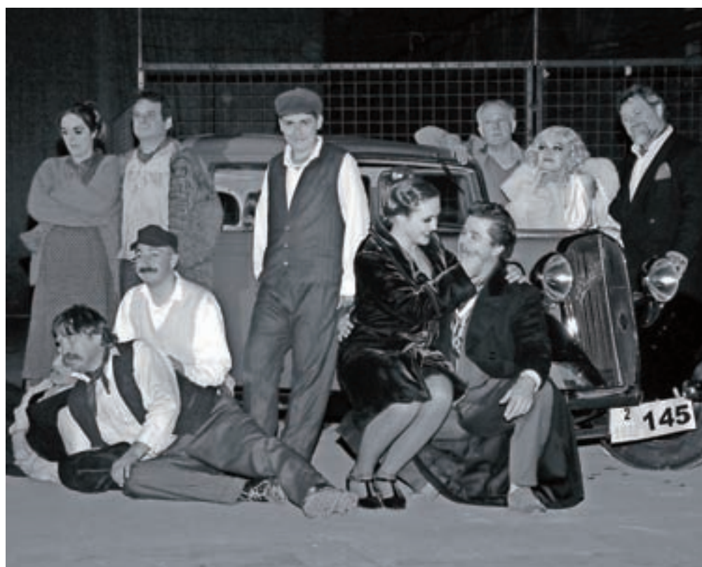
Ena Čufarjevih najpomembnejših literarnih stvaritev je drama Polom, ki so jo na Jesenicah uprizorili večkrat, nazadnje 14. novembra 2005, na stoletnico Čufarjevega rojstva. Velika ambientalna uprizoritev proletarske drame je potekala v nekdanjem železarskem obratu, v proizvodni hali podjetja SIJ Acroni.

»Njegovo ime živi,« poudarja sogovornica, ki ji je žal, da na njenih knjižnih policah ni več rdečih knjig, zbranih del Toneta Čufarja s številkami 10 in več. »Iz pripovedovanj vemo, da je zadnjo noč, preden je ugasnilo njegovo življenje, snoval novo literarno delo, ki ga je nameraval nasloviti Lipe. A njegove lipe niso nikoli ozelenele ...«