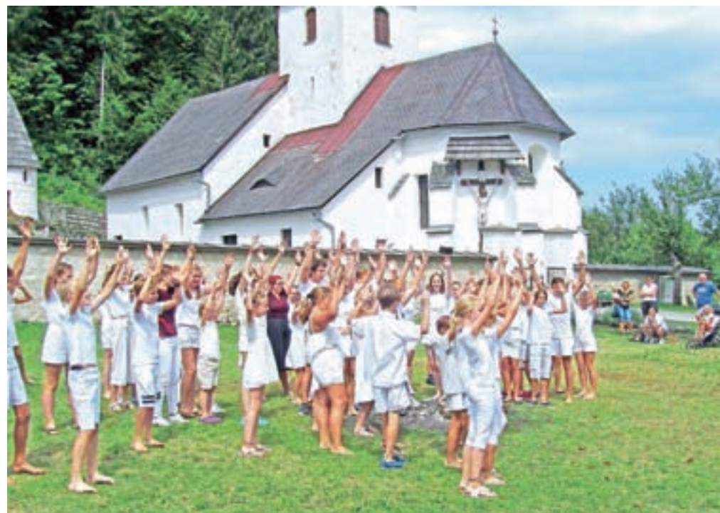
Mladost in razigranost pred cerkvijo svetega Jerneja