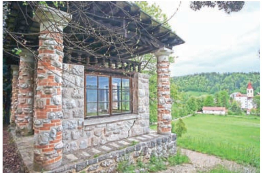
Na robu čudovitega gradu graščine Katzenstein si je moč ogledati kapelico Jožamurka in paviljon Brezjanka; v času pred drugo svetovno vojno ju je zasnoval arhitekt Jože Plečnik.