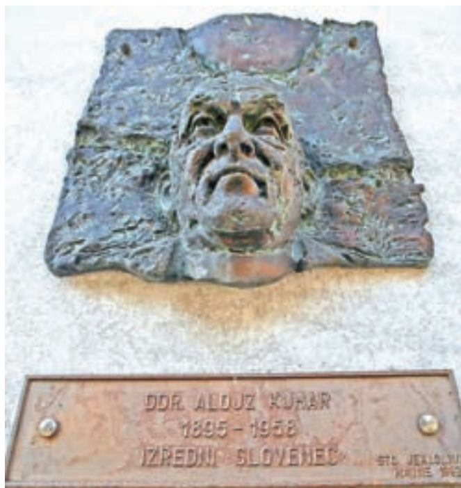
Obeležje Vorančevemu bratu Alojziju, duhovniku, politiku in časnikarju na pročelju kotuljskega župnišča. Kotuljani upajo, da bo nekoč počival v domači zemlji.