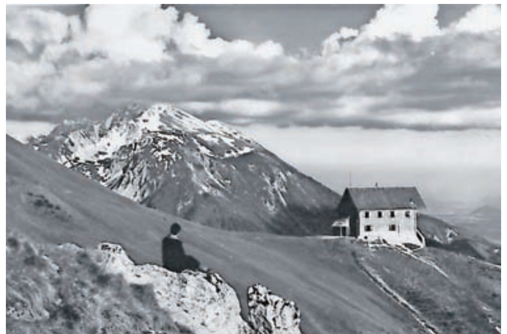
Nemško ali Spodnjo koč na Golici je zgradilo Nemško-avstrijsko planinsko društvo.