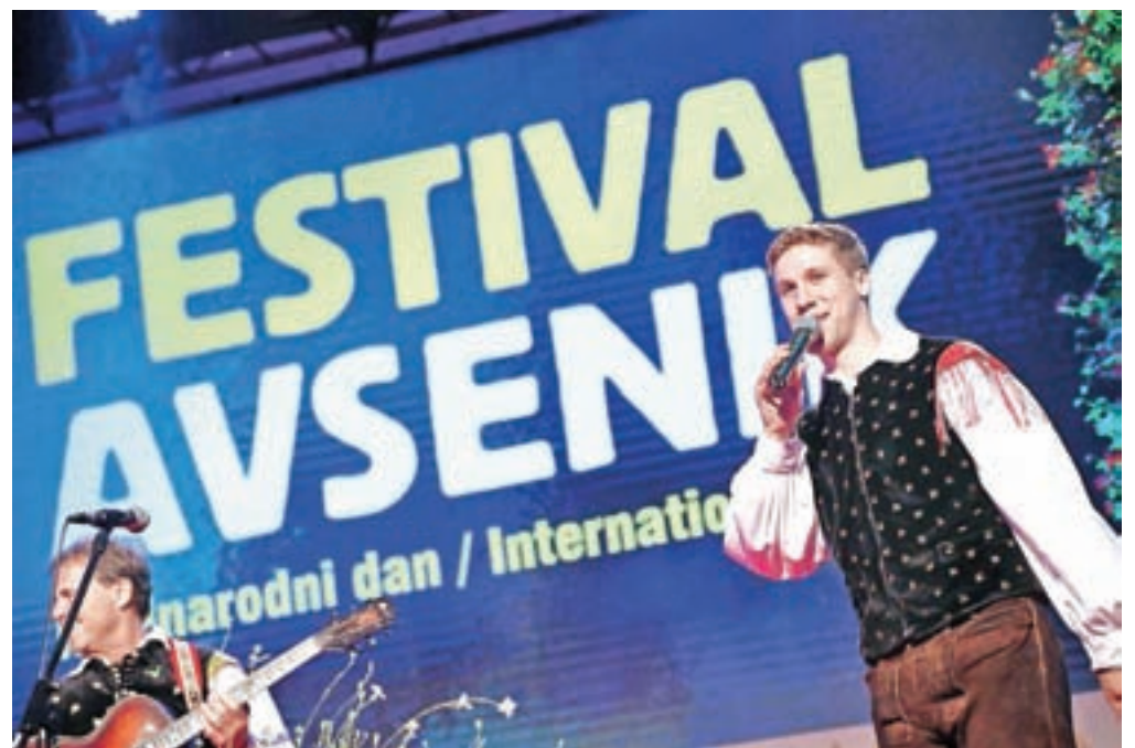
Danes obiskovalce v kraju najbolj privlači dediščina bratov Avsenik, družinsko tradicijo v gostilni Pri Jožovcu v središču Begunj nadaljujejo njihovi otroci in vnuki.