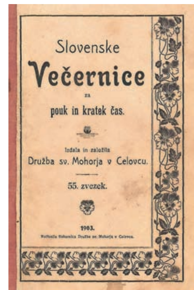
Povest o Miklavovi lipi je prvič izšla leta 1903 kot 55. večernica pri Družbi sv. Mohorja v Celovcu.