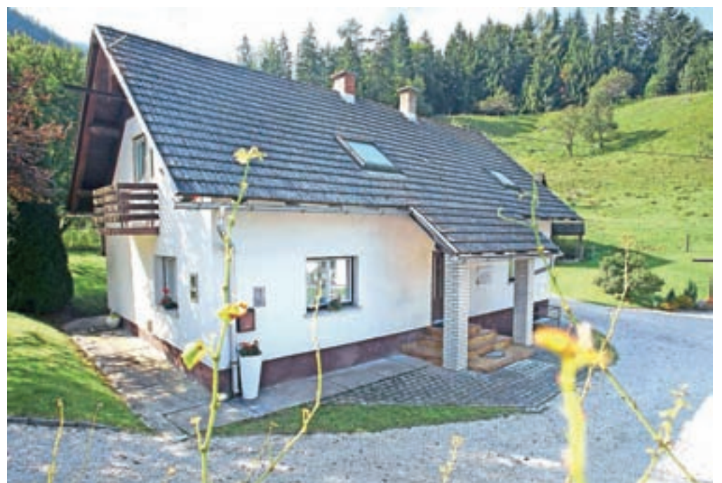
Obnovljena Vorančeva rojstna hiša pri Kotniku v Kotu: na njej je nameščena plošča z napisom, da se je tu rodil Lovro Kuhar.