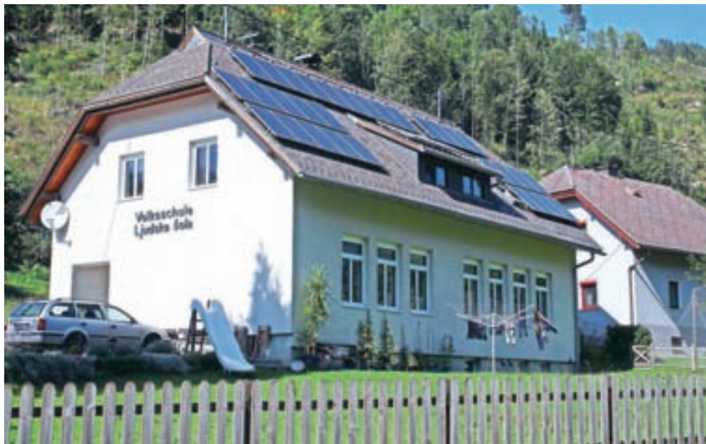
Leta 2011 zaprta ljudska šola v Lepeni je sedaj živahno kulturno središče.