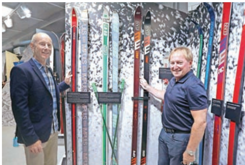
Alpski smučarski muzej Elan; na slovesnosti ob odprtju sta si ga ogledali tudi smučarski legendi, nepremagljivi Šved Ingemar Stenmark in slovenski smučarski junak Bojan Križaj.