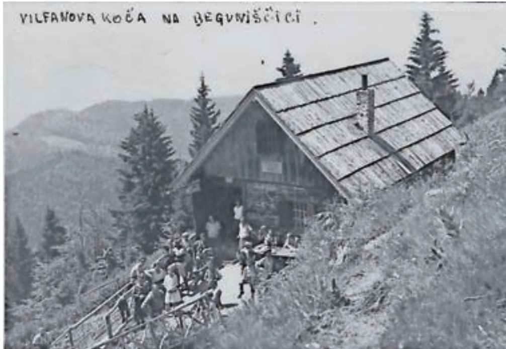
Vilfanova koč na Begunjščici je bila predhodnica kasneje zgrajenega in višje ležečega Roblekovega doma.