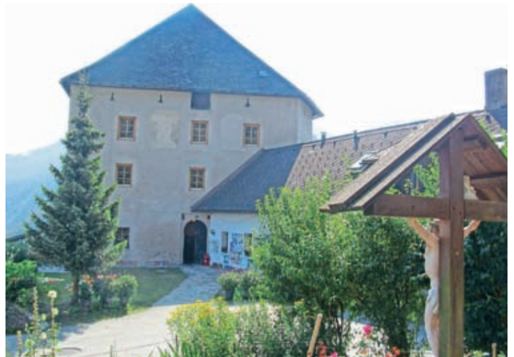
V propadajočem gradu – komendi je konec osemdesetih let začel nastajati Mladinski center. Danes grad živi novo življenje.

Za Rebrco sta značilni dve zgodbi: ena temačnejša in druga obetavnejša. Začnimo s prvo. Ob cesti v dolini, na levem bregu Bele, je dolgo delovala tovarna celuloze z imenom Obir, ki je bila zadnja leta v mešani koroško-slovenski lasti. V njej je bilo v najboljših časih zaposlenih nad dvesto ljudi. V drugi polovici devetdesetih let preteklega leta se je zgodilo najhujše. Koroška oblast je začela negodovati, da tovarna onesnažuje okolje, zlasti reko Belo, in da ne posluje rentabilno. Ljudje, ki