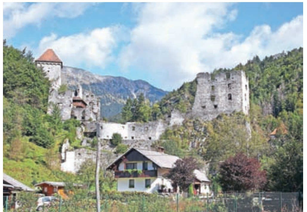
V zadnjih letih so po vasi in okolici uredili številne sprehajalne poti, ena od njih vodi do ruševin gradu Kamen.

Domačini pa, ko razmišljajo o prihodnosti Begunj, stavijo predvsem na turizem. Ta dejavnost ima v kraju dolgo tradicijo, saj je bil že pred drugo svetovno vojno znan kot klimatsko zdravilišče, v njem pa so si premožni ljubitelji lepega in zdravega okolja zgradili številne počitniške vile.