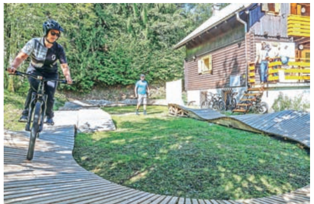
Gorskokolesarski učni center Pristava nad Javorniškim Rovtom

usmerjevalne in informativne table ter izdelali promocijsko zloženko. V kratkem bodo z razpisom poiskali najemnika centra, v celoti pa naj bi zaživel prihodnji pomlad.