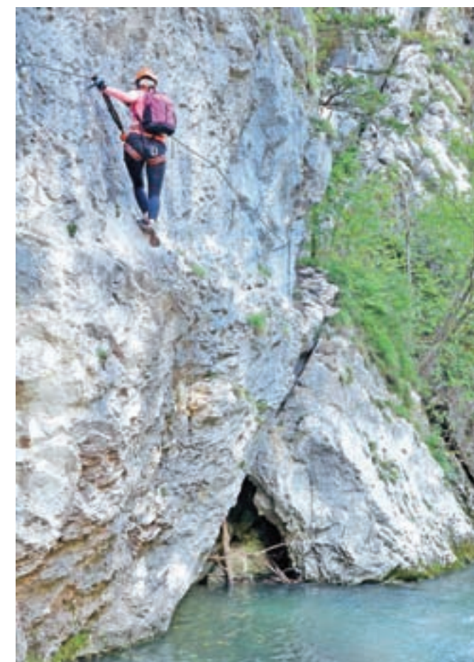
V zgodbi o Miklavovi lipi se je iz Taborske stene odlomila skala in tako naj bi nastala skalna formacija, znana kot Turška glava. Danes je v steni nad reko Belo speljana drzna in zahtevna zavarovana plezalna pot.