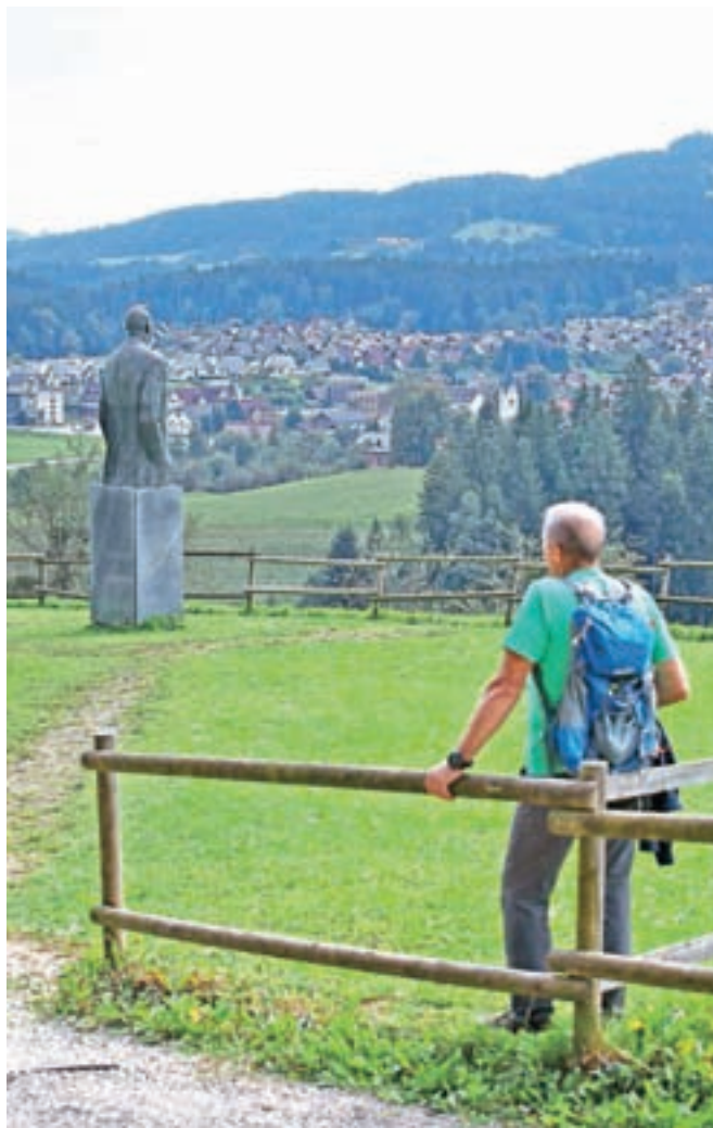
Leta 1979 so na Preškem Vrhu, nad Prežihovo bajto, postavili Batičev spomenik Vorancu, ki zre v dolino, na svoje Kotlje in nad njimi dvigajočo se Uršljo goro.

V Kotljah vsako leto oktobra organizirajo Kuharjeve dneve. Sprva so bile posvečene le spominu na Prežihovega Voranca, zadnja leta pa so tudi spomin na tri