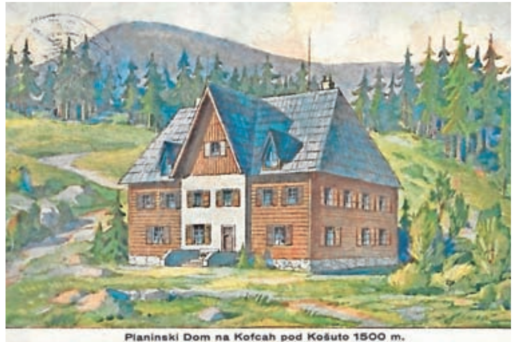
Nekdanji Planinski dom na Kofcah

koča preimenovana v Spodnjo koč. Leta 1893 je bilo ustanovljeno Slovensko planinsko društvo (SPD), ki je iz leta v leto širilo svojo mrežo podružnic oziroma okrajev. Po ustanovitvi kranjsko-gorskega okraja SPD in jeseniške podružnice SPD leta 1903 so se odločili, da na vrhu Golice postavijo koč, ki so jo poimenovali po starosti slovenskih planincev Francu Kadilniku (1825–1908). Kot je pred desetletji zapisal Uroš Zupančič, so »za delo prijeli, kljub velikim težavam in vsem mogočim naporom, vsi Rovtarji in z njimi tudi vsi Dolinci.« Koča je bila dograjena in je začela obratovati leta 1905. Odprtje koč je bilo veliko slavlje ljubiteljev Golice. Dobrotnik Golice Franc Kadilnik, ki je daroval 3000 kron, pa je lastnoročno pritrtil na koč tablo Kadilnikova koč. Obe planinski postojanki na