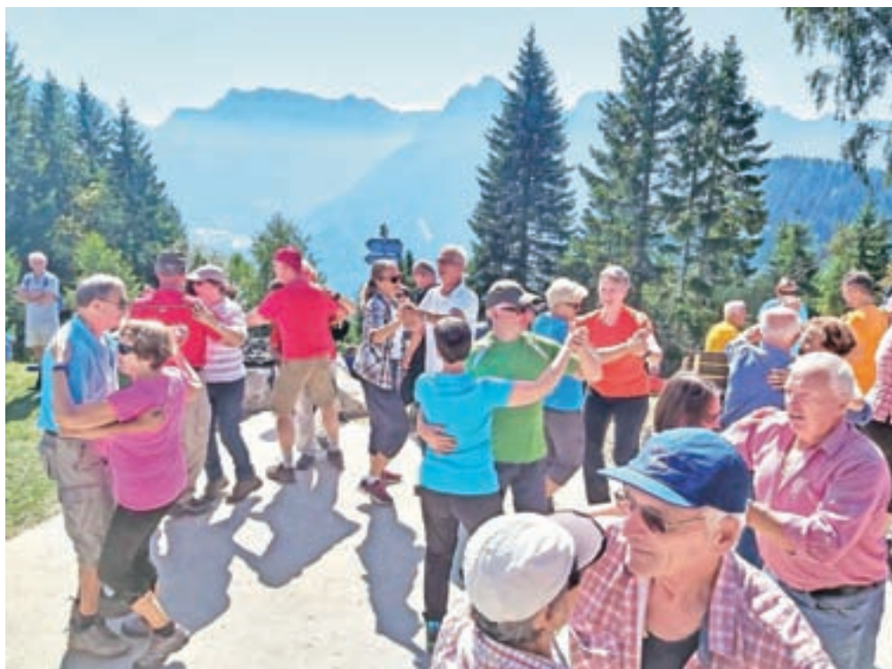
Plesni oder s pogledom proti Planici, Poncam, Ciprniku, Slemenovi špici, Jalovcu ...