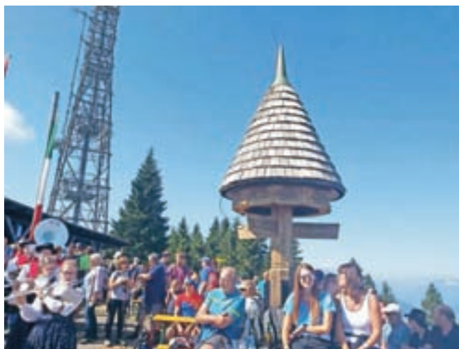
Na stičišču treh dežel boste našli več spominskih obeležij, ki poudarjajo razumevanje in sožitje med narodi.