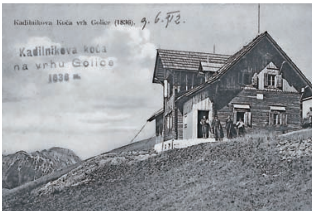
Nekdanja Kadilnikova koč na vrhu Golice je bila med vojno požgana, a nikoli obnovljena.