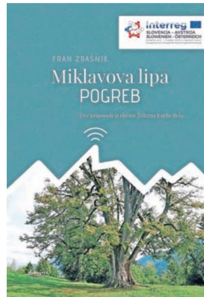
Povesti Frana Zbašnika Miklavova lipo in Pogreb bosta ponovno izšli v okviru čezmejnega projekta Smart Tourist.