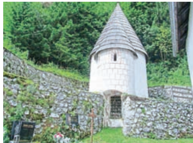
Rebrška kostnica je ena najlepših in najbolj ohranjenih na Koroškem.

so bili priče temu dogajanju, so prepričani, da niso bili odločujoči gospodarski in naravovarstveni razlogi, ampak politični, nacionalni. Oblasti je šlo v nos slovensko lastništvo tovarne in zagotavljanje preživetja (tudi) slovensko govorečemu življu v dolini. Leta 1989 so po sedemdesetih letih stroji v rebrški tovarni, ki je bila največji