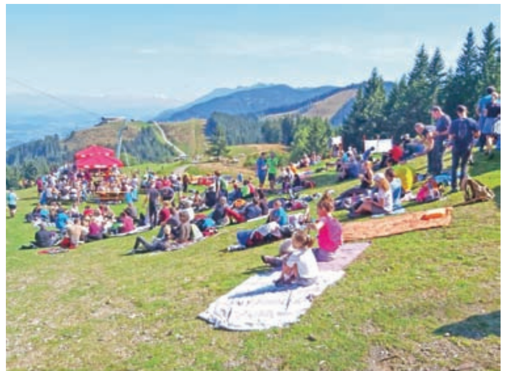
Poleti priljubljena izletniška točka, pozimi tudi priljubljeno smučišče, na katero pelje trosedežnica iz Podkloštra.