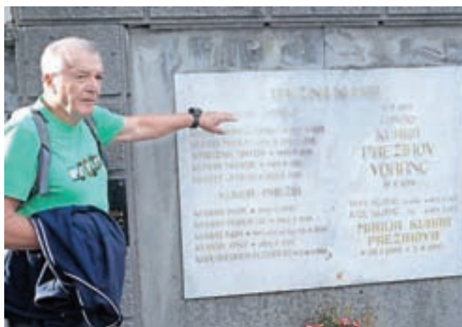
Grob Kuharjeve družine na kotuljskem pokopališču ob taborski cerkvi svete Marjete