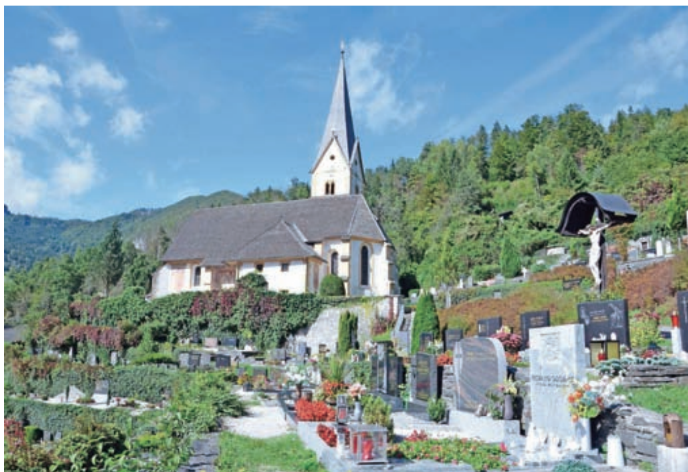
Zbašnikova zgodba Pogreb se dogaja tudi na kapelskem pokopališču pri romarski cerkvi Martije v Trnju.