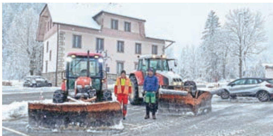
Lonca... in danes