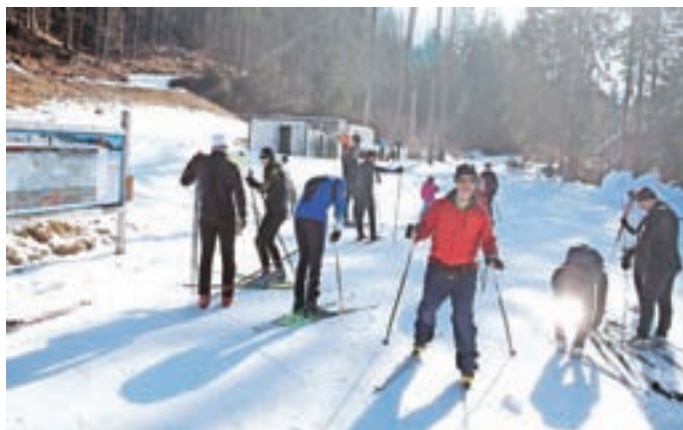
Tekaške proge na Jezerskem so bile letošnjo zimo dobro obiskane