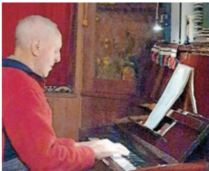
Pri osemdesetih letih se je sam naučil igrati na klavir.