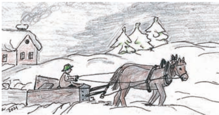
"Oranje" snega nekoč ... / Ilustracija: Mija Murovec

Želim vam veselo veliko noč, dosti pirhov in potic in samih dobrih novic.