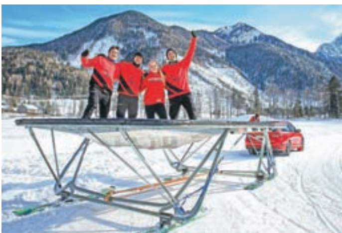
Fantje in dekle iz akrobatske skupine Dunking Devils so se januarja letos odpravili na Jezersko in na smuči postavili trampolin.