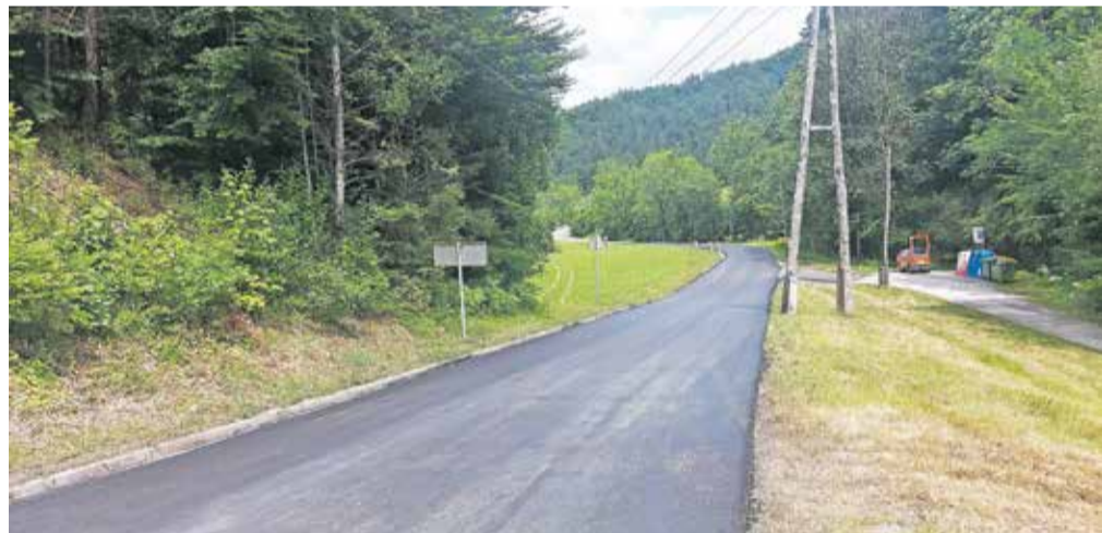
Obnova cestišča Nemilje–Podblica (KS Podblica)