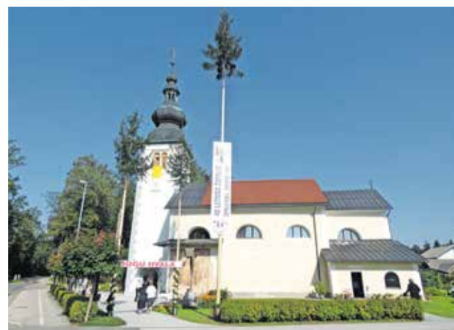
Fasada zvonika na Bregu je ob 40-letnici župnije dočakala obnovo v prvotni podobi, ki so jo med sondažo našli strokovnjaki iz Zavoda za varstvo kulturne dediščine.

Na zvoniku so namesto rumenega opleska, kakršen je tudi na cerkvi, po navodilih Zavoda za varstvo kulturne dediščine rekonstruirali poslikavo na beli podlagi s sivimi kvadri na vogalih. V ka-