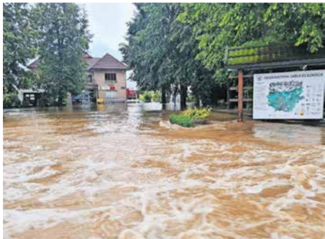
V največji naravni katastrofi v zgodovini Slovenije je poplavilo več predelov Kranja, sprožilo se je dvanajst plazov. / FOTO: ARHIV MOK

cijska cev). Na podlagi njihovih ugotovitev, ki jih pričakujejo v teh dneh, se bodo odločili, ali most znova odprejo za promet. V največji naravni katastrofi v zgodovini Slovenije se je na območju MOK sprožilo tudi več plazov na območju Besnice, Pševga, Golnika in Javornika, ki se že sanirajo. Poplavilo je tudi več predelov občine, zato so bile poleg mostu pri Planiki zaprte še številne ceste: Bitnje pri puškarni, Gorenja Sava – podvoz pod železniško progo, Zabukovje, del ceste pri Zbirnem centru Zarica, v Savski loki, Javornik (pri hišni št. 32), most na Kokrici (v bližini kulturnega doma), Cesta na Belo, Srakovlje, cesta Bobovek–Mlaka, most čez Rupovščico v smeri