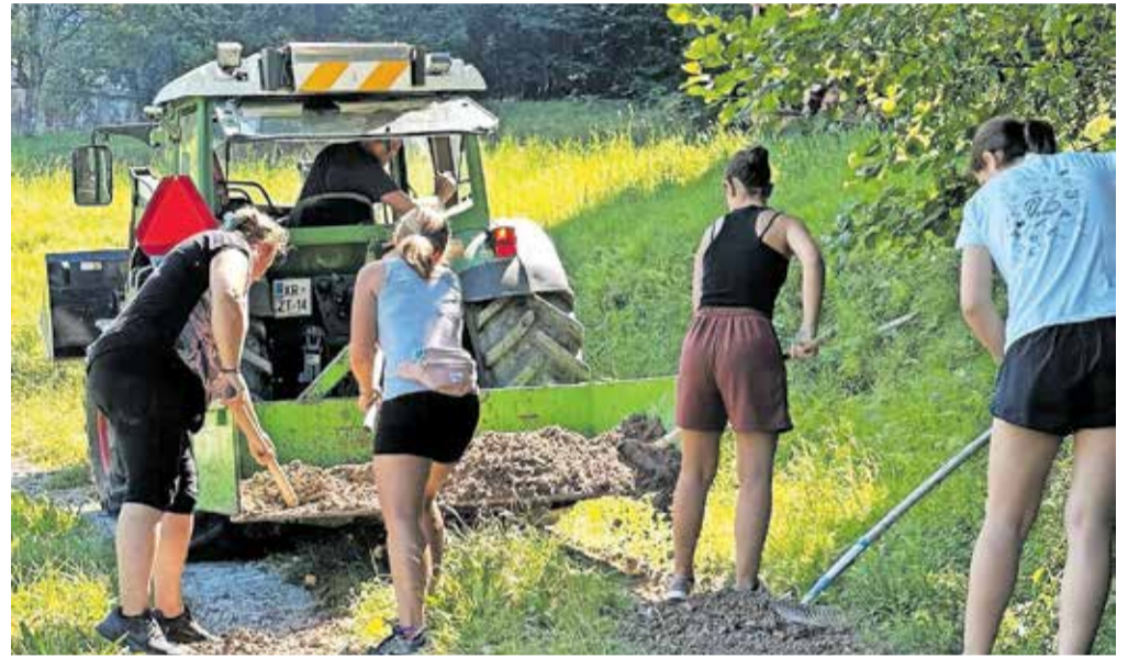
Delovne akcije se je udeležilo skoraj petdeset krajanov vasi pod Joštom.

Pševo – Avgustovsko deževje je preglavice povzročilo tudi v krajevni skupnosti Jošt. Sprožilo se je več zemeljskih plazov, ki so se približali hišam in odnesli nekaj lokalnih cest, prav tako pa je na cestni infrastrukturi in kmetijskih zemljiščih škoda nastala zaradi divjanja hudourniških voda. Na dan solidarnosti, 14. avgusta, so zato združili moči s ProstoVOLJNIM GASILSKIM DRUŠTVOM Jošt in izpeljali udarniško delovno akcijo, v okviru katere so odpravljali posledice deževja, čistili vodotoke in urejali odvodnjavanje meteorne vode.