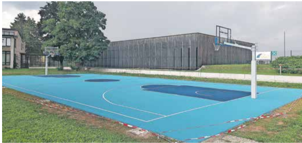
Preplastitev košarkarskega igrišča pri Osnovni šoli Stražišče

MOK že sedaj vabi vse občanke in občane od dopolnjenih 16 let starosti naprej, ki imajo stalno bivališče v MOK, h glasovanju za projekte v okviru participativnega proračuna za leto 2024. O porabi 624.000 evrov proračunskih