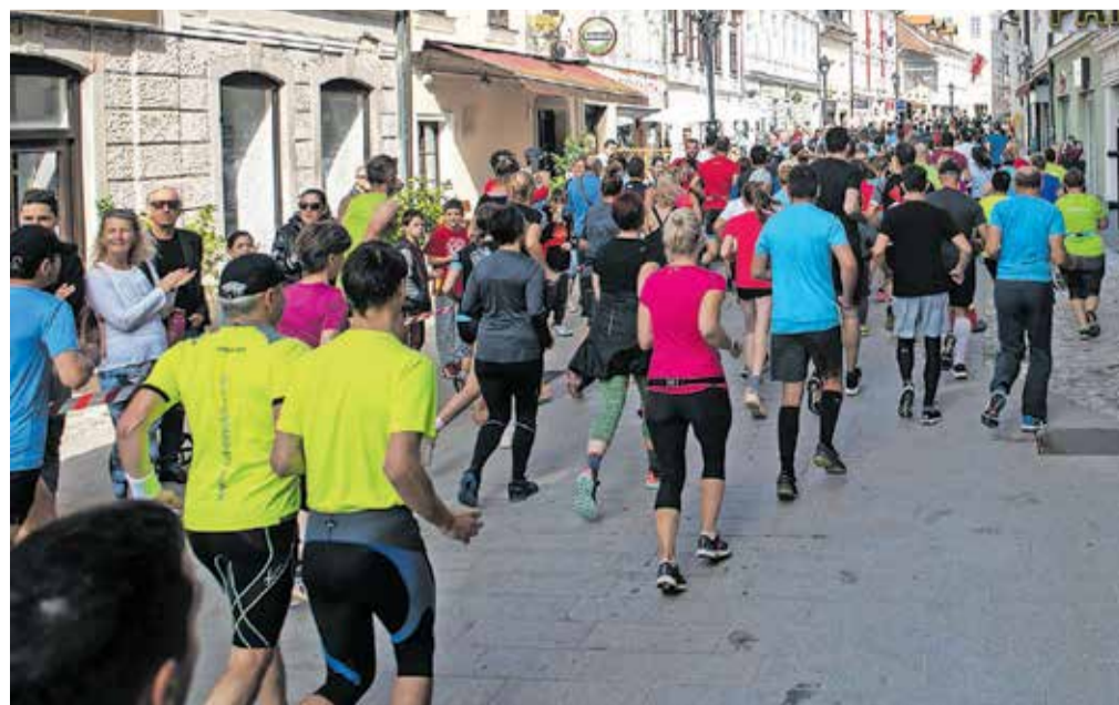
Organizatorji tudi letos pričakujejo veliko tekačev.

Prireditelji teka so Mestna občina Kranj, Zavod za šport Kranj, Zavod za turizem in kulturo Kranj, Atletski klub Triglav Kranj, Fundacija Vincenca Drakslerja in podjetje Dspot. Del sredstev od startnin bodo prireditelji tudi letos podarili v dobrodelne namene. Informacije in prijave na www.tezakranj.si .