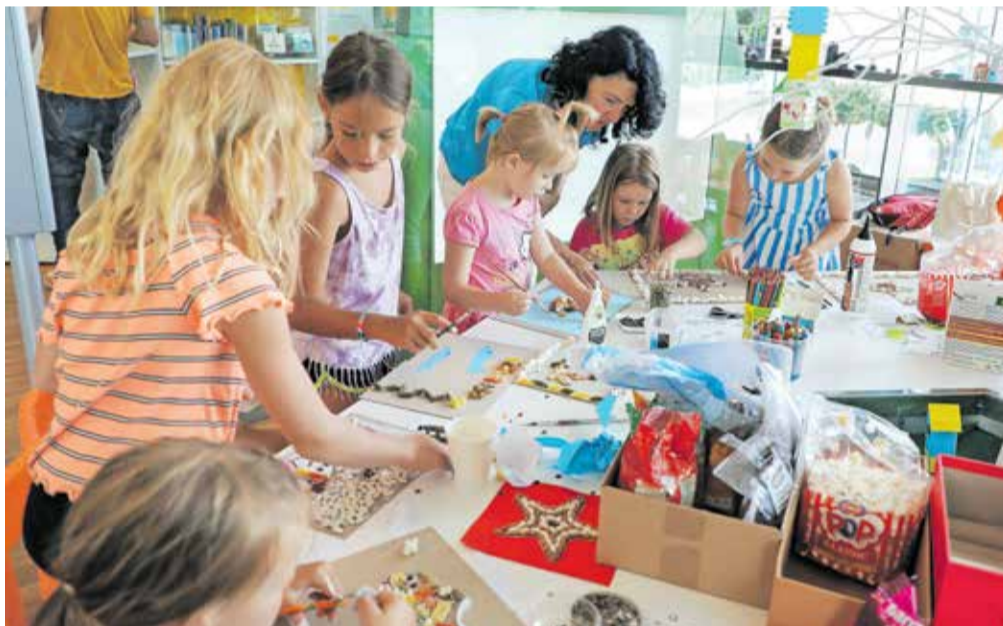
Počitnic bo kmalu konec, s 1. septembrom se začne novo šolsko leto.

Poglejmo še v kranjske srednje šole. Na Gimnaziji Kranj bo v novem šolskem letu okoli 940 dijakov; v prvih letnikih jih bo od 235 do 240. Na Gimnaziji Franceta Prešerna naj bi bilo 650 dijakov, pri čemer naj bi jih bilo v prvem letniku 167. V Šolskem centru Kranj, pod okriljem katerega delujejo Srednja ekonomska, storitvena in gradbena šola, Srednja tehniška šola in Strokovna gimnazija, pa pričakujejo okoli dva