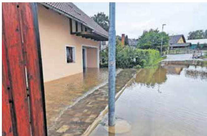
V zadnjem neurju je bilo predvsem zaradi poplav prizadetih veliko gospodinjstev.

križu Slovenije in Slovenski karitas dodelila po pet milijonov evrov sredstev, s čimer se bo omogočila učinkovita in hitra oskrba z osnovnimi življenjskimi potrebščinami tistim, ki so bili najbolj prizadeti v zadnjih poplavih. Dodeljena sredstva bodo v obeh primerih namenjena neposredno prizadetim prebivalcem z upoštevanjem različnih stopenj škode na njihovih domovih. Višina