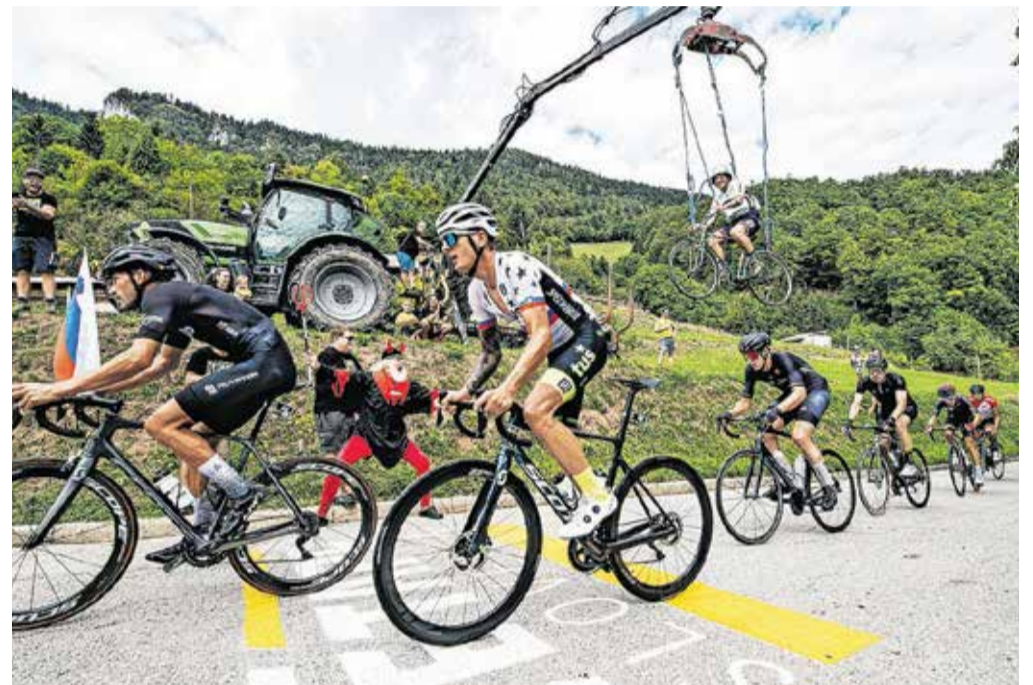
Po lanskim krstni izvedbi se v začetku septembra v Kranj vrača L'Etape, rekreativna različica Dirke po Franciji.

Tudi letos bodo za udeležence L'Etape Slovenia na voljo ceste po prelepi Gorenjski z minimalnimi spremembami trase krajše različice (68 kilometrov) v primerjavi z lansko premierno izvedbo. Pri daljši trasi (138 kilometrov) pa je organizatorjem letos žal dodobra ponagajala narava in silovita ujma v začetku avgusta, zaradi katere je katastrofalne posledice utrpela večina Slovenije, in del trase L'Etape Slovenia ni bil izjema. Pred nekaj dnevi je tako padla končna odločitev, da se bodo rekreativci, prijavljeni za daljšo različico (138 kilometrov), podali v dva kroga krajše variante, saj je del ceste na daljši trasi za zdaj na žalost še neprevozen. Tako bodo odpeljali le nekaj kilometrov manj (136 kilometrov), in sicer dva kroga s startom v Kranju, pot pa bodo nadaljevali ob Savi proti Besnici, mimo Podblince, rojstnega kraja ambasadorja dirke Mateja Mohoriča, sko-