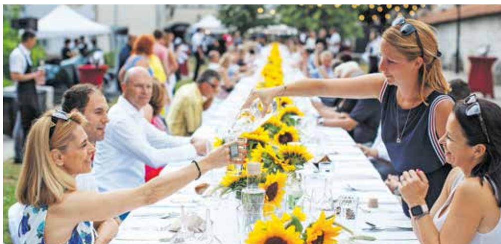
Kranjska dolga miza bo letos na vrtu gradu Khislstein pogrnjena 7. septembra.

Kranjska dolga miza, ki je že razprodana, ni edini kulinarčni dogodek, predviden za prihodnje dni. Že 26. avgusta bo na Glavnem trgu med 10. in 21. uro Odprta kuhna, ki bo tokrat premierno gostovala ne samo v Kranju, ampak tudi na Gorenjskem. Omenimo lahko tudi, da se v starem mestnem jedru vse do 8. septembra nadaljuje niz kulinarčnih dogodkov Kr' petek je, ki že po tradiciji Na Glavnem trgu potekajo vsak poletni petek med 17. in 22. uro.