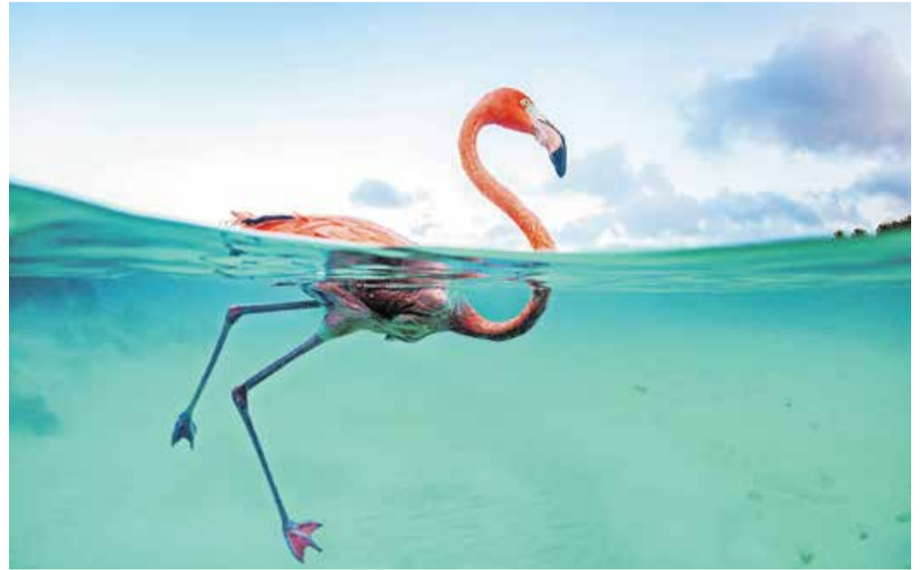
Jasper Doest: Spoznajte Boba 2 (Meet Bob 2)

Kranj – Včeraj so v Layerjevi hiši slovesno odprli letošnji festival Kranj Foto Fest 2023, do nedelje pa bo potekal še bogat festivalski program, ki ob 30 fotografskih razstavah vključuje še pogovore, delavnice, mojstrske tečaje, projekcije in pregledne portfoliov, druženje in zabave, nočne projekcije, vodstva po razstavah in podobno ... Festival si že tretje leto zapored uspešno utira pot v domači in mednarodni fotografski prostor. Osrednja tema letošnjega festivala je Človek – narava, ki je prav v tem obdobju še posebno aktualna in je fotografom ponudila široke možnosti izraza, kar se je pokazalo tudi pri izjemno velikem odzivu na razpis, saj se je ta glede na lansko leto povečal za več kot sto odstotkov. Letos je na festival prispelo kar 656 prijavnosti iz 90 držav s šestih kontinentov, kar nedvomno dokazuje, da gre za odmeven mednarodni festival, ki bo tudi letos privabil v Kranj številne domače in tuje goste, med njimi znana domača in tuja imena iz sveta fotografije. Letošnja tema Kranj Foto Festa želi poudariti prav odnos med človekom in okoljem – tako z dokumentarno fotografijo, ki prikazuje vpliv in posledice človekovih dejanj na naravo, kot s sodob-