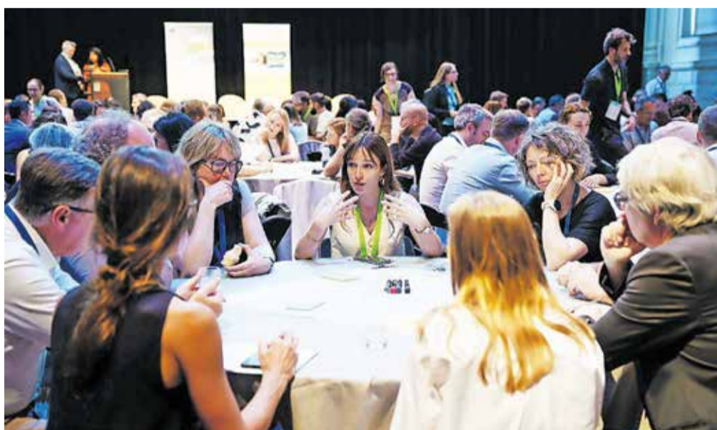
Utrinek z ene od delavnic na letni konferenci mest, vključenih v »Misijo 100«, junija letos v Bruslju.

V začetku junija se je prvič sestal razširjeni strateški svet Mestne občine Kranj za podnebno nevtralnost in pametno skupnost. Na uvodno srečanje so povabili tudi predstavnike podjetij iz različnih področij ter jih pozva-