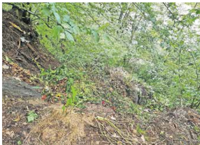
Biološki odpadki v naravi

Hrana, sadje, zelenjava, kuhinjski ostanki in celo kavna usedlina predstavljajo bi-