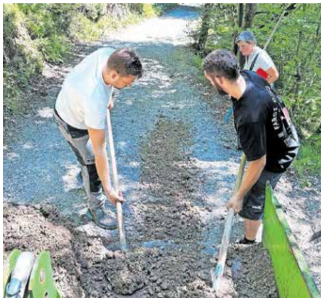
Čistili so jaške, kanale in struge vodotokov ter nasuli in utrdili poti.