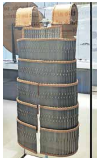
Rekonstrukcija kranjskega oklepa

Kranjska najdba izstopa na razstavi, ne le zaradi svojega simbolnega pomena, temveč zaradi enkratnosti v evropskem in celo svetovnem merilu. Gre za enega od vsega skupaj le sedmih skoraj v celoti ohranjenih lamelnih oklepov iz 6. in 7. stoletja, odkritih na širnem območju med Kavkazom na vzhodu in Španijo na zahodu. Malokateri med njimi nudi toliko zanesljivih podatkov za rekonstrukcijo zgradbe in nekdanjega videza kot prav oklepa iz Kranja.