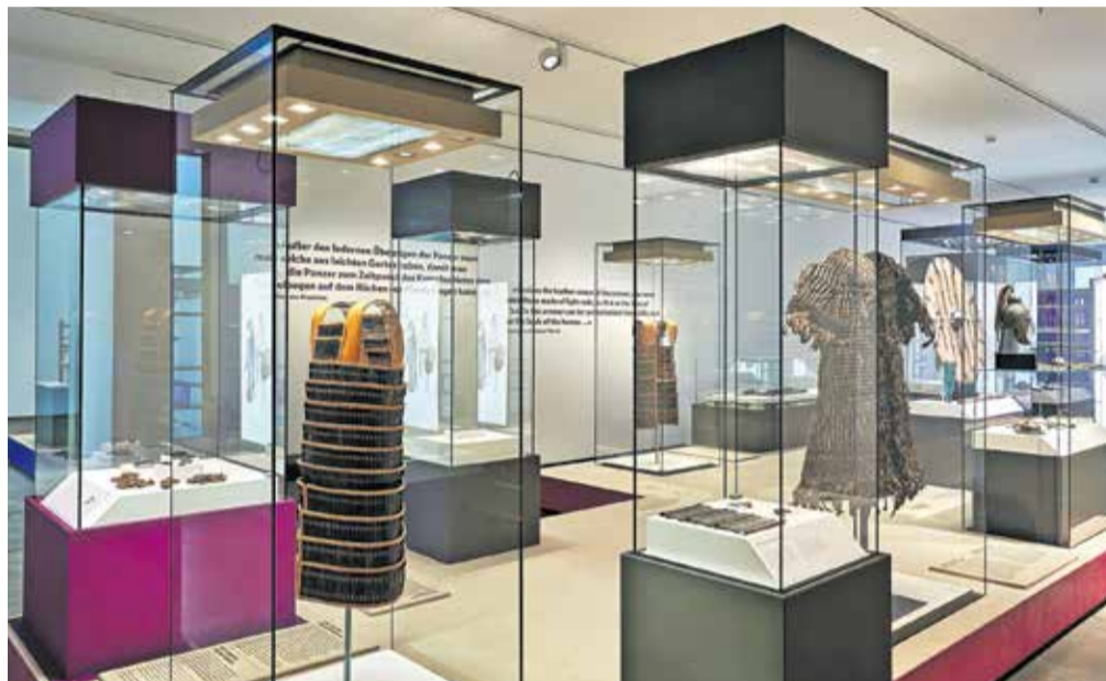
Kranjski oklep gostuje na razstavi v Bonnu.

Kranj – V Deželnem muzeju v Bonnu je na ogled obsežna razstava Bodijevo življenje – Raziskovalno potovanje v zgodnji srednji vek (Das Leben des BODI. Eine Forschungsreise ins frühe Mittelalter), ki je posvečena najdbam iz izjemnega frankovskega groba, ki so ga pred več kot petdesetimi leti odkrili v kraju Bislich v Spodnjem Porenju. V grobu so bili med drugim ostanki lamelnega oklepa ter zlat pečatni prstan z imenom nekdanjega lastnika (Bodi) in imitacijo vladarske podobe. Razstava grobne najdbe iz Bislicha predstavlja v kontekstu primerljivih izstopajočih arheoloških najdb iz vse