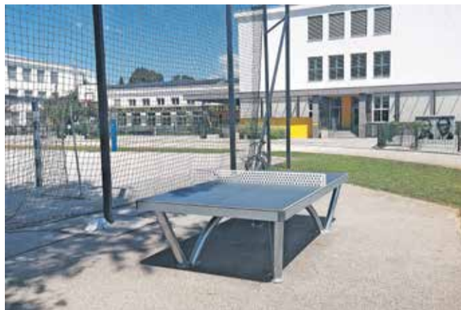
Miza za namizni tenis pri OŠ Janeza Puharja (KS Center)