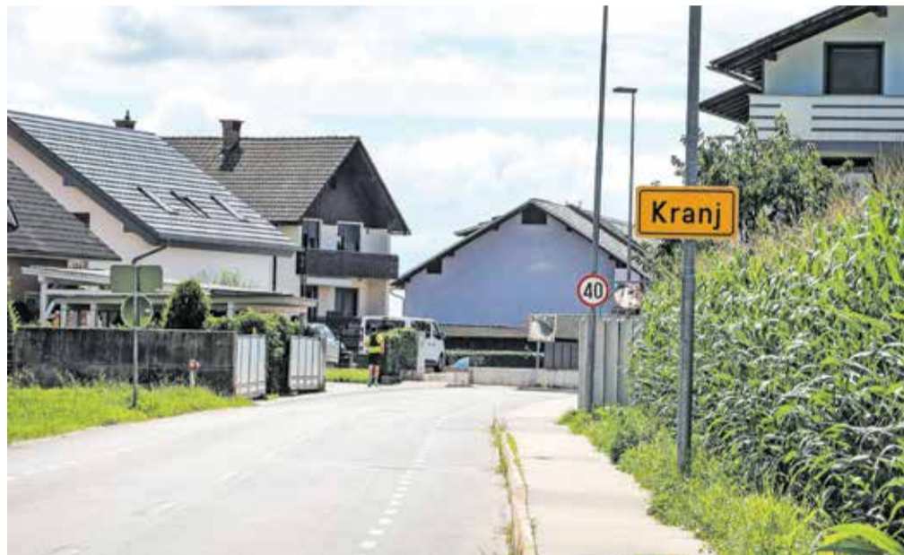
Pred Rupo po novem stoji znak za naselje Kranj.

Kranj – Policijska postaja Kranj je konec marca letos obvestila Medobčinsko redarstvo Kranj, ta pa pristojni urad Mestne občine Kranj (MOK) za ceste, da naselje Rupa uradno ne obstaja. Ob tem so opozorili tudi na problem postavljene prometne signalizacije, ki ni bila v skladu s predpisi. Kot so navedli na MOK, je tudi na podlagi Zakona o določanju območij ter imenovanju in označevanju naselij, ulic in stavb ter po Odloku o območjih naselij ter imenih naselij in ulic v Mestni občini Kranj in Statuta MOK razvidno, da v registru Geodetske uprave RS vas Rupa ni opredeljena kot naselje. MOK je bila tako po uradni dolžnosti dolžna odstraniti table v predelu Rupe, ki označujejo začetek in konec naselja, ter jih nadomestiti z znakom za naselje Kranj.