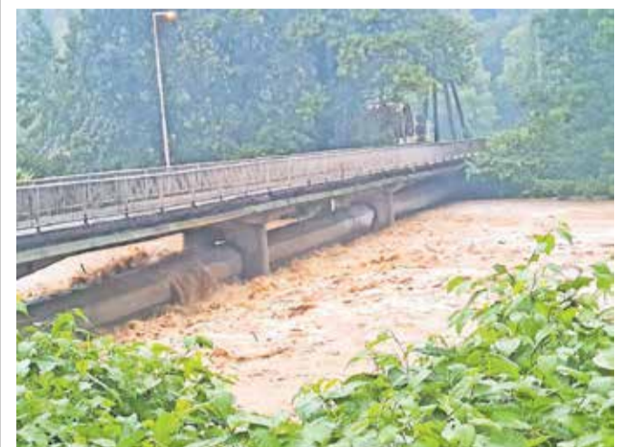
V hudi ujmi v začetku avgusta je prišlo do poškodb betonskega plašča okoli kanalizacijske cevi pod mostom pri Planiki.

sicer celotnemu območju ob Savi grozi ekološka katastrofa neslučenih razsežnosti. Betonski plašč, ki obdaja kanalizacijsko cev, je bil v poplavih na več mestih močno poškodovan, zato se pristojni bojijo usodne poškodbe cevi, na katero je priključeno približno 25.000 ljudi, kar bi povzročilo razlivanje fekalnih voda v Savo. V tem primeru bi se bilo nemogoče izogniti ekološki katastrofi – ne le na območju Kranja, temveč tudi na predelih vzdolž Save po Sloveniji in tujini. Za mostom pri nekdanji Planiki se začne kanjon Zarica, ki je zaščiten kot naravna vrednota državnega pomena, tako kot