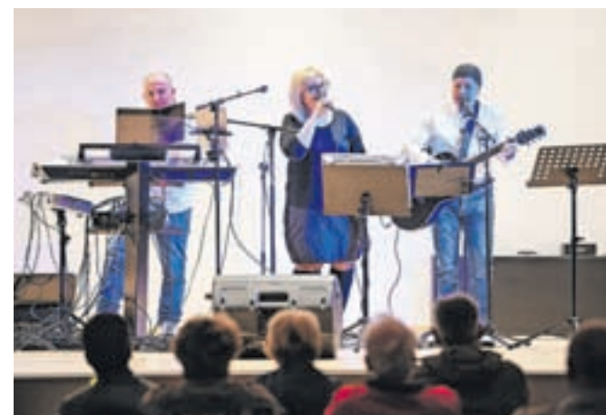
Ansambel Apropo je skrbel, da ni šlo le za laži in šale, ampak tudi za glasbo.