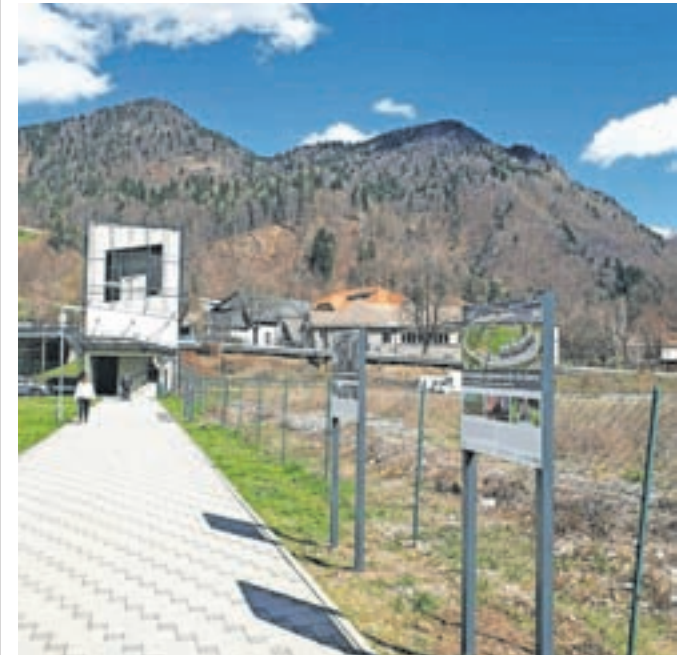
Nove table so kovinske.

Na tematski poti Spomini starih Jesenic so na območju Hrenovce obnovili table, ki so bile tarča vandalov. Namesto dosedanjih lesenih so nove table kovinske. Na Občini Jesenice upajo, da bodo zdržale dalj časa in bodo služile svojemu namenu, to je obujanju spomina na zanimivo zgodovino Jesenic.