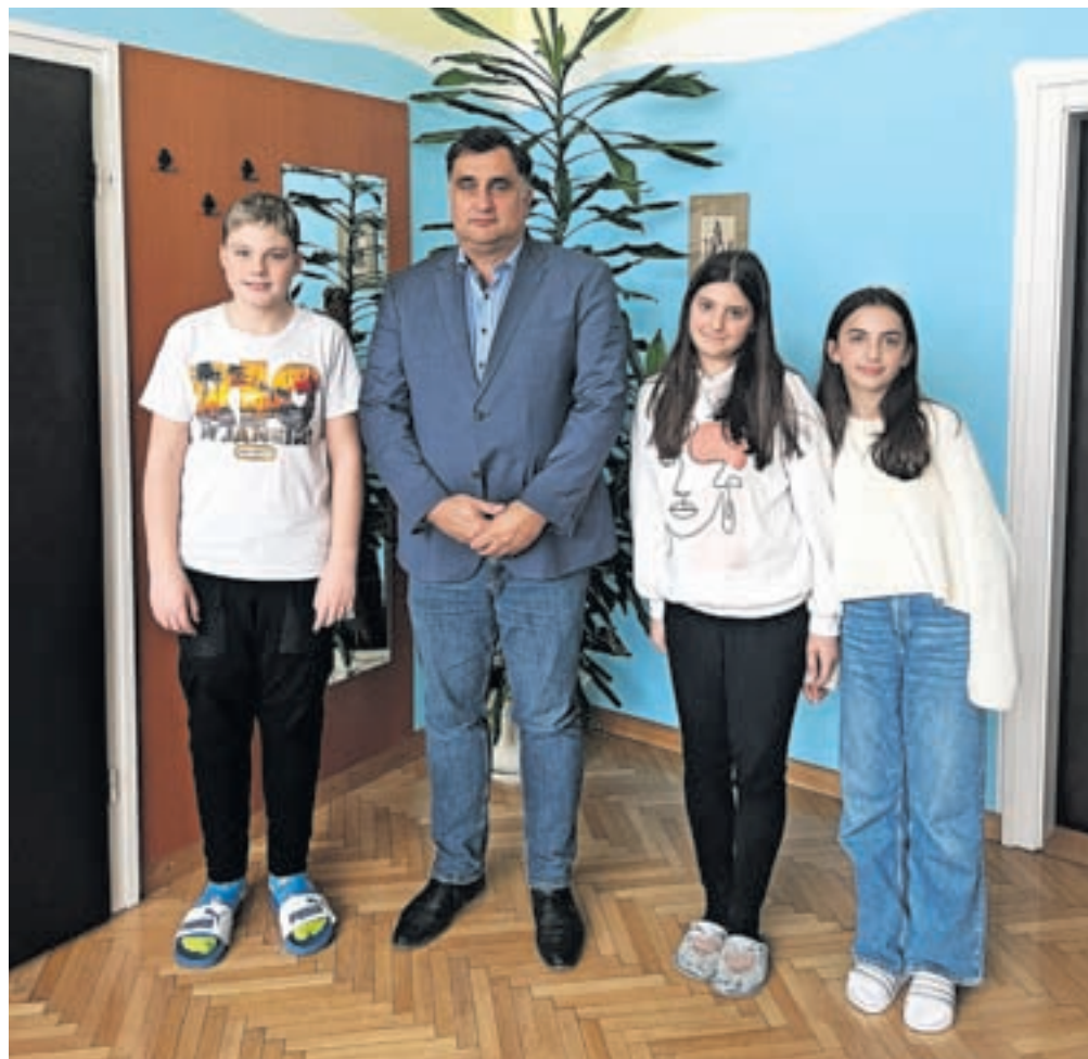
Učenci Osnovne šole Prežihovega Voranca z županom