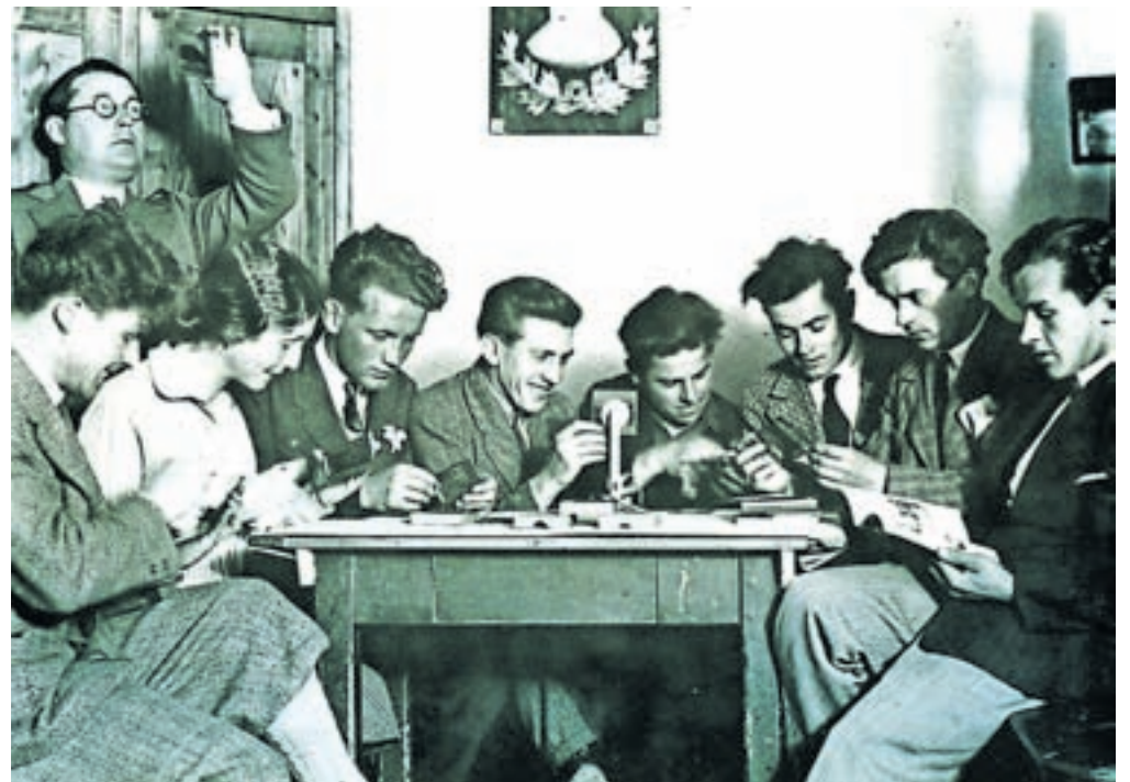
Fotografski odsek jeseniškega Turistovskega kluba Skala v gostilni pri Kobalu, kjer so Skalaši leta 1923 ustanovili jeseniško podružnico

svetovni vojni in zavezniškemu bombardiranju Jesenic spomladi leta 1945. V razstavo bo vključena tudi še ohranjena zaporniška celica, ki jo je v graščini uporabljal Gestapo. Muzejska razstava bo mesto predstavila iz zgodovinskega, umetnostnozgodovinskega in etnološkega vidika,« je vsebino razstave opisal Pogačnik. Nekoč najmlajše mesto v Kraljevini Jugoslaviji bo predstavljeno tudi iz vidika urbanizma, poveljnega ženskega gibanja, gospodarstva, šolstva, zdravstva ter bogate