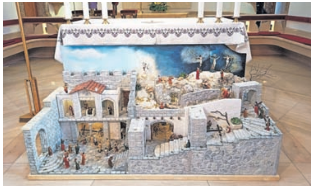
Pasijonske jasllice v jeseniški cerkvi

Jasllice so po krščanskem izročilu širše znane predvsem v božičnem času in prikazujejo Jezusovo rojstvo. V Sloveniji so manj znane pasijonske jasllice, ki prikazujejo Jezusovo trpljenje, smrt in vstajenje. V jeseniški župniji so se izdelave pasijonskih jasllic lotili mladi v pripravi na zakrament svete birme. Izdelovali so jih dve leti, najprej prizore velikonočnega tridnevja in vstajenja, letos so jih dopolnili s prizori slavnostnega vhoda v Jeruzalem. Pri izdelavi so uporabljali različne materiale, nikoli si niso prej predstavljali, s kakšnimi gradbenimi deli se bodo srečevali. Potrebno je bilo brušenje, spajkanje, tolčenje s kam-