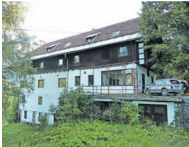
Hotel Belcijan v Planini pod Golico že vrsto let žalostno propada, tudi najnovejši poskus oživitve očitno ni uspel.

lijona evrov, goste pa naj bi sprejel v dveh letih. Ob tem je Požeg potrdil, da bodo morali upoštevati kulturno-varstvene zahteve, hitrost prenove pa da bo odvisna od tega, kako hitro bodo pri-