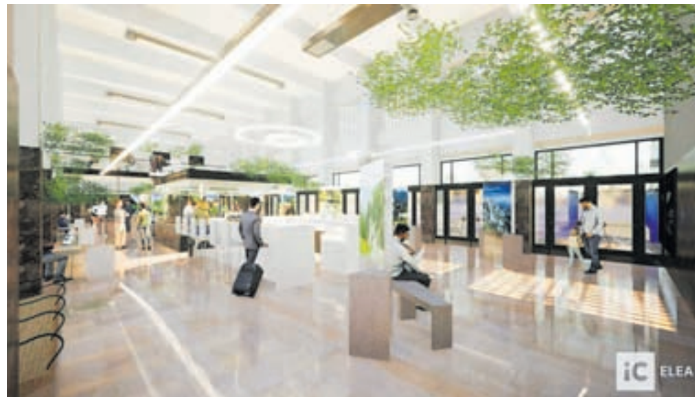
Tako naj bi bila videti vstopna avla v železniško postajo.

jalca del je namreč že zaključen, prispele so tri ponudbe, najnižja ponudba pa je bistveno višja od ocenjene vrednosti in znaša 170 mili-