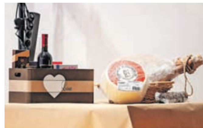
Poleg bogatih nagrad za najboljše lažnivce so se obiskovalci lahko pomerili tudi v ocenjevanju teže košarice, v kateri se je našlo kar nekaj dobrot.