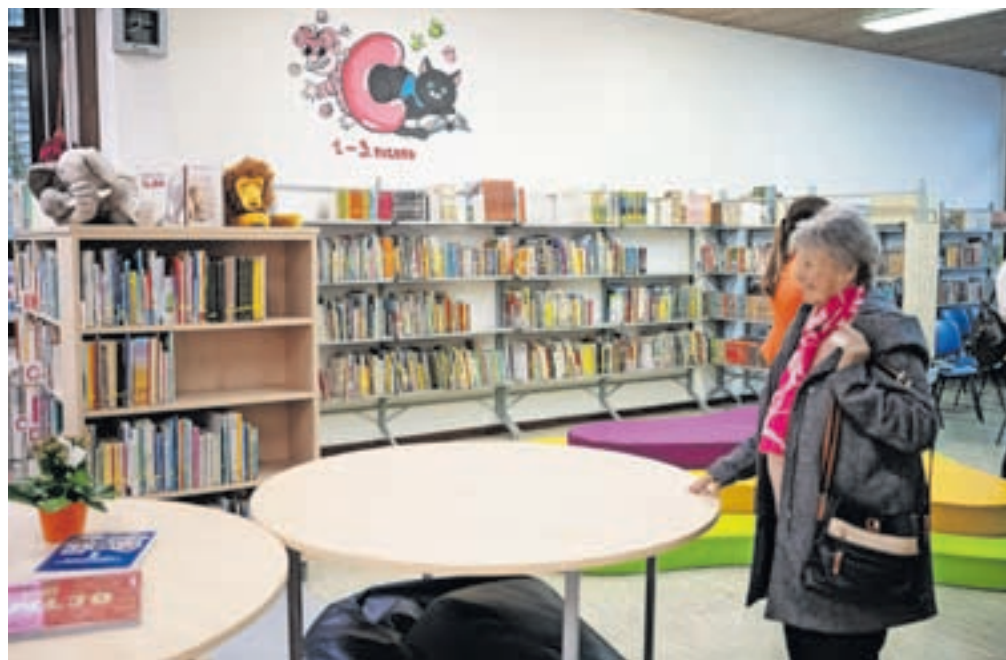
V novi knjižnici je bralcem na voljo kar 22 tisoč enot različnega gradiva.

Prve dejavnosti v zvezi s prenovno so se začele pred tremi leti s načrtovanjem del, nabavo prvega pohištva in police za knjige. S selitvijo so