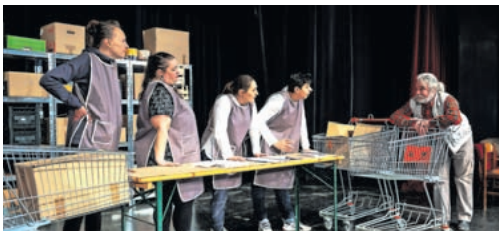
Štiri delavke v skladišču ogromne trgovine delajo podnevi in ponoči ...

Gre za komično, hkrati žalostno, absurdno in utopijsko polno socialno dramo o štirih ženskah, ki delajo v skladišču ogromne trgovine. Kot