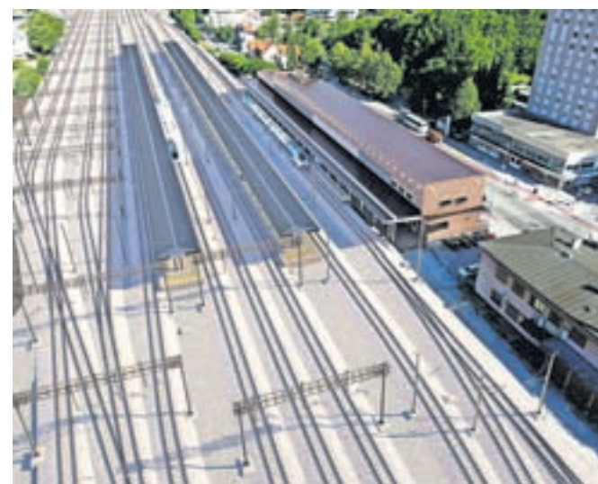
Idejna zasnova prenovljene železniške postaje

Na novinarski konferenci so podrobno predstavili tudi finančni del investicije. Javnost je namreč razburila informacija, da se bo projekt s prvotnih 83 milijonov podražil na 137 milijonov evrov. Kot so poudarili, je bila leta 2021 investicijska vrednost