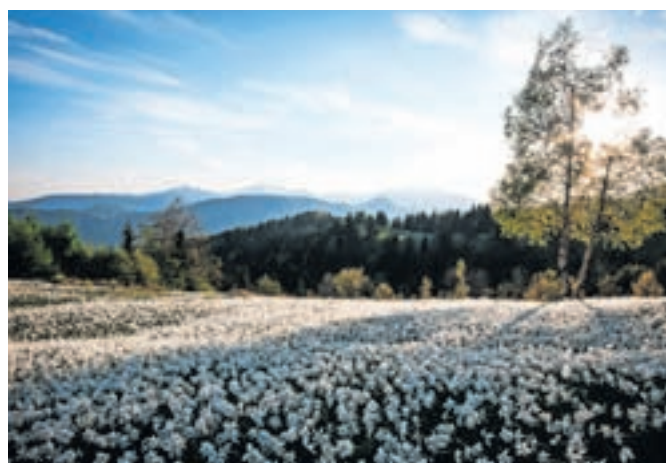
Cvetoče narcise oziroma ključavnice na Kopišarjevem Rovtu

koncev tedna, to je 11. in 12. maja ter 18. in 19. maja. Veljal bo le ob ugodnem vremenu in ob omenjenih terminih, ne bo pa veljal za domačine in lastnike zemljišč in počitniških objektov. V vasi bo poostren nadzor redarjev, so poudarili na Občini Jesenice. Bogat zabavni in kulturni program bo potekal na prireditvenem prostoru pr' Čop v Planini pod Golico ter na ostalih lokacijah v naselju. Praznik narcis bodo sicer letos zaznamovale pomembne obletnice: nova kočna na Golici praznuje 40 let, Avsenikova skladba Na Golici 70 let prve izvedbe, v maju pa bodo izbrali že 60. mis narcis.