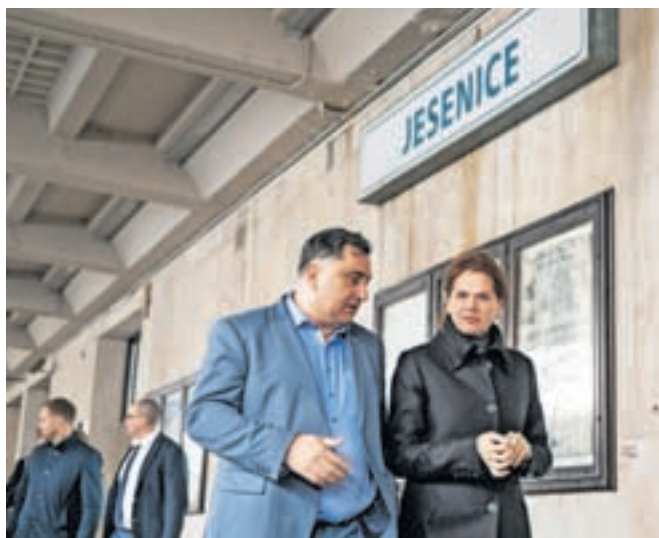
Župan Peter Bohinec in ministrica za infrastrukturo Alenka Bratušek na ogledu železniške postaje

Železniška proga bo podaljšana za 1,4 kilometra do Hrušice, tako bosta nastali dve novi postajališči, in sicer na Plavžu ter na Hrušici.