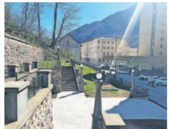
Nove solarne lučke v Kolarjevem parku

V sklopu urejanja Kolarjevega parka v Centru II so na betonske stebre namestili lične solarne lučke. Kot so ob tem zapisali v TIC Jesenice, je park tako podoben imel v osemdesetih letih prejšnjega stoletja, saj so lučke podobne tistim iz preteklosti.