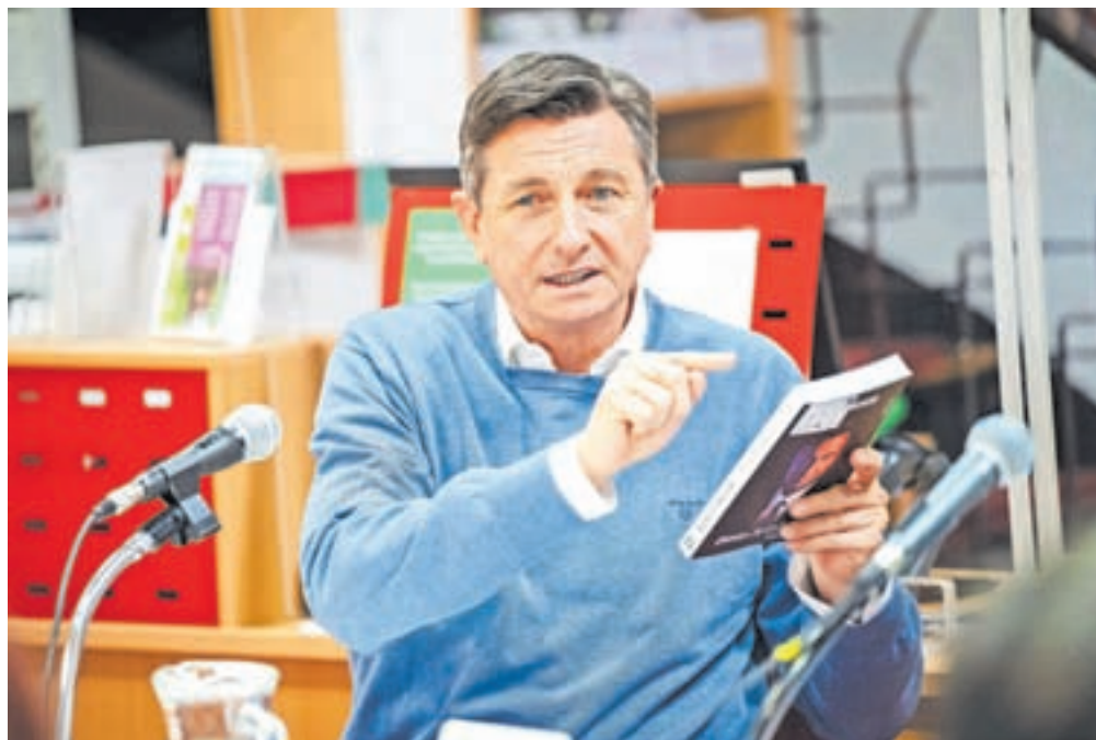
Pozitivni odzivi na knjigo, predvsem mlajše populacije, so Borutu Pahorju v veliko čast in zadovoljstvo.

čenju s težavnimi časi, še posebej s konflikti s Hrvaško. Pahor je dejal: »Kot predsednik vlade sem nastopil, saj sem to obljubil stranki. Leta 1997 sem obljubil, da bomo čez deset let na političnem vrhu. Bilo je hudo, težko obdobje, vendar sem se kot predsednik vlade veliko naučil, naredil veliko napak, se veliko navadil. To je botrovalo k temu, da sem bil potem lahko boljši predsednik republike.«