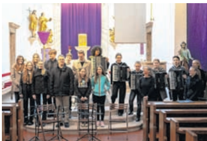
Nastopajoči na koncertu v jeseniški cerkvi