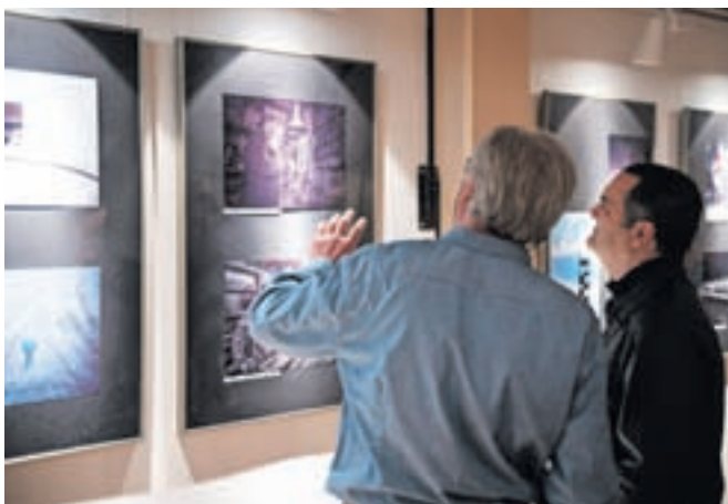
Človek in kovina