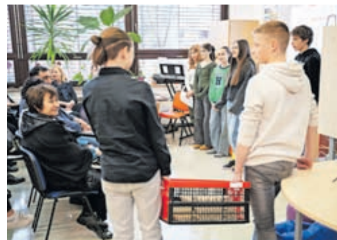
Učenci so poskrbeli za pester program in goste povabili k bralnemu izzivu.