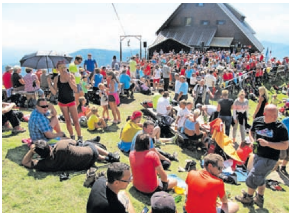
Množični obisk na Golici v lanskem maju

Golica v Karavankah je že več kot stoletje pomembno vpeta v razvoj planinstva na Jesenicah in v širši okolici. V viharnih časih je predstavljala steber odločnosti in ohranjanja narodne zavesti med ljudmi, da čudoviti gorski svet ostane v slovenskih rokah. Na pomembne mejnike se letos s ponosom ozirajo pri Planinskem društvu Jesenice, ki slavi pomemben jubilej, stoletnico delovanja. Nemška planinska organizacija je že leta 1892 na pobojnih Golice postavila svojo kočjo. To je jeseniške rodoljube in planinske zanesenjake spodbudilo, da so leta 1903 postavili svojo kočjo na vrhu Golice in jo poimenovali Kadičnikova kočja. Med NOB sta bili obe kočji požgani in kar nekaj let so množice planincev, posebej v maju v času cvetenja ključavnic, pogrešale varno zavetišče ob vzponu ali vrnitvi z Golice. Jeseniški planinci so se po večletnih pripravah odločili, da na temeljih nekdanje nemške kočje zgradijo svojo postojanko. Po velikih naporih z dvajset tisoč opravljenimi pro-