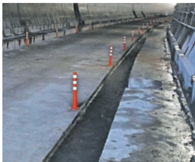
V drugi cevi predora Karavanke je polno vode, ki je za zdaj speljana v Savo.

projekta, kako bi karavanški vodni vir vključili v oskrbo s pitno vodo Jesenic. V sklopu Vodnega centra