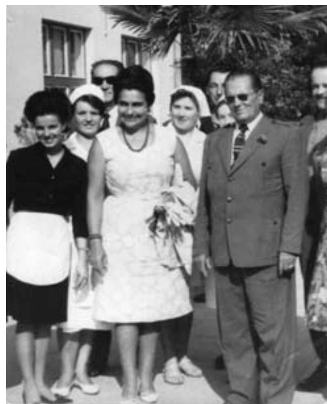
Jugoslovanski predsednik Josip Broz Tito in soproga Jovanka z osebjem restavracije Dom Kamnik, kjer sta se po vrnitvi z lova v Kamniški Bistrici ustavila na kosilu.

ji Dom Kamnik in o postrežbi ter pripravljeni hrani dal zelo pohvalne izjave. Žalostna vest: poslovil se je borec za delavske pravice, organizator vstaje proti okupatorju in ljudske revolucije,