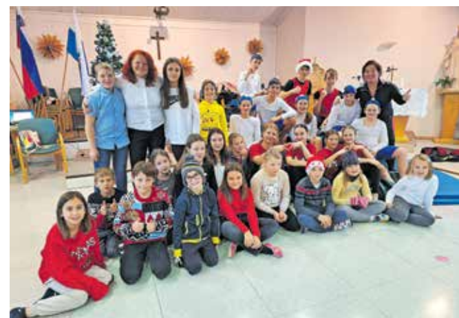
... in polepšali dan starostnikom v DSO Kamnik.