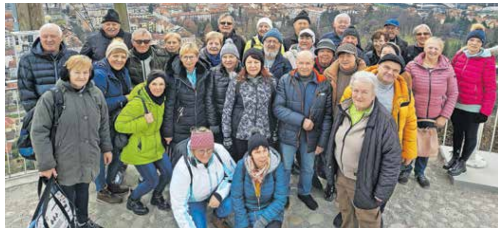
Na mariborski Piramidi

Avgusta smo imeli vsakoletno srečanje članov v Špitaliču. Septembra je bil organiziran društveni izlet v Izolo. Med drugim smo obiskali največjo leseno hišo v Sloveniji, kjer ima sedež neodvisni raziskovalni inštitut InnoRenew CoE. Oktobra smo se odpravili v Višnjo Goro, znano po Jurčičevi humoreski Kozlovska sodba v Višnji Gori in legendi o polžu. Obiskali smo Hišo kranjske čebele in z zanimanjem sledili vodenemu ogledu. V novembru smo šli v Ljubljano. Obiskali smo Bežigrad; najprej Navje, potem smo izvedeli, da je na mestu sedanjega Jurčka na Gospodarskem razstavišču nekda