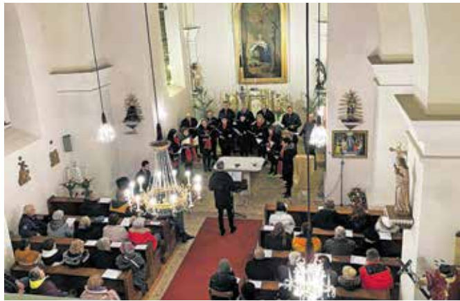
Koncert MePZ Mavrica v Rauchenwarthu

sledile dve ali tri nemške oz. slovenske pesmi. Vrhunec koncerta je bil, ko se nam je pred oltarjem pridružil gostujoči zbor pod vodstvom gospe Andreje. Skupaj smo zapeli pesem Joy to the world. Pesmi Hitite kristjani in Sveta noč pa sta zboru