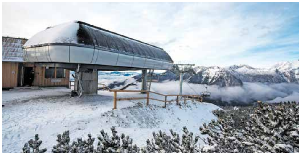
Uradno odprtje šestsedežnice načrtujejo v drugi polovici januarja.

Po prvotnih načrtih naj bi bila dela končana do konca novembra, a so po opravljenih pregledih zeleno luč za obratovanje dobili 22. decembra. »Remont nihalko je bilo treba podaljšati iz več razlogov. Ker so se podaljšala dela pri dokončanju izvedbe šestsedežnice, je bilo s strani izvajalca Leitner zamaknjeno tudi usposabljanje zaposlenih na novi šestsedežnici. Tako je usposabljanje zaposlenih za varno delo šestsedežnice poseglo v obdobje remonta in se je ta podaljšal za osem dni. Po koncu del, ki so bila načrtovana z remontom za letošnje leto, je bilo na zahtevo pristojnih institucij treba izvesti še dodatne posebne preglede varnostnih sklopov, ki so bili zahtevani kot pogoj za nadaljnje obratovanje nihalko. Za izvedbo teh pregledov je bilo potrebnih še dodatnih 15 dni,« so nam še pojasnili.