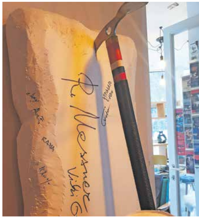
»Dobrodelni« cepin je razstavljen v Baru kulture 313,6 v Medvodah.

Medvode – Ko se je v Štali pri Škofji Loki zgodila tradicionalna zabava, nihče še pomislil ni, da bodo kmalu zatem prišle katastrofalne avgustovske poplave. Kot piše na spletni strani skupine Adria Animals, so se takrat tako odzvali. Vsi člani skupine so se angažirali pri reševanju v Škofji Loki, Mostah, Kamniku in Gornjem Gradju. »Tako se pojavijo zamisli, kako pomagati tudi, ko bodo enkrat kleti in ulice počiščene. Nastane projekt Za gasilca veselica.« Skupina Adria Animals je tako prvi zahvalni koncert Za gasilca veselica, ki se je nato spremenil v dobrodelnega, soorganizirala že septembra. Nadaljevali so na Prevaljah 31. oktobra, kjer se je nato spremenil v dobrodelnega koncerta za PGD Prevalje. »Tam so nas gasilci prvič opozorili na to, da so poplave popol-