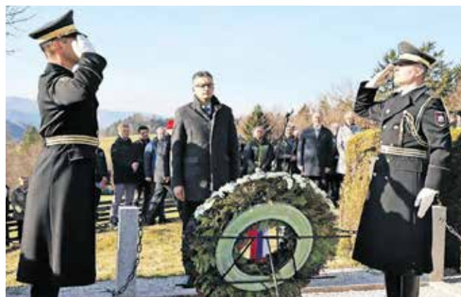
Venec k spomeniku je na spominski slovesnosti na Prevojah položil minister za obrambo Marjan Šarec.