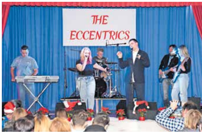
Utrinek z decembrskega koncerta