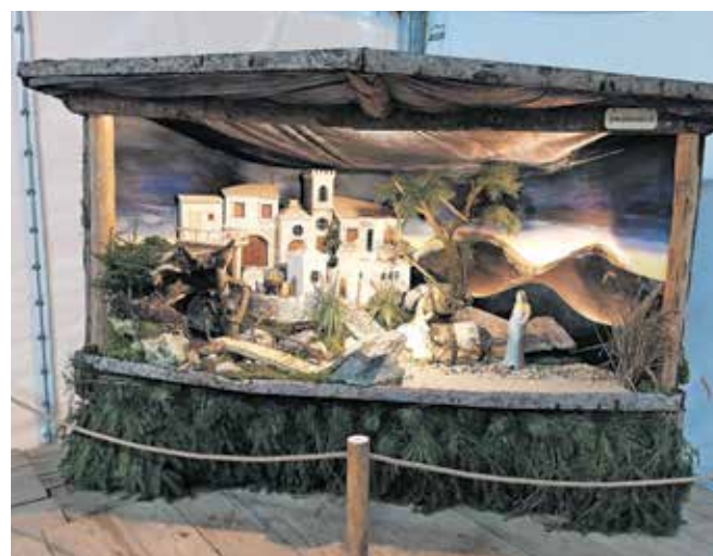
Tokrat so praznični čas obogatili tudi z razstavo jaslíc ustvarjalcev iz Tuhinjske doline in bližnjih krajev.