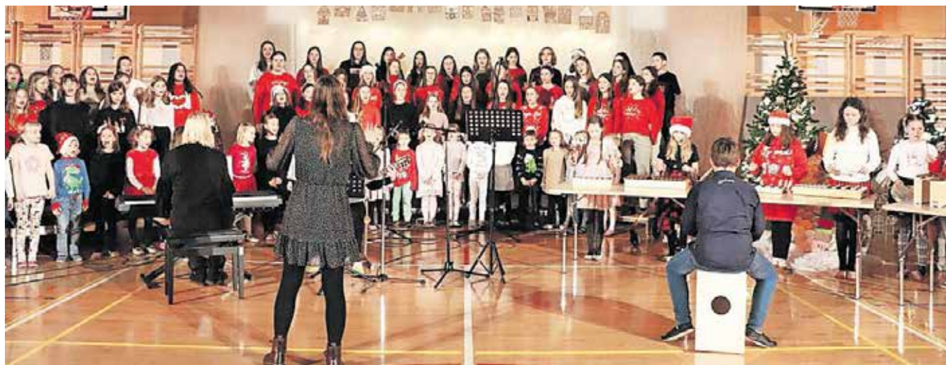
Tradicionalni praznični koncert učencev Osnovne šole Toma Brejca

V s čustvi napolnjenem večeru so se predstavili vsi trije šolski pevski zbori, skupni plesalcev in učenci izbirnega predmeta umetnost. Skozi dišeče praznike in vragolije na snegu sta obiskovalce popeljala stric in nečak, ki sta skupaj z odlično napovedovalko narisala nasmeha na obraze prisotnih. Poslovili so se z univerzalno mislijo, ki lahko vodi vse nas: Delajte dobro.