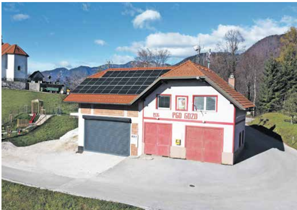
Člani PGD Gozd so bogatejši za nov prizidek h gasilskemu domu.

novega ogrevanja in pripravili vse potrebno za izdelavo tlakov v dvorani, sanitarijah in na balkonu.