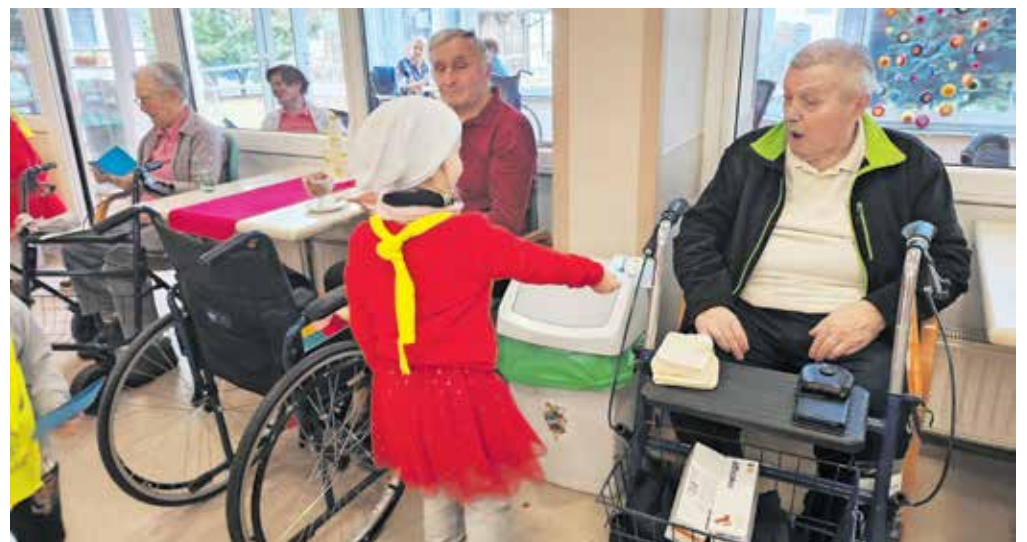
Med deljenjem voščilnic

Ob prihodu v Dom starejših občanov Kamnik smo zbrane prijazno pozdravili, nato smo zapeli himno vrtca Zarja, pesem z naslovom Jesenska (saj je zima šele trkala na vrata), zaplesali koreografijo na glasbo Bela