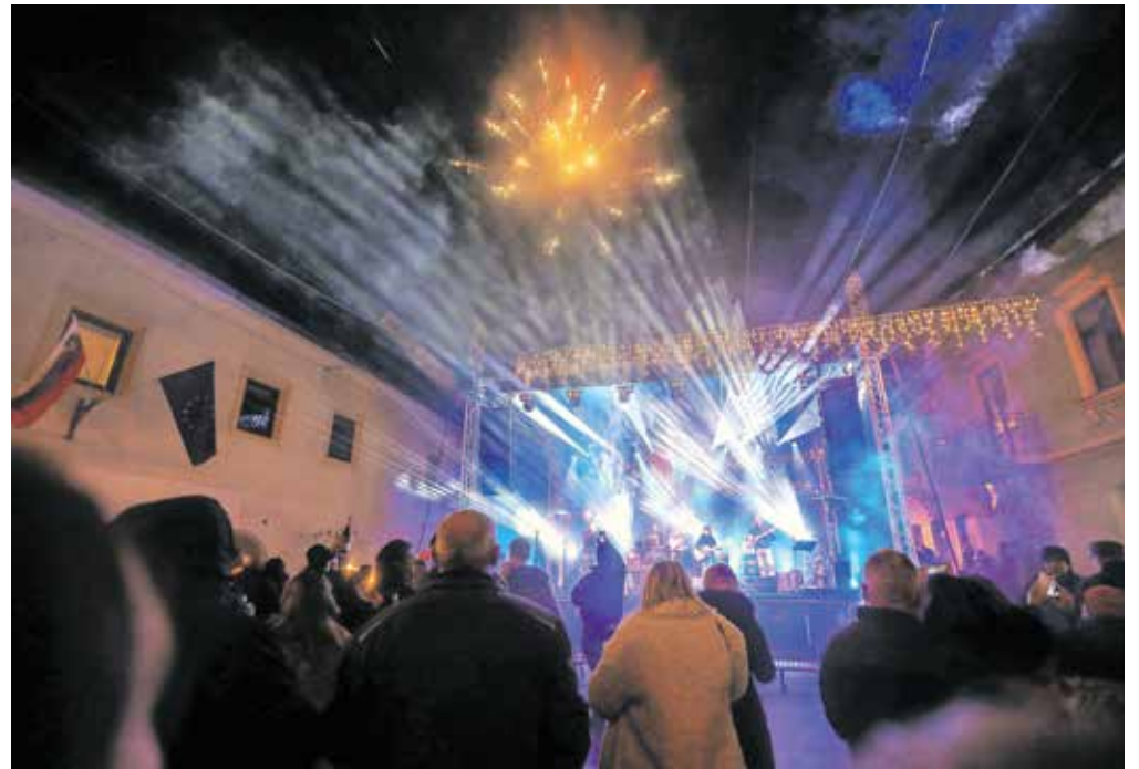
Kamniško nebo je ob polnoči razsvetlil ognjemet.