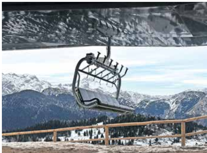
Šestsežnica na Veliki planini / FOTO: VELIKA PLANINA

vključuje vožnje z nihalko in sedežnico, smučanje ter sankanje. Letna vozovnica velja leto dni od nakupa. Novost v letošnji sezoni je t. i. kombo paket, ki vključuje tridnevno vozovnico za nihalko, sedežnico, nočno sankanje ter smučanje – cena vozovnice za odrasle je 82 evrov, za otroke pa 50 evrov. Uradno odprtje nove šestsežnice načrtujejo v drugi polovici januarja.