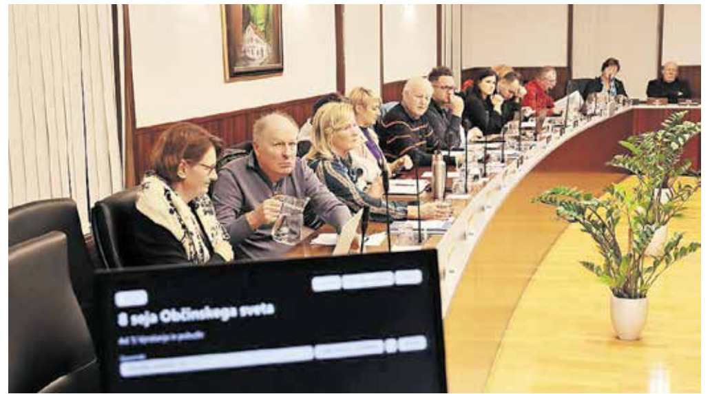
Svetniki so se od začetka mandata zbrali na osmih rednih sejah.

V naslednji točki je sledila obravnava dokumenta identifikacije investicijskega projekta (DIIP) Gradnja in nabava opreme v zdravstvenem domu Kamnik. Po pooblastilu soustanoviteljice zdravstvenega doma, Občine Komenda, je namreč Občina Kamnik oddala vlogo na razpis ministrstva za zdravje za sofinanciranje investicij na primarni ravni zdravstvene dejavnosti. Občini namreč v prihodnjih štirih letih načrtujeta obsežnejšo investicijo v zdravstveni dom, ki bo po tekočih cenah (pričakovane cene med izvajanjem investicije, vključujoč inflacijo) predvidoma znašala dobre tri milijone evrov. V prihodnjih letih v Zdravstvenem domu dr. Julija Polca načrtujejo ureditev dodatnih prostorov za štiri ambulante družinske medicine, patronažne službe in psihologa. Prav tako načrtujejo nakupe reševalnega vozila in vozil za patronažno službo ter urgentnega zdravnika. Investicijski program predvideva tudi nakup rentgena in zobnega rentgena ter elektrokardiografa (EKG), terapevtskih stomatoloških stolov, sterilizatorja ter druge opreme ordinacij. Od države se nadejajo tudi 67-odstotnega financiranja