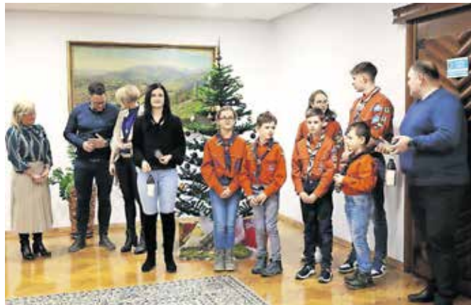
Kamniški skavti so prinesli plamen luči miru iz Betlehema z geslom Premostimo in razsvetlimo.

bili tudi drugi svetniki in svetnice. Podžupan se je kamniškimi skavtom zahvalil za pozornost in prizadevanje, da občanom vsako leto prinesejo plamen luči miru. Kamniški skavti pa so ob obisku prenesli naslednjo poslanico: »Nasprotje med mrazom in toploto, žalostjo in veseljem, grozotami in mirom, temo in svetlobo. Ko doživimo prvo, šele zares spoznamo dragoceno vrednost drugega. Ko vidiš ne-