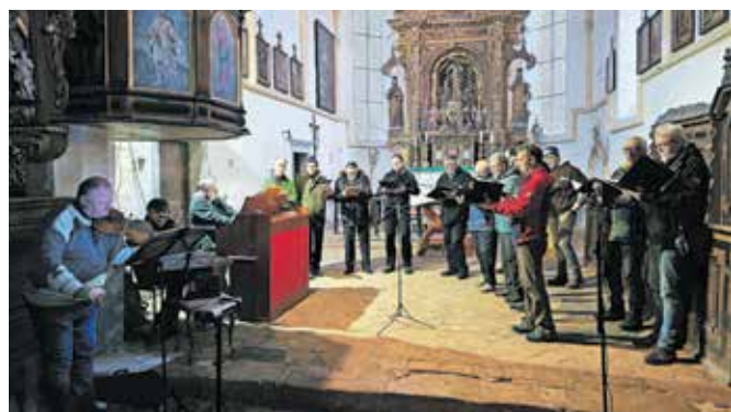
Pevske jaslíc v cerkvi sv. Primoža

možen način smo iztekajoče se leto spet zaključili skupaj z vami. Za vse, ki zaradi takšnih ali drugačnih obveznosti niso prišli k sv. Primožu, pa smo pripravili ponovitvi 6. januarja v Domu krajanov Godič in 7. januarja v cerkvi Marijinega vnebovzvetja v Mekinjah, kjer smo najprej peli pri sv. maši, po njej pa je potekala še ponovitev koncerta pred oltarjem.