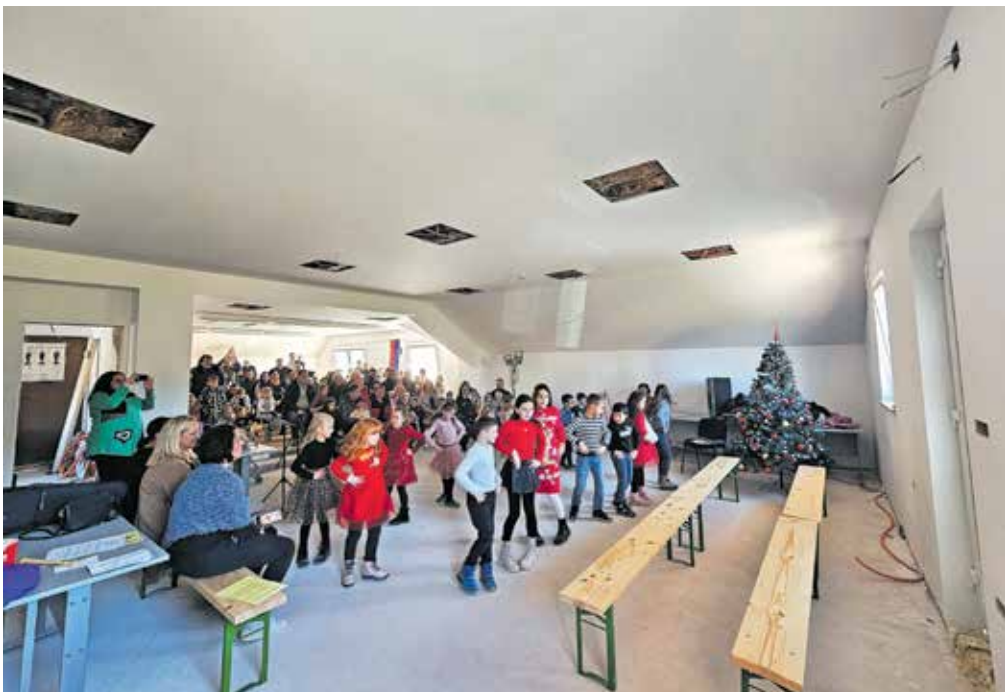
Nova dvorana PGD Gozd

dvorane je v zadnjih dveh letih z dvakrat po dvajset tisoč evrov podprla Občina Kamnik (v letu 2024 pa bo v ta namen namenila še dodatnih 25 tisoč evrov), preostali del stroškov pa smo pokrili s prejetimi donacijami in