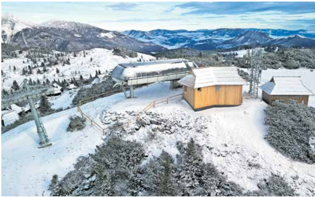
Pogled na novo šestsedežno napravo na Veliki planini

Spomnimo, na javnem razpisu za gradnjo nove sedežnice je bila izbrana skupna ponudba izvajalcev, družb Leinter in Riko, ki sta