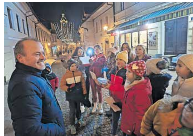
Učenci OŠ Frana Albrehta so mimoidočim na kamniških ulicah zaželeli srečen božič ...

Adventni čas je priložnost, da se ljudje malo ustavimo, se zazremo drug drugemu v oči in si izmenjamo želje, ki nam ob uresničitvi lepšajo