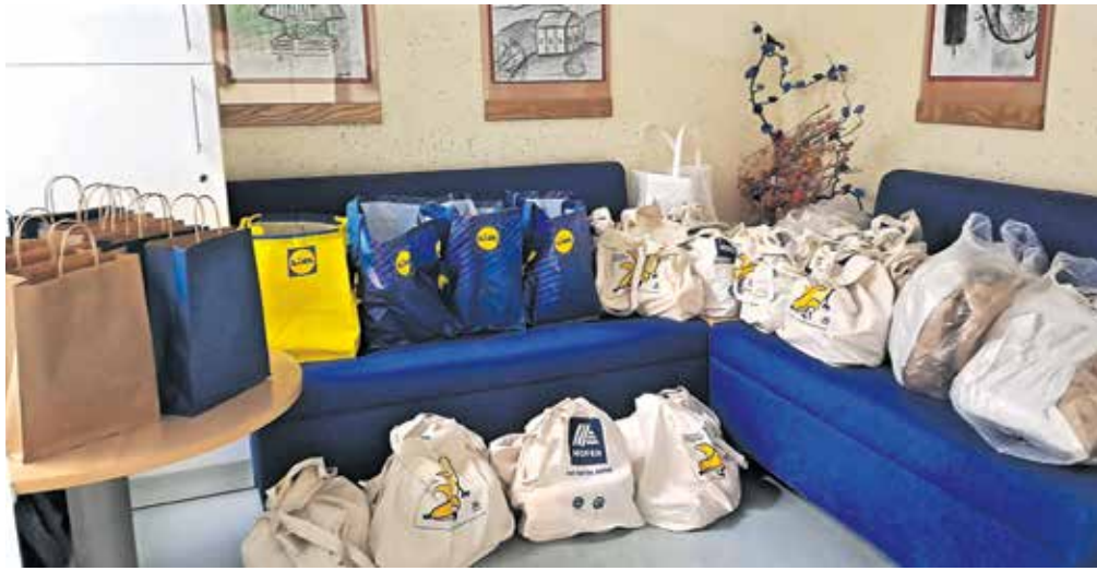
Paketki, s katerimi so na Osnovni šoli Marije Vere pomagali družinam v stiski

bili torej paketi bogati, in verjamem, da bodo tem družinam prižgali vsaj malo iskrico v očeh. V nekaterih razredih so otroci sami poskrbeli za hranilnike po učilnicah in so vanje pridno metali kovance,