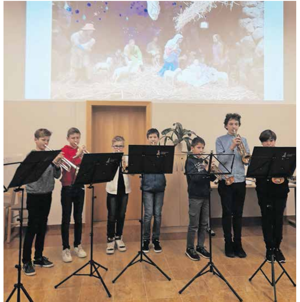
Koncert učencev Glasbene šole Kamnik pri frančiškanih

V soboto, 23. decembra, nas je v praznične dneve ponesel odlični koncert Mešanega pevskega zboru Musica viva