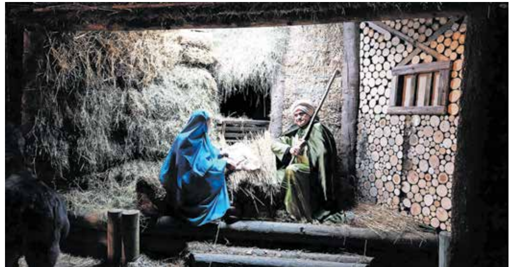
Žive jaslíc v Snoviku

Ni božiča brez jaslíc, ki na simboličen način prikazuje rojstvo malega kralja, ki se je rodil v ubogem hlevč-