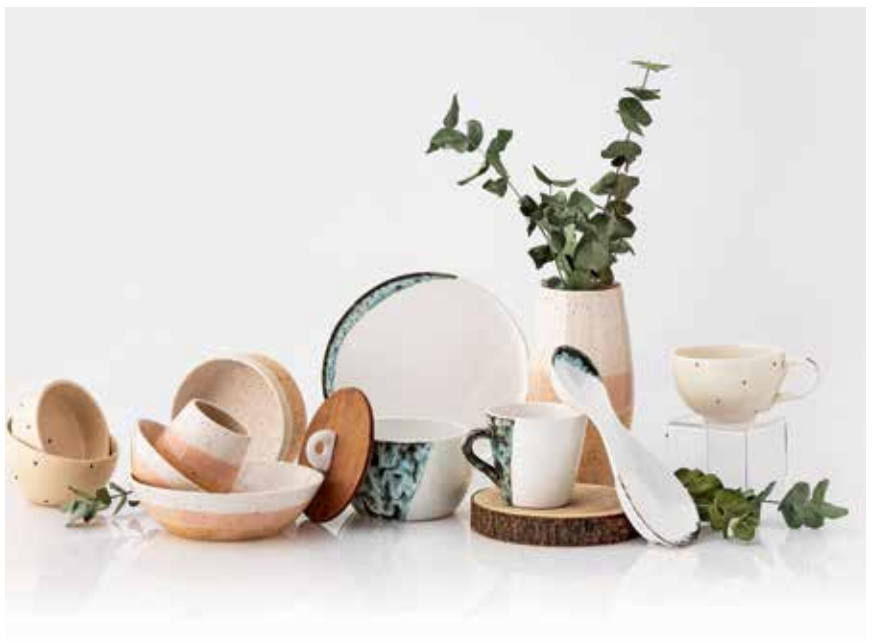
Izdelki tudi za vsakdanjo uporabo

rehabilitacije in delovne terapije z namenom postopnega – »po korakih« – vračanja v vsakdanje okolje.