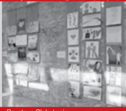
Razstava Plakat miru