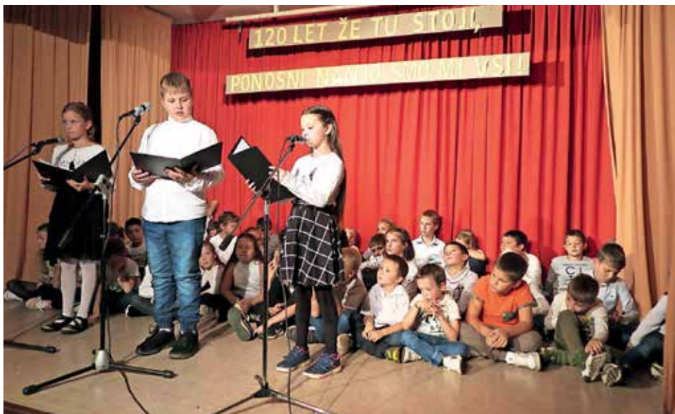
Šolarji so poskrbeli za zanimiv program in nasmejali zbrane v dvorani zadružnega doma na Bukovici.