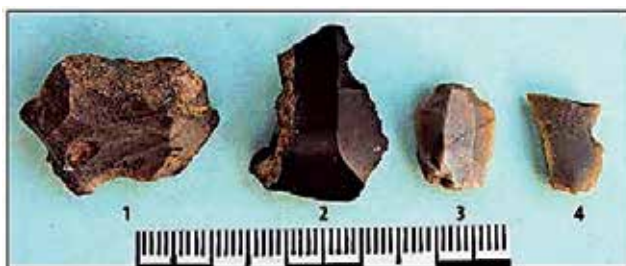
Kamene najdbe z Ratitovca (po Jamnik, Bizjak 2015, 276)

kar pomeni, da so kamnita orodja izdelali na mestu samem in jih niso prinesli s seboj. Poleg izdelanih orodij so bila tako na najdišču odkrita tudi kamnita jedra, razbitine, okruški in luske, skratka vsi stranski produkti, ki nastanejo ob izdelavi. Kamena orodja so ljudje izdelovali in uporabljali vse od starejše kamene pa vse do bronaste