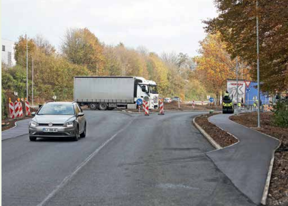
V tem tednu na krožišču Lipica potekajo zaključna dela. / Foto: Gorazd Kavčič

Obnova Kidričeve ceste v Škofji Loki se je zaključila, prav tako pa se občani že lahko vozijo po novozgrajenem krožišču Lipica na regionalni cesti Škofja Loka–Ljubljana.