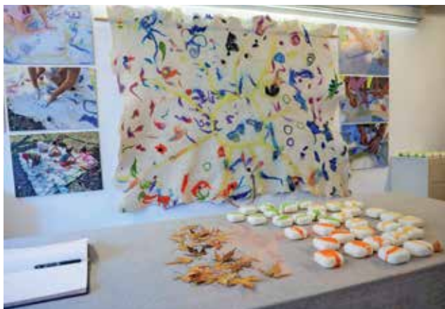
Žareče sonce in čarobne sanje so poimenovali stensko tapiserijo, ki so jo številne roke ustvarjale več mesecev.

Gorenjski glas je najbolj bran regionalni časopis v Sloveniji.