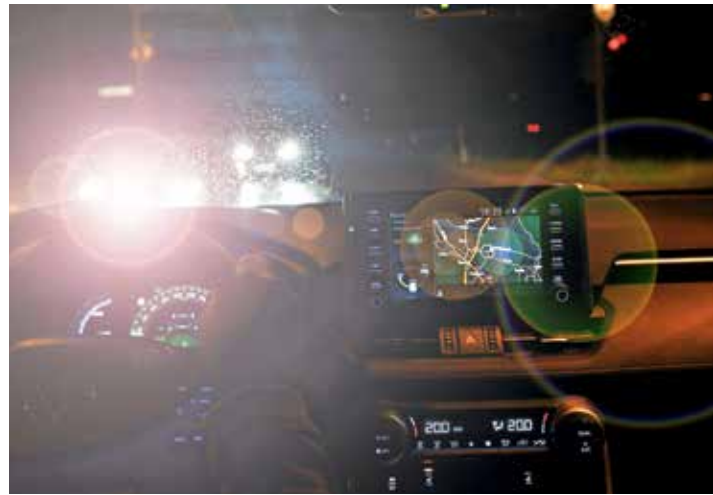
Bleščanje žarometov

Ponuja se rešitev, po kateri bi morali LED žarometi vsebovati obe zasnovi: za zasenčene luči bi morali imeti odbojnik svetlobe, za dolge luči pa projekcijsko zasnovi.