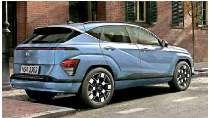
Kona se je z izrazito in daljšo bočno linijo ter poudarjenimi blatniki oblikovno približala večjemu bratu Tucsonu.

Zanimivo je, da je razvoj in obliko pogojevala električna verzija, in ne obratno, kot je bilo v navadi, in tu tiči razlog za futuristično podobo avtomobila. Kona je v dolžino zrasla za 17 cm in meri 435 cm. Estetsko dovršena kabina prinaša več prostora in praktičnosti. Na cesti bo prepoznavna z dvema širokima LED trakovima, ki potekata spredaj in zadaj po celotni širini avtomobila.