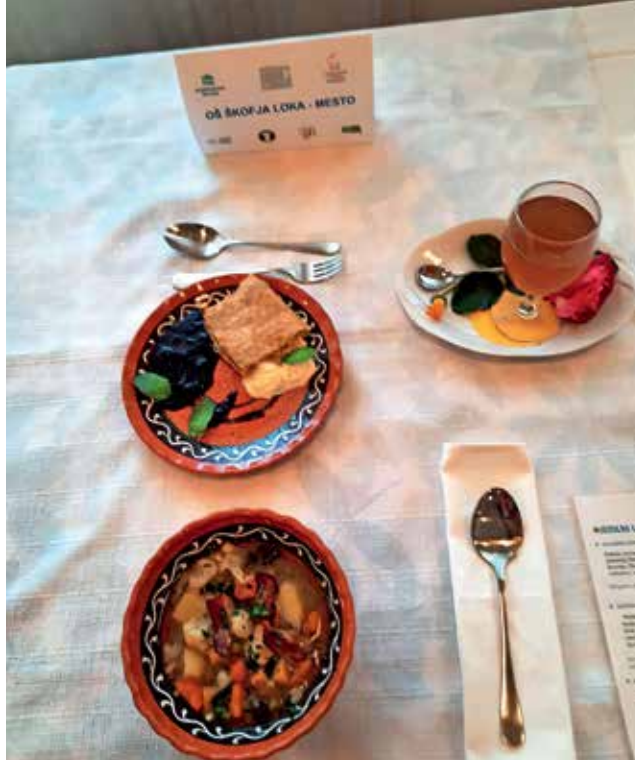
Na regijskem tekmovanju so navdušili s praznično čorbo, božansko sladico in rožnim napojem.

Postopek: Na olivnem olju popražimo sesekljano čebulo. Ko začne rumeneti, dodamo sesekljan česen in pražimo, da zadiši. Dodamo meso in pražimo, da zakrknje in se posuši tekočina. Dodamo korenje, krompir in kolera bo in popražimo. Zalijemo z jušno osnovo in začинimo s šetrajem, timijanom in lovorovim listom, posolimo in popopravimo. Ko je zelenjava napol kuhana, dodamo cvetačo, fižol in grah. Kuhamo toliko časa, da je trda zelenjava kuhana na ugriz. V mineštro vlivamo vlivance in kuhamo še 5 minut. Preden postrežemo, začинimo še z majaronom in jabolčnim kisom. Na olju ocvremo rezine slanine, ki jih dodamo na servirano mineštro. Potresemo s sesekljanim peteršiljem.