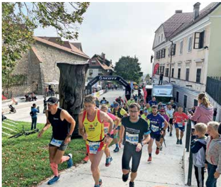
Udeleženci Lubnik traila so se iz Škofje Loke podali na Lubnik in nazaj.

Lubnik trail je del tekaške serije Gorenjska, moj planet, ki se bo zaključila 3. decembra z Miklavževim tekom v Snoviku.