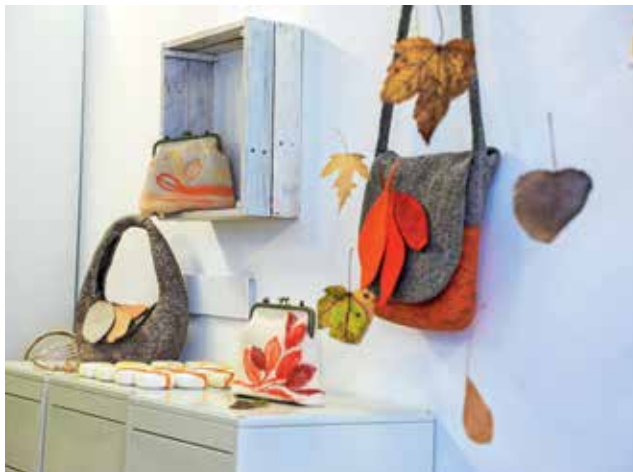
S svojimi volnenimi izdelki se predstavlja mojstrica Darja Rant.

Razstava združuje različne pristope k oblikovanju ter tehnike in načine dela. »Narava je neskončen vir navdiha in prostor povezave s samim sabo. Jesen je posebna – kljub hladu in temi privabi iz listov barve, ki osvetljujejo vedno krajše dni.« Kakor listje šelesti pod nogami med sprehodom po gozdu, šelestita tudi volna in milnica med polstenjem. »Ponazarjata akcijo in gi-