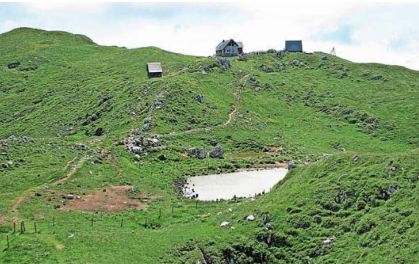
Pod kočo na Ratitovcu se nahajata dva večja kala

Srednja kamena doba (mezolitik) je obdobje med starejšo (paleolitik) in mlajšo (neolitik) kameno dobo. Najdišče iz tega obdobja na Loškem je bilo odkrito na Ratitovcu.