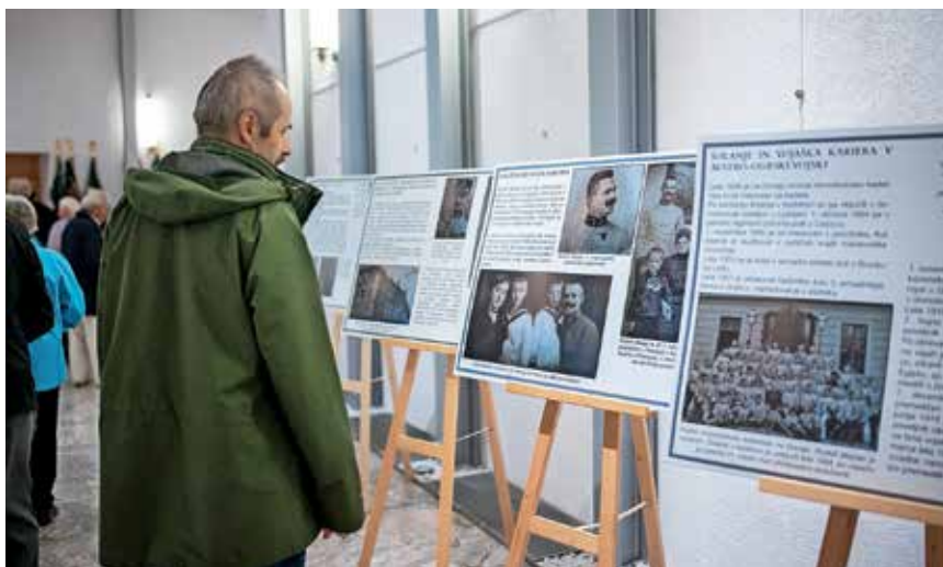
Z razstavo so v javni spomin vrnili 62 imen rojakov, ki so sodelovali v bojih za severno mejo.