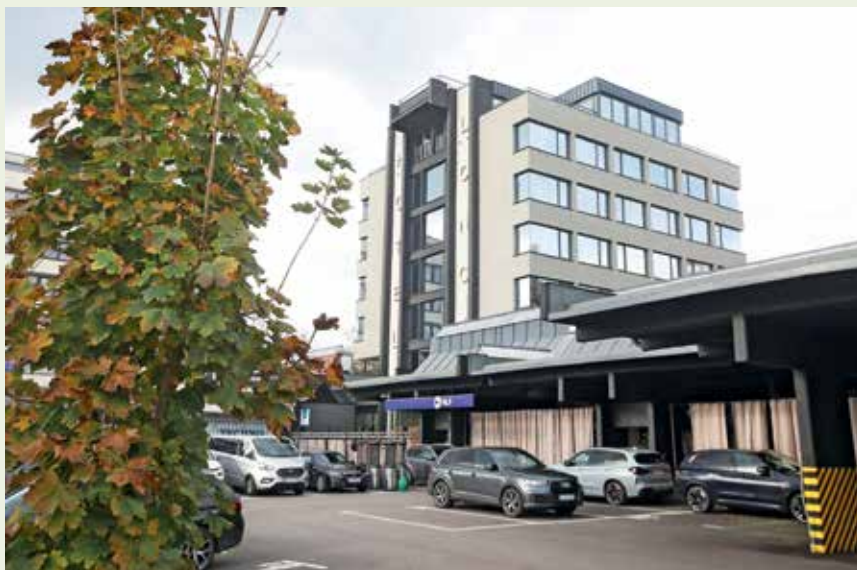
Gostje Lonca lahko pakirajo v neposredni bližini hotela.

odlično izhodišče, saj so blizu tako Ljubljane kot gorenjskih hribov. Glede na to, da v mestu cveti industrija, je hotel primeren tudi za sestanke in izobraževanja, saj ima tudi konferenčno sobo.