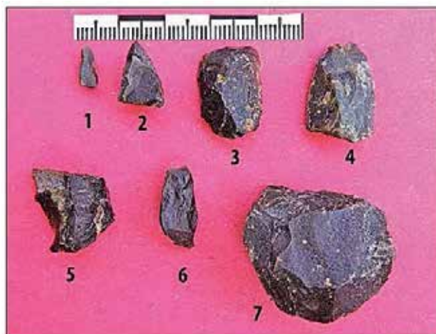
Kamene najdbe z Ratitovca (po Jamnik, Bizjak 2015, 277)

Tudi na Loškem ozemlju poznamo mezolitsko najdišče na prostem, ki je bilo odkrito v visokogorju, natančneje na Ratitovcu. Zahodno pod planinsko kočo se v kotanjasti izravnavi tik ob prelazu pod večjo skalno steno nahajata dva večja kala. V primeru kala gre za plitvo kotanjo, v kateri se zbira deževnica. Zaradi nepropustne plasti ilovice na dnu voda ne pronica v zemljo, ampak se tu zadržuje ves čas. Take kotanje so bile v visokogorju pomemben vir vode za živali in ne nazadnje tudi za ljudi, saj so vodni viri tu omejeni. Človeško prisotnost ob obeh kalih nakazuje odkritje 29 primerkov kamene industrije,