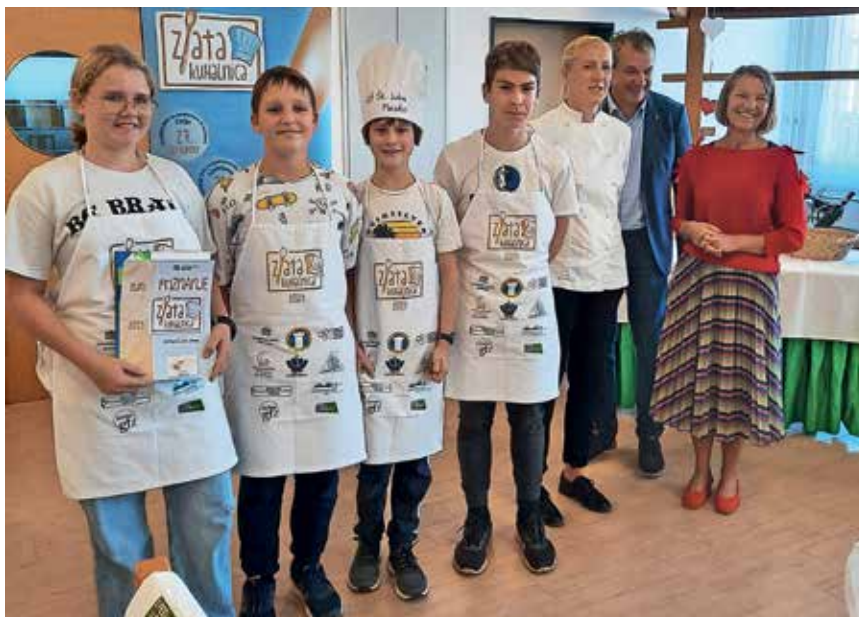
Ekipa mladih kuharjev z OŠ Škofja Loka – Mesto

Sestavine za mineštro za 6 oseb: 75 g (pol ene) sesekljanje rjave čebule,