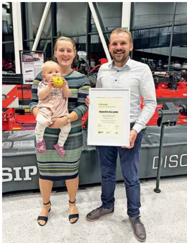
Na izboru za inovativnega mladega kmeta sta prejela priznanje za največ glasov v spletnem glasovanju.