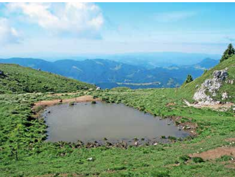
Bližnji pogled na enega izmed kalov

kar pomeni, da so kamnita orodja izdelali na mestu samem in jih niso prinesli s seboj. Poleg izdelanih orodij so bila tako na najdišču odkrita tudi kamnita jedra, razbitine, okruški in luske, skratka vsi stranski produkti, ki nastanejo ob izdelavi. Kamena orodja so ljudje izdelovali in uporabljali vse od starejše kamene pa vse do bronaste