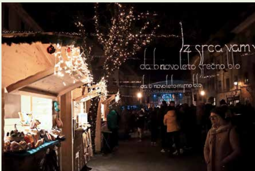
Decembrsko vzdušje v Škofji Loki bodo tudi letos popestrile hiške na Mestnem trgu.