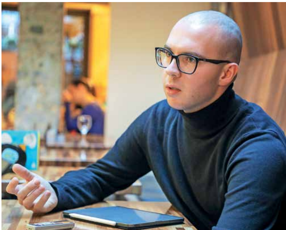
Prostovoljstvu se je zapisal že pri tabornikih.

Moj cilj, recimo pri omenjeni akciji Škrat za 1 dan, ni pomagati državi, ampak konkretnim ljudem. Po drugi strani pa mogoče ravno zaradi prostovoljskih ur ni politične volje, da bi kaj spremenili.