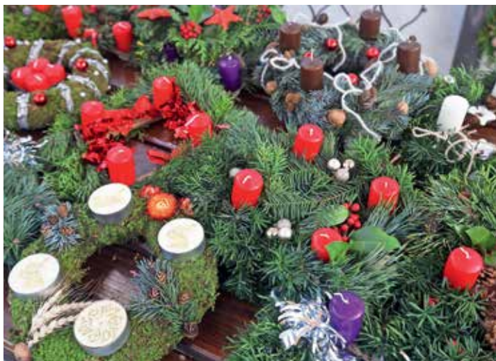
Adventni venčki