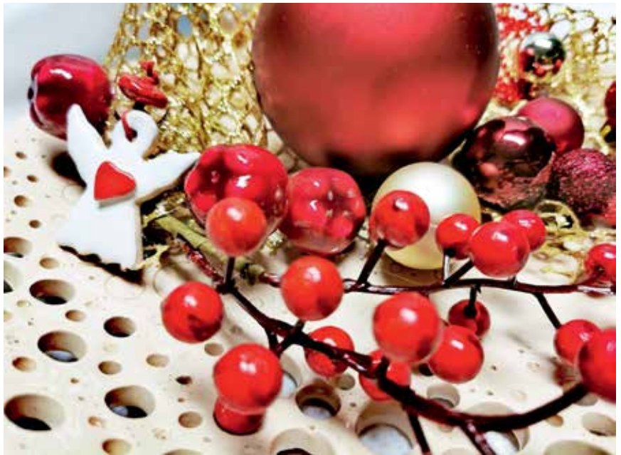
Na Korakovem bazarju bodo božično-novoletni izdelki.

ljenje, in tistih, ki jim je poškodba prekrizala pot in jim je bila ta možnost odvzeta. Svečani bazar bo, kot so povedali, ponudil vrsto izdelkov, ki jih uporabniki v Centru Korak in zaposleni invalidi na zaščiteneh delovnih mestih v Zaposlitvenem centru Korak izdelujejo v okviru