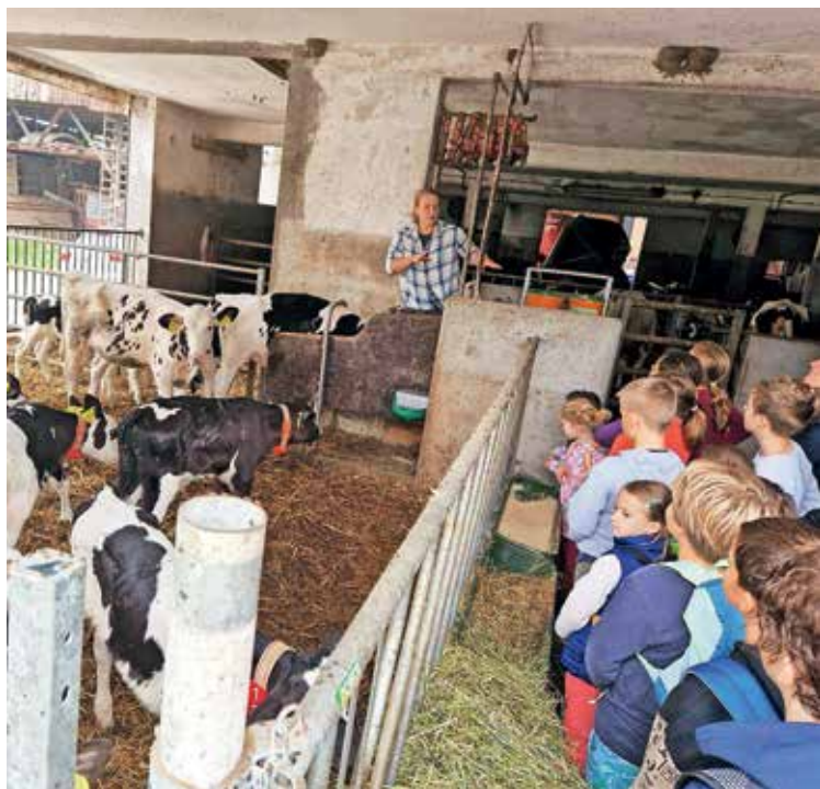
Velik poudarek namenjata ozaveščanju in izobraževanju, tako da sta vesela obiska otrok iz vrtcev in šol.

Vesela sta, da prodaja še vedno raste, zato presežek vlagata v razvoj – tudi v skrbi za okolje, kar jima je zelo pomembno. »Menim, da bodo morali kmetje način