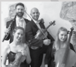
Kvartet Tamino, foto: Jana Jocič

Petek, 1. 12., ob 17.00 Prižig prazničnih luči (Mestni trg)