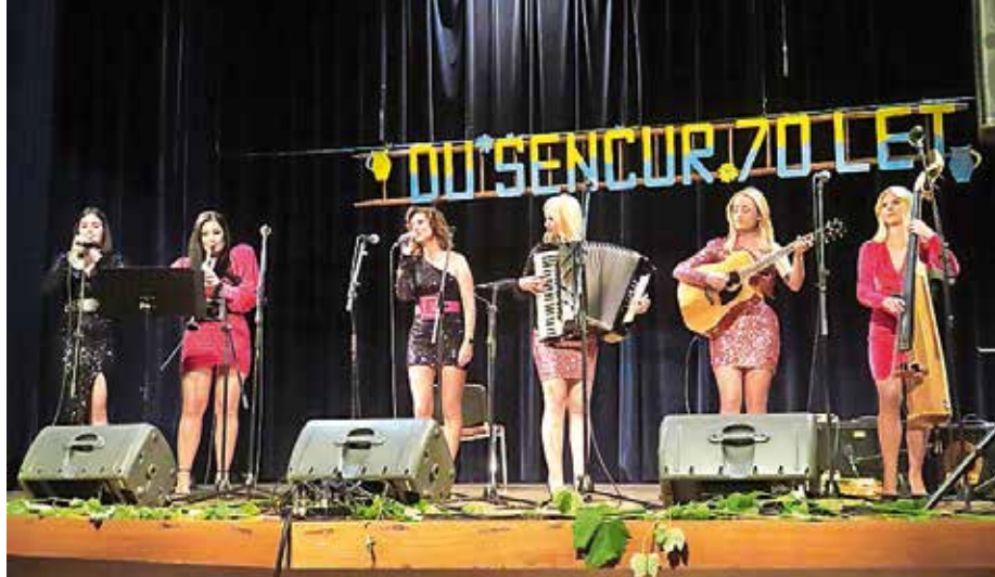
Skupina Ladies je navdušila šenčursko občinstvo. / Foto: Franci Erzin

Oktoberja je v Domu krajanov Šenčur potekal 14. koncert Šenčurska glasbena srečanja.