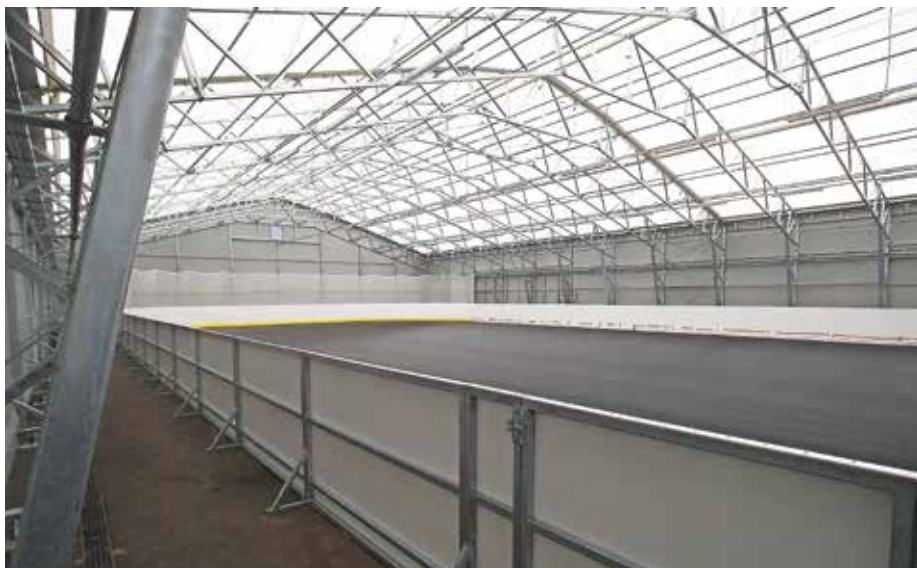
Pokrito drsališče v Športnem parku Šenčur bodo odprli predvidoma v začetku prihodnjega leta.

Problematika umestitve objekta, kjer bi Komunala Kranj skladiščila in obdelovala odpadke, ima dolgo zgodovino. Ker lokacija v Kranju, kjer se trenutno izvaja dejavnost zbiranja odpadkov, ni ustrezna, občine solastnice že vrsto let iščejo ustrezno rešitev. Predlagateljica ene od lokacij je bila v preteklosti tudi Občina Šenčur, a do dogovora ni nikoli prišlo. Že več kot pred desetletjem smo predlagali umestitev sortirnice odpadkov ravno na območje znotraj avtocestnega priključka Kranj vzhod. Ker se Mestna občina Kranj (MOK) tedaj ni odločila za odkup našega zemljišča na omenjenem območju, smo ga prodali na javnem