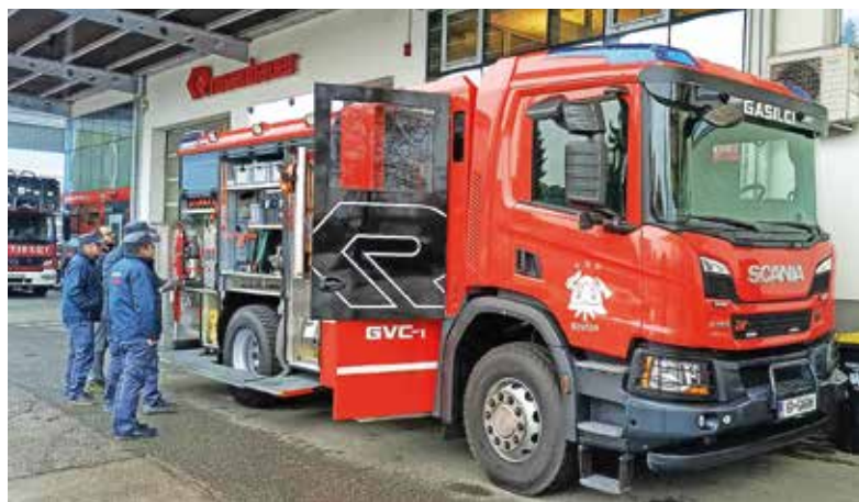
Gasilci PGD Šenčur so pred kratkim prevzeli novo vozilo, uradni sprejem in blagoslov bosta predvidoma v maju prihodnje leto.

Glede na obsežne naravne nesreče in številne požare je bilo leto precej stresno in nič kaj prijazno, zlasti ne za gasilce in pripadnike Civilne zaščite. Naj se jim ob tej priložnosti še enkrat zahvalim za njihovo požrtvovalnost in nesebično pomoč. Kar se tiče investicij, jih nismo uresničili toliko, kot bi si želeli. Ovirala so nas soglasja oziroma dejstvo, da jih nismo pridobili. Smo pa začeli graditi drsališče, ki so si ga občani dolgo želeli. Gradi se tudi Dom starejših Šenčur, ki bo velika