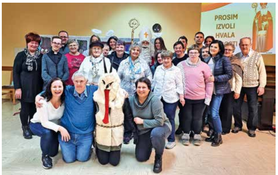
Miklavž je obiskal skupino Vera in luč

Oprosti, prosim, hvala, izvoli ..., ki se nam rade izmuznejo iz naših pogovorov. Skupaj z igralci smo priklicali Miklavža v spremstvu angelov in parkeljnov. To je mož ne le dobrote, tem-