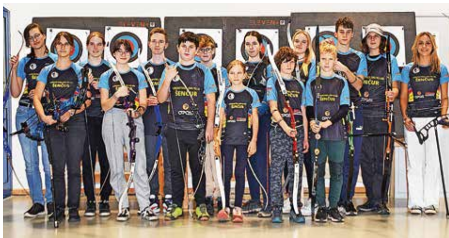
Lokostrelski klub Šenčur deluje od leta 1983.

Zimska sezona se je že začela. Ena izmed tekem za slovenski dvoranski pokal bo potekala tudi v Šenčurju v organizaciji Lokostrelskega kluba Šenčur. Tekmovanje bo 16. decembra v Športni dvorani Šenčur, kjer bodo nastopali tekmovalci v več kategorijah in slogih. Tekmovanje je še toliko bolj zanimivo, ker poleg tega, da se bodo v vrstah lokostrelcev borili tudi naši člani, v LK Šenčur letos zaznamujemo štirideset let obstoja. V teh letih je pod spretnim vodstvom trenerjev in mentorjev vzkl-