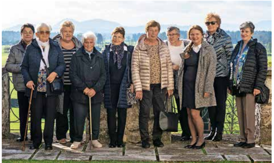
Skupina Koprive ob praznovanju desetletnice

Pravila skupine so jasna, nič politike in cerkve, pa tudi sosede bomo pustile na miru – in tega se držimo še danes. Tako nam ostajajo lastne teme, zgodbe, ki nam jih piše življenje, letni časi, naši najdražji, kdaj pa kdaj tudi vreme. Učimo se govoriti o sebi, o lepih in tistih manj lepih trenutkih, si dovolimo biti ranljive in ravno skozi ranljivost smo odkrile tudi moč ženske podpore. Postale