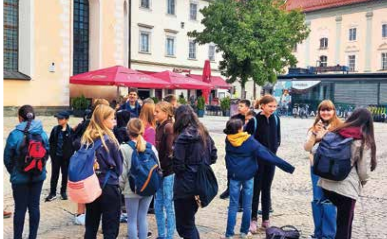
Izlet Osnovne šole Šenčur na avstrijsko Koroško

Pot nas je vodila do romarskega središča Gospa Sveta, najstarejše cerkve na slovenskem ozemlju. Zgraditi jo je dal misionar Modest, ki je med Karantance širil krščanstvo. Gospa Sveta je dala ime Gosposvetskemu polju, kjer je v slovenščini potekalo ustoličevanje karantanskih knezov. Tam sta stala knežji kamen (od 1862 v celovškem muzeju) in vojvodski prestol, na katerem sta sedela knez in škof ter podeljevala zemljo vazalom, ki so jima zato nudili pokorščino in vojaško službo. Mimo križevega pota smo prilezli do Krnskega gradu, političnega središča Karantanije. Tu smo se soočili s ponemčevanjem zamejskih Slovencev, slovenska imena in priimke na nagrobnikih so spremenili v nemška. Sledila je atrakcija,