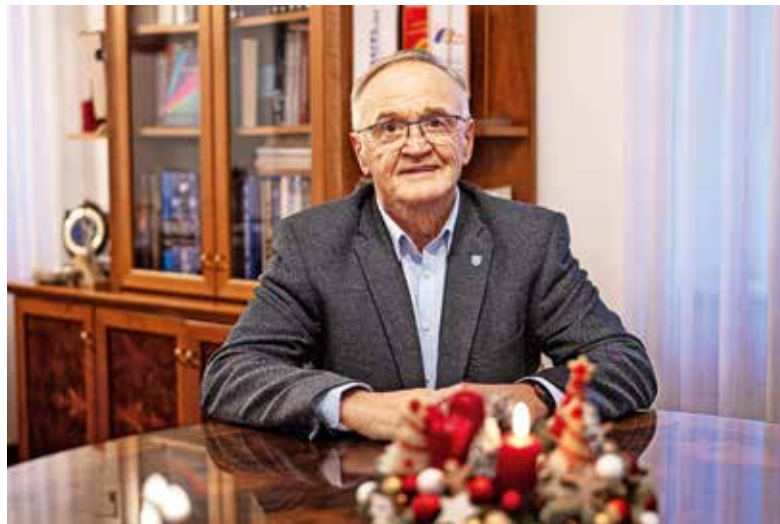
Župan Ciril Kozjek

Med osnutkom, ki je bil mesec dni v javni razgrnitvi, in predlogom proračuna bo nekaj razlik, a osrednje investicije ostajajo nespremenjene. Vsako leto namenjamo več kot milijon evrov za odkup zemljišč. Pričakujemo, da bomo prihodnje leto kupili vsa zemljišča za izgradnjo športnega parka Šenčur, ki trenutno ne izpolnjuje pogojev za kakovostno športno udeleževanje. Po odkupu bomo pristopili k izgradnji nogometnega igrišča z umetno travo. Za ta del že imamo gradbeno dovoljenje, prav tako je potrjen podrobni občinski prostorski načrt. Prihodnje leto pričakujemo začetek gradnje ceste z mešano površino za pešce in kolesarje med naseljema Voklo in Trboje. Prizadevamo si, da bi čim prej pridobili manjkajoča zemljišča. Izbran je bil že izvajalec del, predvidoma decembra bo zaključena tudi revizija. Sestali smo se s predsedniki krajevnih in vaških skupnosti, ki so podali svoje predloge, večino smo upoštevali. Po sprejemu proračuna jih bomo pisno obvestili, kaj bomo v posameznem naselju storili. Veliko sredstev namenjamo gasilcem. Naslednje leto je za novo gasilsko vozilo na vrsti PGD Visoko. Pred kratkim so sodobno vozilo prejeli gasilci PGD Šenčur, uraden prevzem in blagoslov bosta predvidoma v maju naslednje leto. Vozilo je stalo 270 tisoč evrov, občina je prispevala sedemdeset odstotkov. Hkrati se nadajamo, da bo čim prej dokončana garaža ob obstoječem