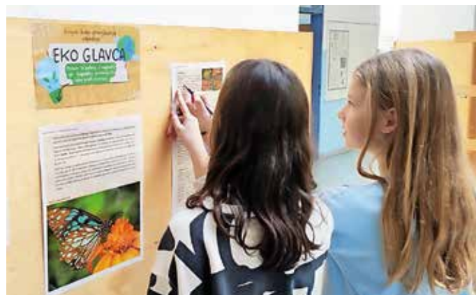
Letos smo akcijo poimenovali Ekoteden. / Foto: arhiv šole

Letos smo akcijo poimenovali Ekoteden, saj smo aktivnosti načrtovali za vsak dan v tednu od 20. do 24. novembra. Projekt smo povezali s projektom Erasmus+, ki poteka na naši šoli. Ponedeljku smo namenili eko čvek, pri pouku smo se pogovarjali o ekoloških temah, si ogledali poučne videoposnetke, brskali po knjigah. V torek smo pri uri oddelčne skupnosti izvedli dejavnosti, kjer so učenci spoznavali okoljsko problematiko na različnih področjih, krepili občutek soodgovornosti in povezanosti med ljudmi. Učenci višjih razredov so tudi kritično razmišljali ter argumentirano izražali svoja mnenja in stališča. Učenci iz vsakega razreda so zapisali po štiri zanimivosti iz ekologije, ki smo jih poimenovali eko dejstva in jih izobesili v eko koticu. V sredo smo izvedli eko kviz, ki smo ga poimenovali Eko glavca, in preverili znanje naših mladih eko nadobu-