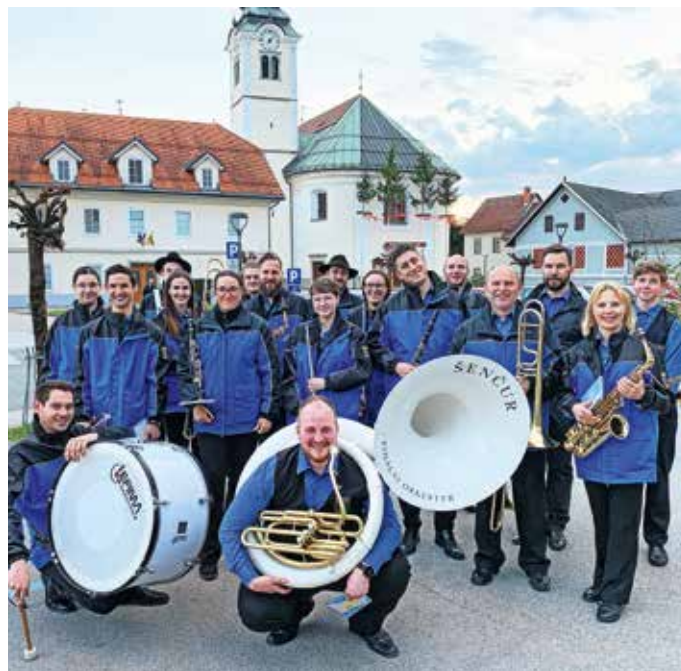
Pihalni orkester občine Šenčur bo letos pripravil božično-novoletni koncert z naslovom Pod šenčursko marelo.

Če pa še ne igrate instrumenta, ki spada v pihalni orkester, pa najprej vabljeni v Godbeno glasbeno šolo Šenčur. Letos jo