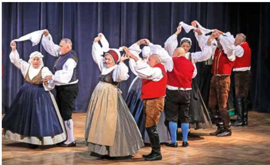
Bilo je nekoč in je še vedno – s folklorno skupino Folklornega društva Šenčur.

Konec oktobra so plesalke in plesalci v zrelih letih navdušili z dobro pripravljenimi koreografijami in ljudsko pesmijo ter s prikazom starih običajev občinstvo popeljali v nekdane čase, hkrati pa so dokazali, kako lepa so lahko leta v tretjem življenjskem obdobju. S sodelovanjem v folklorni skupini še posebno, bi dodali člani domačega Fol-