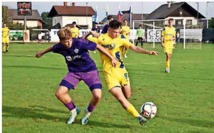
Šenčurski nogometaši nizajo uspehe.

Z dobrimi rezultati se lahko pohvalijo tudi mlajše ekipe, ki nastopajo na tekmovanjih pod okriljem MNZ Gorenjske. Vse mlajše selekcije od decembra naprej nastopajo na tekmovanju zimske lige. V Nogometnem klubu Šenčur se letos lahko pohvalijo s kar 16 ekipami – od najmlajših iz programa vrtec pa vse do članske ekipe – ter z več kot 300 člani društva, kar je največ uradno registriranih ekip in članov do sedaj.