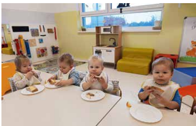
Ob tradicionalnem slovenskem zajtrku