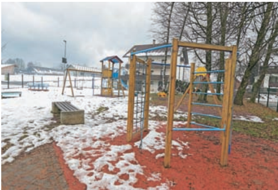
Na otroškem igrišču smo zamenjali nekaj igral, obnovljene so tudi varnostne talne obloge.

Krajevna skupnost Kokrica, Cesta na Brdo 30, Kokrica