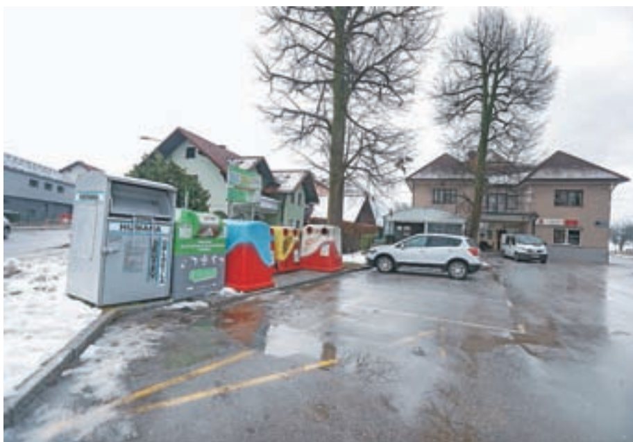
Odlaganje drugih smeti ob ekološkem otoku, ki je bilo redna težava pri Mercatorju, se zdaj pojavlja tudi na ekoloških otokih pri domu krajanov, v Srakovljah in na Velikem hribu.

Konec oktobra ste prejeli vabilo na prireditev ob deseti obletnici zaprtja smetišča Tenetiše. Kot je velikokrat poudarjeno, je civilna iniciativa, ki naj bi štela 450 krajanov Mlake, Kokrice, Tenetiš in ostalih dosegla, da se je smetišče zaprlo in da se tam ni zgradil center