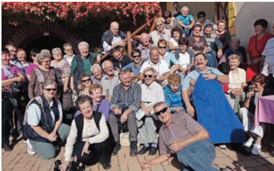
Na izletih je vedno prešerno.

Čprav smo kokriški upokojenci prečesali domovino po dolgem in počez, obiskali smo že vse pokrajine, nekajkrat smo šli tudi v zamejstvo, se še vedno najdejo kraji in koticiki, ki jih je vredno obiskati, pa tudi ponudba je vse večja. Včasih se mam zdi, da domovino dobro