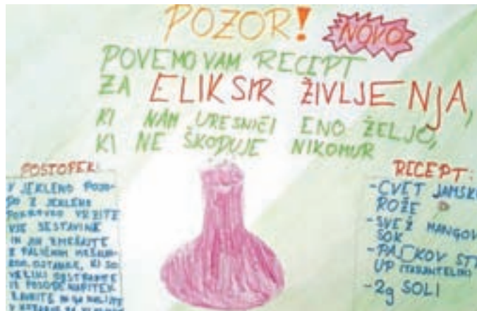
David, Črt, Gal, Ajna, 5. c

Takrat bodo na svetu samovozeči avtomobili, na cestah bo manj prometnih nesreč. Uvajati bodo začele stroje, ki jim boš povedal, kam bi želel iti, nato te bodo ti stroji na en dva tri prestavili na zeleno mesto. To bo super! (Gaja, 4. č)