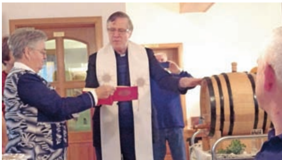
Na krstu mošta