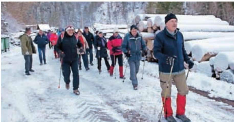
Januarja se bomo spet odpravili na spominsko slovesnost v dolini Lobnice.