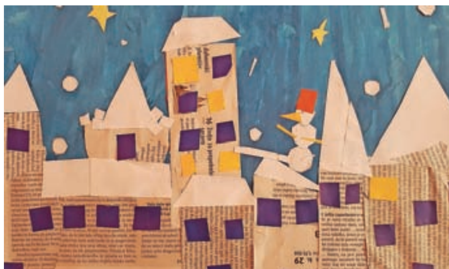
Julija, 2. c