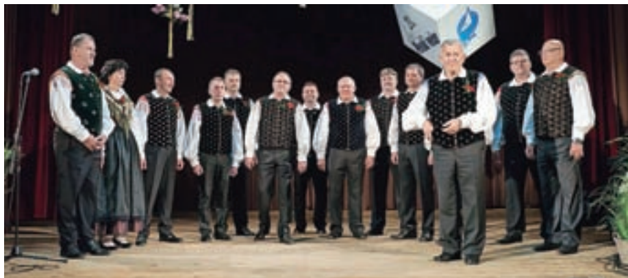
Vokalna skupina Kokrčan na 21. Pevskem večeru

Vseh nastopov je bilo kar veliko: podoknica kot presenečenje slavljenju, nastop in maša ob petdeseti obletnici poroke, konec oktobra pesem na pokopališču ob komemoraciji, koncertni nastop pri prijateljih v Borovnici ... Prireditvev Kdor hoče Janez bit', mora mleko pit' je