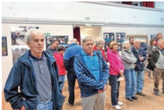
S fotografske razstave ob deseti obletnici protesta pred smetiščem Tenetiše

Vsak pa se spomni, da se je spor končal na civiliziran način z uspešno mediacijo in s sodno poravnavo. Ministrstvo je izdalo podaljšanje dovoljenja za slabo leto in pol pod novimi pogoji, Komunala Kranj se je obvezala dodatne pogoje spoštovati, krajanji Mlake in Tenetiš pa dopustiti ponoven dovoz odpadkov za dobro leto v zameno za iztožljivo obvezo, da na smetišču Tenetiše razen zbirnega centra ne bo nikoli več in nič več v zvezi z odpadki. Vse to se je potem tudi zgodilo. KS Kokrica je na temelju posebnega pisnega dogovora z Mestno občino Kranj kot kompenzacijo za negativne vplive smetišča dobila otroško igrišče. Zakaj igrišče stoji na Kokrici pri gasilskem domu, ne pa kje na Mlaki, pa prepuščam vaši