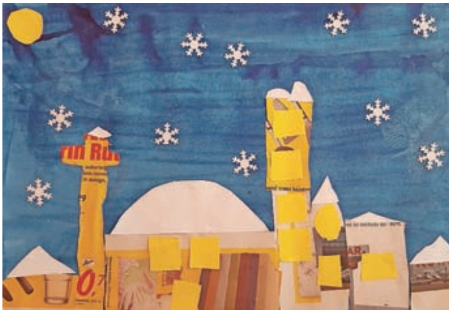
Bor, 2. c

Da bi bili ljudje bolj pametni. (Jošt, 3. c)