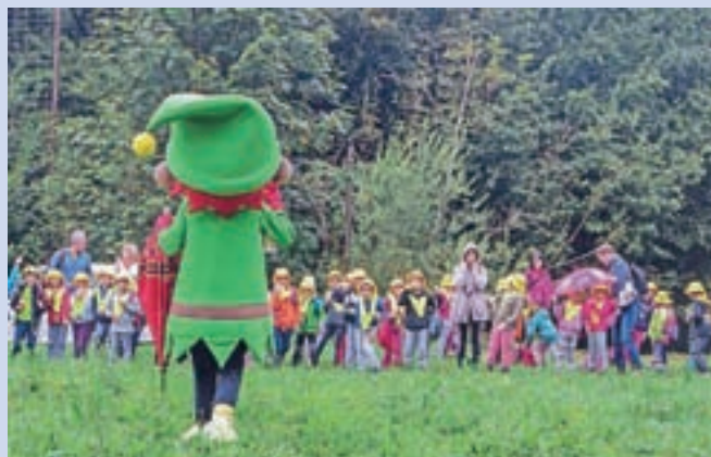
Pohoda po Mamutovi deželi se je udeležil tudi škratec Kranček, ki je še posebno razveselil otroke iz Osnovne šole Franceta Prešerna.

Kot že vrsto let zaključujemo program s Pohodom za domovino. Z baklami, pesmijo in harmoniko se po ulicah naše KS veselimo svoje domovine in lastne države. Za zaključek se nam pridruži vokalna skupina Kokrčan z zdravico ob kozarčku kuhanega. Po dobri božični