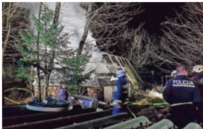
Požar v Tatincu

V mesecu novembru je v naši Gasilski zvezi Mestne občine Kranj ponovno potekala ocenitev društev. V oceno se šteje vse delo ter uspehi, ki smo jih dosegli v preteklem letu. Lanskoletnega uspeha, ko smo dosegli drugo mesto v celotni gasilski zvezi, nam ni uspelo ponoviti, pa vendar smo med 16 društvih v zvezi dosegli odlično peto mesto. Prav tako v novembru so naši operativni gasilci pomagali društvu Korak izvesti dobrodelni bazar na Brdu. Žal so nam 15. novembra ob 20.59 zopet zazvonili pozivniki. Gorela je lesena brunarica v Tatincu. Na intervencijo se je odpravilo osem operativnih gasilcev, ki so aktivno sodelovali v krotjenju rdečega petelina, z bokom ob boku pa smo sodelovali tudi z operativnimi člani PGD Britof in poklicnimi gasilci iz Kranja. V mesecu decembru bomo na vrata vaših domov ponovno potrkali člani našega društva. Pri