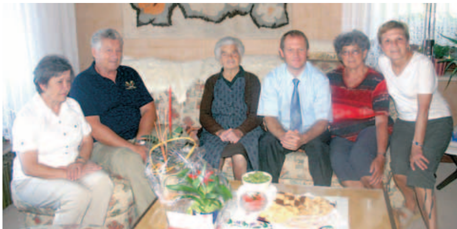
Pri gospe Mariji Noč

Zavedamo se, da je sodelovanje starejših in mlajših generacij pomembno za dobro počutje starejših ter spletnje prijateljskih vezi, ki jih ne sme biti nikoli premalo. Helena Čadež