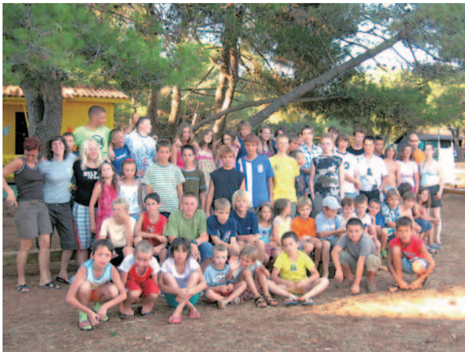
V letovišču Pinea v Istri so avgusta uživali tudi otroci iz občine Žirovnica.

Kaj pa pogoji za izvedbo poletnih počitnic?