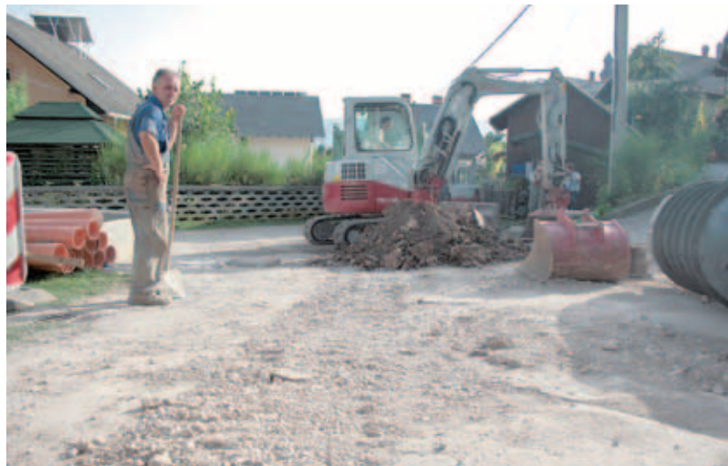
Gradnja kanalizacije na Breznici