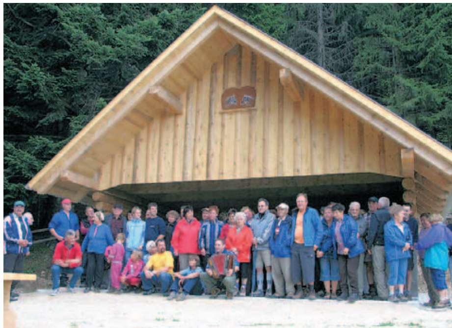
Na prijetnem srečanju na Zabreški planini se je 15. avgusta zbralo več kot 120 ljudi.

Na omenjenih planinah se prav zaradi ohranjanja krajine vedno prizadevajo širiti pašne površine. S posebej odmevnimi dosežki se lahko pohvalijo na Zabreški planini. V več letih so poleg širitve pašnih površin poskrbeli za temeljito prenovo objektov. Obnovili so kočo in hlev, dogradili in obnovili so šest napajalnih