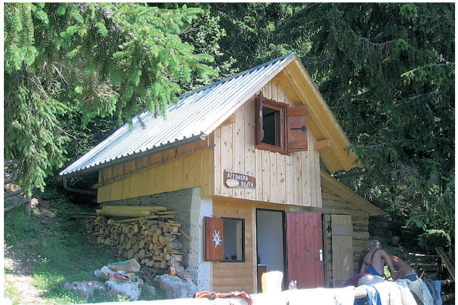
Zaključna dela pri nekdanji betonski bajti na Zabreški planini