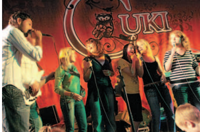
Najbolj pogumni so zapeli s Čuki.