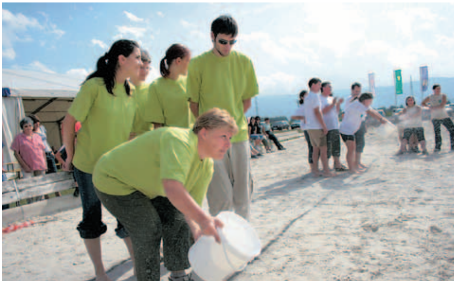
Ekipa iz Žirovnice med lovljenjem vode v vedro