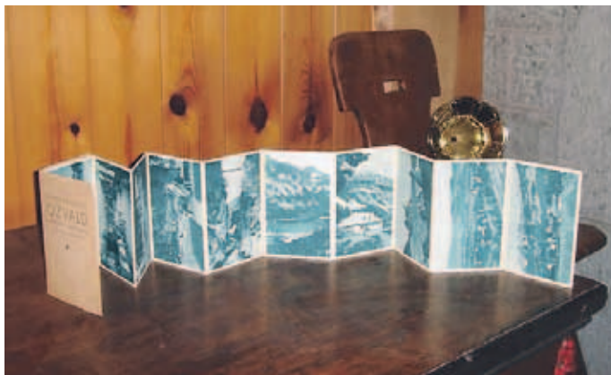
Prvi turistični prospekt iz leta 1936