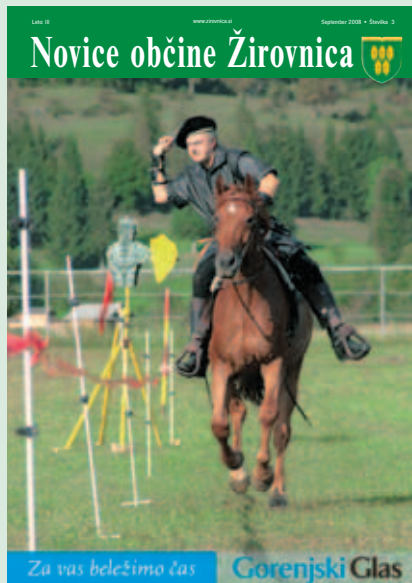
Na naslovnici: Viteške igre na Veselih dnevih

NOVICE OBČINE ŽIROVNICA (ISSN 1854-4932) - Ustanovitelj in izdajatelj: Občina Žirovnica, Breznica 3, 4274 Žirovnica. Pravice izdajatelja izvaja: Gorenjski glas, d. o. o., Kranj, Bleiweisova cesta 4, 4000 Kranj. Odgovorna urednica: Marija Volčjak. Urednica in novinarka: Ana Hartman. Časopis izhaja v nakladi 1.550 izvodov, brezplačno ga prejema vsa gospodinjstva v Občini Žirovnica. Tisk: Set, d. d., Ljubljana. Naslov uredništva: Gorenjski glas, d. o. o., Kranj, Bleiweisova cesta 4, 4000 Kranj, tel. 04/201-42-00, fax: 04/201-42-13, e-pošta: ana.hartman@g-glas.si; trženje oglasov: Aleš Šenk, ales.senk@g-glas.si, tel.: 041/638-980.