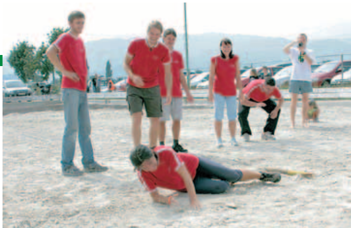
Po osmih vrtljajih okoli palice so le redki ostali na nogah.