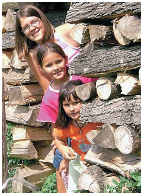
Ena od fotografij, ki je nastala na počitniški fotografski delavnici.

V knjižnici Matije Čopa so pripravili šest počitniških delavnic. Jeseni tudi delavnice za odrasle.