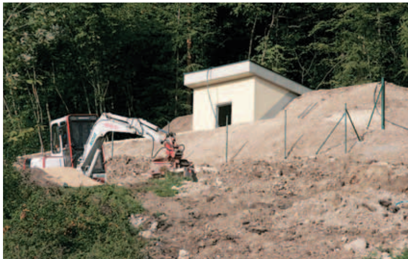
Zahvaljujoč novemu vodohranu nad Smokučem težav z zadostnim pritiskom vode v višje ležečih delih občine ne bo več.

”Prišlo je do zapletov s pridobivanjem zemljišč, kar je zdaj urejeno, prav tako pa smo glede predstavitev aleje slavnih iskali skupni jezik z zavodom za varstvo kulturne dediščine. A so na zavodu le prisluhnili idejni rešitvi projektanta in nam dali soglasje. Aleja slavnih je predvidena v sklopu ureditve šolskega trga, kjer bo cona brez prometa. Tam bomo dobili kvaliteten prostor, trg z ustrezno hortikulturno ureditvijo, kjer bodo možne prireditve, kot so