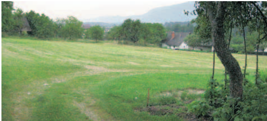
Središče Rodin, kjer je predvidena gradnja sedmih petstanovanjskih objektov.