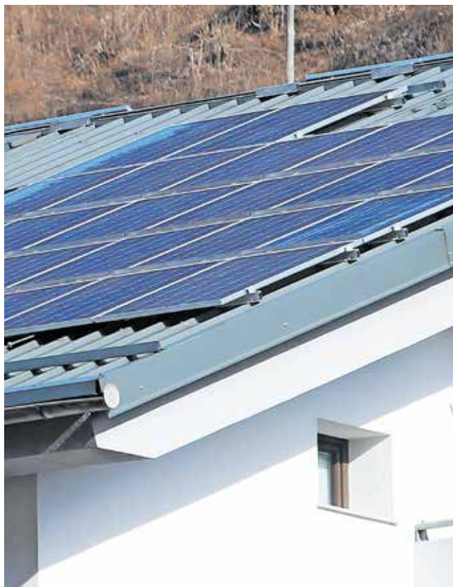
Zanimanje za sončne elektrarne je po izteku obdobja neto meritev precej upadlo. Fotografija je simbolična.

Kot dodajajo, konec obdobja neto meritev pomeni le konec ene dobe upravljanja zelene energije, novo