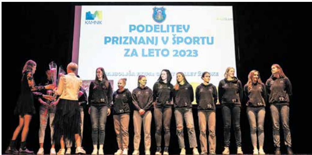
Najboljša kamniška ekipa v letu 2023 so članice Odbojcarskega kluba Calcit Volley.