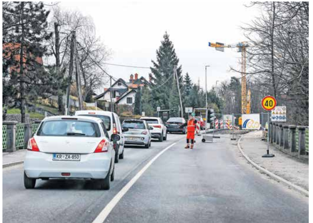
Prometni režim s polovično zaporo in izmeničnim enosmernim prometom na Betinu bo marca in aprila otežil pot domačinov in turistov na Bled.