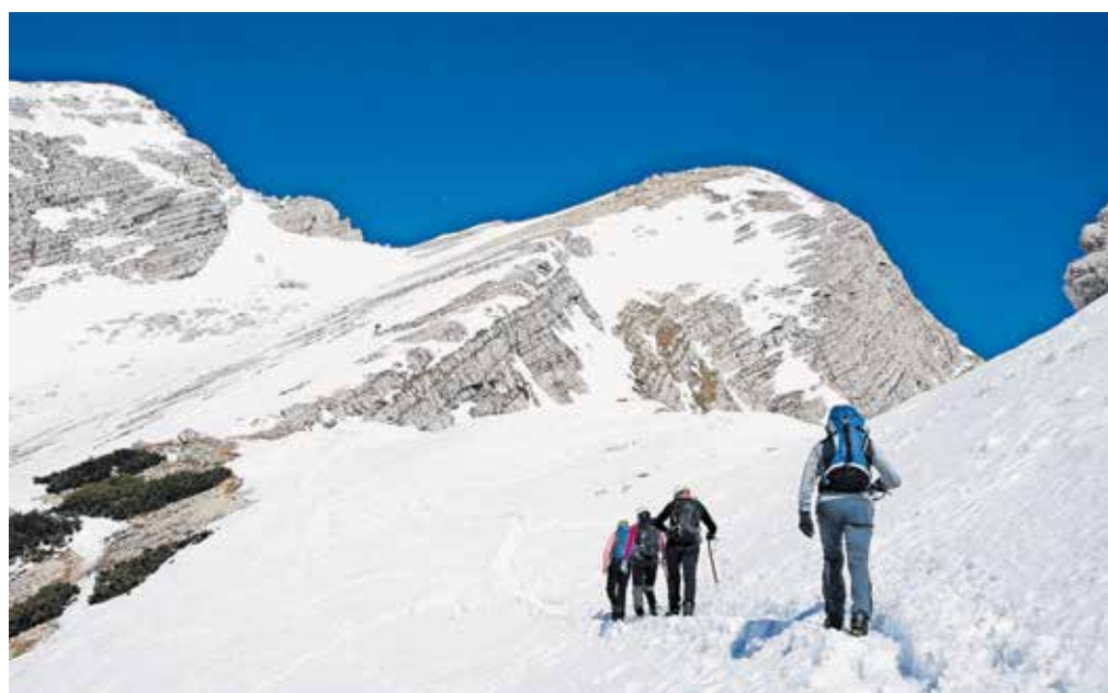
Prečenje Grebena proti Mali Mojstrovki

Škratica, Oltarji, Ponce, Lipnica, Frdamane police, Rigljica, Rušica. V ozadju Prisojnika se pokaže slovenski očaj Triglav. Pogled proti jugu se ustavi na Bavškem Grintovcu, pred nami pa je greben Velike in Zadnje