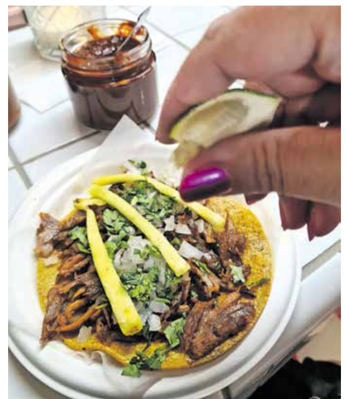
Priljubljeni »al pastor« z marinirano svinjino in ananasom

Eden od poskusov je namreč kosček daljne Mehike prinesel tudi na Jezersko, kjer sta fanta pripravila čisto pravo »barbacoo«, jed, ki jo v Mehiki začnejo pripravljati v petek zvečer, da je nared naslednje jutro, ko se vrnejo z zabav. Skopljejo jamo, jo obložijo z opeko, v njej zakurijo ogenj in počakajo, da se opeka tako močno segreje, da ustvari pečico. Na Jezerskem ima eden od fantov vikend in so se lotili poskusa, le da so pripravili piknik. Ko je bila jama nared in opeka segreta, so vanjo postavili kotel s čebulo, zelenjavo, čičeriko, rižem in začimbami, na rešetko nad kotel pa položili jagenjčka in ga prekrili