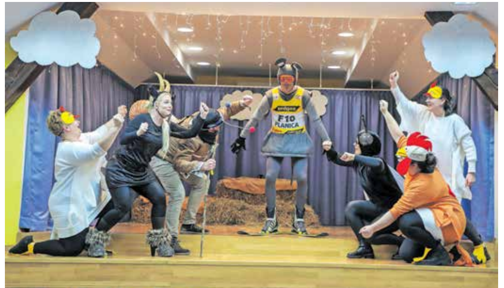
S skupnimi močmi živali Mišku pomagajo poleteti na veliki skakalnici.

Tokratno predstavo so navezali na letošnjo osrednjo temo v vrtcu, in sicer dejavnosti pripravljajo pod naslovom Poletimo skupaj, kot je tudi naslov predstave. »Otroci spoznavajo letenje, padalstvo, jadralno letalstvo ...«