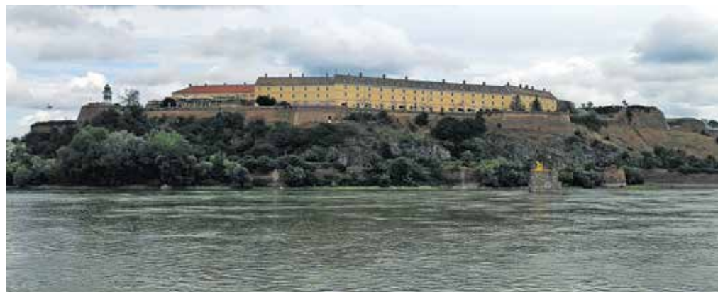
Petrovaradinska trdnjava na desnem bregu Donave

Kolesarili smo skozi naselja Begeč in Futog do našega cilja v Novem Sadu. Tik pred neurjem smo prispeli v hotel v središču mesta, se namestili v sobe in si privoščili kratek počitek. Neurje ni dolgo trajalo, tako da smo imeli še dovolj časa za ogled mesta. Po ogledu smo si privoščili večerjo.