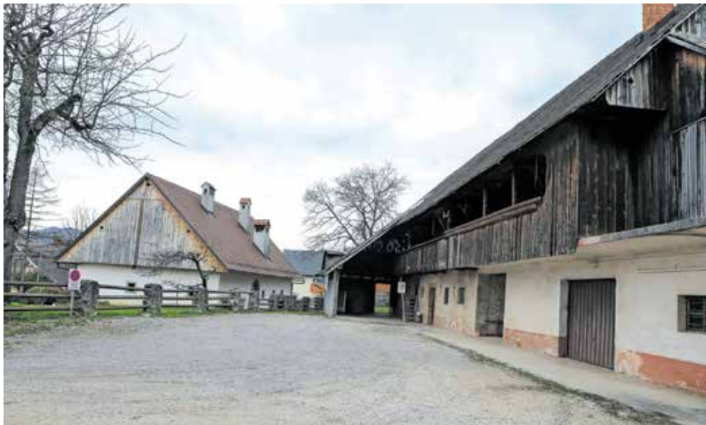
▶ 5. stran Začetek obnove Prešernove domačije v Vrbi je predviden junija letos.

Vrba – Na Prešernovi domačiji, ki je pred leti v celoti prešla v državne roke, bodo predvidoma junija letos stekla prva obnovitvena dela. Kot so pojasnili na ministrstvu za kulturo, bo marca objavljen razpis za izbor izvajalca za obnovo gospodarskega poslopja ob Prešernovi hiši, kjer bo v sklopu projekta prenove urejen interpretacijski center z vsemi podpornimi in dopolnilnimi programi za muzejsko in kulturno dejavnost. Del teh se v Prešernovi rojstni hiši že izvaja.