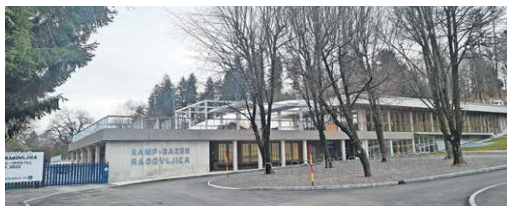
Med športnimi objekti, ki naj bi jih po novem neposredno upravljala občinska uprava, je tudi radovljiško kopališče.

in odhodkov v občinski proračun. Glede na trenutne ocene prihodkov in stroškov bo višina proračunskih sredstev za upravljanje športnih objektov znašala približno petsto tisoč evrov, kar je nekaj več od trenutno zagotovljenih proračunskih sredstev za leto 2024, so še pojasnili na občinski upravi.