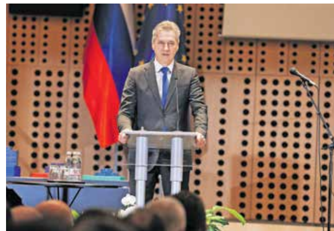
Osrednji govornik državne slovesnosti je bil predsednik vlade dr. Robert Golob.

Osrednji govornik državne slovesnosti je bil predsednik vlade dr. Robert Golob. Spomnil je, da nas je naravna lani kar sedemkrat opozorila, da bodo ekstremni vremenski pojavi nekaj, s čimer se moramo naučiti živeti. Opozorilo velja, kot je dejal