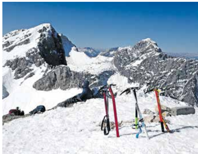
Vrh Male Mojstrovke, zadaj pa Jalovec in Mangart

Nadmorska višina: 2332 m Višinska razlika: 730 m Trajanje: 5–6 ur Zahtevnost: ★★★★★