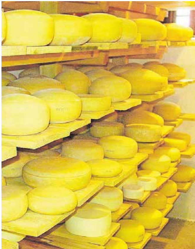
Pomembna dopolnilna dejavnost na gorenjskih kmetijah je predelava mleka v mlečne izdelke.