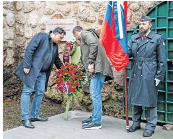
K spominski plošči v Kolarjevem parku so položili venec.

ki so izdelovale orožje, rafinerije in železniške proge, ki so služile Nemcem. Največ bomb je padlo na območje od nekdanje gostilne Peklar do jeseniške cerkve. Močno so poškodovale