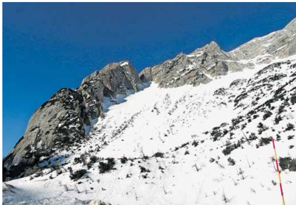
Pogled z Vršiča proti Vratcem. Povzpemo se kar direktno navzgor.

Vrh Mojstrovke nam ponudi čudovit razgled, sploh če imamo srečo z vremenom. Gore v svoji zimski, deviško beli preobleki so še lepše. Na dosegu roke imamo kolos Julijskih Alp – Prisojnik, na njegovi levi strani so Dolkova Špica,