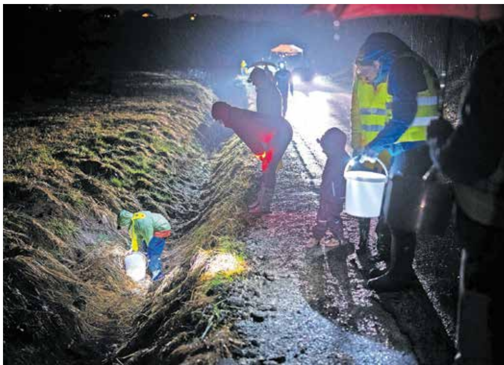
V dveh dneh se je akcije udeležilo približno sto dvajset prostovoljcev.

ki bi opozarjal na njihovo prisotnost. S tem bi morda spodbudili katerega od voznikov, da upočasni vožnjo in je bolj pozoren na cestišče. Pozorni moramo biti tudi na to, da jih ne pohodimo med iskanjem in prenosom čez cesto,« je prepričan Dolhar, ki verjame: »Kolikor žab bomo rešili, toliko manj bomo imeli poleti komarjev.« Povedal je še, da kakšna od žab včasih zaide do hiše, skoči na teraso in se skriva v škorenj.