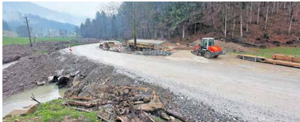
Gradnja novega mostu v Podobenem, kjer promet še vedno poteka po začasnih premostitvah

Mahnič je tudi poudaril, da bi bilo čiščenje vodotokov smiselno prenesti na občino, posledično pa občini zagotoviti tudi finančna sredstva za to.