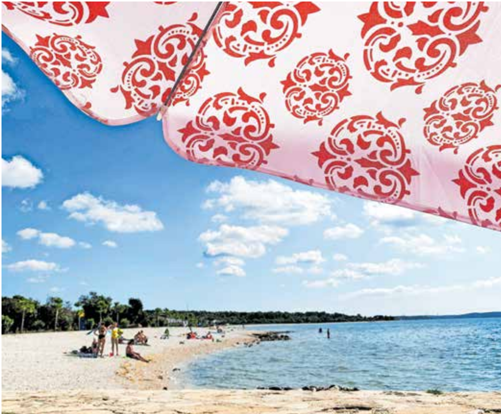
Sobotno leto je namenjeno oddihu od vsakodnevnih službenih obveznosti in po navadi traja od nekaj tednov pa tudi do enega leta. Fotografija je simbolična.

Pred kratkim je diskontni trgovec Hofer naznanil podaljšanje sobotnega leta s šestih na 12 mesecev. Pogoj za to je vsaj pet let aktivne delovne dobe pri tem