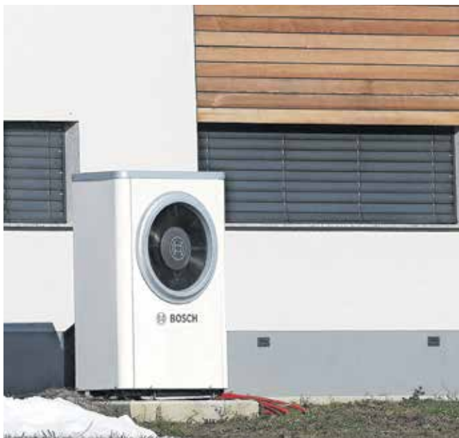
Delež OVE pri ogrevanju in ohlajanju se povečuje predvsem na račun vse večje uporabe biomase in toplotnih črpalk. Fotografija je simbolična.

Na repu lestvice je Irsko, kjer za ogrevanje in ohlajanje izkoriščajo le 6,3