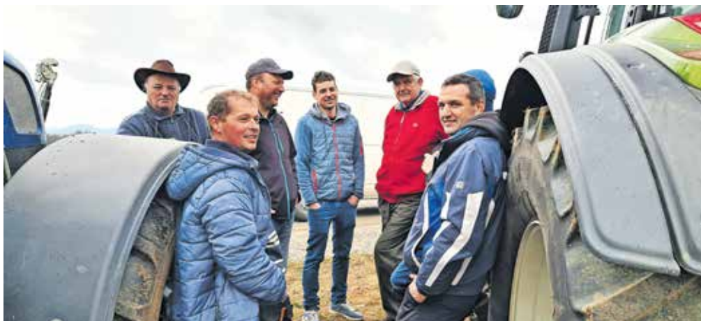
Skupina gorenjskih kmetov na nedavnem protestu v Kranju