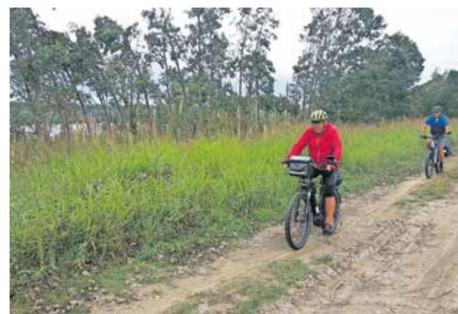
Kolesarjenje ob Donavi mimo odlomljenih dreves

Iz Bačke Palanke smo do naselja Čelarevo kolesarili