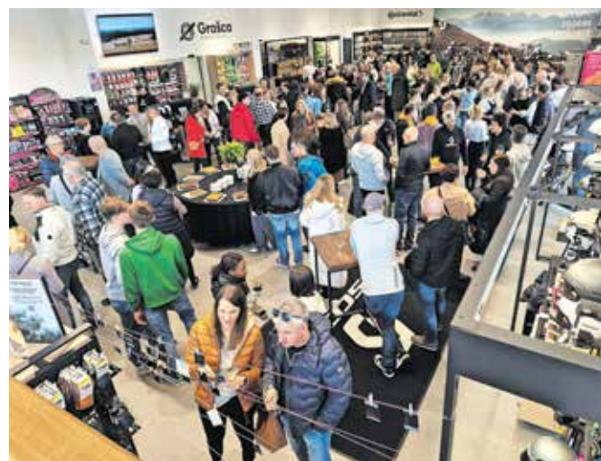
Prodajni prostori Grašce so se v soboto spremenili v prireditveni prostor.

dvesto povablencev. »Neskončno sem hvaležna in vesela, da nam je omogočeno, da smo se preselili v Naklo. Če imaš tako super