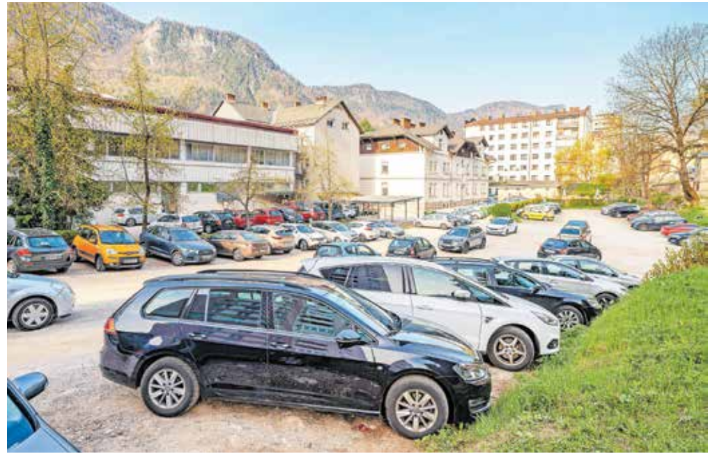
Makadamsko parkirišče, na katerem naj bi gradili garažno hišo

Na Občini Jesenice so pripravili idejno zasnovo, kako naj bi bil objekt videti umeščen v prostor. Za zdaj zbirajo vloge o zainteresiranosti