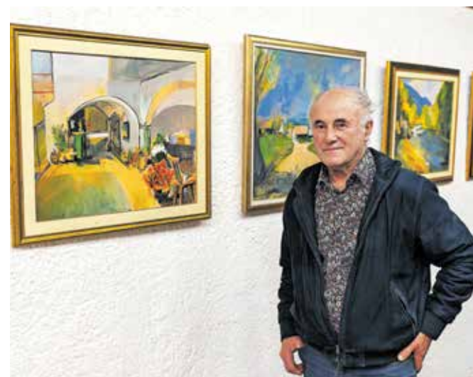
Razstava Iskanja Franca Ranta bo v Galeriji Muzeja Železniki na ogled do 29. marca.

in krajina v vseh časovnih preoblikah nasploh. Najraje ustvarja v akrilnih barvah na platno. Njegovo delo krasita močna temeljna vehementna risba ter edinstvena suverena in zelo kakovostna izraznost poteze. Močan je tako v kompoziciji kot v posameznih detajlih. Njegova dela so zelo zanimiva po kombinaciji lazurnih in pokrivnih barv z vsemi gradacijami, s katerimi na svoj način pričara prostorski vtis. Vsa ta izrazna moč se skriva v avtorjevem izjemnem talentu, nenehnem iskanju in neumornem delu. Rant je odličan mojster združevanja poteze, nanosa barv in kolorita, s katerimi na svojih platnih dosega izjemne učinke vzdušja in osebne