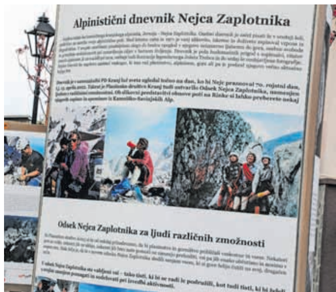
Razstava pred kranjsko knjižnico

Kranj – Planinsko društvo Kranj in Odsek Nejca Zaplotnika sta ob 40. obletnici smrti alpinista Nejca Zaplotnika 24. aprila organizirala spominski pohod od Rupe do Bežkove vile v Kranju. Pohodniki so se zbrali pri cerkvi na Rupci, krenili mimo njegove rojstne hiše po poti, ki jo je kot otrok neštokrat prehodil. V Galeriji na mestu pri Mestni knjižnici Kranj so si ogledali razstavo, ki nas z besedo in sliko popelje skozi dnevnik Nejca Zaplotnika in po planinskih poteh. Pohod so končali pri Bežkovi vili, kjer so k njegovemu doprsemu kipu položili spominski venec.