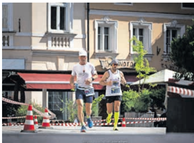
Čez dober mesec dni, prvo junijsko nedeljo, bo v Kranju znova 12-urni ultra tek.

SLO12RUN bo štel za 2. prvenstvo Slovenije v teku na 12 ur. Za tekače iz Bosne in Hercegovine bodo že drugi izvedli bosansko prvenstvo v teku na 6 ur. V soboto, 3. junija, in v nedeljo, 4. junija, bo ob prizorišču tudi sejem športne opreme, sobotni večer pa bo znova rezerviran za tematski pogovor s priznanimi ultramaratonci in drugimi gosti.