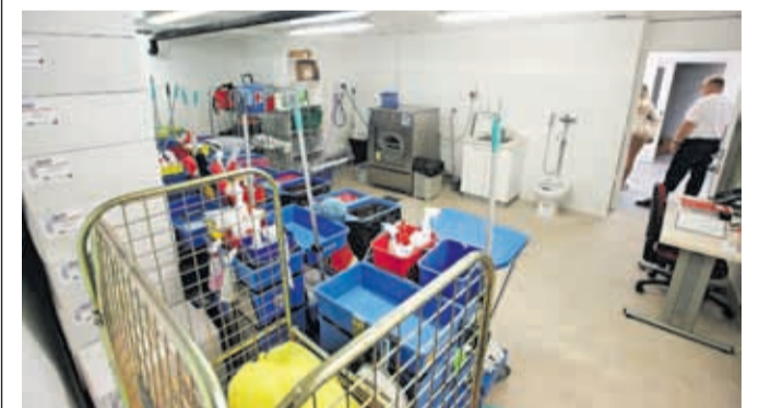
Novo prostore so dobile tudi čistilke.