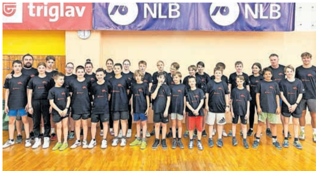
V klubu ne posvečajo pozornosti le tekmovalnem, ampak tudi vzgoji mladih.

»Ob vseh dobrih članskih rezultatih in prebrodenem ob-