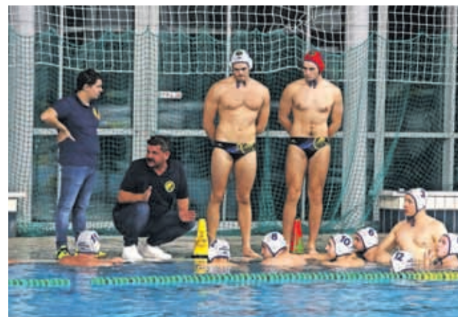
Vaterpolisti Triglava bodo polfinale začeli s prvega mesta.

V polfinalu bodo Kamničani igrali s Triglavom. Prva tekma bo v Kranju. V drugem polfinalnem paru se bosta pomerila Branik in Slovan. Polfinale se bo začel 10. maja, ekipe pa igrajo na dve zmagi.