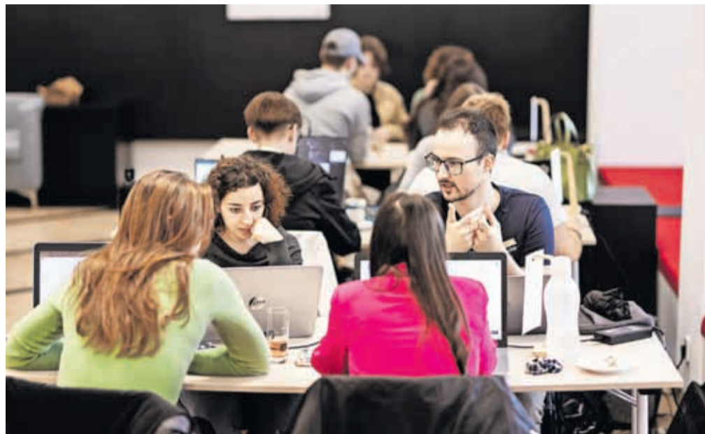
Mladi so imeli za razvijanje svojih idej nekaj več kot 24 ur časa.

»Če bi na primer želel v nedeljo potovati na Bled, bi chatbot iz vseh razpoložljivih virov našel različne mo-