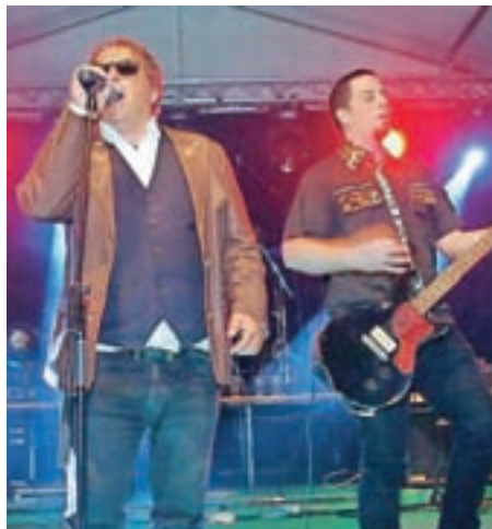
Energijo prvega maja je širil tudi legendarni Pero Lovšin.

Prireditev Zbudi me za 1. maj, ki je potekala v Zalogu pri Cerkljah, je bila letos še pestrejša kot sicer. Na tradicionalni prireditvi s kresovanjem, ki jo prireja tamkajšnje prostovoljno gasilsko društvo, so tako na predpraznično nedeljo nastopili legenda roka Pero Lovšin, priljubljena skupina Tabu in zvezde televizijskih zaslonov Poskočni muzikanti. Ti so odprli eno izmed največjih prvomajskih prireditev na Gorenjskem: svojim znanim skladbam so dodali tudi nekaj trših pop-rok ritmov, ki so jih odigrali suvereno, predvsem pa poskočno. Zasedba Tabu tudi po prihodu nove pevke ostaja v srcih svojih oboževalcev. To velja tudi za Pera Lovšina, ki je s Španskimi borci poskrbel za udaren sklep prvega večera. Naslednje jutro so za praznični pridihi povsod poskrbele pihalne godbe, dogajanje pod velikim šotorom v Zalogu, kjer so organizatorji poskrbeli tudi za kulinarne užitke, pa se je nadaljevalo zve-