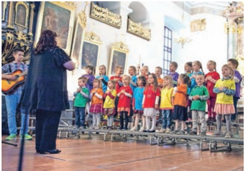
Otroci Marijinega vrta, ki jih je požar najbolj prizadel, so tudi zapeli na dobrodelnem koncertu.

»Do začetka kurilne sezone je pogoreli zgradbi nujno treba vrniti osemsto kva-