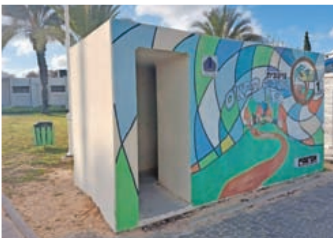
Avtobusna postaja, ki je v osnovi tudi bunker ...

Obisk je skupina nadaljevala v Jeruzalemu, ki je politična prestolnica Izraela, v Tel Avivu ima svoj sedež le ministrstvo