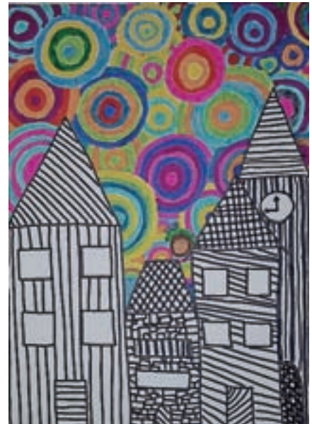
Ula Šenk, 4. a

Medved se je zbudil. Poklical je volka. Šla sta v gozd nabirat zvončke.