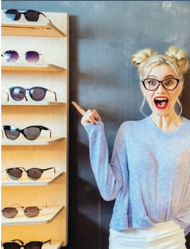
TRIA DA DC DOO., PODBREŠKOVA ULICA 15, NOVO MESTO

NOVO! NOVO! NOVO! NOVO! NOVO! NOVO! NOVO! NOVO! NOVO! NOVO! NOVO!