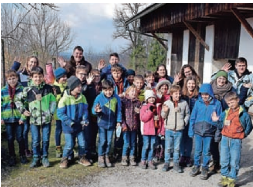
Gasilska fotografija z zimovanja

Skavti pogumno nadaljujemo svojo pot. Tako je med drugim vodnike v mesecu februarju gostila Kruhkerija Gorjanc. Lastnik jim je predstavil delo kuharja, potek priprave kruhkov in jih prijazno popeljal v zakulisje kruhkerije. Voditelji so se na svojem že tradicionalnem celodnevem načrtovanju skavtskega leta potepali na Jezerskem, kjer so sicer zaman iskali sneg, a uspešno načrtali potek druge polovice leta. To gorsko vas so v enem od svojih srečanj obiskali tudi popotniki in popotnice ter si v višje ležečih legah