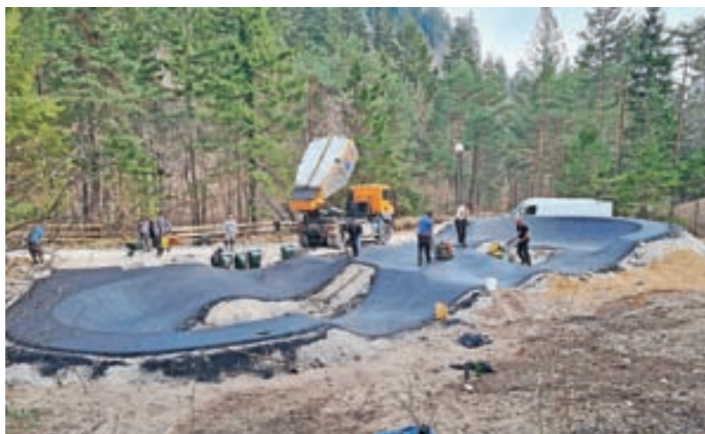
Grbinasti poligon so ravno v teh dneh asfaltirali.