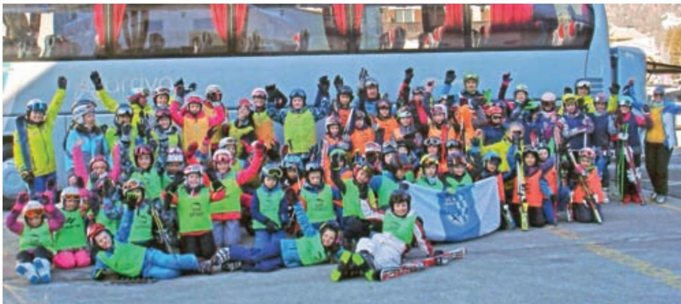
Letos se je smučarskega tečaja udeležilo rekordno število tečajnikov.

Po lanskoletnem izpadu tečaja, ko se leta 2021 zaradi epidemije skoraj ne spomnimo več, smo se zopet optimistično lotili tokrat že 13. tradicionalnega smučarskega tečaja za osnovnošolce v Kranjski Gori.