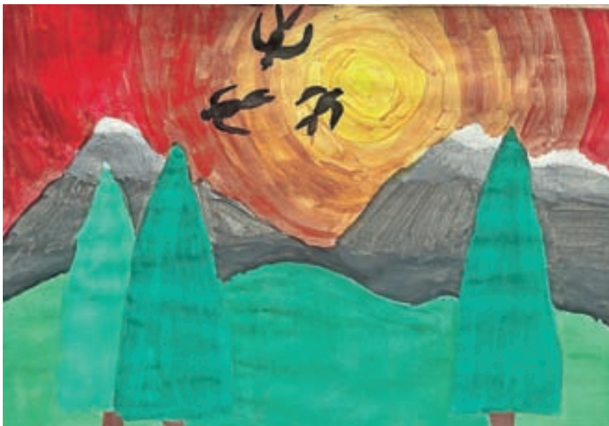
Pomladni večer, Brina Šubic, 7. b

Ko se znoči, mami zakriči: Pod tuš, puncí! Zapreva oči. Spiva do polnoči. Naprej pa me zbudi, ker očka smrči. Leja Mehić, 2. a