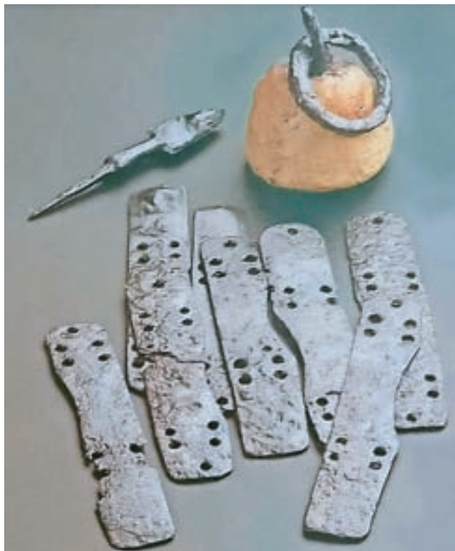
Poznoantične najdbe z Gradišča nad Bašljem (hrani NMS)

Obzidje, zidano iz lomljenega kamenja, je bilo široko od 60 do 70 centimetrov in ponekod ohranjeno do poldruga metra visoko. Prvotno je segalo verjetno še višje ter je obdajalo utrdbo s severa, zahoda in juga. Štirikotna stavba na zunanji južni strani obzidja je bila znotraj tlakovana in ometana, in kasneje, domnevno v slovanski fazi gradnje, dograjena z lesenimi bruni. V notranjosti so bili med drobirjem najdeni odlomki lončenine in stekla, drobni kovinski predmeti, kamniti brusi ter kosi žlindre in drugih surovin. Iz časa pozne antike ali zgodnjega srednjega veka izvirajo še fragmenti žrmelj iz sivega kremenovega konglomerata. Življenje romanskih staroselcev pa se ni odvijalo samo znotraj utrdbe. Na edinem ravnem platoju severno