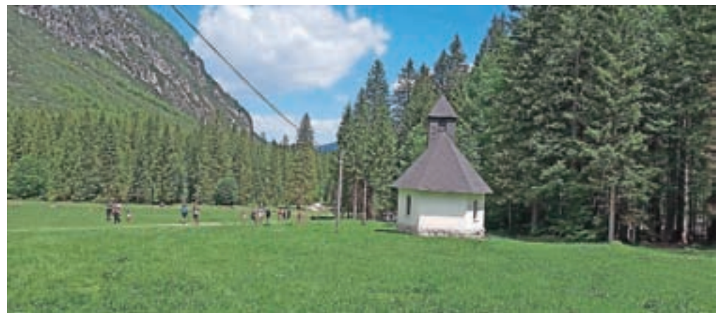
Lavtižarjevo delo, povezano s planinstvom, je postavitev Marijine kapele v Tamarju.

doba Slovencev (1935/36), Lipniški grad pri Radovljici (1939), v žanr biografije pa Primož Trubar (1935), Šentjoški gospod Šimen in njegovi sodobniki (1938), Naši zaslužni možje (1942) ... Izšlo je nekaj njegovih potopisov, med njimi potopisne