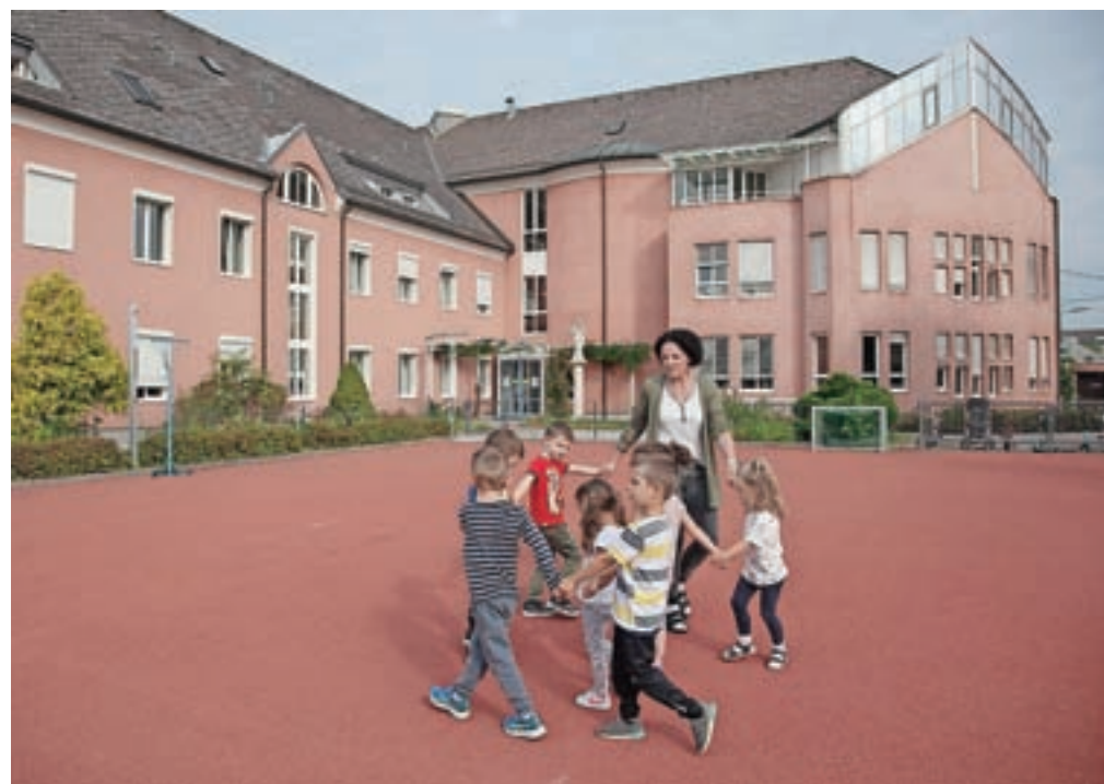
Dvojezična skupina iz vrtca v Slomškovem domu na Ainethgasse 10 v Celovcu, kjer je Mohorjeva odprla tudi prve dvojezične jasli v Celovcu.