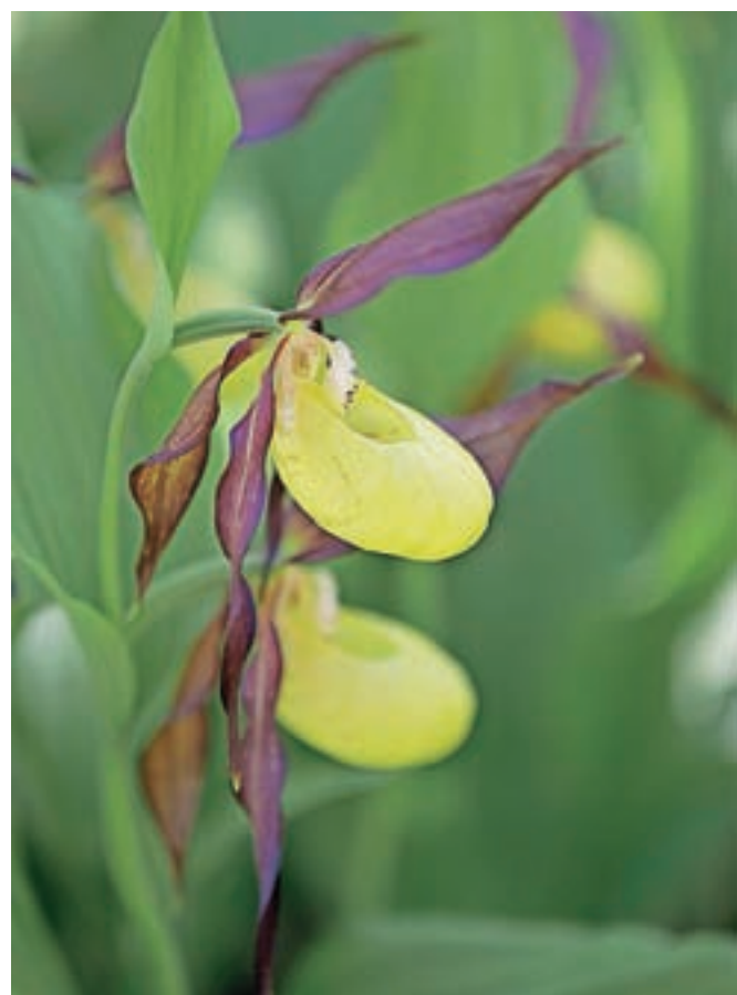
Lepi čveljc: Ko pomislimo na orhideje, si predstavljamo tropske cvetlice. A predstavnik te družine raste tudi pri nas. Zacveti konec maja in v juniju, med drugim tudi ob poti, ki pelje od planinskega doma na Zelenici na Begunjsčico.

Najlepši koticiki so zame na Zelenici pod Vrtačo. Na tem območju sem delala diplomsko nalogo o rastlinstvu in začela svojo strokovno botanično pot. V maju uživam v rovtih nad Jesenicami, kjer cvetijo ključavnice. V juniju na Belski planini (Struški) zacvetijo rumene Zoisove vijolice. Takrat obiščem tudi našo največjo orhidejo lepi čveljc pod Ljubeljem. Najlepše rožice pa rastejo pravzaprav povsod, saj je prav vsaka lepa in edinstvena.