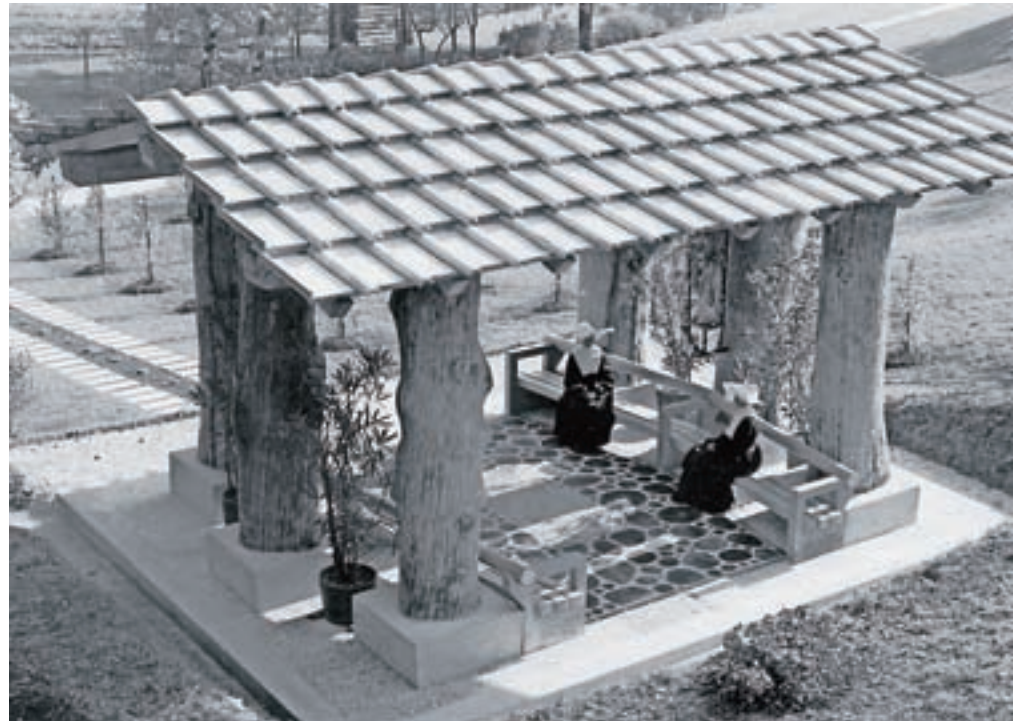
Brezjanko je mojster postavil na mesto, kjer so imele sestre prej manjšo klop. Ob poti do senčnice je Plečnik dal zasaditi drevje in postavil klopi tako, da se je z njih odpiral pogled na gore.

Lastništvo že desetletja propadajočih objektov v Begunjah, ki sta si ga vse od konca druge svetovne vojne