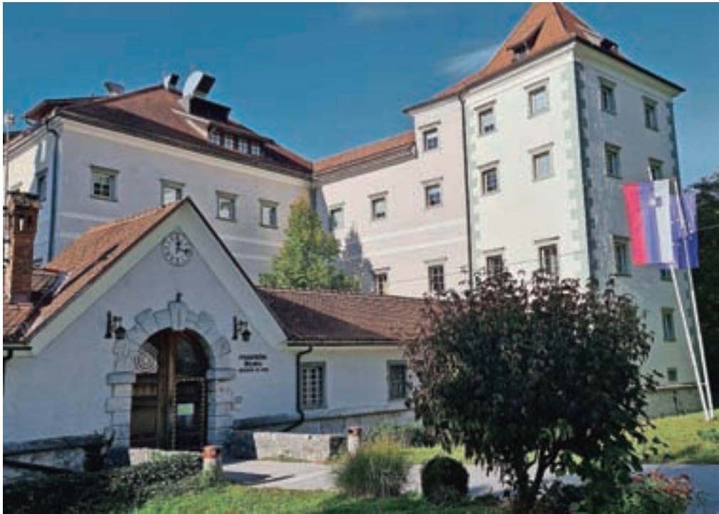
Kapelici so v tridesetih letih prejšnjega stoletja postavili na vrtu graščine Katzenstein, ki je bila v tistem času ženska kaznilnica, med drugo svetovno vojno nacistični zapori, danes pa so v njej prostori psihiatrične bolnišnice.

jo je mojster zasnoval na mestu, kjer so imele sestre manjšo klop, se je najprej rekle Murka. Kasneje pa je zasnovana kot objekt iz šestih mogočnih hrastovih ste-