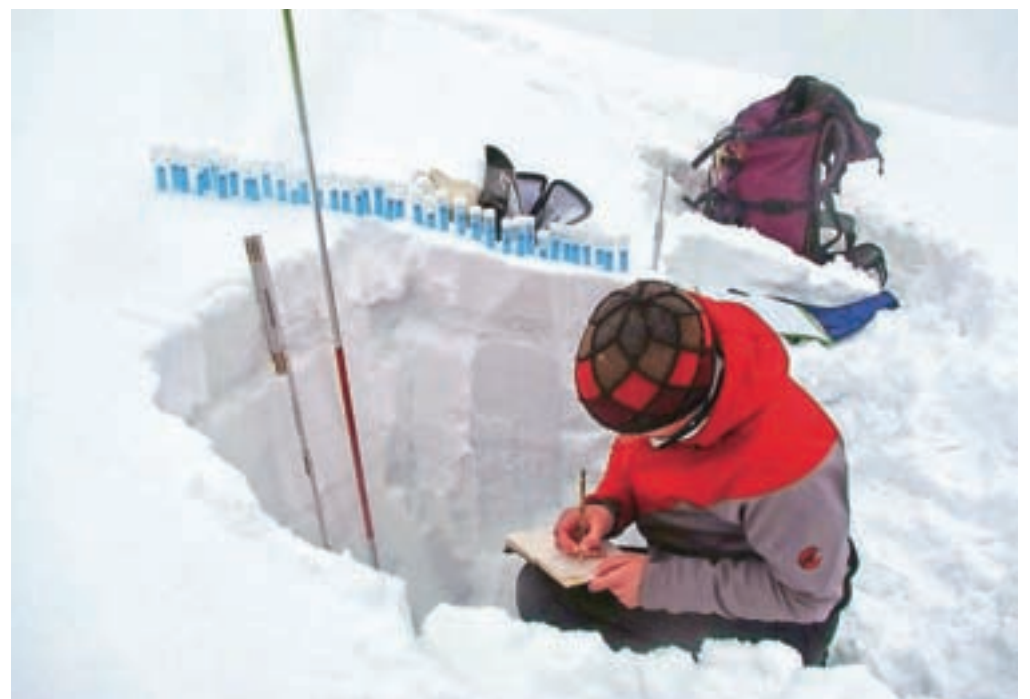
S svojim znanjem sodeluje tudi pri dopolnjevanju lavinskega katastra in modeliranju.