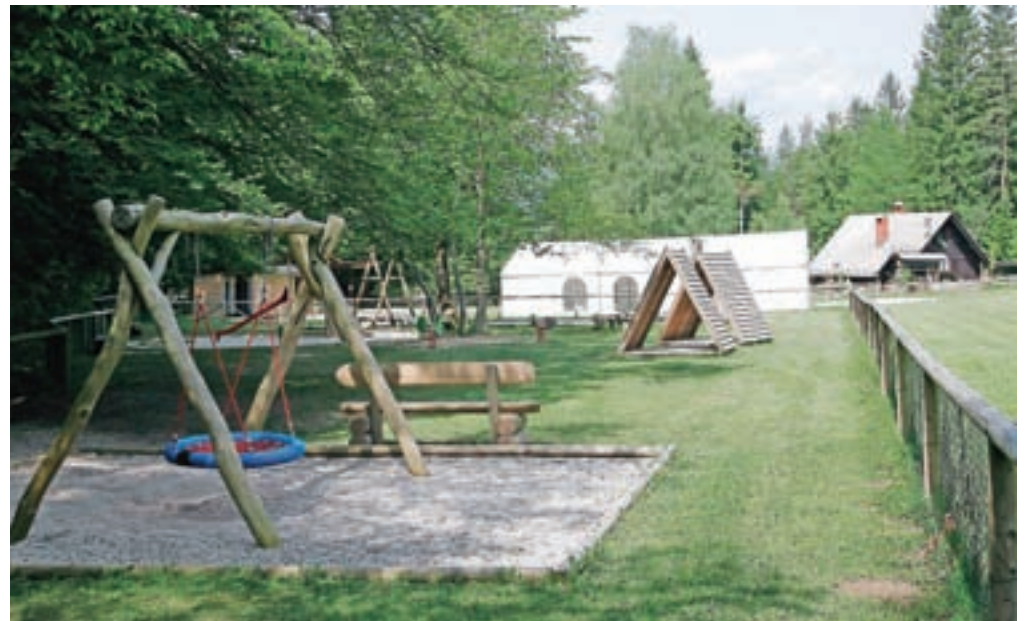
Obiskovalcem so na voljo otroško igrišče, prireditveni prostor, prostori za piknik, igrišče za mali nogomet, igrišče za odbojko na mivki (ki se pozimi spremeni v drsališče) ...

Pobočja nad Završnico skrivajo ostanke antičnih naselbin in vojnih skrivališč. Zelo zanimiva je Turška