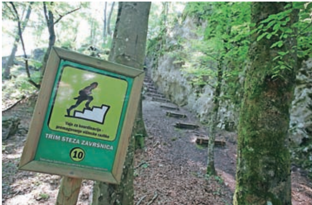
Urejena je tudi krožna trim steza z desetimi postajami.

Iz doline Završnice se je mogoče povzpeti tudi na Ajdno, ki je eno