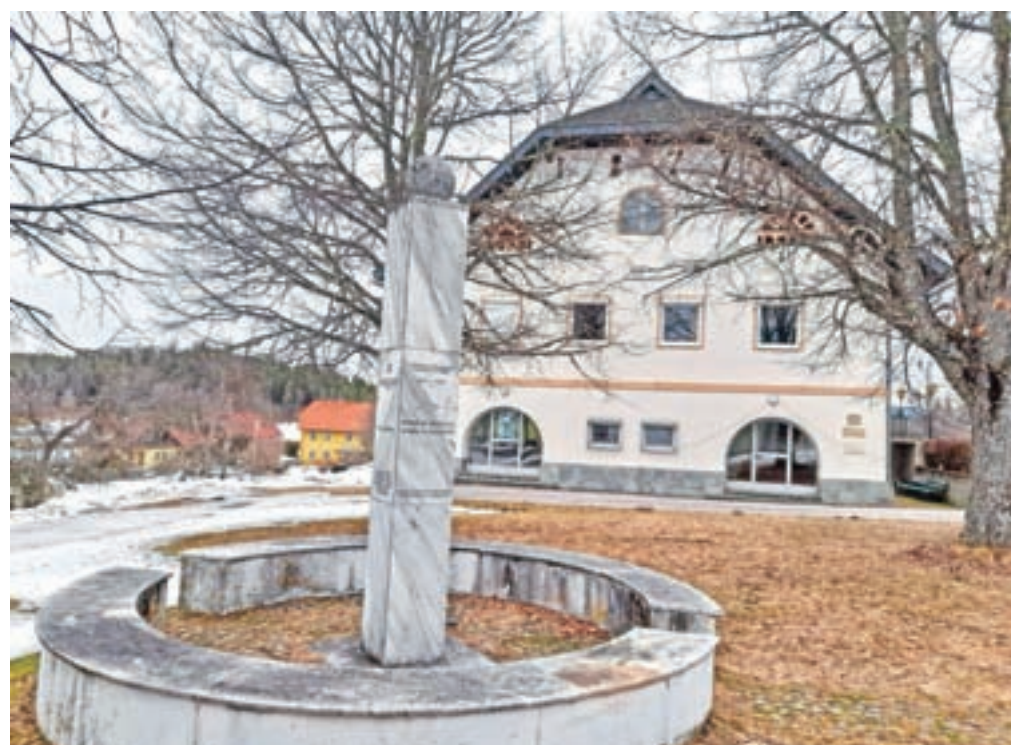
Kulturni dom, pred njim pa prvi spomenik slovenskim izgnancem na Koroškem. Drugega so kasneje postavili v Žrelcu.

diva za karte starih hišnih in ledinskih imen, saj je vedno večja nevarnost, da bo nesnovno kulturno bogastvo za vselej utonilo v pozabi. Za