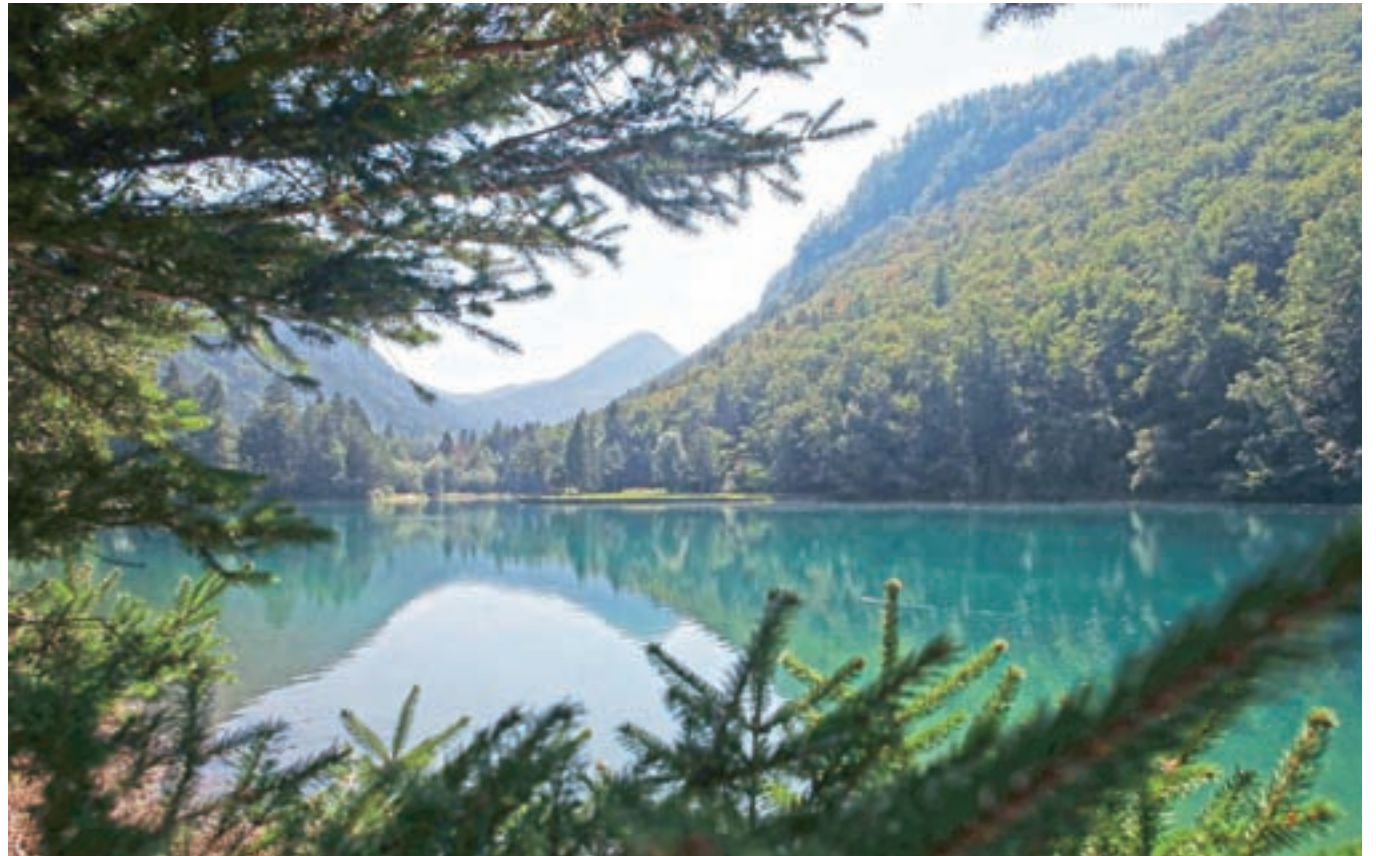
Akumulacijsko jezero je ena od osrednjih točk doline Završnica.

najznamenitejših poznoantičnih arheoloških najdišč na Slovenskem. Zgodba o vasici in najdeni predmeti še danes burijo domišljijo.