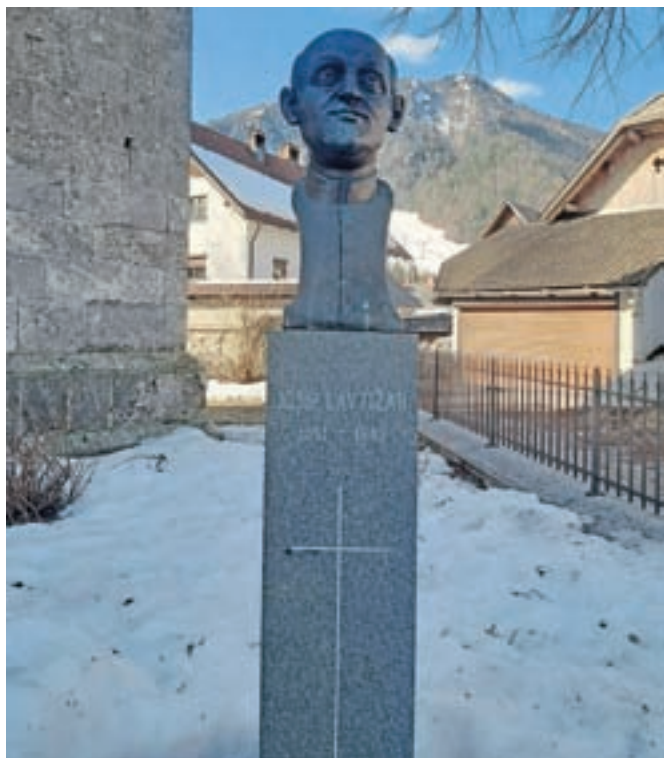
Spomenik pred župnijsko cerkvijo Device Marije Vnebovzete v Kranjski Gori

V Ljubljani je Lavtižar končal najprej ljudsko šolo, kot gojenec Alojzijevega gimnazija. Po maturi je vstopil v ljubljansko bogoslovje in bil leta 1875 posvečen v duhovnika.